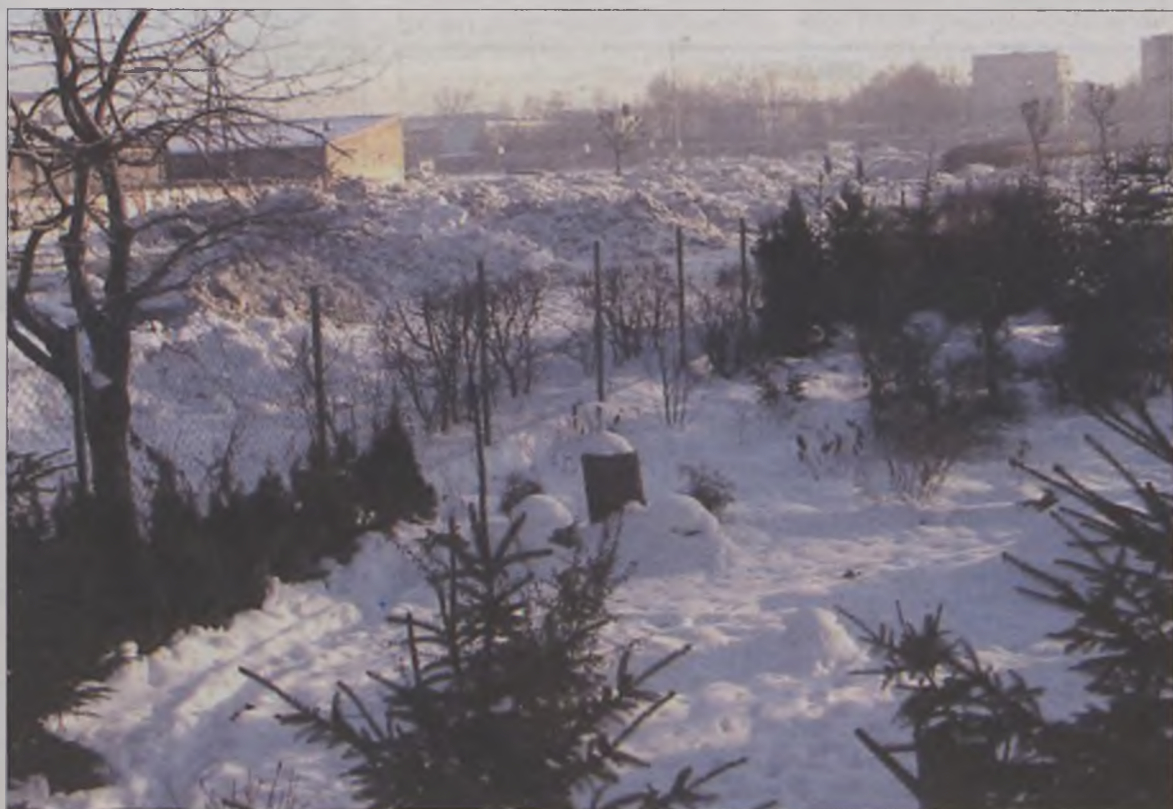
Na teren OSiR-u przy Kolskiej Szosie trafiło kilkadziesiąt ciężarówek ze śniegiem, co według władz okazało się najbardziej ekonomicznym rozwiązaniem