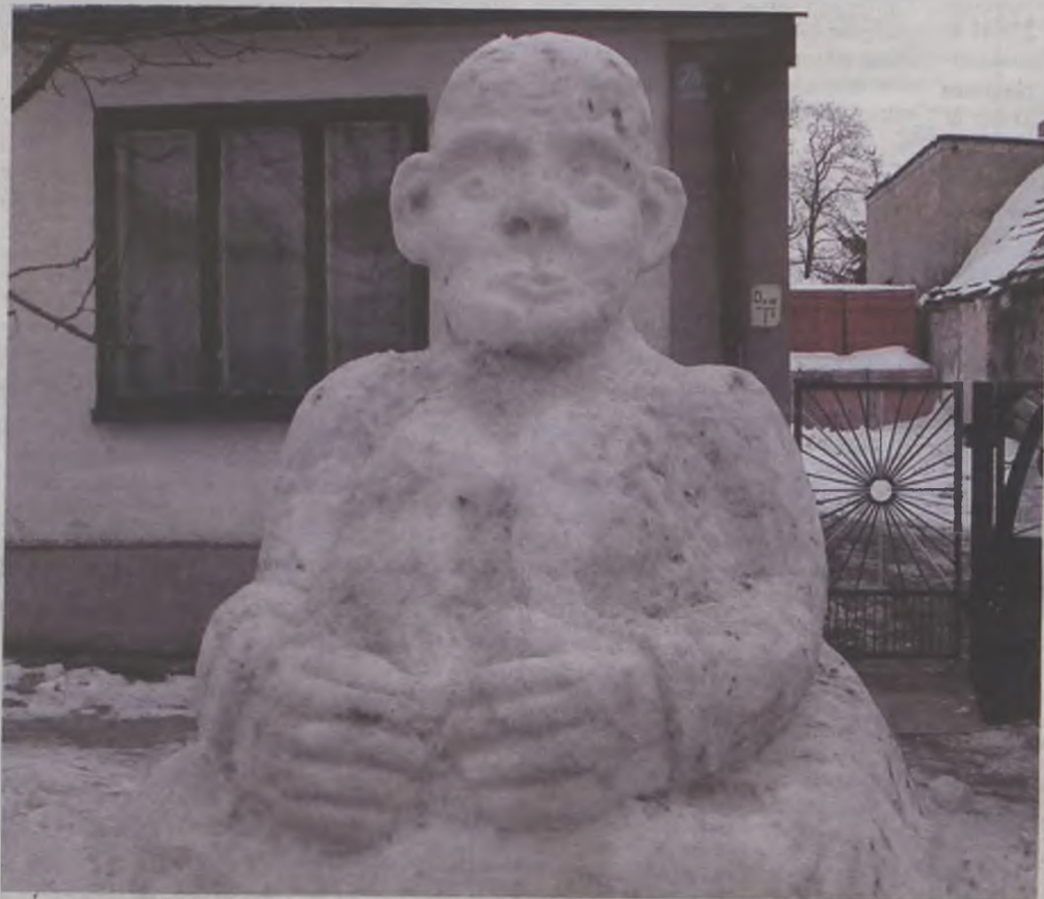
Śnieżowa rzeźba stoi przed posesją jej właściciela i niewątpliwie jest zimową ozdobą Brudzewa

nie, maluje obrazy, zajmuje się kowalstwem artystycznym, naprawia sprzęt elektroniczny, uczy się języków obcych ze słowników oraz nut. Dla nas zagrał na organach - na razie ze słuchu. MJ