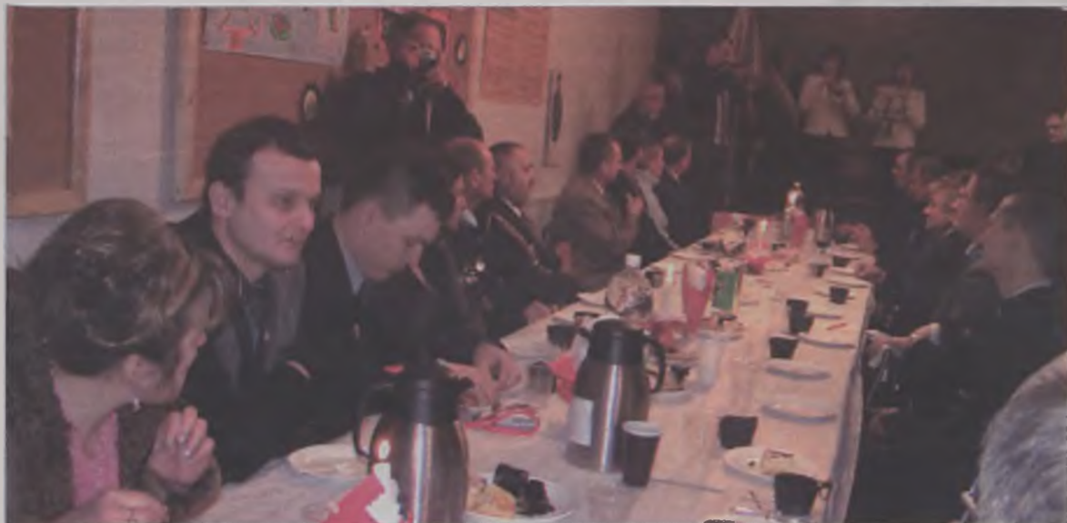
Spotkanie oplątkowe odbyło się w sali Klubu Młodzieżowego "Przystań"

Na spotkanie oplątkowe tradycyjnie już przyjechały zaprzyjaźnione zarządy klubów z Pruszkowa, Rudy Śląskiej, Swarzędza, Konina, Kleczewa i Koła. MJ