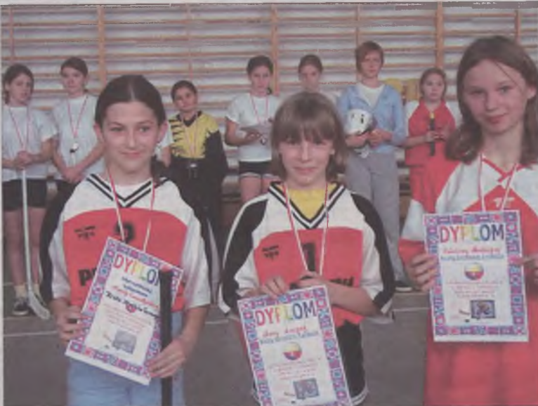
Królowe strzelców turnieju

Dobroszów-UKS „Zryw” Przykonia II 1:2 „Zryw” Przykonia I-SP Koziegłowy 0:1