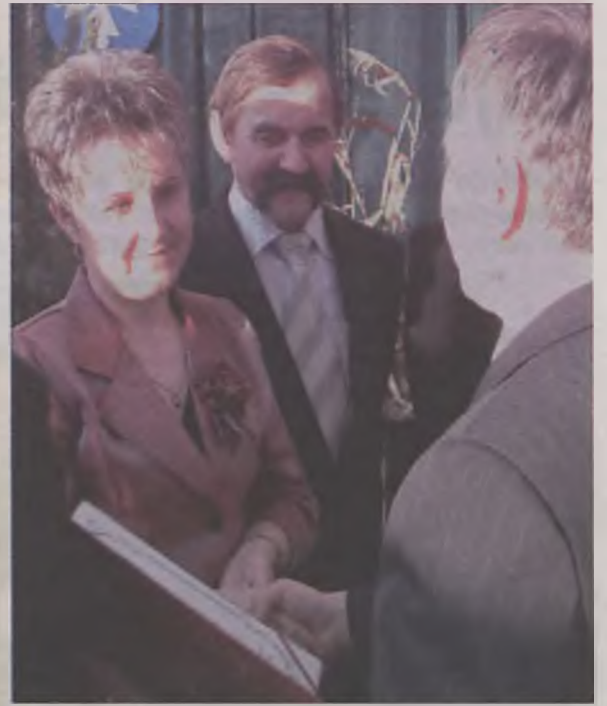
Jubilanci otrzymali listy gratulacyjne i medale