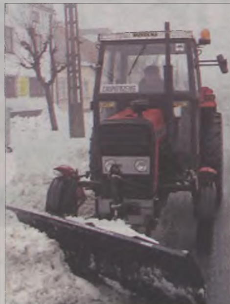
Tuż po zakupie nowy spychacz zmierzył się z zaspami śniegu.

Zima wszystkim dała się we znaki. Nic więc dziwnego, że wraz z ostatnimi opadami śniegu, władze gminy Władysławów zdecydowały o zakupie spychacza czołowego T-21812 do ciągnika rolniczego Ursus 3512. Sprzęt kosztował 3.892 złote.