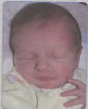
...Gąsiorek córka Renaty i Krzysztofa ur.29 grudnia, godz.14.00 waga 2400, długość 51cm