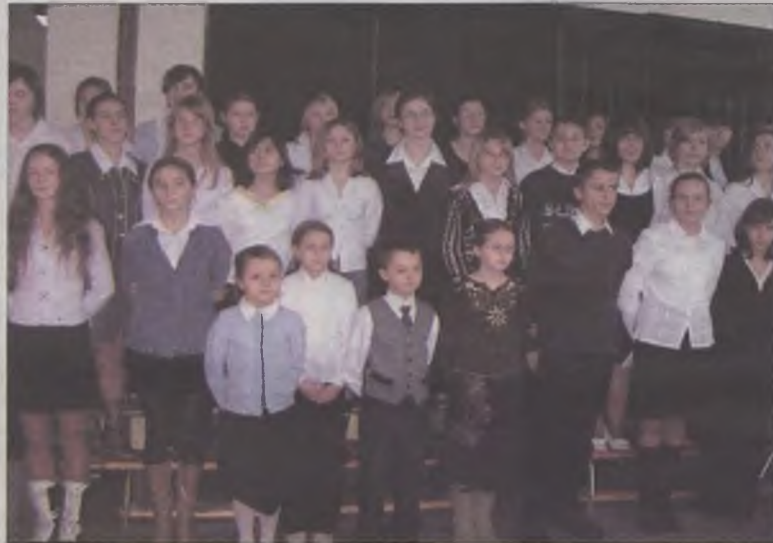
Kolędy śpiewał chór szkolny.