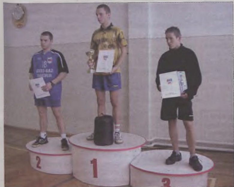
Zwycięzcy kategorii szkół ponadgimnazjalnych.