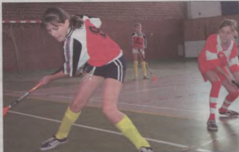
Na boisku dziewczęta dawały z siebie wszystko