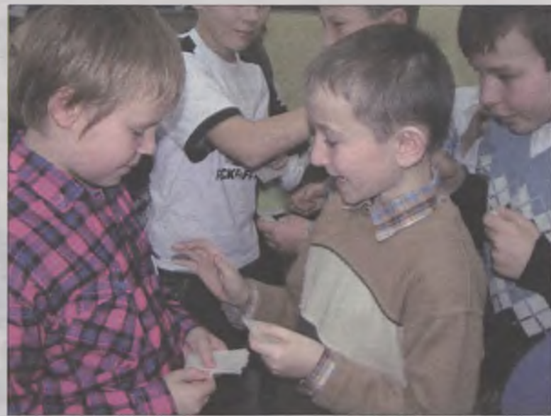
Ponad 800 osób podzieliło się oplątkiem, życząc sobie wszystkiego, co najlepsze.

Po podzieleniu się oplątkiem na stoły wniesiono potrawy wigilijne. Nie zabrakło żadnej i każdy najadł