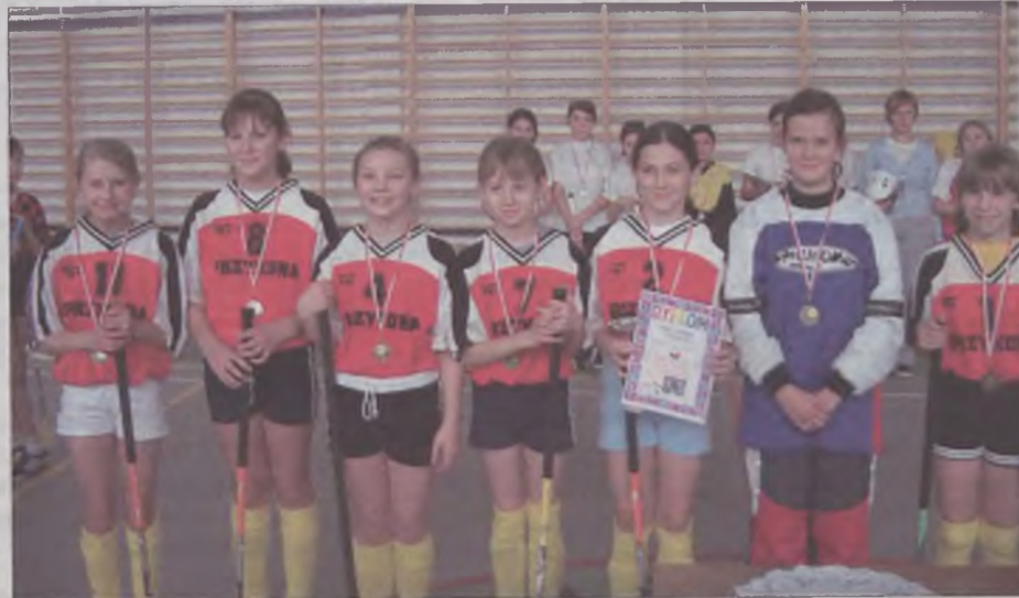
Zwycięska drużyna Zryw I

„Zryw” Przykonia I - „Zryw” Przykonia II 0:0 Koziegłowy-SP Lipice 1:0