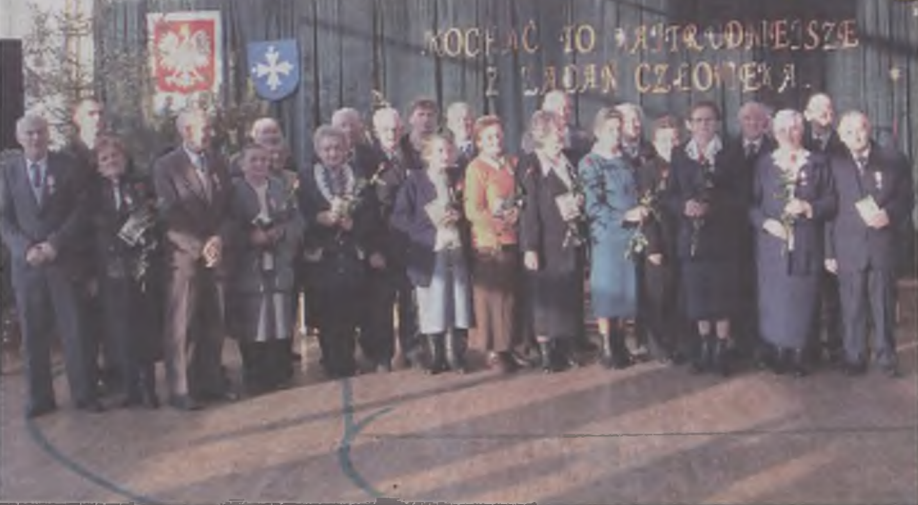
Złoci jubilanci stanęli do wspólnej pamiątkowej fotografii