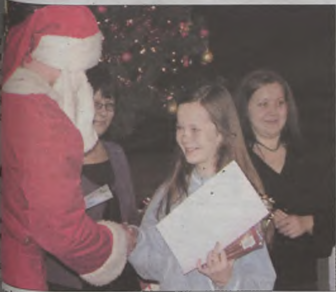
Upominki wręczał sam Święty Mikołaj.

komisja plastyczna, jak i literacka, miały nie lada problem, aby wybrać te najlepsze, dlatego wśród nagrodzonych i wyróżnionych znalazło się dużo pięknych rysunków i listów. Wszyscy nagrodzeni i wyróżnieni