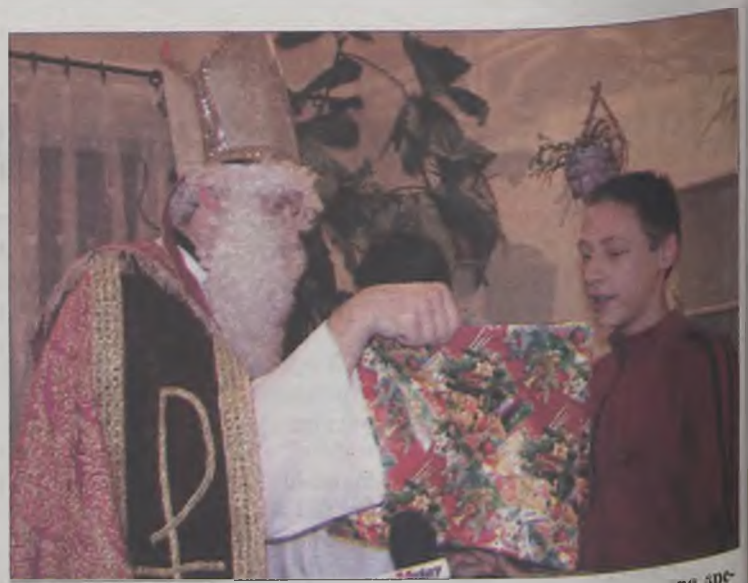
Każdy otrzymał paczkę, podpisaną imiennie i przygotowaną specjalnie dla konkretnego dziecka.

mal, początkowo planowano zawieźć do domu dziecka świąteczne potrawy, które będą przygotowywane dla pielgrzymów spędzających święta Bożego Narodzenia w Sanktuarium w Licheniu.