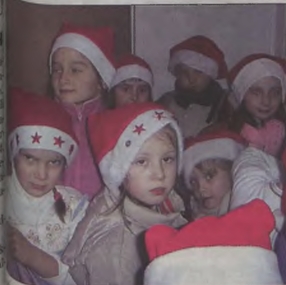
Przedszkolaki na ulice miasteczka wyruszyli w czerwonych czapczkach.