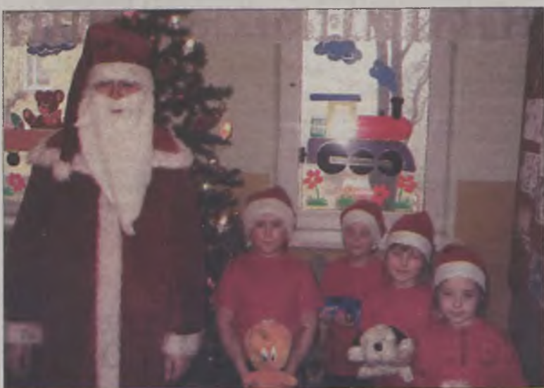
Święty Mikołaj wraz ze swoimi małymi pomocnikami.

eczki. Hojność przedszkolaków przekroczyła wszelkie oczekiwania, bowiem do zapakowania darów potrzeba było kilka worków. Dnia 6 grudnia starym zwyczajem do przedszkola zawitał św. Mikołaj, aby zabrać podarki i podziękować swoim małym pomocnikom. Zabawki przekazano kierownikowi kuratorów rodzinnych przy Sądzie Rejonowym w Turku. Stamtąd trafiają do dzieci z rodzin, które mają pod swoją opieką. MJ