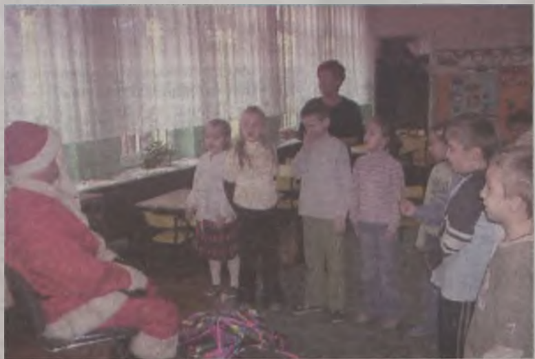
Dla Mikołaja występują dzieci z grupy czwartel.