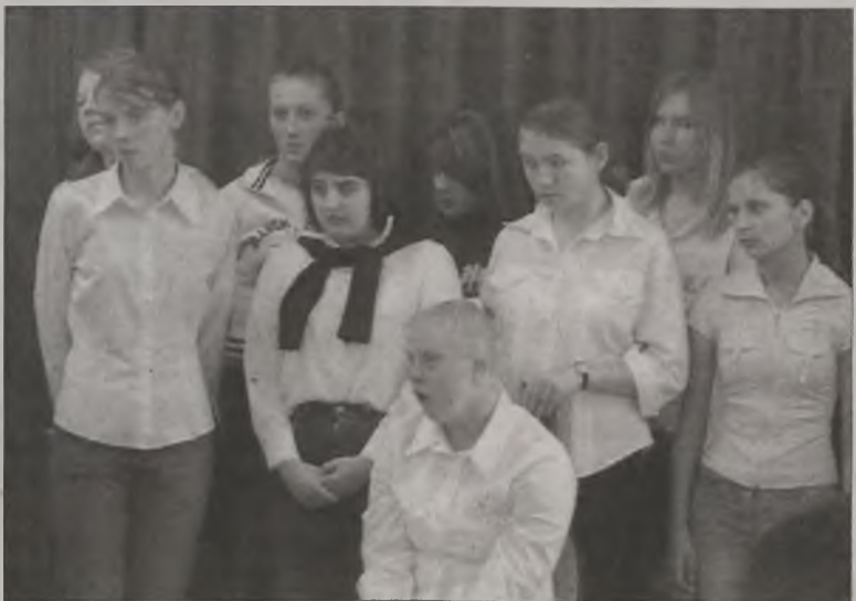
Program artystyczny przygotowały klasy integracyjne z Gimnazjum nr 2 w Turku.