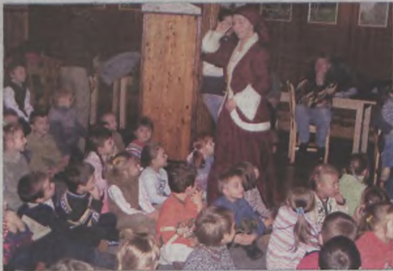
Dzieci pomagały żonie rybaka w wymyślaniu coraz to nowych życzeń do złotej rybki.

był Gminny Ośrodek Kultury we Władysławowie. az