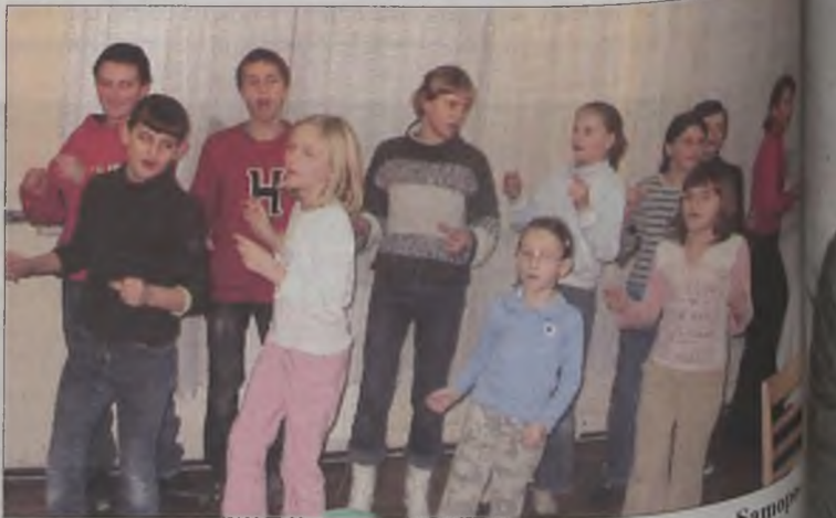
Dzieci z punktu prowadzonego przez Środowiskowy Dom Samopomocy przygotowały muzyczną niespodziankę.