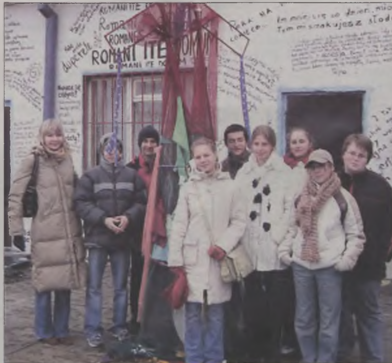
Aktorzy „Debiutu” z Przykony zostali podwójnie wyróżnieni.