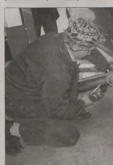
Kiedy tylko pojawiają się pierwsze oznaki zimy, a temperatura spada poniżej 7 st. Celsjusza zakłady oponiarskie pękają w szwach.

O konieczności wymiany opon z letnich na zimowe mówią również policjanci, których zdaniem powinno to być obowiązkiem każdego kierowcy.