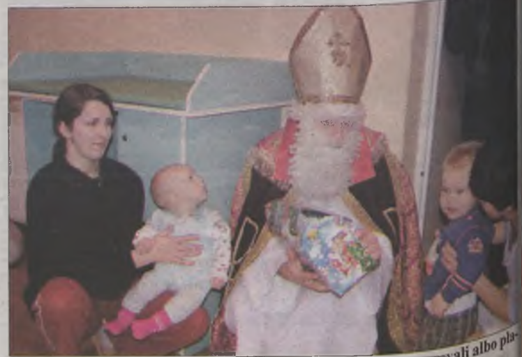
Najmłodsi wychowankowie na biskupa Mikołaja reagowali albo płaczem, albo przyglądali mu się z wielką ciekawością.