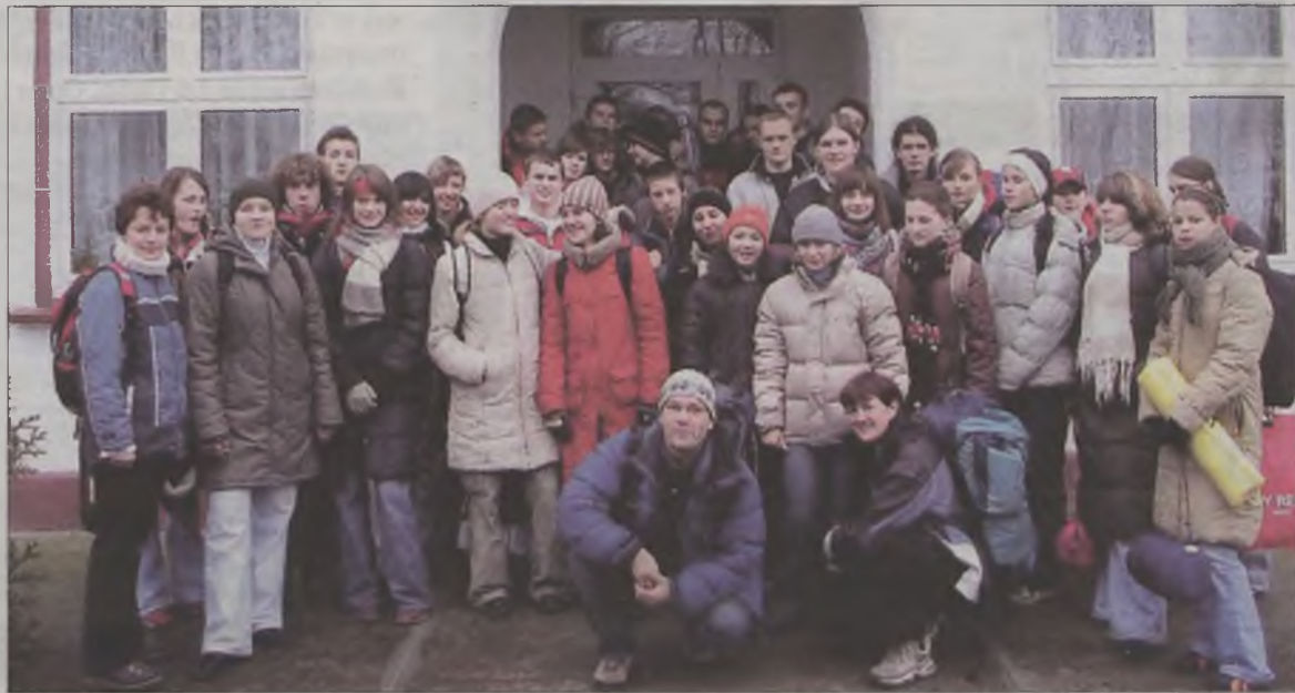
Uczestnicy rajdu do Sarbic.

Rajd odbył się dzięki pomocy Starostwa Powiatowego w Turku. az