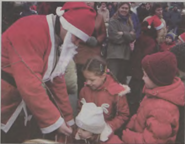
Każdy z czterech spacerujących po rynku Mikołajów rozdawał słodycze.

Dotychczas 6 grudnia w Brudzewie kojarzył się wszystkim z odpustem w miejscowej parafii, noszącej imię właśnie świętego Mikołaja. Od tego roku może się to zmienić i zacząć kojarzyć z wesołą zabawą na rynku, którą z takim rozmachem zorganizowano po raz pierwszy, ale jak stwierdzili organizatorzy, nie ostatni.