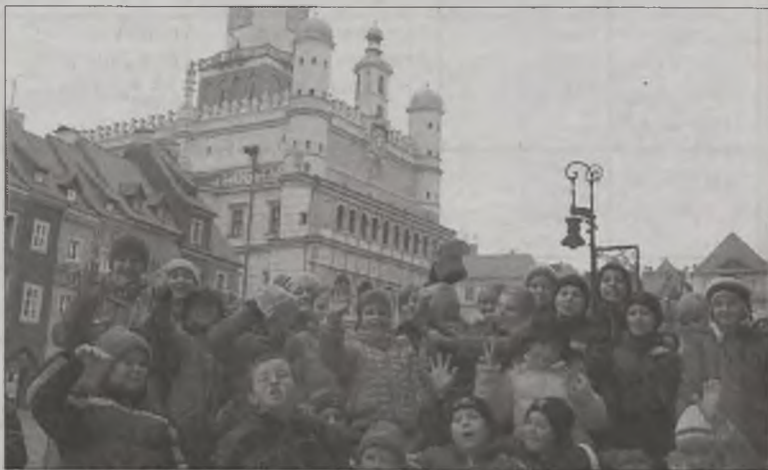
Jednym z punktów wycieczki była wizyta na Starym Rynku.