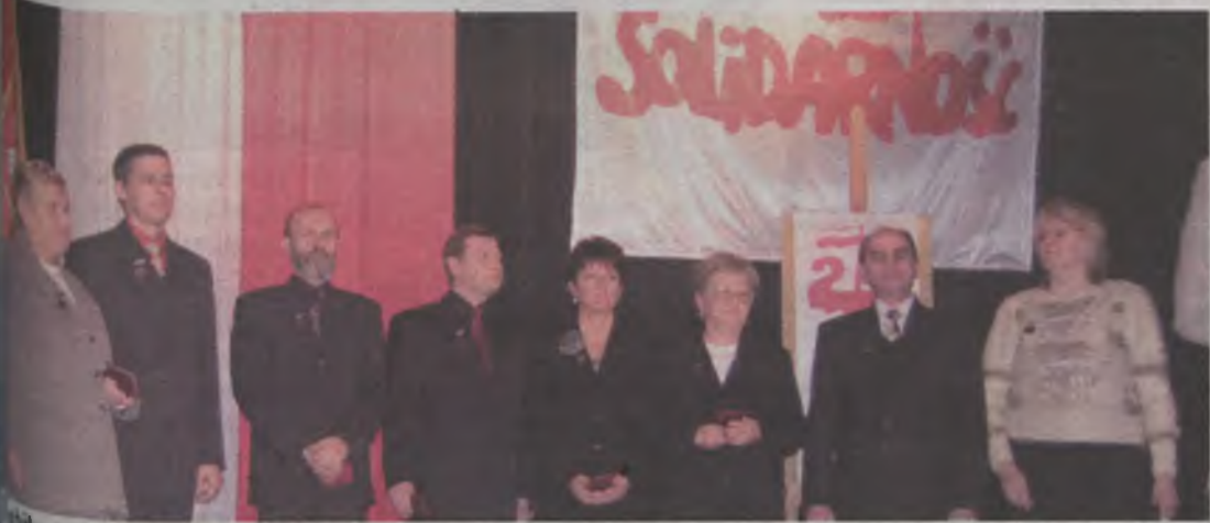
Obchody „Solidarność” były okazją do uhonorowania członków związków. Na zdjęciu wyróżnieni medalem „za zasługi dla miasta Turku”.

Współpraca Boże Solidarność, 9 grudnia podsumowano tegoroczne jubileuszowe obchody ćwierćwiecza „Solidarność” na ziemi turkowskiej. Była msza święta oraz wieczornica, podczas której uhonorowano zasłużonych działaczy tego związku zawodowego i ruchu społecznego.