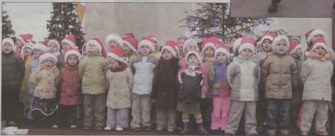
Maluchy z brudzewskiego przedszkola rozgrzewały publiczność swoim śpiewem i wierszami.

tak huczny sposób obchodzi się Mikołajki, a dodatku świetnie się przy tym bawiąc. Organizatorami imprezy nazwanej po prostu Dniem Świętego Mikołaja, byli: Urząd Gminy, Gminny Ośrodek Kultury i Gminna Komisja Rozwiązywania Problemów Alkoholowych w Brudzewie. Zabawa trwała od południa do wieczora. W południe, kiedy pierwsze dzieciaki dotarły na rynek, w miejscowym kościele rozpoczęła się msza święta, a po niej procesja. Po blisko dwugodzinnym nabożeństwie, orkiestra dęta z dwoma Mikołajami na czele przemaszerowała na rynek.