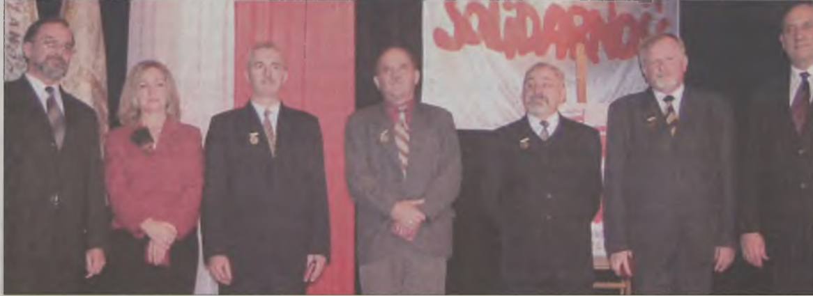
Zasłużeni dla powiatu tureckiego.