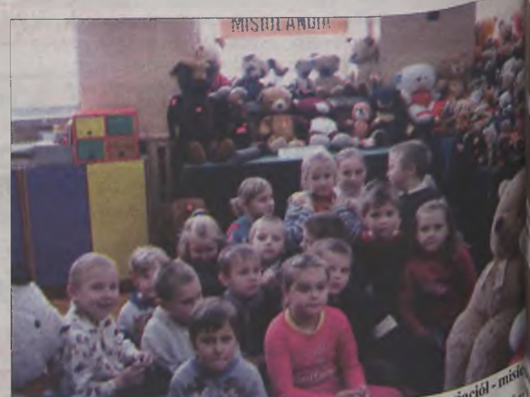
Dzieci z Tokar zaprosiły do szkoły swoich pluszowych przyjaciół - misia

ła zgłoszonym do konkursu misiom tytuły w kategoriach: najstarszy, największy, najmniejszy, najbardziej kolorowy i najbardziej puszysty. Zwycięzcy konkursów, czyli właściciele utytułowanych pluszaków, otrzymali pamiątkowe dyplomy.