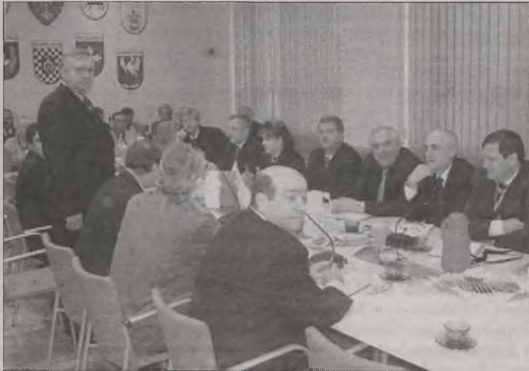
Ukraina obiera kierunek na samorządy. Stąd też zainteresowanie naszych gości doświadczeniami samorządowymi w powiecie tureckim.

W ubiegłorocznej „pomarańczowej rewolucji” Ukraina stoi wobec poważnych wyzwań reformatorskich i modernizacyjnych. Nic zatem dziwnego, że w całym kraju zainteresowaniem strony ukraińskiej cieszą się polskie doświadczenia z samorządem lokalnym. Stąd tematyka samorządowa są na Ukrainie przedmiotem uważnych studiów i dyskusji. A, że pod względem wielkości i walorów budżetowych, powiat turecki uważany jest za nader reprezentatywny, by nie powiedzieć modelowy przykład, mamy okazję doświadczyć gościa przedstawicieli władz lokalnych z Ukrainy. W dniach 6-10 grudnia przebywała u nas grupa szefów administracji rejonowej okręgu czerkaskiego. Dodajmy, że rejon pod względem wielkości terytorialnej i demograficznej stanowi odpowiednik naszego powiatu. Nic zatem dziwnego, że goście (7 grudnia) ukraińscy goście poświęcili na zapoznanie się z metodami funkcjonowania samorządu