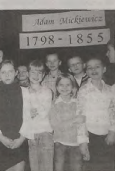
Uroczystość z okazji 150. rocznicy śmierci polskiego wieszca narodowego Adama Mickiewicza.

Uroczystość z okazji 150. rocznicy śmierci Adama Mickiewicza.