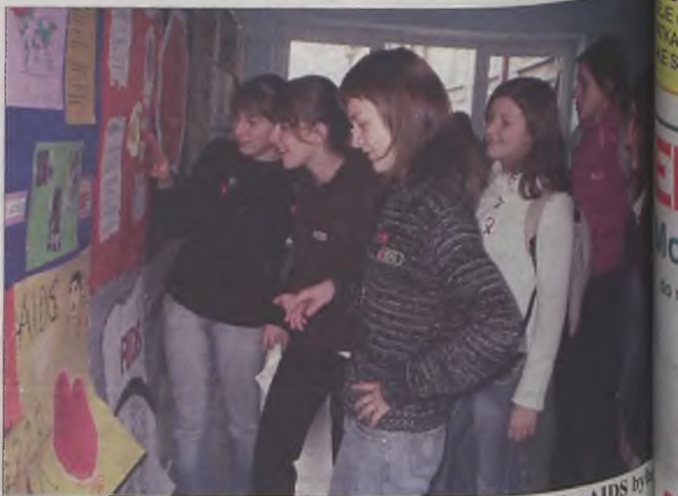
Jednym z punktów obchodów Światowego Dnia Walki z AIDS była szkolna wystawa plakatów wykonanych przez gimnazjalistów.