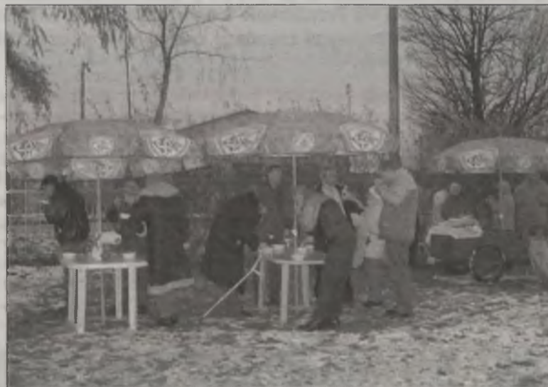
Co wtorek rozdawany jest ciepły posiłek dla tych, których życie spycha na margines społeczeństwa.