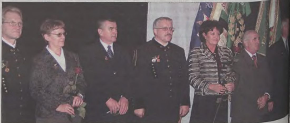
Niektórzy z wyróżnionych odznaką „Zasłużony pracownik KWB „Adamów”.

Prezes, ale również przemawiający po nim zaproszeni goście, składali życzenia załodze, która w kopalni jest najważniejsza. A przed nią kolejne zadania. W przyszłym roku bowiem ma być m.in. przebudowana największa odkrywka, czyli „Adamów” i wyremontowane dwie koparki. Ponadto plano-