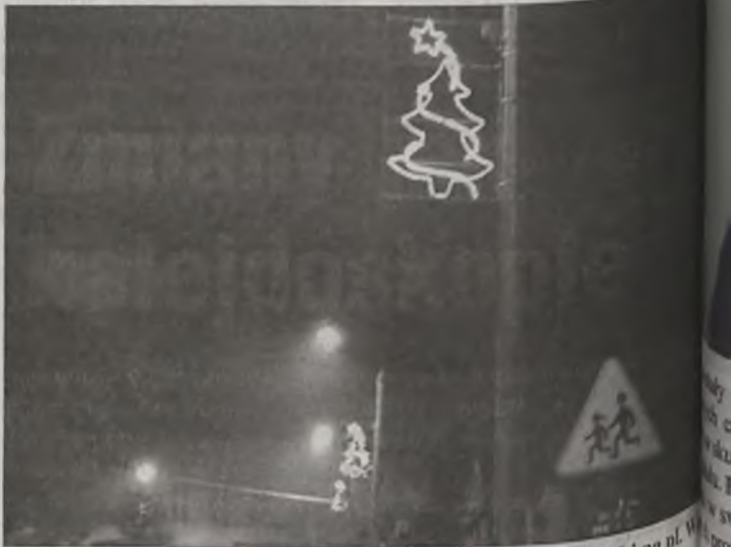
W tym roku Turek zdobią nie tylko rozświetlone choinki na placu Wojska Polskiego.

Burmistrz Zdzisław Czaplą wyraził nadzieję, że dekorowanie Turku kosztowało łącznie 8.000 złotych. Połowa tej kwoty pokrywa kasa miejska, połowę PGKiM. Oczywiście na placu Wojska Polskiego także w tym roku odbędzie się zabawa sylwestrowa. Będzie scena, na której wystąpią muzycy i będzie tradycyjny konkurs sylwestrowy. Na wypadek ewentualnych zdarzeń losowych choinka zostanie ubezpieczona.