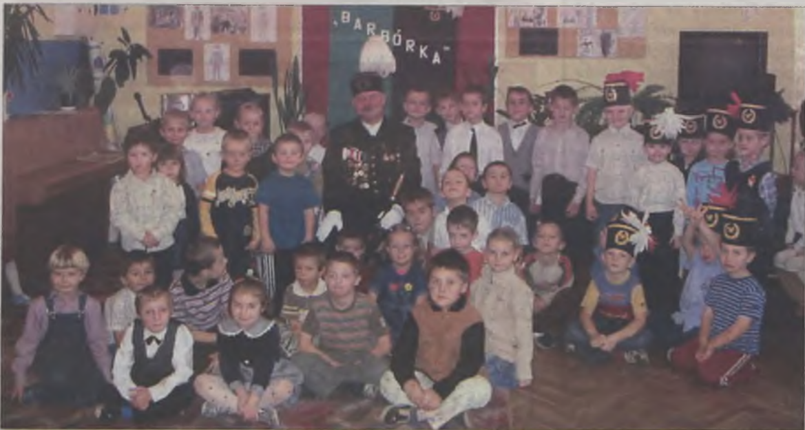
Każdy przedszkolak chciał mieć zdjęcie z górnikiem

Najładniejsze prace otrzymały pamiątkowe dyplomy, które wręczył małym artystom gość honorowy. W podziękowaniu za wizytę dzieci zaprezentowały górnikowi cześć artystyczną w postaci wierszyków i piosenek, oczywiście z górnikiem w roli głównej. MJ