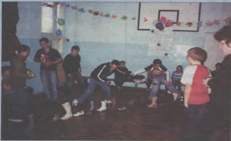
Czyj but pierwszy znalazł się przy wyjściu? To już wiedzą uczniowie z Koźmina.