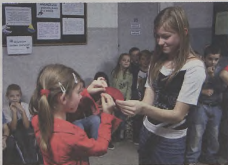
Dziewczynki chciały poznać imię swojego przyszłego partnera.