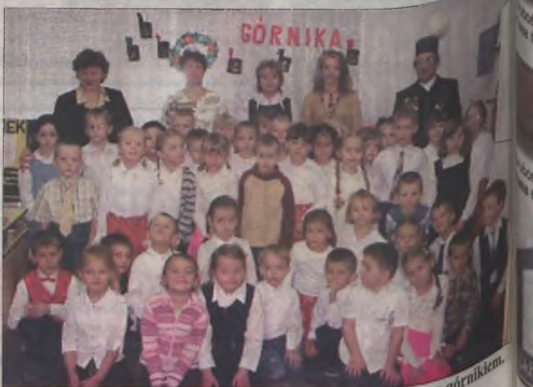
Podsumowaniem spotkania było pamiątkowe zdjęcie z górnikiem.

Na koniec przedszkolaki wręczyły górnikowi kwiaty z napisami, za co otrzymały album o turkowskich odkrywkach i cukierki.