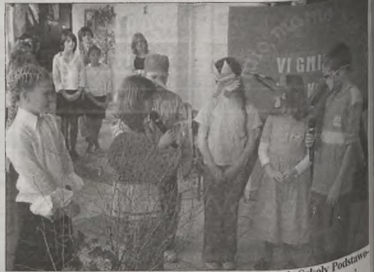
Podczas imprezy podsumowującej konkurs uczniowie Szkoły Podstawowej w Skarżynie zaprezentowali przedstawienie o tematyce zdrowotnej.