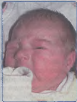
...Sypniewska córka Justyny i Rafała ur.28 listopada, godz.12.55 waga 3720, długość 55cm