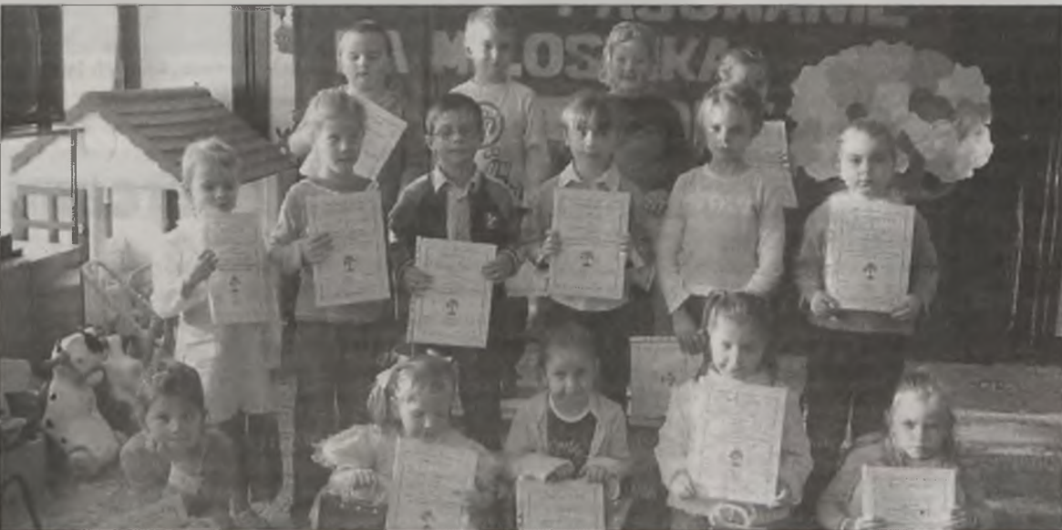
Laureaci konkursu plastycznego „Przyroda, krajobraz i zabytki naszego miasta”.

Podsumowanie konkursu odbyło się w poniedziałek, 28 listopada w „Trójce”. Na powitanie dzieci obejrzały teatrzyk „Leśna szkoła”, po czym uczestnicy konkursu złożyli ślubowanie „Jesteśmy ekologami i o środowisko nasze dbamy”. Wszyscy otrzymali pamiątkowe dyplomy „Małego Miłośnika Przyrody”. MJ