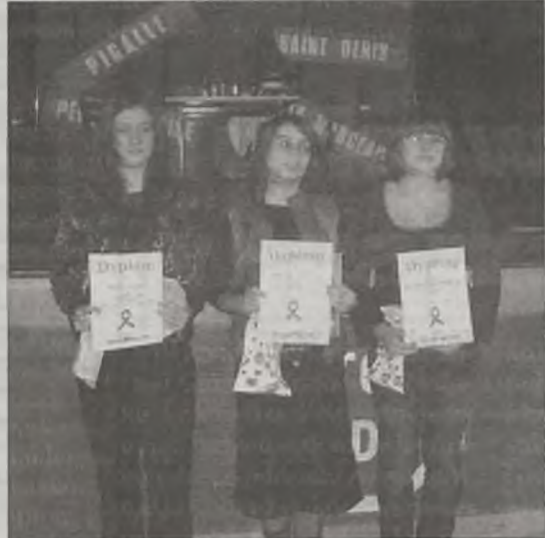
Laureatki II Powiatowego Konkursu na list o tematyce związanej z AIDS.