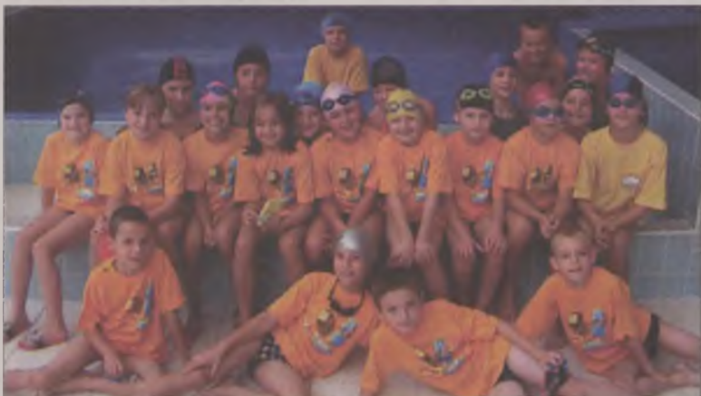
Dzieciaki z klasy sportowej podczas zajęć na basenie