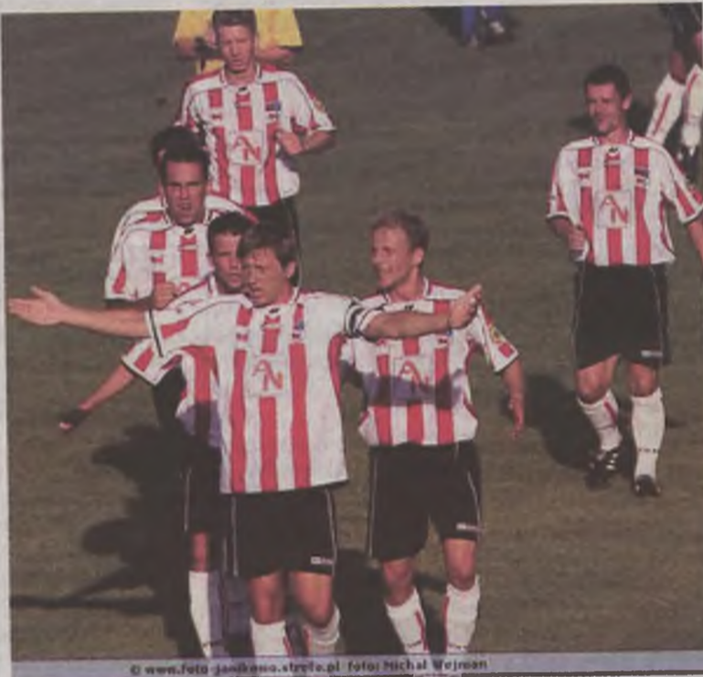
Piłkarze Tura cieszyli się z wyrównania w 31 minucie.