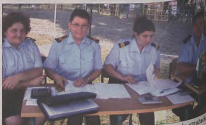
Punkty za poszczególne konkurencje dokładnie liczyła strażacka komisja.

lei w kategorii drużyn kobiecych najlepsze okazały się kolejno: OSP Żeronice, OSP Głuchów i OSP Brudzyń. Oprócz pucharu i nagród zwycięska drużyna będzie reprezentować nasz powiat w najbliższych zawodach wojewódzkich. Organizatorami zawodów byli: Komenda Powiatowa PSP w Turku, Zarząd Oddziału Powiatowego ZOSP RP w Turku oraz Zarząd Oddziału MG ZOSP RP w Tuliszkowie.