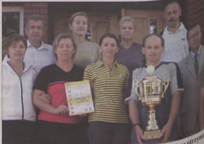
Najbardziej usportowiona szkoła średnia w Wielkopolsce otrzymała ogromny puchar i dyplom gratulacyjny.

tenis stołowy, strzelectwo i szachy. Dzięki im pomagają nam Miejski Klub Sportowy i gminne kluby sportowe, bo zawsze ciężko jest nam się pomieścić. Marzymy o nowej hali, która ma powstać przy liceum, ale na razie to tylko nasze marzenie.