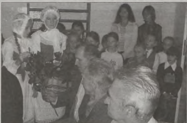
Dzieci dziękowały wierszami, śpiewem, tańcem i czerwonymi różami.