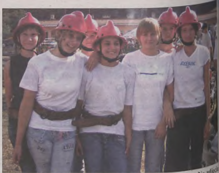
Kobiece drużyny w zawodach radziły sobie znakomicie. Na zdjęciu drużyna OSP Głuchów, która zajęła drugie miejsce.

Najlepsza w tegorocznych zawodach pożarniczych w kategorii męskiej okazała się drużyna OSP z Głuchowa, drugie miejsce otrzymała OSP Krwony, faworyt i zwycięzca poprzednich zawodów powiatowych, a trzecie miejsce ZOSP KWB „Adamów” z Turku. Z ko-