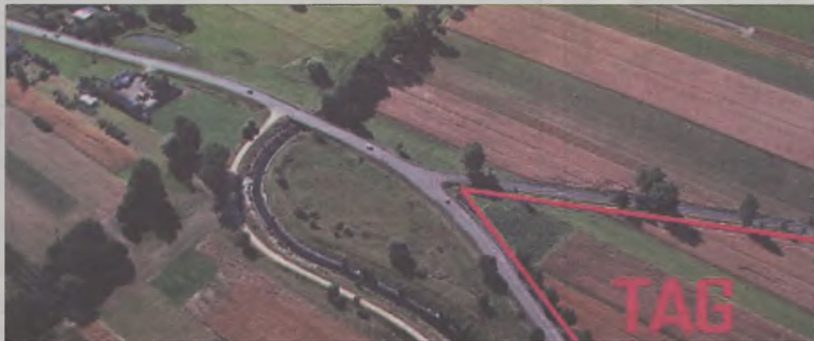
Teren aktywizacji gospodarczej z lotu ptaka.

Celem konkursu jest wybór najlepszego terenu inwestycyjnego w każdym województwie. Zgłaszane tereny muszą posiadać uregulowany stan prawny, być zaopatrzone w media i zlokalizowane w pobliżu autostrady, drogi krajowej lub wojewódzkiej. Teren proponowany przez Przykonę o powierzchni ok. 55 ha,