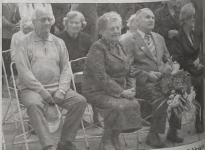
W uroczystościach uczestniczyli członkowie Kół Związku Sybiraków i Rodziny Katyńskiej, kombatan- ci oraz weterani II wojny światowej.

– Z mamą byliśmy wtedy pod rosyjską granicą, bo tam nas wysiedlili, kiedy dowiedzieliśmy się, że Ruscy na nas napadli. Byliśmy ogromnie przerażeni.