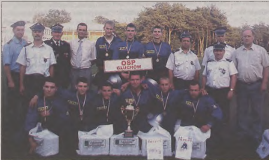
Najlepsza w tegorocznych zawodach pożarniczych w kategorii męskiej okazała się drużyna OSP z Głuchowa.

Drużyna Ochotniczej Straży Pożarnej z Głuchowa w gminie Kawęczyn (w grupie męskiej „A”) oraz Ochotniczej Straży Pożarnej z Żeronice w gminie Dobra (w grupie żeńskiej „C”) to najlepsze drużyny strażackie w powiecie. Zwycięzcy zostali wyłonieni podczas IV Powiatowych Zawodów Sportowo-Pożarniczych Jednostek OSP, które odbyły się w sobotę, 10 września na stadionie w Tuliszkowie.