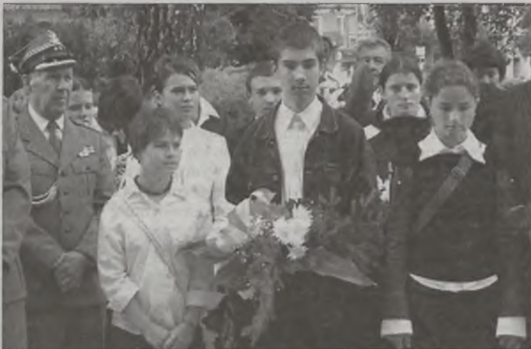
Pod pamiątkowymi tablicami wieńce złożyła m.in. delegacja Gimnazjum nr 2 w Turku.

W sobotę, 17 września pod tablicami pamiątkowymi przy Kościele Najświętszego Serca Pana Jezusa w Turku obchodzono 66 rocznicę napaści Armii Czerwonej na Polskę. Uroczystości rocznicowe były lekcją historii o tych turkowanach, którzy polegali za losy Ojczyzny.