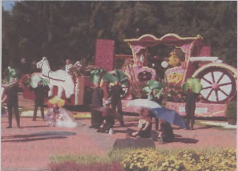
Festyn kwiatowy w Wiesmoor to jedna z ważniejszych imprez ogrodniczych w Niemczech.

wyżywienie i szereg atrakcji. Była wycieczka do parku wodnego w Holandii, wycieczka nad Morze Północne, do zoo, jazda konna, ale również zajęcia lekcyjne w Wiesmoor. Głównym celem wyjazdu był jednak udział w przeglądzie artystycznym twórczości dziecięcej, na którym młodzi turkowiacy zaprezentowali widowisko artystyczne na motywach baśni H. Ch. Andersena „Stara latarnia”. Do tego występu dzieci przygotowywały się w wakacje. W nagrodę otrzymały gromkie brawa publiczności oraz miłą recenzję w prasie niemieckiej. a