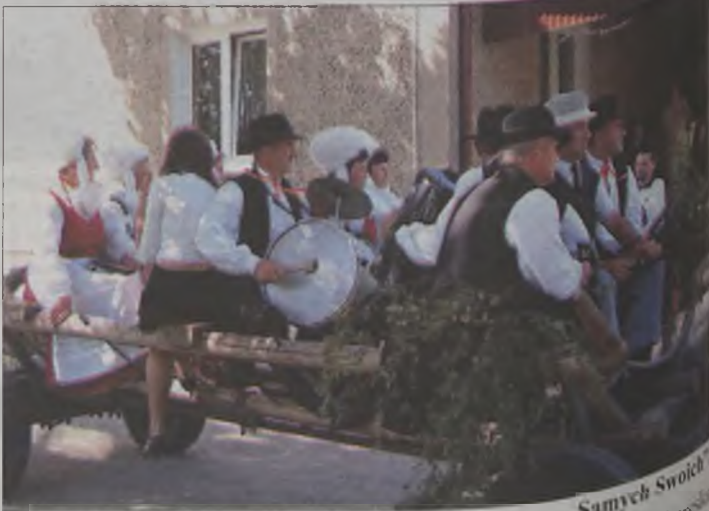
Wóz drabiniasty jest nadal ulubionym pojazdem „Samych Swoich”.