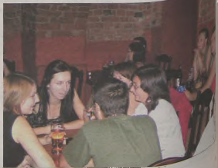
Na urodzinach piwnicy zawsze było dużo gości.