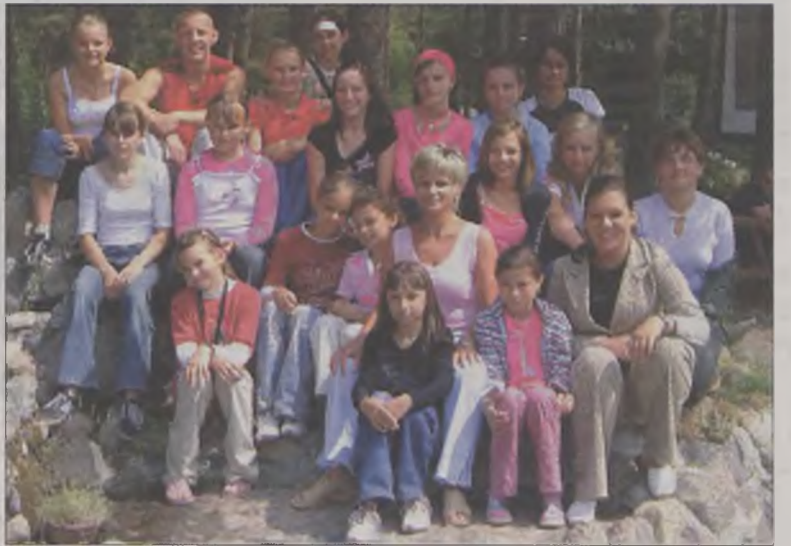
Dzieciaki były zadowolone z wypoczynku.

W Jarosławcu kolonijni oprócz codziennego plażowania odbyli rejs statkiem, wycieczkę do latarni morskiej i aquaparku w Darłówku. Dodatkowymi atrakcjami były: jazda