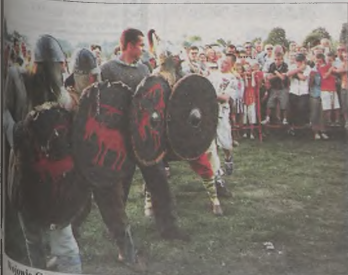
Wojewie Grodu Tura.

Tysiące turkowie bawili się na festynie, który rozpoczął jubileuszowe obchody 25-lecia Niezależnego Samorządnego Związku Zawodowego „Solidarność” Ziemi Turkowskiej.