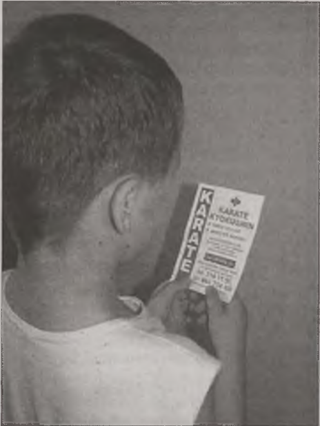
Dzieci z rozmowy z policjantem zamiast wnieść materiały prewencyjne na temat bezpiecznych zachowań, wnieśli ulotki reklamujące klub, którego szefem jest tenże policjant.

ulotki. Niemniej już sam fakt rozdania tych ulotek to wykorzystanie swojej funkcji publicznej i munduru policyjnego. W końcu opłacany z naszych podatków policjant powi-