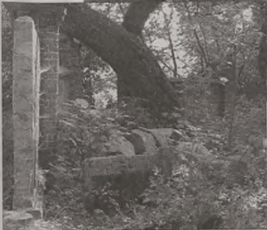
Dawne oblicze parku z roku na rok blednie - coraz mniej śladów po dawnych właścicielach folwarku.

Oprócz pięknych i wiekowych drzew, rozsypujące się mury i śmieciowisko - to dzisiejsze oblicze grzymiszewskiego parku.