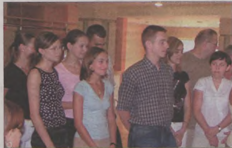
Dzieciaki dostały wyprawki m.in. dzięki tym członkom Turkowskiego Stowarzyszenia Młodych.