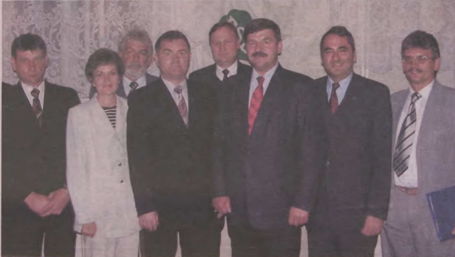
Foto: Kalinowski z kandydatami PSL na posłów i senatora w naszym okręgu