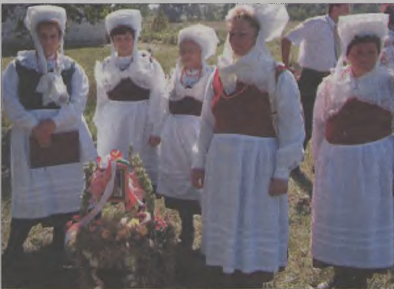
Śpiewaczki pozostały te same.