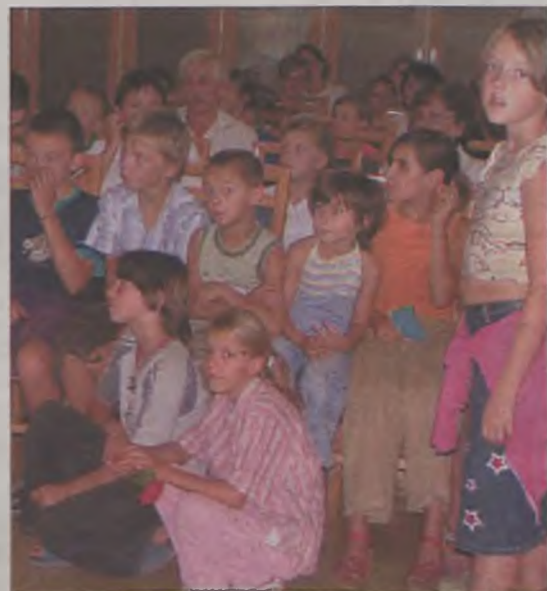
Łącznie udało się skompletować 100 wyprawek szkolnych.