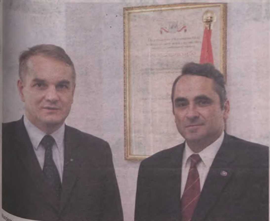
Waldemar Pawlak prezes PSL i Eugeniusz Grzeszczak lider listy PSL w okręgu nr 37

Polskie Stronnictwo Ludowe w okręgu nr 37 obejmującym powiaty gnieźnieński, koniński, słupecki, średzki, turecki i wrzesiński oddaje do Państwa dyspozycji swoich 18 najlepszych przedstawicieli. Są nimi: samorządowcy, nauczyciele, lekarze, weterynarze, prawnicy, przedsiębiorcy. "W większości z tych osób było współpracować i nigdy na nich nie zawiodłem" -