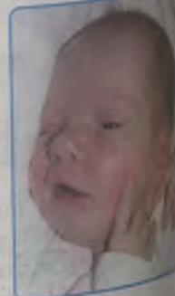
... Gajewska córka Beaty i Pawła ur. 5 września, godz. 13.30 waga 2900g, długość 51cm