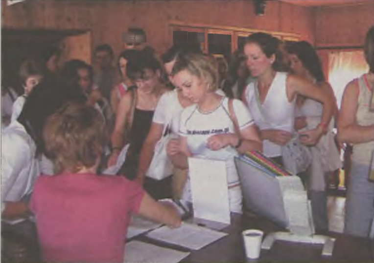
W Targach Au Pair uczestniczyło około 300 osób bezrobotnych i poszukujących pracy, oraz ponad 200 uczniów turkowskich szkół średnich.