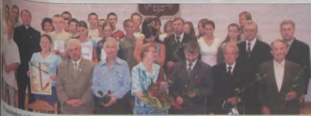
uczestnicy władysławowskiej lekcji historii o drodze do wolności.

Gimnazjaliści, dla których początek lat 80-tych minionego wieku to już bardzo odległa historia, uświadomili sobie, jak ciężko było wtedy żyć, a tym bardziej, jak dużym bohaterstwem należało się wykazać, aby wystąpić przeciwko władzy w walce o wolność dla jednostki. Choć każdy z dawnych opozycjonistów miał swoje osobiste odczucia i refleksje, to wszyscy byli zgodni co do jednego, że był to czas słusznej walki. AZ