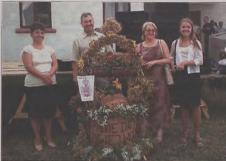
Dobryscy „rolnicy” ze swoim wieńcem.