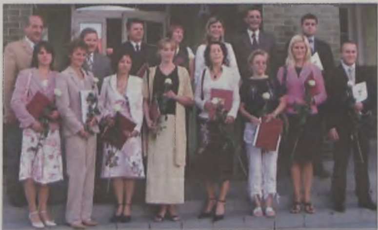
Dwunastu nauczycieli ze szkół podlegających Starostwu Powiatowemu w Turku odebrało akty awansu na nauczyciela mianowanego.

Kolejnych dwunastu nauczycieli ze szkół podlegających Starostwu Powiatowemu w Turku odebrało akty awansu na nauczyciela mianowanego. Uroczystość ślubowania odbyła się w miniony piątek, 26 sierpnia.