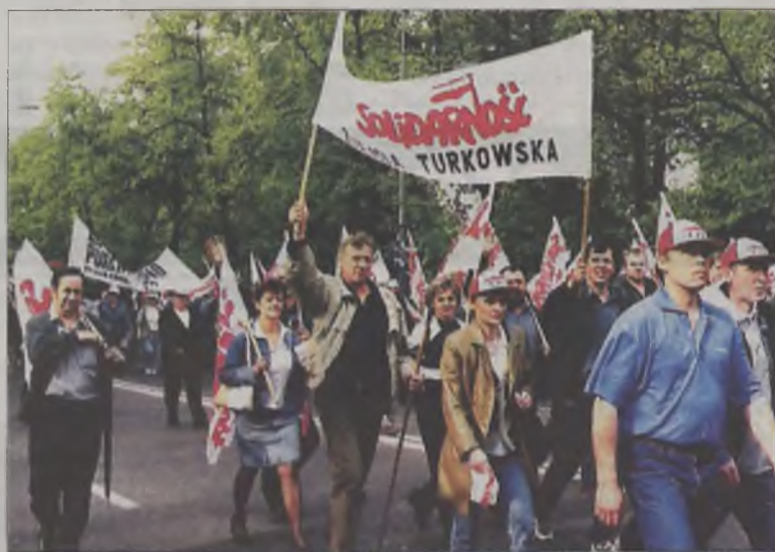
Związkowcy z Turku podczas demonstracji w Warszawie