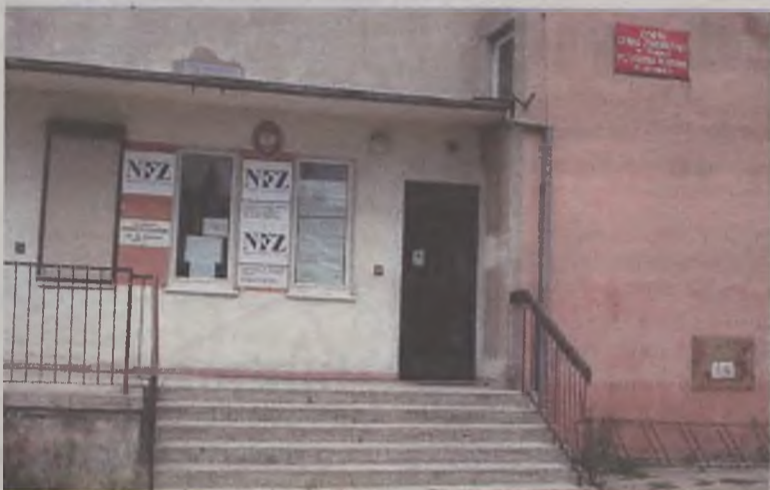
Kobieta nie zdążyła dojechać do Kowali Pańskich, a na pomoc pielęgniarek z przychodni w Dobrej nie mogła liczyć.

Tragedia rozegrała się dwa tygodnie temu na schodach ośrodka zdrowia w Dobrej. Tu bezradna kobieta przywiozła swoją matkę, która nie czuła się dobrze. Było około godz. 11.00. Pielęgniarki poinformowały ją, że nie ma lekarza i aby czekała do przychodni w Kowali Pańskich. W tym momencie matka pani upadła i... zmarła. Z badania córki staruszki wynika, że nie było w przychodni pielęgniarki, która mogłaby pomóc umierającej kobiecie.