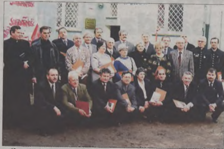
Zastąpieni działacze związkowi podczas jubileuszu 20-lecia „Solidarność” na pamiątkowym zdjęciu.