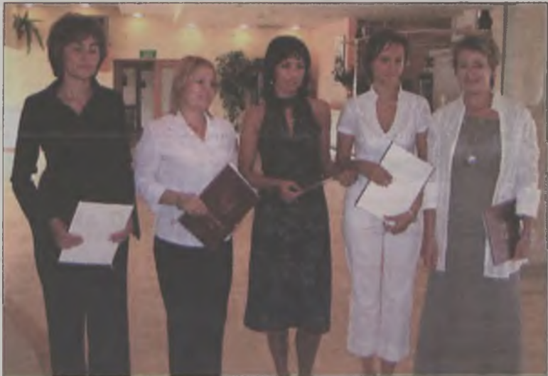
Akty nadania stopnia awansu odebrała tylko część awansowanych z Turku. Pozostali byli na wycieczce.

Kolejni nauczyciele z powiatu tureckiego w miniony piątek, 26 sierpnia odebrali akty nadania im stopnia awansu zawodowego na nauczyciela dyplomowanego.