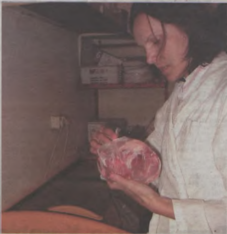
W zamrażarkach znajdowało się nieoznakowane mięso nieznanego pochodzenia.