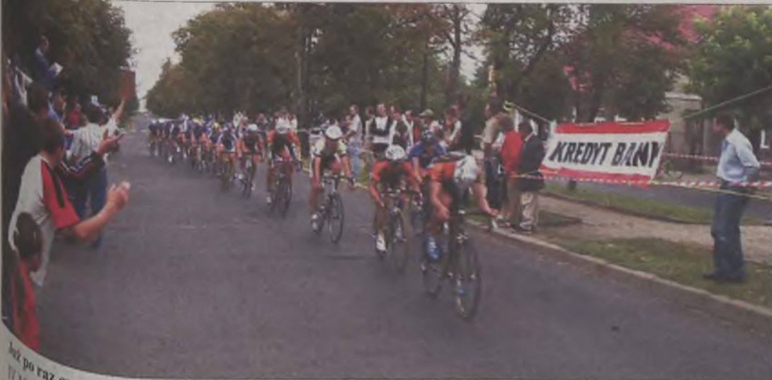
W tym roku czwarty kolarze ścigali się na Kaliskiej w Turku.

W tym roku czwarty kolarze ścigali się na Kaliskiej w Turku. W tym roku czwarty kolarze ścigali się na Kaliskiej w Turku. W tym roku czwarty kolarze ścigali się na Kaliskiej w Turku.