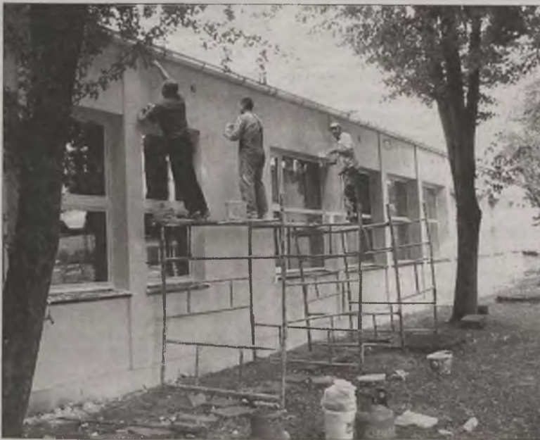
W tej samej szkole wykańczana jest nowa frontowa elewacja.

Tymczasem w Szkole Podstawowej nr 1 zostanie utworzona klasa artystyczna. Pozwoli to na rozbudzenie