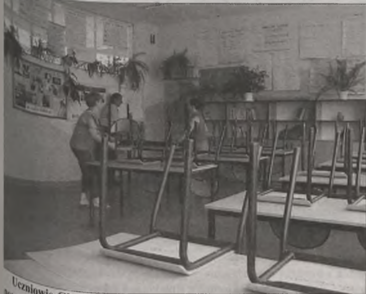
Uczniowie Gimnazjum nr 1 zasiądą od nowego roku szkolnego na nowych krzesłach i w nowych ławkach.

P.S. 2005 rok będzie chyba pierwszym rokiem od wielu lat, w którym urodzi się prawie 20% więcej turkowiaków niż rok wcześniej.