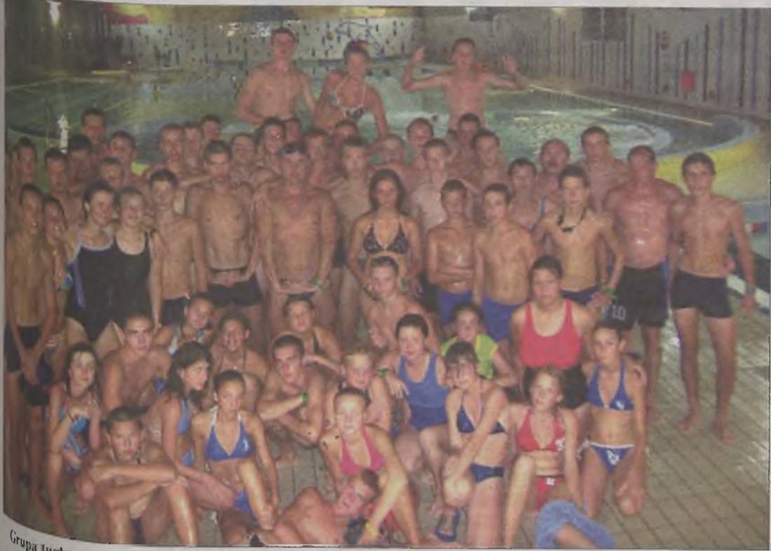
Grupa turkowskich siatkarzy w aqua parku w Darłowie.

Siatkarze z Międzyszkolnego Ośrodka Sportowego przy ul. Sportowej 1 w Darłowie, przebywali na nadmorskiej miejscowości w Darłowie. Dwanaście dni głównie poświęcone były na treningi. W turnieju siatkarskim w kategorii juniorek, zwyciężyła w kategorii juniorek. W turnieju siatkarskim w kategorii juniorek, zwyciężyła w kategorii juniorek.