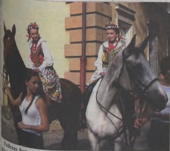
Podczas festynu w Domu Dziecka w Turku tańczące krakowiaka dziewczynki jeździły również na koniach.

"Bądźmy razem" to hasło przewodnie festynu zorganizowanego dla dzieci z Domu dla Dzieci i Młodzieży w Turku. Gry i zabawy na świeżym powietrzu z udziałem zaproszonych gości odbywały się w czwartek, 25 sierpnia.