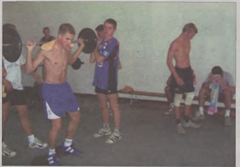
W różny sposób próbowano swoich sił.