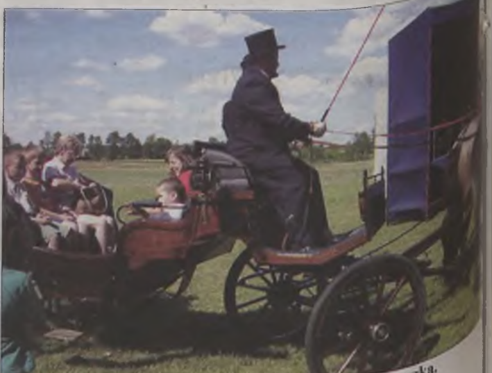
Jedną z festynowych atrakcji były przejażdżki bryczką.

W trakcie festynu odbyły się konkursy sportowe, wiedzowe i tradycyjny już konkurs na odgadnięcie wagi szynki. Były też prześcig bryczką, a na zakończenie odbyła się dyskoteka.