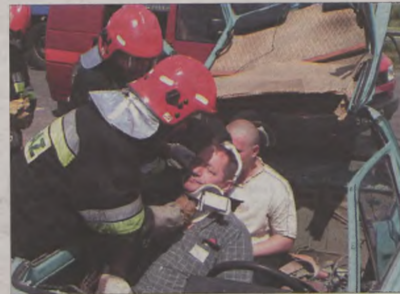
Z rozciętego wraku wydobyto ciężko rannych pasażerów.

Scenariusz ćwiczeń zakładał, że na tamie zderzyły się dwa samochody osobowe i autobus. Jedna z osobówek siłą uderzenia staranowała barierę i wpadła do wody, zanieczyszczając ją wydobywającymi się z pojazdu substancjami ropopochodnymi. Do zdarzenia doszło w części zapory leżącej po stronie powiatu turckiego.