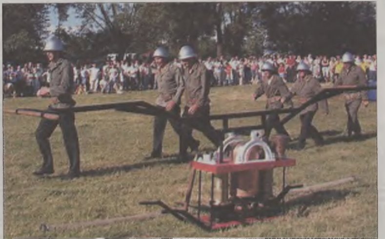
Zabytkowa ręczna pompa odrestaurowana przez głuchowskich strażaków.

gminie Kawęczyn bywało i wyniosła 2.475 zł. Fundatorów było trzech. Rada Gminy w Kawęczynie, wójt gminy i Zarząd Gminny OSP. Najwięcej 500 zł otrzymali seniorzy z Głuchowa. W sumie ta jednostka zebrała 850 zł. Kolejne Marianów i Kawęczyn wygrały po 450 zł.