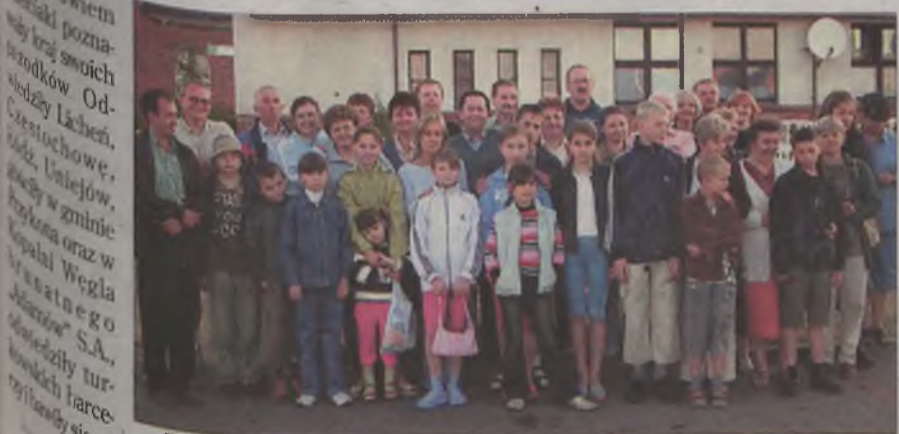
Dzieci z Ukrainy już po raz czwarty odwiedziły Turek i zostały serdecznie przyjęte przez tureckie rodziny.