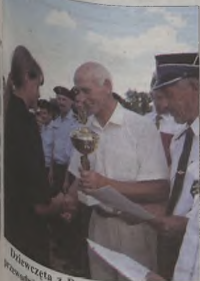
Dziewczęta z Radyczyn uhonorował przewodniczący Rady Gminy.