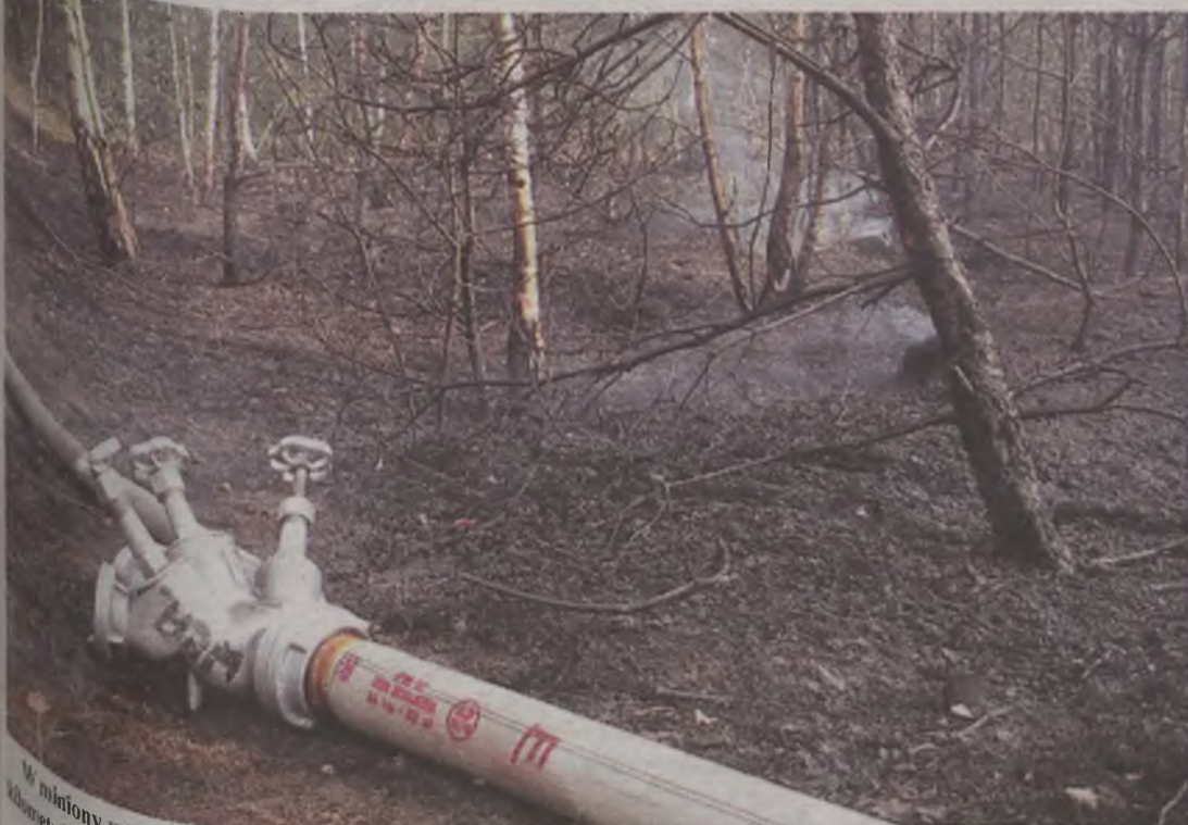
W miniony wtorek, w ciągu około godziny w dziewięciu miejscach oddalonych od siebie zaledwie o kilka kilometrów, podpalacze podkładali w lasach ogień.

W tym roku Nadleśnictwo Turek odnotowało 13 pożarów lasów, z czego dziewięć z nich miało miejsce w ciągu jednego dnia w ubiegłym tygodniu i było efektem podpalenia. Dodatkowym czynnikiem sprzyjającym pożarom jest trwająca od dłuższego czasu upalna pogoda, w wyniku której o pożar nietrudno.