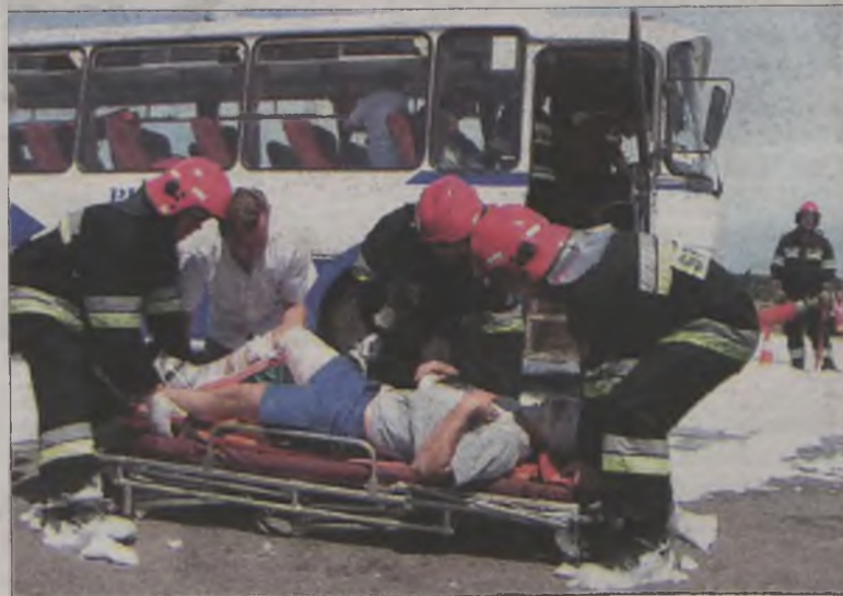
Dwunastu pasażerów autobusu doznało obrażeń ciała.

Ćwiczenia obserwował Powiatowy Zespół ds. Reagowania Kryzysowego przy Starostwie Powiatowym w Turku. Łącznie w akcji wzięły udział 62 osoby, a w tym czasie ruch pojazdów na tamie odbywał się w normalnym trybie. Na zakończenie posumowano działania i wyciągnięto z nich wnioski. Organizatorzy wskazują m.in. na potrzebę prowadzenia takich akcji symulujących warunki rzeczywiste. Ponadto podkreślono, że ćwiczenia pomogły doskonalić komunikację radiową przez stanowiska kierowania w PSP Podębice oraz PSK w PSP Turek, jak i przez pozostałe służby ratownicze, oraz wykazały dobrą współpracę pomiędzy jednostkami ochrony przeciwpożarowej, pogotowiem ratunkowym, policją i innymi służbami, w tym dysponującymi np. zastępczym autobusem. AZ