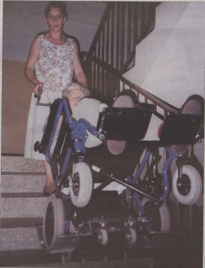
Schodolaz okazał się wybawieniem, bo dzięki niemu wózek inwalidzki przytrzymywany schodzi po schodach niemal samodzielnie.

na chora. – Gdy po raz pierwszy otworzyłam oczy zobaczyłam na sali rząd kłęczących pacjentek, które modliły się o moje zdrowie.