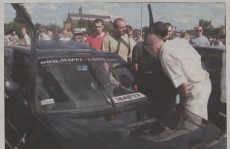
Auta cieszyły się dużym zainteresowaniem wśród turkowskich.

Podsumowaniem imprezy była wspólna parada techno ulicami miasta, która zakończyła się w dyskotece „Piramida” w Kalinowej. MJ