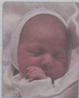
... Pyzik syn Honoraty i Przemysława ur. 13 czerwca, godz.15.00 waga 3300g, długość 53cm