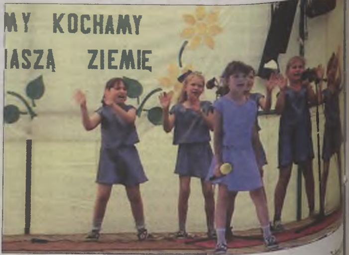
Występ dzieci ze szkoły w Dziadowicach.