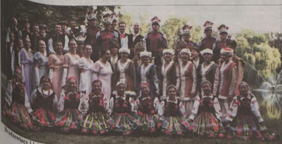
Burdzewiaczy i ich nowi przyjaciele poznani w Jarocinie.