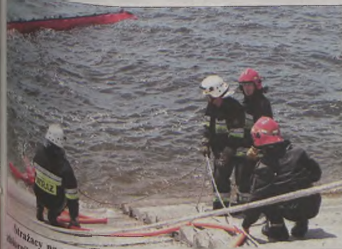
Strażacy na wodzie rozstawili zaporę uniemożliwiającą skażenie substancją ropopochodną.

Jako pierwszy do akcji wkroczyli strażacy, którzy przy pomocy sprzętu hydraulicznego rozcinali roztrzaskany pojazd, by wydobyć z niego trzech ciężko rannych. Przy okazji warto dodać, że w roli poszkodowanych wystąpili specjalnie ucharakteryzowani druhowie z OSP Kawęczyn i OSP Władysławów. Ponadto obrażeń doznało dwunastu pasażerów autobusu. Strażacy przeprowadzili ich segregację na lekko i ciężko rannych oraz tych bez obrażeń i udzielili im pierwszej pomocy przedmedycznej. Na miejsce zdarzenia przybyły karetki pogotowia z Turku i Podębic (ranni odwiezieni byli do szpitali w tych miejscowościach) oraz specjalistyczna grupa wodno-