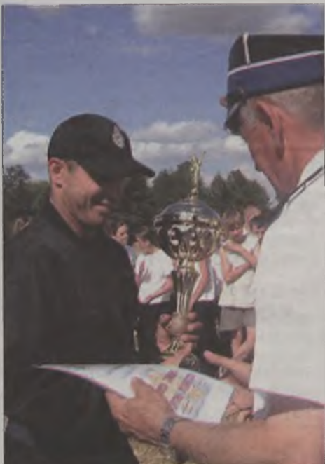
Puchar dla zwycięzców odbiera dowódca drużyny seniorów z Przykony.

OSP Radyczyn gościły w tym roku u siebie Gminne Zawody Sportowo-Pożarnicze. W trzech kategoriach wygrała drużyna z Przykony, Smulsko i Radyczyn. Gospodarze z dużą przewagą zwyciężyli w kategorii młodzieżowych. Za to seniorów zajęli ostatnie miejsca. Dla odmiany przycykła znakomitych przygotowanych seniorów, a młodzieżówki w tym roku słabszej od przykockich. Zawody przebiegły sprawnie w sportowej atmosferze. Jedynym błędem za popełniony w kategorii seniorów był błąd przykocki.