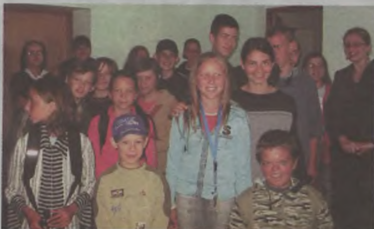
Podczas wizyty w naszej redakcji wycieczka z „Przystani” poznała pracę dziennikarza.

pytały również o zawód dziennikarza, najciekawsze materiały oraz wszystko to, co z pracą dziennikarza prasowego jest związane. Praca redakcyjna tak im się spodobała, że od września zamierzają otworzyć własną „Przystaniową” gazetkę. MJ