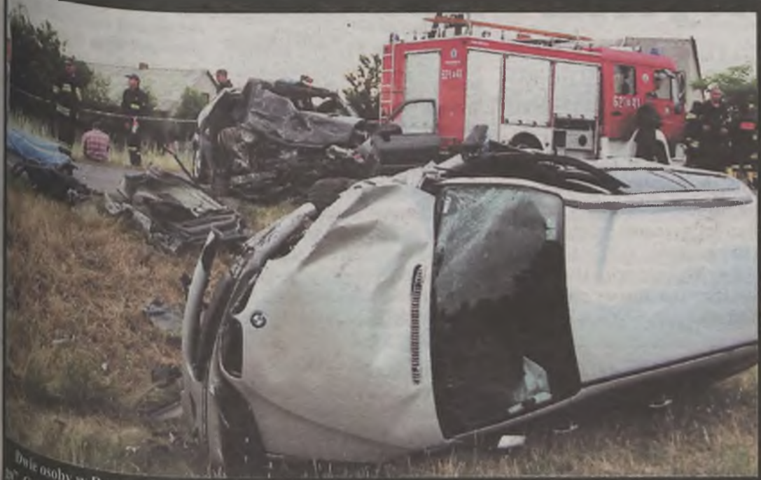
Dwie osoby w Rzymku zginęły najprawdopodobniej dlatego, że kierowca BMW wyprzedzał „na trzeciego”. Czy kolejne zdjęcie ze śmiertelnego wypadku drogowego sprawi, że będziemy jeździć bezpieczniej?

Kolejny tragiczny wypadek na drogach powiatu tureckiego. Tym razem ofiarami bezmyślności i dużej prędkości padły dwie osoby. Wszystko w wyniku tak zwanego wyprzedzania „na trzeciego”.