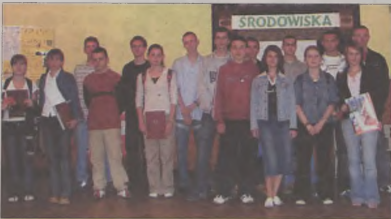
Finałiści wszystkich konkursów stanęli do wspólnej fotografii.

W piątek, 3 czerwca w Zespole Szkół Ogólnokształcących w Turku odbyły się obchody Powiatowego Dnia Ochrony Środowiska. W imprezie wzięli udział uczniowie ze szkół ponadgimnazjalnych z całego powiatu tureckiego.