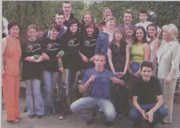
Ekipa Gimnazjum nr 2 w Turku była bardzo zadowolona z występów artystycznych.

Finałowe przedstawienie odbyło się w piątek 3 czerwca w Miejskim Domu Kultury w Turku, z udziałem nie tylko turkowiaków, ale również zagranicznych gości z Holandii i Niemiec. Tematem głównym musicalu była miłość i agresja, widziana oczami młodego pokolenia. Uczniowie sami wybrali temat, sami pisali scenariusze, wybierali muzykę i przede wszystkim realizowali własne wizje na temat świata, gdzie obok miłości jest także agresja.