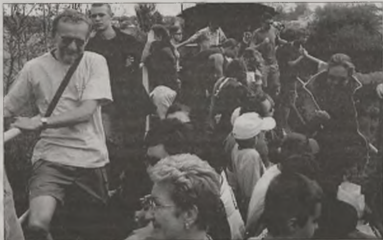
Z wagonów turyści podziwiali okoliczne widoki.

Oczywiście kolejka nie ruszyłaby, gdyby nie praca maszynisty, który dba o to, aby wyjazd się udał i wszyscy podróżni bezpiecznie dotarli na