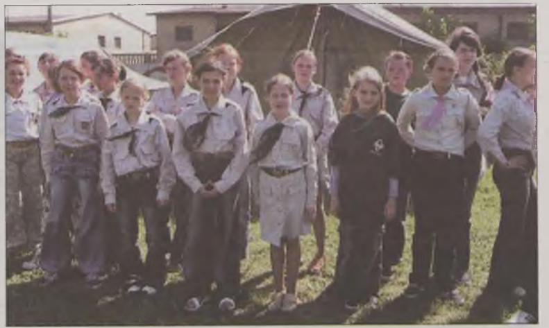
...i z Władysławowa.

-Harcerstwo w życiu bardzo się przydało, szczególnie podczas samotnych pobytów w domu. Mój mąż był leśnikiem, często wyjeżdżał a ja sama zostawałam w środku lasu z małymi dziećmi. Bez prądu, wody w domu, nie mówiąc o takich wygodach, jak kuchnia gazowa, czy pralka. Po mleko dla