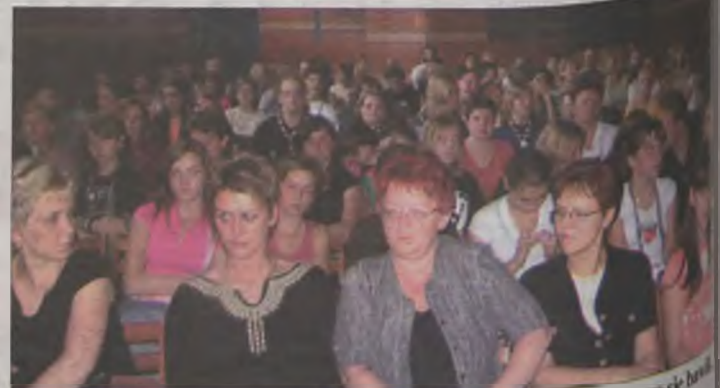
Podczas przedstawienia widownia była zapełniona i wszyscy dobrze się bawili.

przede wszystkim wiele korzyści, zarówno finansowych, jak kulturo-