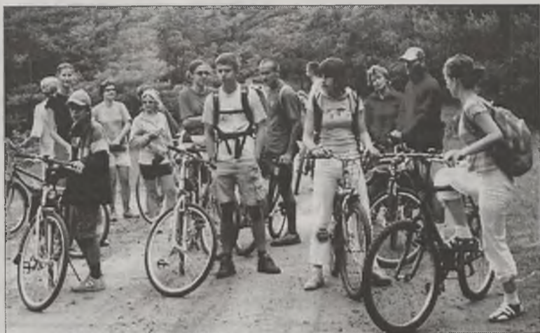
Jednym z punktów rajdu był powrót malowniczymi ścieżkami rowerowymi.

Na trasie do Zbierska tradycyjnie już uczestnicy odpoczywali w Piętnie, gdzie zorganizowano wspólne ognisko. Zwyczaj dodatkową atrakcją postoju były przejazdy starą drezyną. W tym roku jednak atrakcji tej nie było, bo drezynę skradziono. Była za to gry i zabawy dla