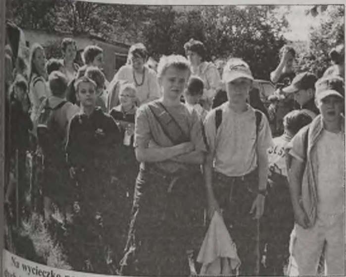
Na wycieczkę poza granicę powiatu wybrała się spora grupa młodych turystów.

Organizatorami wyprawy do Zbierska było Tureckie Towarzystwo Turystyczne oraz Koło Turystyczne Liceum Ogólnokształcącego w Turku. MJ