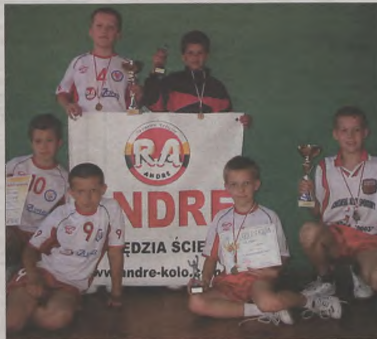
Młodzi siatkarze z turnieju w Jastarni przywieźli kolejne puchary. Powiększą one kolekcję klubu UKS „Piątka” Turek, którego jednym ze sponsorów jest firma Andre z Koła.