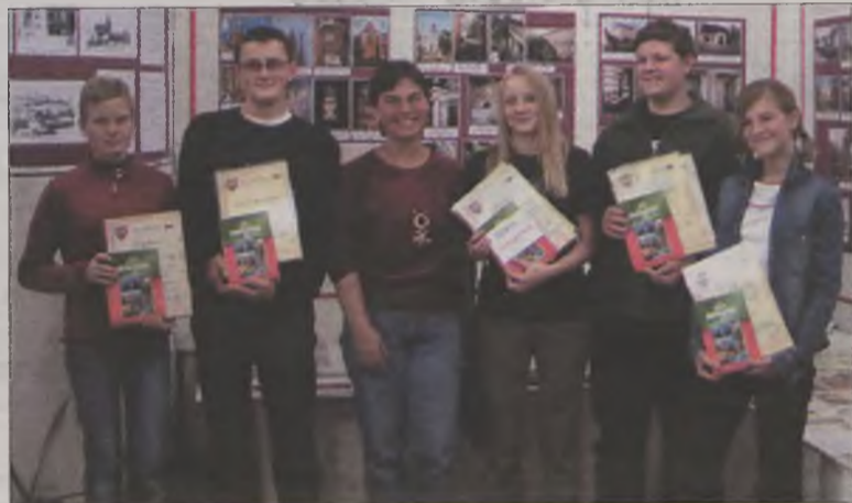
Ekipa z Gimnazjum nr 2 w Turku okazała się najlepsza w konkursie wiedzy o regionie.

ku otrzymali pamiątkowe dyplomy oraz nagrody książkowe.