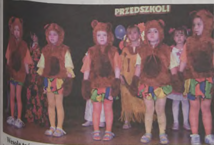
Wesołe tańczące misie to program przygotowany przez Przedszkole Samorządowe nr 3 w Turku.

udział we wszystkich występach i prezentacjach, tym bardziej, że w naszym przedszkolu już od trzech lat działa kółko artystyczne, na którym dzieci zdobywają szeroką wiedzę artystyczną, ta-