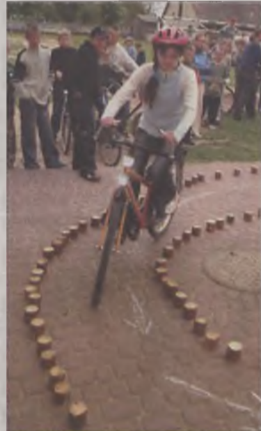
Najlepiej spisały się dziewczęta.

W dalszej części przeprowadzono przegląd techniczny rowerów należących do dzieci. Niestety, z