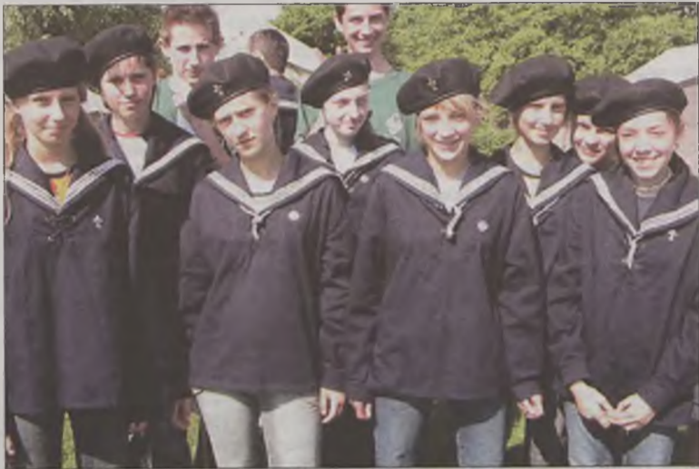
Na zlot do miasteczka harcerskiego stawily się drużyny z całego powiatu, m.in. z Przykony...

Obchody rocznicowe rozpoczęło otwarcie wystawy w piątek, 3 czerwca w Muzeum Rzemiosła Tkackiego w Turku, która poprzez rekwizyty i dokumenty gromadzone od 1915 roku przybliżyła działalność harcerstwa na terenie naszego powiatu. Głównymi zdobytymi fotografiami, legitymacjami, dokumentami, które stały się potwierdzeniem tego, jak ważne w dawnych czasach był harcerstwo, jak dużą w życiu miasta i turkowskiego odegrało rolę.