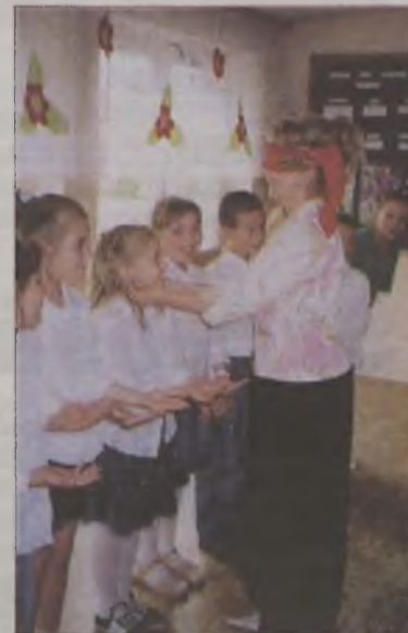
Wspólne zabawy dzieci i mam.