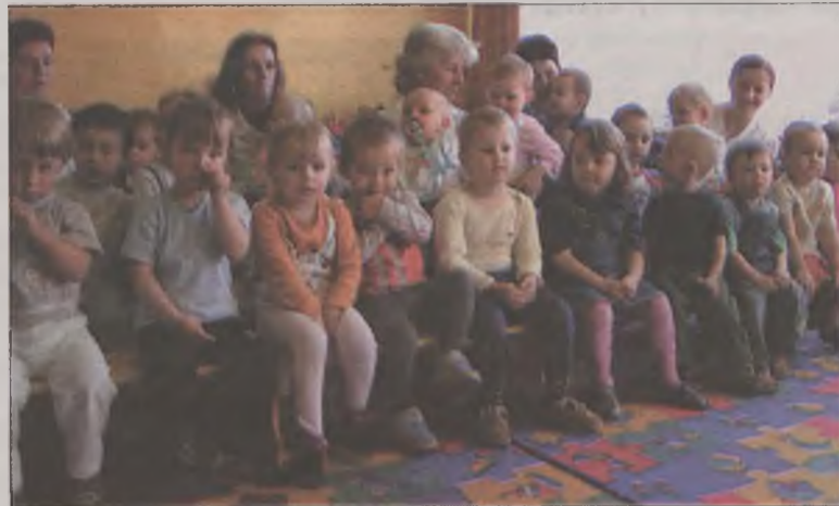
Maluszkom bardzo podobało się przedstawianie o Kapturku, babci i wilku.