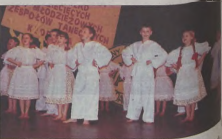
„Mali brudzewiaczy” w układzie „Nowe lotko”.