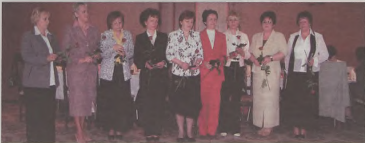
Nauczyciele nagrodzeni medalem 100-lecia ZNP.

98 członków liczy Związek Nauczycielstwa Polskiego w gminie Turek. Większość z nich obecna była we wtorek, 26 kwietnia na uroczystości 100-lecia związku, którą zorganizowano w restauracji „Centralna”.