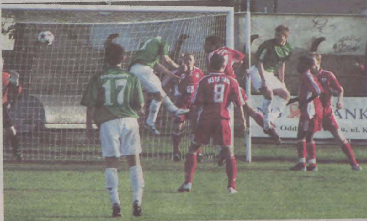
W derbach Wielkopolski Warta (zielone stroje) górowała nad Turem