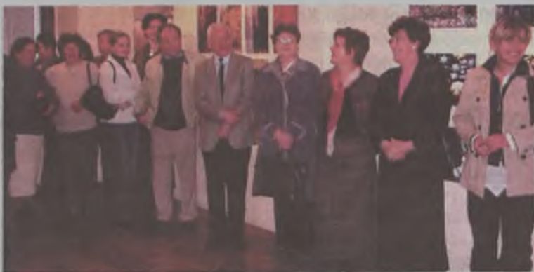
Na otwarcie wystawy przybyło wielu zaproszonych gości.