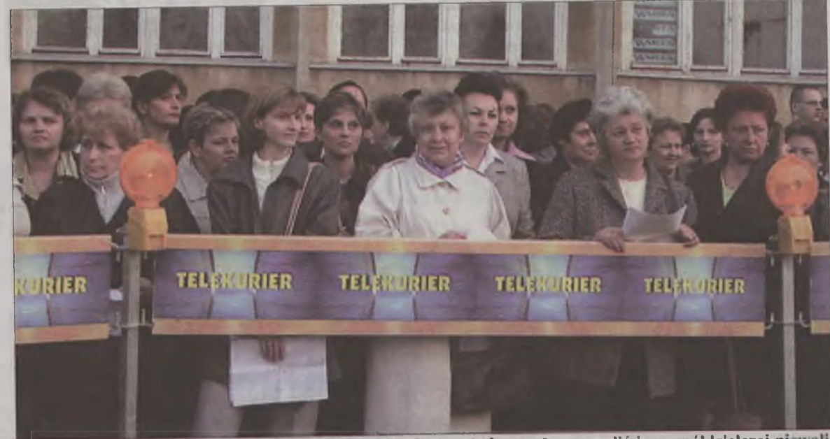
Pracownice Tary w oczekiwaniu na audycję telewizyjną, która może wyzwolić je ze spółdzielczej niewoli.

PS. Jak się dowiadujemy na opisaną sytuację zareagował burmistrz Zdzisław Czapla, który zaproponował syndykowi transakcję polegającą na zbilansowaniu należności Tary wobec miasta (ok. 350 tys. zł zaległego podatku lokalnego) z nieopłaconymi udziałami członkowskimi. O dalszych decyzjach w tej sprawie będziemy informować na bieżąco.