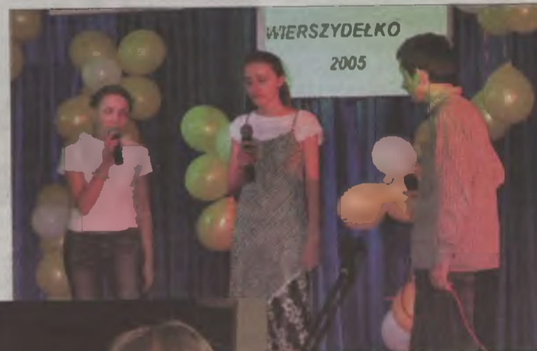
Występ gimnazjalistów z Przykony.