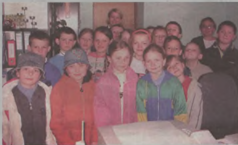
Zwiedzanie naszej redakcji było jednym z punktów wycieczki do Turku.

Dzieciaki zaciekawione pracą dziennikarza pytały, czy to trudny zawód i jak wygląda. Oprócz podstawowych czynności jak pisanie tekstu czy robienie zdjęć, uczniowie zaciekawieni byli tym, jak powstaje strona, jak wygląda jej makieta, jak się zamieszcza ogłoszenia, a jak reklamy. Największym zainteresowaniem cieszyła się jednak wspólna pamiątkowa fotografia, którą od razu mogły zobaczyć na ekranie komputera. Kto wie, może w przyszłości z ciekawych świata dzieciaków wyrosną przyszli dziennikarze „Echa”. MJ