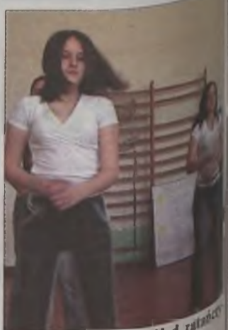
Uczennice klasy II d zatańczyły dla publiczności.