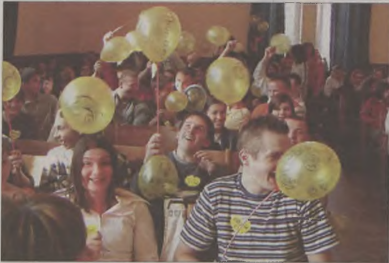
Nie dziwią balony. W końcu to było święto chemii.