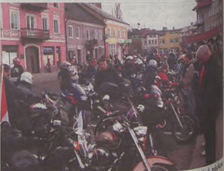
Z okazji inauguracji sezonu mieszkańcy mogli podziwiać piękne maszyny.