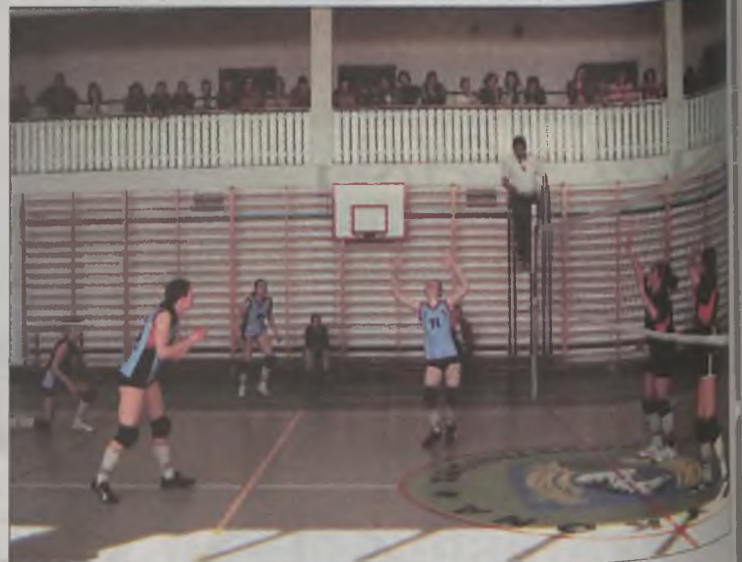
Atak tuliszkowianek w meczu ze Słupcą.

W spotkaniu o 3 miejsce drużyna z Wilczyna mimo słabszych umiejętności stawiała zacięty opór przeciwniczkom ze Słupcy. Pierwszą partię słupczanki wygrały 25:15, lecz w drugim secie było już tylko 25:21 i w całym meczu 2:0 dla Słupcy. Finał mistrzostw rejonu pomiędzy Tuliszkowem i Przykoną stał się rewanżem za mistrzostwa powiatu, gdzie