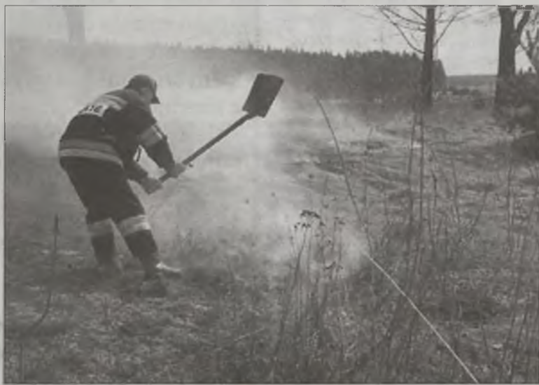
Rolnicy zaczęli wypalać trawy i nie ma dnia, by strażacy nie wyjeżdżali do kosztownych akcji gaśniczych. Dlatego zapowiadają, że sprawcy wypaleń będą surowo karani.

Mimo zakazu i wysokich mandatów nakładanych na wypalających, ciągle mamy do czynienia z takimi przypadkami. W ubiegłym tygodniu aż sześć razy wypalający trawy nie opanowali ognia i wzywana była straż. Łącznie od 27 do 31 marca suche trawy płonęły w Dobrej na ul. Wiatraki, na ul. Obwodnica Północna w Turku, na ul. Żuchalskiej w Tuliszkowie oraz we wsiach Staru-