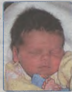
... Wojciechowski syn Emilii i Piotra ur. 20 marca, godz. 11.15 wżył 3250g, mierzył 53cm