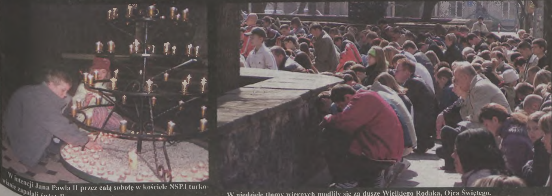
W intencji Jana Pawła II przez całą sobotę w kościele NSPJ turkowie zapalali światełka.