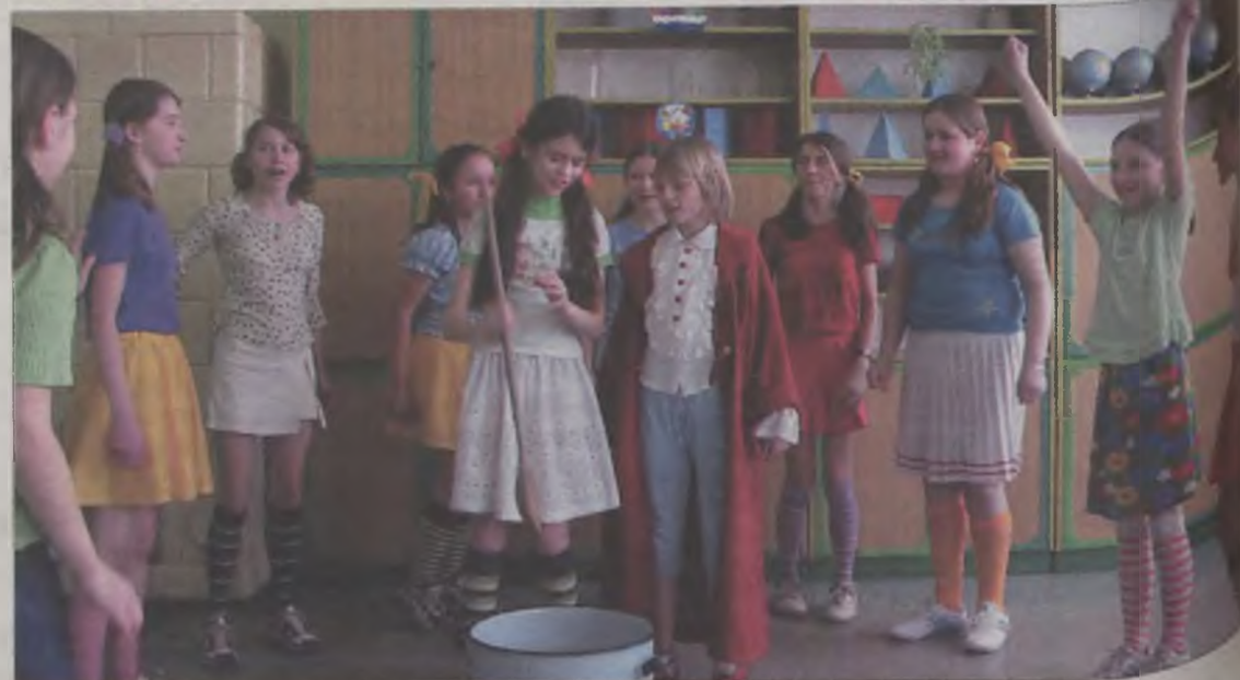
W wielkim garze ucennice gotowały potrawę według „przepisu na szkołę”.

Za tę pomoc dzieci ze Szkolnego Kółka Teatralnego podziękowały w części artystycznej, w której można było zobaczyć przedstawienie pod tytułem „Przepis na szkołę”. IŁ