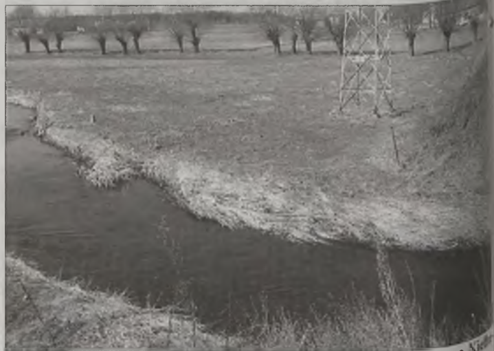
Po trzech dniach poszukiwań zaginioną znaleziono w rzeczce Kiełbasce w Bratuszynie (gmina Brudzew).

pomoc do jasnowidza. On stwierdził, że widzi ciało kobiety i naszkicował mapkę okolicy, w której ono znajdować. 28 marca rodzina znowu udała się do policji. We wskazanym miejscu wyruszyła ekipa, która natychmiast odnalazła ciało kobiety w Bratuszynie w rzeczce Kiełbasce, która na tym odcinku wchodziła około półtora metra głębokości. Wcześniej nikt jej tam nie widział. Sekcja zwłok wykazała, że przyczyną śmierci było utonięcie. Klucza się udział innych osób w wypadku. 67-letnia kobieta spadła z skarpy przy drodze i spadła ze skarpy przyprost do wody.