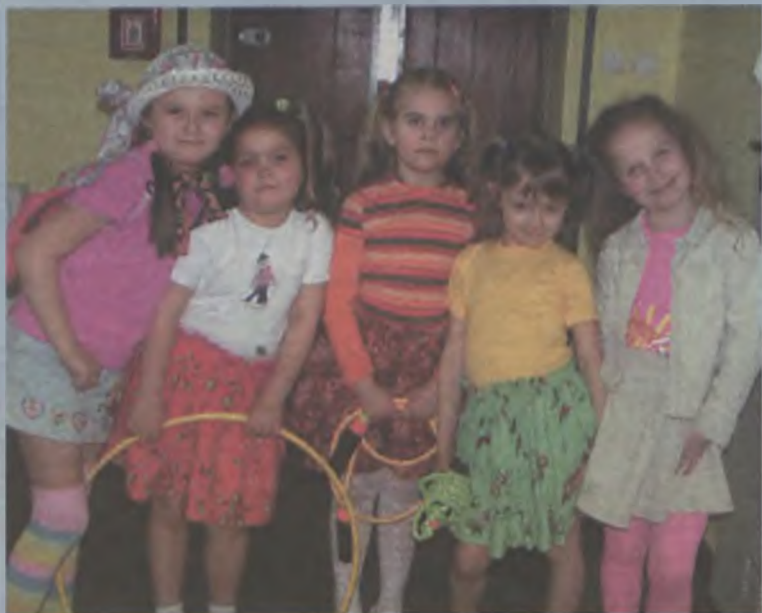
...i z Przedszkola Samorządowego nr 4 w Turku.