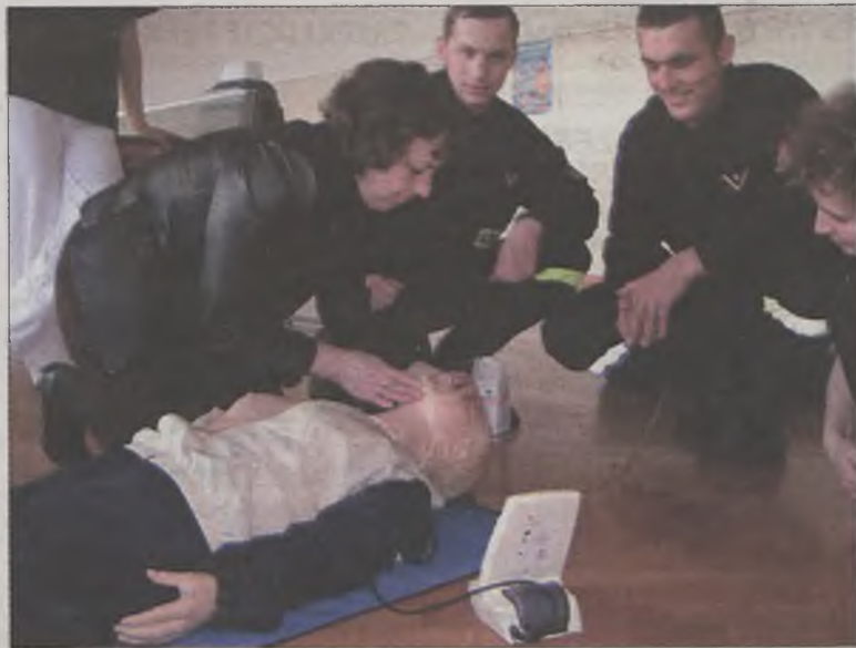
Podstaw pierwszej pomocy przedmedycznej panie uczyły się od strażaków – ratowników.

Uczestniczki szkolenia pod nazwą BEZPIECZNA KOBIETA w ubiegłym tygodniu wzięły udział w lekcji podstaw pierwszej pomocy przedmedycznej i w kolejnych zajęciach z samoobrony.