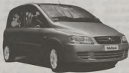
NOWY FIAT MULTIPLA