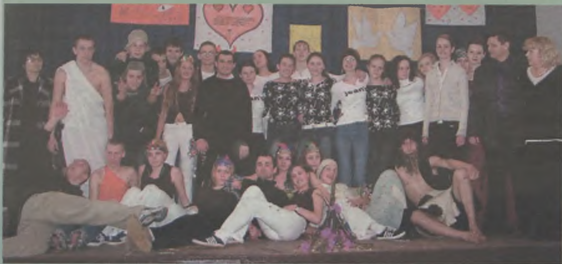
Wykonawcy z przygotowującymi ich nauczycielami.