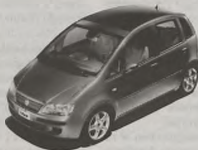
NOWY FIAT IDEA