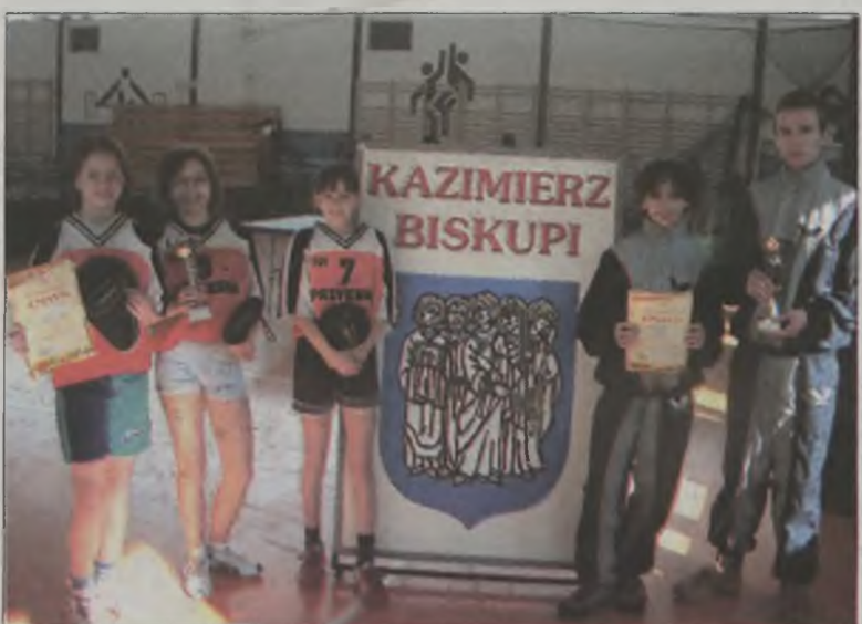
Wicemistrzowskie drużyny z powiatu tureckiego.

W gronie gimnazjalistek, reprezentujące nasz powiat dziewczęta z Brudzewa zajęły piąte miejsce. Natomiast w samym miejscu zakończyli zawody chłopcy ze Szkoły Podstawowej nr 4 w Turku. (can)