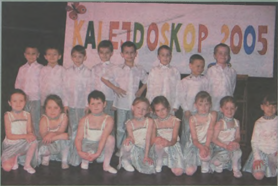
Przedшкоlaki z Brudzewa podczas konkursu zdobyły wyróżnienie z tańca.

przedszkoli byłego województwa konińskiego. Mimo bardzo silnej konkurencji dzieci z przedшкоla w Brudzewie zdobyły wyróżnienie za profesjonalne i bardzo eleganckie wykonanie układu tanecznego do muzyki Jamesa Lasta. Nagrodą dla przedшкоlaków były pamiątkowe dyplomy, gra dydaktyczna i komplet klocków Lego. IŁ