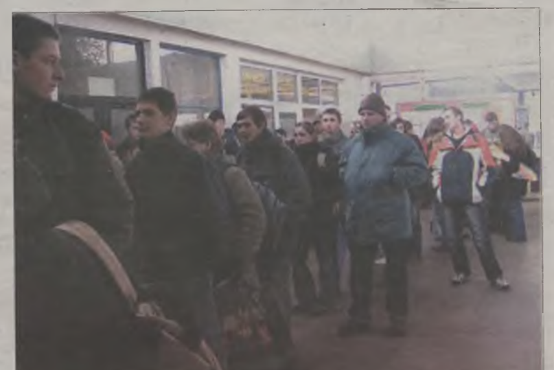
Z usług turkowskiego PKS najczęściej korzysta młodzież szkolna i studenci.