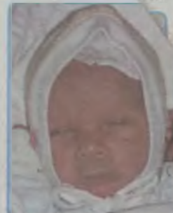
... Kasper syn Wioletty i Mariusza ur. 2 marca, godz. 8.35 wazył 2400g, mierzył 49cm