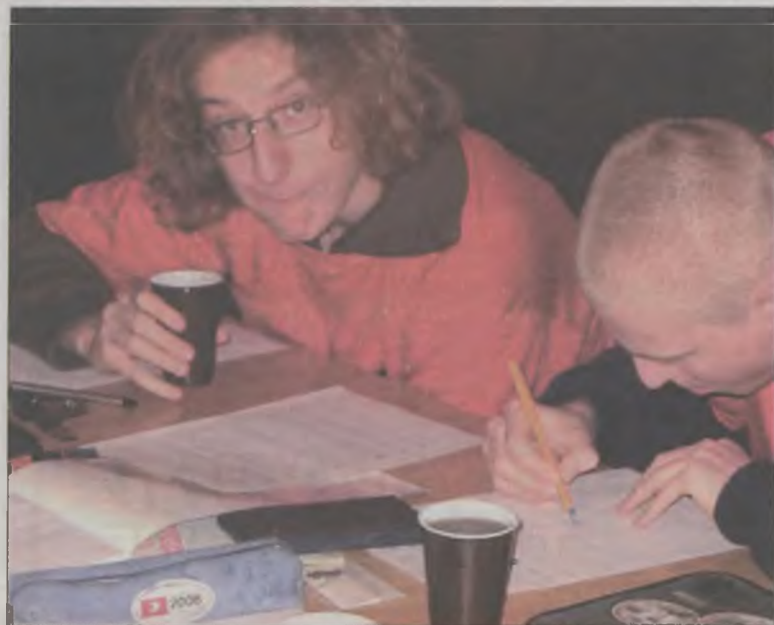
Kawa i liczymy dalej, tylko jak to było...

Już po raz szósty w auli turkowskiego „Ogólniaka” odbył się Ogólnopolski Maraton Matematyczny. Patronat honorowy nad maratonem objęli dziekan Wydziału Matematyki i Informatyki Uniwersytetu im. Adama Mickiewicza w Poznaniu oraz dziekan Wydziału Matematyki Uniwersytetu Łódzkiego. Do obu uczelni, co roku z turkowskiej alma mater wędrują jej absolwenci.