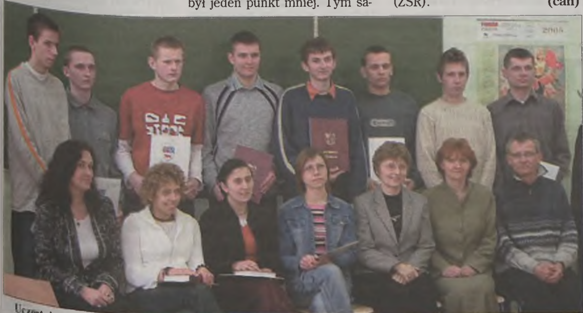
Uczestnicy konkursu ze swoimi opiekunami.