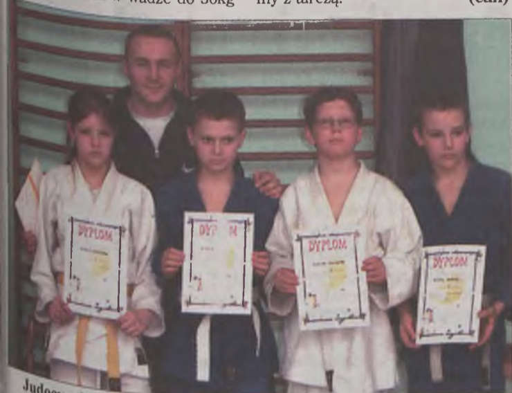
Judocy z Brudzewa zdobyli kolejne medale.

-Tak dobre wyniki - mówi trener Kujawa - zawodnicy zawdzięczają dobremu przygotowaniu podczas obozów sportowych, które odbyły się w ferie. Kolejne ważne starty w najbliższym czasie to Międzynarodowy Turniej Judo w Kaczorach oraz eliminacje do Mistrzostw Polski Juniorów i juniorów młodszych w Poznaniu. Liczę, że i z stamtąd wrócimy z tarczą. (can)