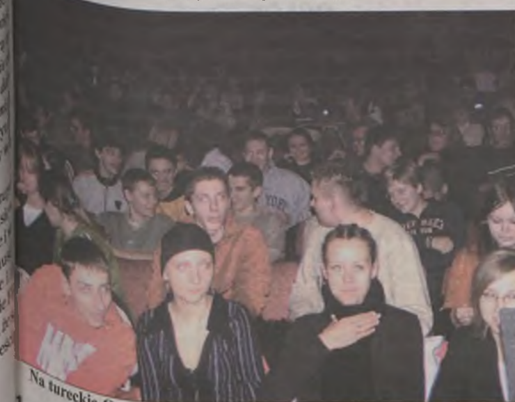
Na tureckie Oscary przyszło około trzysta osób. 2 marca 2005 r.