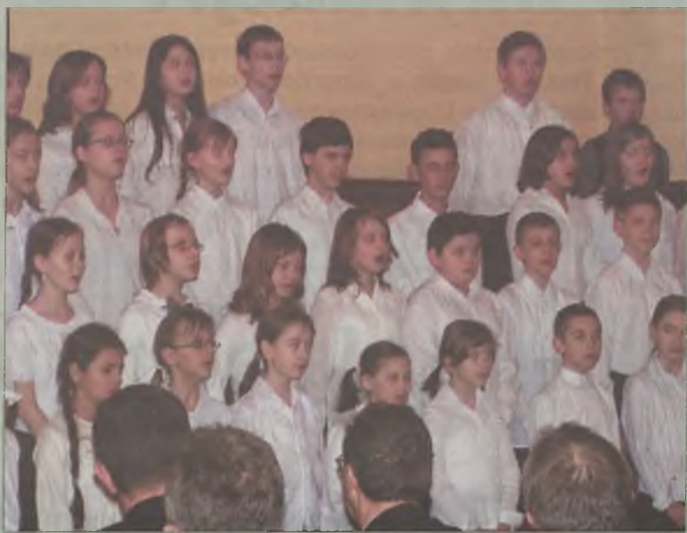
Jako pierwszy zaprezentował się chór szkolny, który wykonał utwory „Muszelka” i „Wianki” z repertuaru Lutosławskiego.