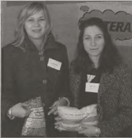
Rozdawanie żywności rozpoczęło się już od ósmej rano i trwało przez 10 godzin, aż do godziny 18.00.

tym razem firmie "Sintur", która bezpłatnie przywiozła z Konina unijną żywność. MJ