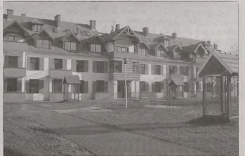
Nowiutki blok we Wrocławiu w dzielnicy Klecina (cena za metr kwadratowy – 3.100 zł). Jak go porównać z kilkudziesięcioletnimi blokami w Turku?

wysokości opłat na pokrycie kosztów eksploatacji budynku, wrocławski zarządca wprowadził zapis, że w przypadku zmiany cen przez dostawców lub usługobiorców ustalona zaliczka podlegać będzie zwiększeniu do 20 proc. bez konieczności podejmowania kolejnej uchwa-