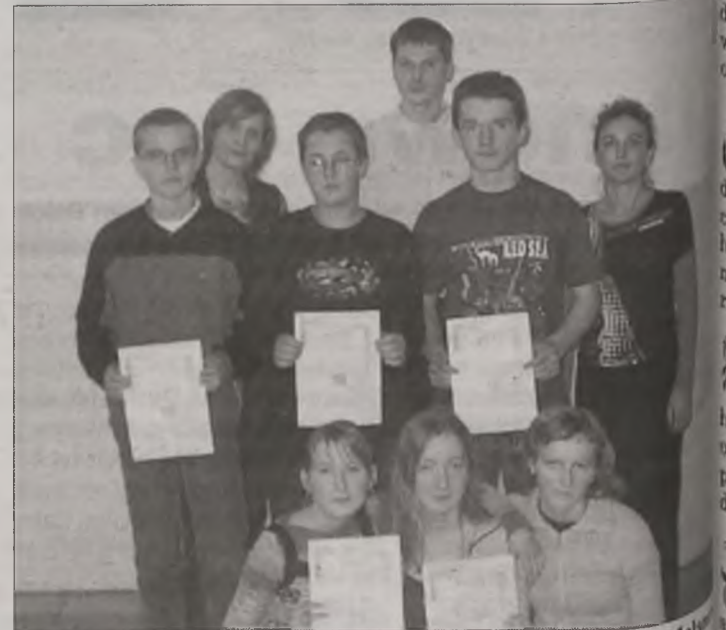
Najlepsi uczestnicy warcabowych zmagani w Gimnazjum w Malanowie

Rewanż z KKS-em został zaplanowany na środę, 2 marca. Natomiast w sobotę, 5 marca, ostatnim rywalem Tura przed ligową inauguracją rundy wiosennej będzie prawdopodobnie Wisła Płock. Do obu spotkań ma dojść w Płocku na boisku ze sztucznej murawą. (wk)