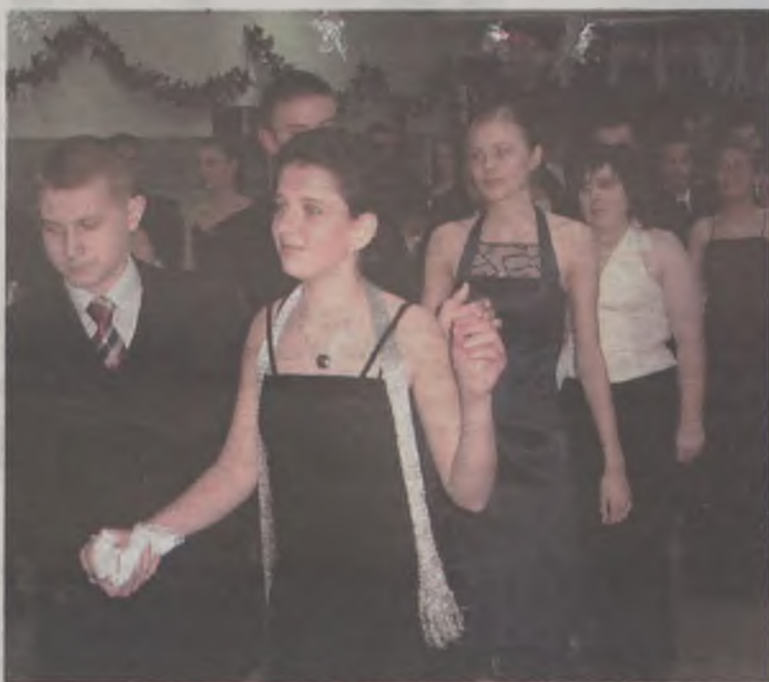
Bal tradycyjnie rozpoczęto polonezem.

Po części oficjalnej rozpoczęła się zabawa, która trwała do półno-cy. Posiłek dla uczestników balu przygotowali rodzice gimnazjali-stów, którzy podawali do stołu i po-dziwiali swoje dzieci.