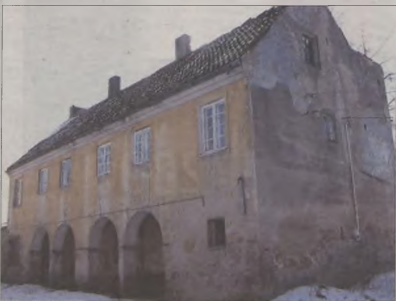
Ruina pałacyku w Kolnicy wreszcie przestanie straszyć.