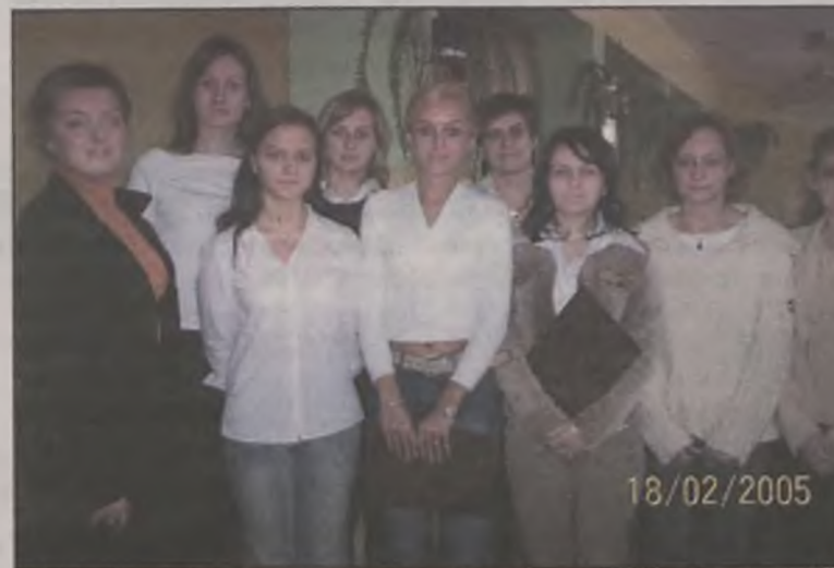
W Zespole Szkół Technicznych dyskutowano nie tylko o odżywianiu się zimą. 18/02/2005