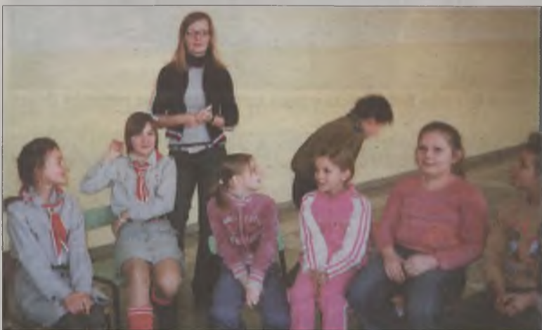
Tegoroczne ferie w turkowskich szkołach przygotowali młodzi harcerze z Liceum Ogólnokształcącego.

Podobną akcję przeprowadzono w czasie ferii we Władysławowie. Tam kadra instruktorska zaprosiła swoich harcerzy na biwak. Obóz rozbito w Zespole Szkół. Zimowiska trwały pięć dni, w czasie których zorganizowano warsztaty harcerskie, gdzie można było szlifować umiejętności, a także zdobywać nowe sprawności. ika