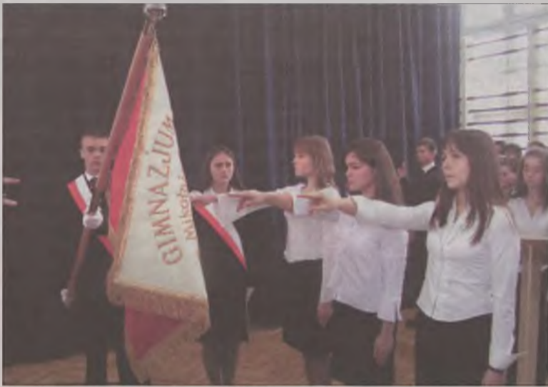
Na sztandar szkoły po raz pierwszy przysięgę złożyli reprezentanci klas pierwszych, drugich i trzecich.

Podsumowaniem części oficjalnej było wpięcie imiennych tarcz w pamiątkową tablicę. Ta niezwykle cenna pamiątka zostanie umieszczona w gablocie, w holu głównym szkoły obok sztandaru. Miłym zakończeniem imprezy był występ gimnazjalistów, którzy przygotowali część artystyczną o... Mikołaju Koperniku. MJ