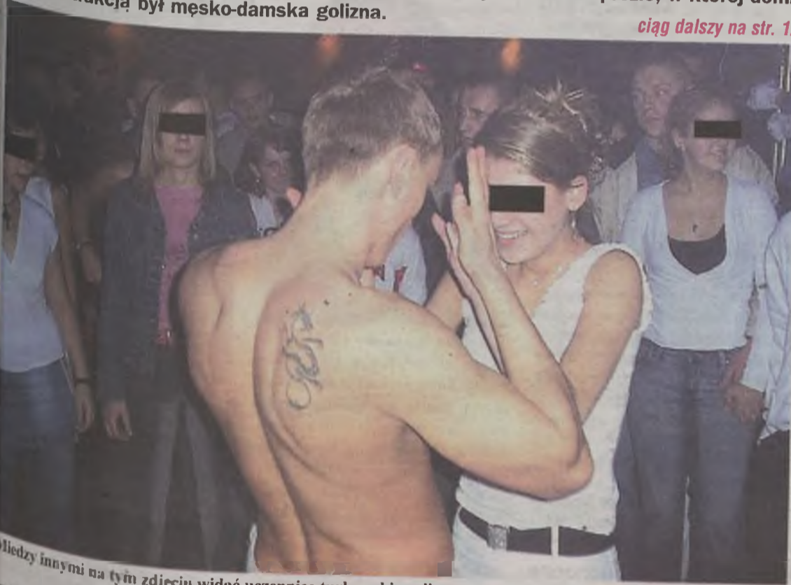
Między innymi na tym zdjęciu widać uczennice tureckiego liceum, przyglądające się półnagiemu mężczyźnie.