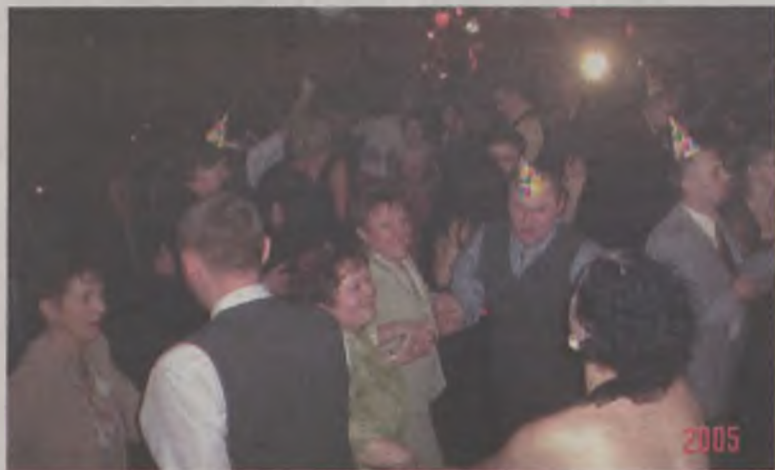
Dochód z tego balu przeznaczony zostanie m.in. na potrzeby dzieci.

Organizatorzy dziękują wszyst-kim, którzy pomogli z organizo-waniu balu.