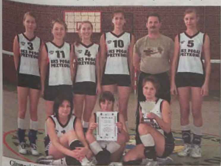
Gimnazjalistki z Przykony obroniły tytuł mistrzyni powiatu tureckiego.