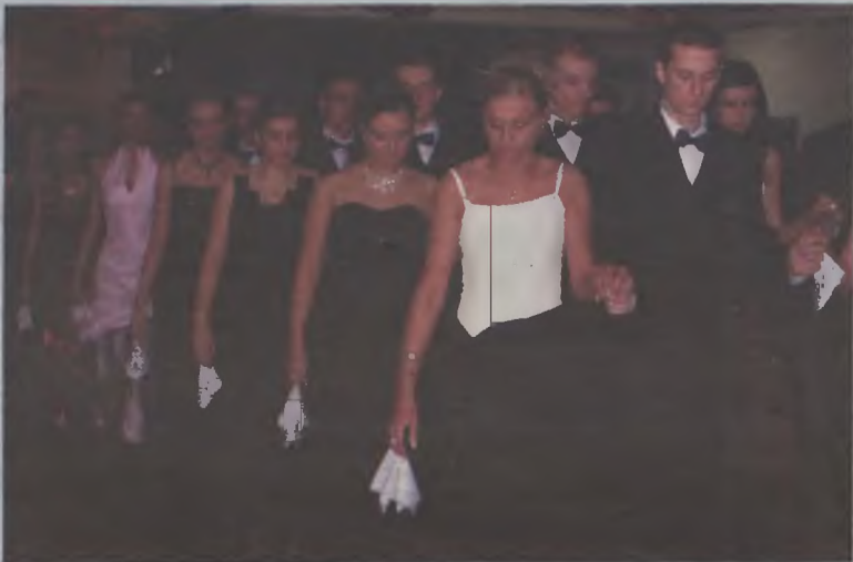
Przez dwa miesiące maturzyści uczyli się skomplikowanych układów poloneza.