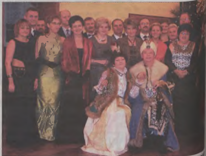
Wszyscy balowicze chętnie fotografowali się z kasztelanką i magnatem.