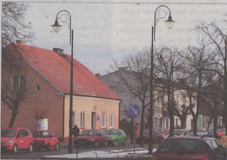
Nowe lampy na Kaliskiej sprawiają, że mamy wrażenie, jakbyśmy poruszali się po ulicy w czasach pierwszej połowy XX wieku.

Dotychczas ulica Kaliska, nazywana najbardziej reprezentatywną ulicą w mieście, oświetlana była przez lampy pamiętające wczesne lata siedemdziesiąte. Betonowe słupy nie tylko nie wyglądały estetycznie, ale często były w nie najlepszym stanie