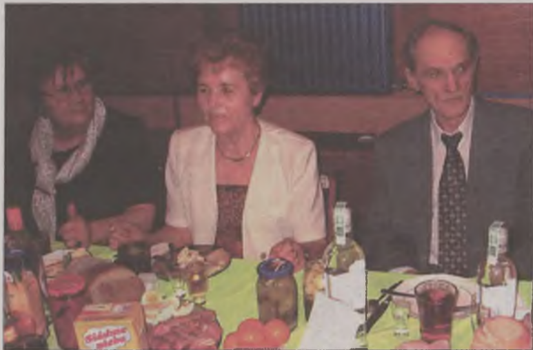
W przerwach między tańcami był czas na małe przekąski.

W sobotni wieczór, 29 stycznia w Miejskim Domu Kultury w Turku odbył się bal nestorów, zorganizowany przez turkowskie Związki Emerytów, Rencistów i Inwalidów.