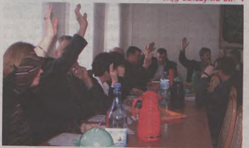
Tym razem radni jednomyślnie zdecydowali o pozostawieniu najmłodszych dzieci w Krwonach.

“SPOŁEM” PSS w TURKU dziękuje Panu PIOTROWI BASZKOWSKIEMU