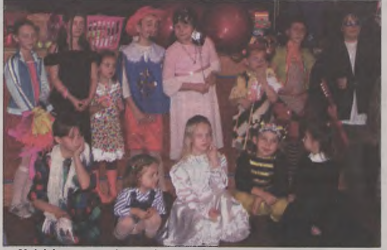
Najciekawsze stroje zostały nagrodzone przez komisję konkursową, w której m.in. znaleźli się rodzice.

To hasło przewodnie corocznego balu dla najmłodszych zorganizowanego przez Miejski Dom Kultury w Turku. Impreza dla małych balowiczów odbyła się w ostatnią sobotę karnawału, 5 lutego.