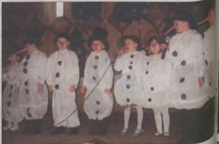
Na scenie wystąpiła grupa śpiewających balwanków.

szkoły Komitet Rodzicielski ufundował posiłek oraz paczki ze słodyczkami. Do późnego wieczora dzieciaki bawiły się przy muzyce