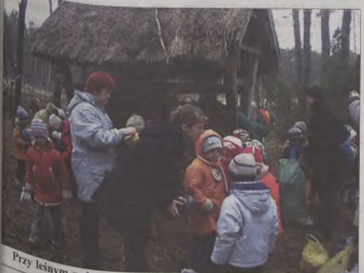
Przy leśnym paśniku.