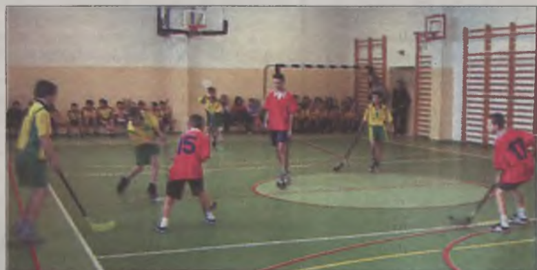
Rozgrywki były wyjątkowo ciekawe.