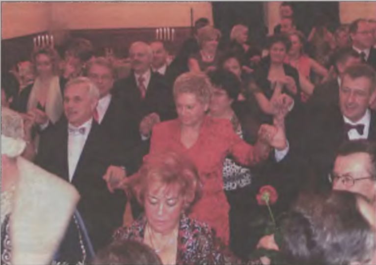
Dziewiąty Bal Absolwenta tradycyjnie rozpoczął się od wspólnego poloneza.

1000 złotych. Poza tym tradycyjnie już odbyła się loteria fantowa, w której znalazło się aż 250 losów. Tylko nieliczne były puste, a te trafione zawierały mnóstwo ciekawych gadżetów o bardzo różnorodnej tematyce: od ubrań i ozdób poprzez biżuterię, zabiegi poprawiające urodę i zdrowie, ozdoby do mieszkania i ogrodu, książki, płyty i wiele innych, na uciechę każdego gustu. Pomysłem organizatorów była niespodzianka sprawiona parze absolwentów, którzy poznali się w