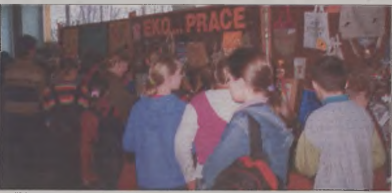
Wystawa cieszyła się dużym zainteresowaniem zarówno wśród dzieci, jak i dorosłych.

czyli powtórnego wykorzystania odpadów. Cała akcja promocyjna została przeprowadzona podczas szkol-