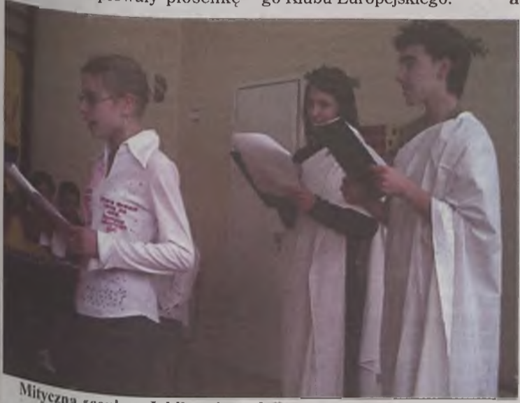
Mityczna scenka „Jabłko niezgody”.