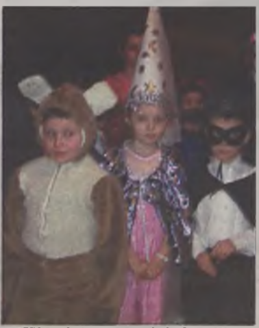
W baśniowej krainie bawili się bohaterowie popularnych bajek.

nice, koty. Byli też Indianie, muzyk rockowy i garbata babcia, która pomimo podeszłego wieku królowała na parkiecie. Przy największych przebojach wszyscy wspólnie się bawili, brali udział w grach i zabawach. Jak na bal przystało wybrano króla i królową balu oraz nagrodzono najładniej przebrane dzieci, które w nagrodę otrzymały upominki i dyplomy. MJ