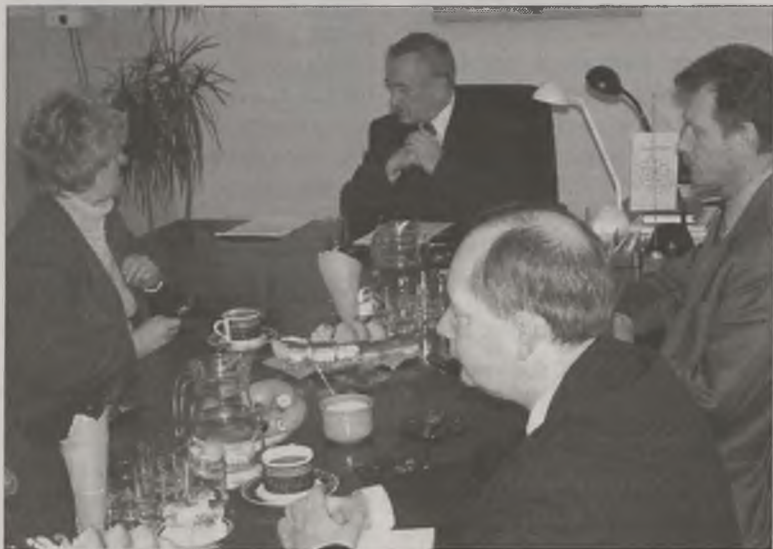
Uczestnicy spotkania w trakcie rozmów.

rzecznik prasowy Starostwa Powiatowego w Turku