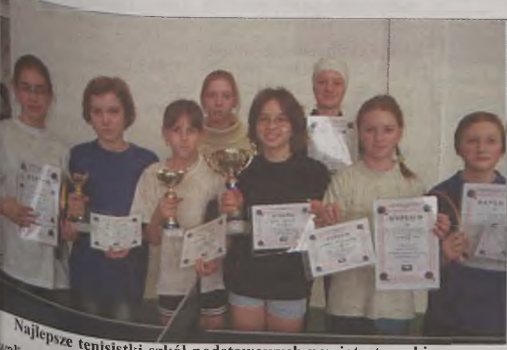
Najlepsze tenisistki szkół podstawowych powiatu tureckiego.

Na hali Zespołu Szkół w Przykonie odbyły się Drużynowe Mistrzostwa Powiatu Szkół Podstawowych w tenisie stołowym dziewcząt. Wystartowało w nich 15 drużyn. Bezkonkurencyjne okazały się dwie drużyny gospodarzy, które sięgnęły po dwa najwyższe laury.