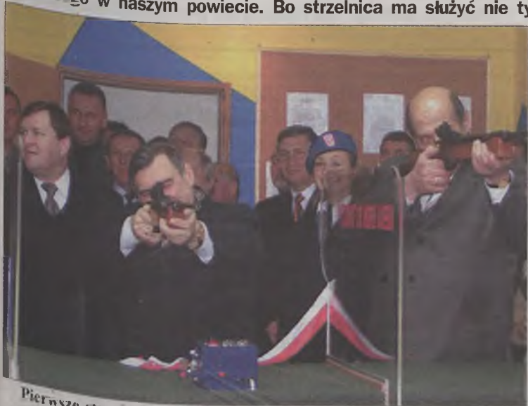
Pierwsze strzały w nowej strzelnicy.

W Turku otwarta została pierwsza strzelnica sportowa. Jej gospodarzem jest Zarząd Powiatowej Ligi Obrony Kraju, który ma nadzieję, że miejsce to przyczyni się m.in. do rozwoju strzelectwa sportowego w naszym powiecie. Bo strzelnica ma służyć nie tylko członkom tej organizacji.