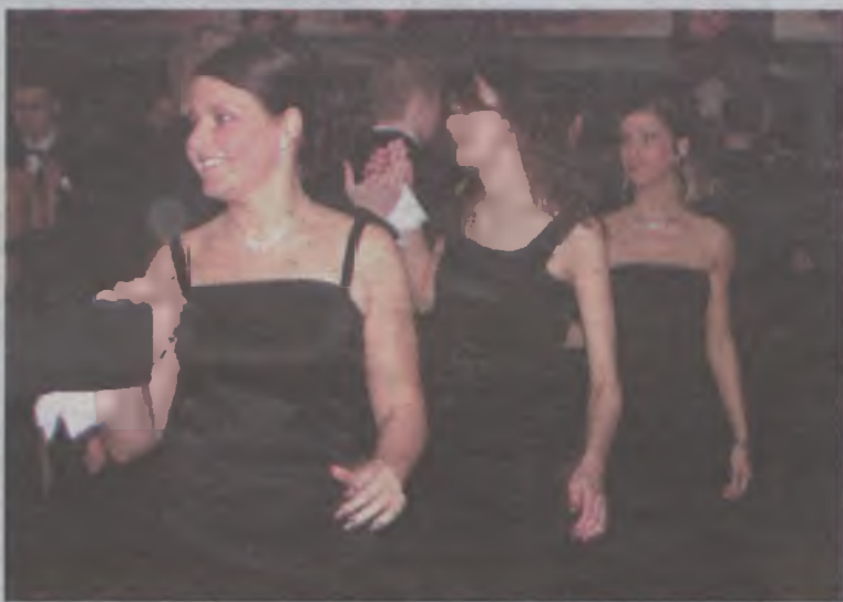
Obowiązkowi tańczący poloneza musieli być ubrani na czarno.

„Stoimy tu u kresu naszej nauki w liceum. Niejednemu z nas na pewno zakręci się w oku łza. Czas jednak jest nieublagany i wszystko kiedyś się kończy. Poczujemy się tym, iż jeszcze sto najbliższych dni, które dzielą nas od matury, przeżyjemy razem z naszymi szkolnymi przyjaciółmi. Cieszymy się przede