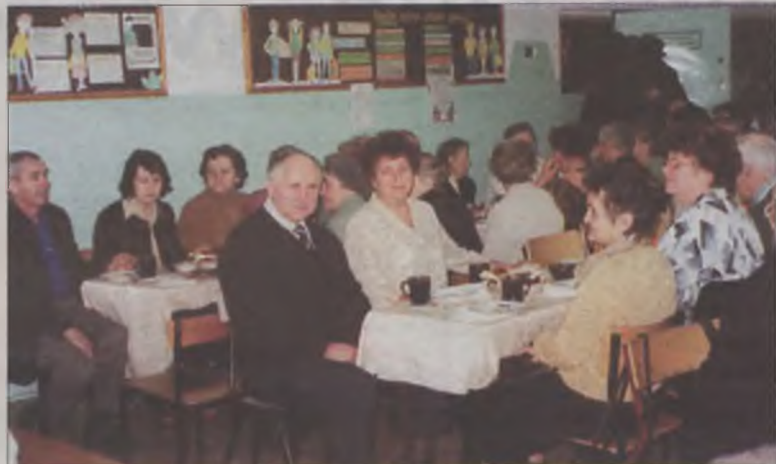
Babcie i dziadkowie podczas słodkiego poczęstunku.

Niech od Bałtyku aż do stożka Tatr, żyją nam Babcie i Dziadkowie sto lat - pod takim hasłem odbyła się uroczysta akademicka Szkoła Podstawowej w Kaczkach Średnich, której organizatorami byli uczniowie klas 0-VI oraz ich opiekunowie.