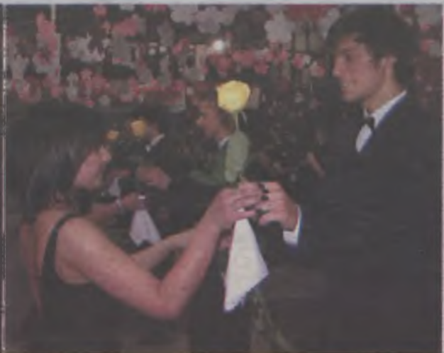
Chłopcy swoim partnerkom w tańcu podarowali żółtą różę.