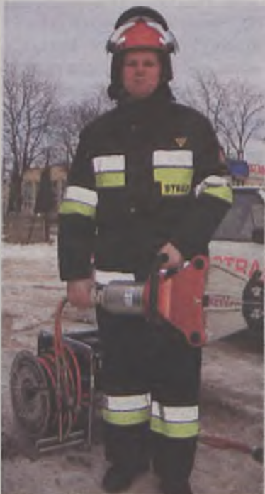
Praca w straży nie jest lekka. Takim ważącym 15 kilogramów rozpięrkami teleskopowymi strażak musi operować czasem około godziny.