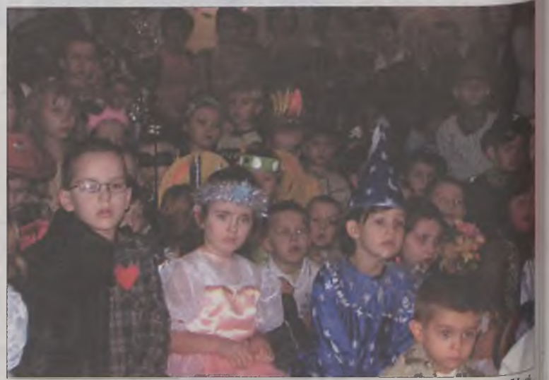
Podczas przedstawienia dzieci z zainteresowaniem śledziły losy Królewny Śnieżki, głośno przestrzegając ją przed złą królową.