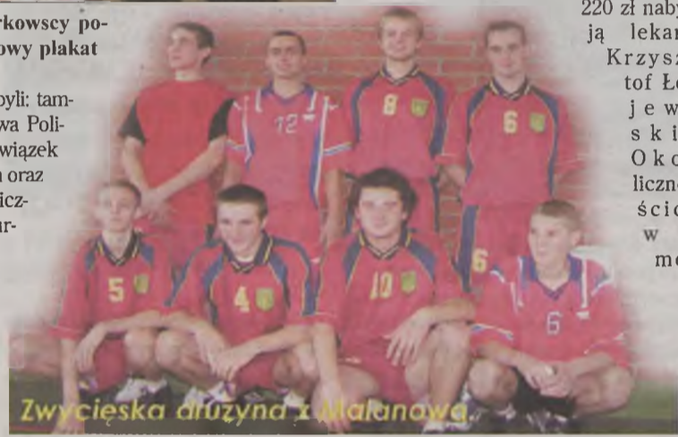
Zwycięska drużyna z Malanowa

nazystki z UKS „Pegaz” i zawodnicy klubu „Teleszyna”). Zespoły rozlosowano do dwóch grup. Po meczach eliminacyjnych w grupach kolejność była następująca: A - 1. Policja, 2. Przykona nauczyciele, 3. Przykona „Teleszyna”; B - 1. Malanów, 2. Kawęczyn, 3. Przykona „Pegaz”. O pierwsze miejsce walczyli malanowianie i policjanci. Wygrali ci pierwsi z wynikiem 2:0. Kolejne miejsca w turnieju zajęli: 2. Policja, 3. Kawęczyn, 4. Nauczyciele Zespołu Szkół w Przykonia, 5. UKS „Pegaz” Przykona, 6. „Teleszyna” Przykona. W międzyczasie odbywały się licytacje gadżetów. Były to figurki i świeczniki z masy solnej oraz malunki na szkle - prace chorych dzieci leczonych na oddziale dziecięcym turkowskiego szpitala. Ponadto można było kupić wiele innych przedmiotów, takich jak kalendarze promujące gminę Przykona, koszulki, zegary, obrazy olejne na płótnie wykonane przez dzieci z kółka działającego przy Ośrodku Upowszechniania Kultury w Przykonia czy policyjną maskotkę o nazwie „Pyrek”, którą za 300 zł nabyli Dorota i Krzysztof Brzęccy. Dużym powodzeniem cieszyła się czapka niemieckiego policjanta z kolekcji Jana Krauze, zastępcy komendanta powiatowego policji w Turku. Za 220 zł nabył ją lekarz Krzysztof Łojewski. Okolicznościowo