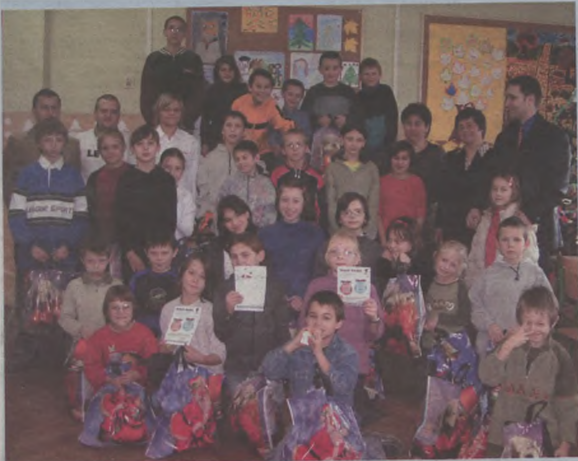
Radość ze słodkich prezentów była ogromna.