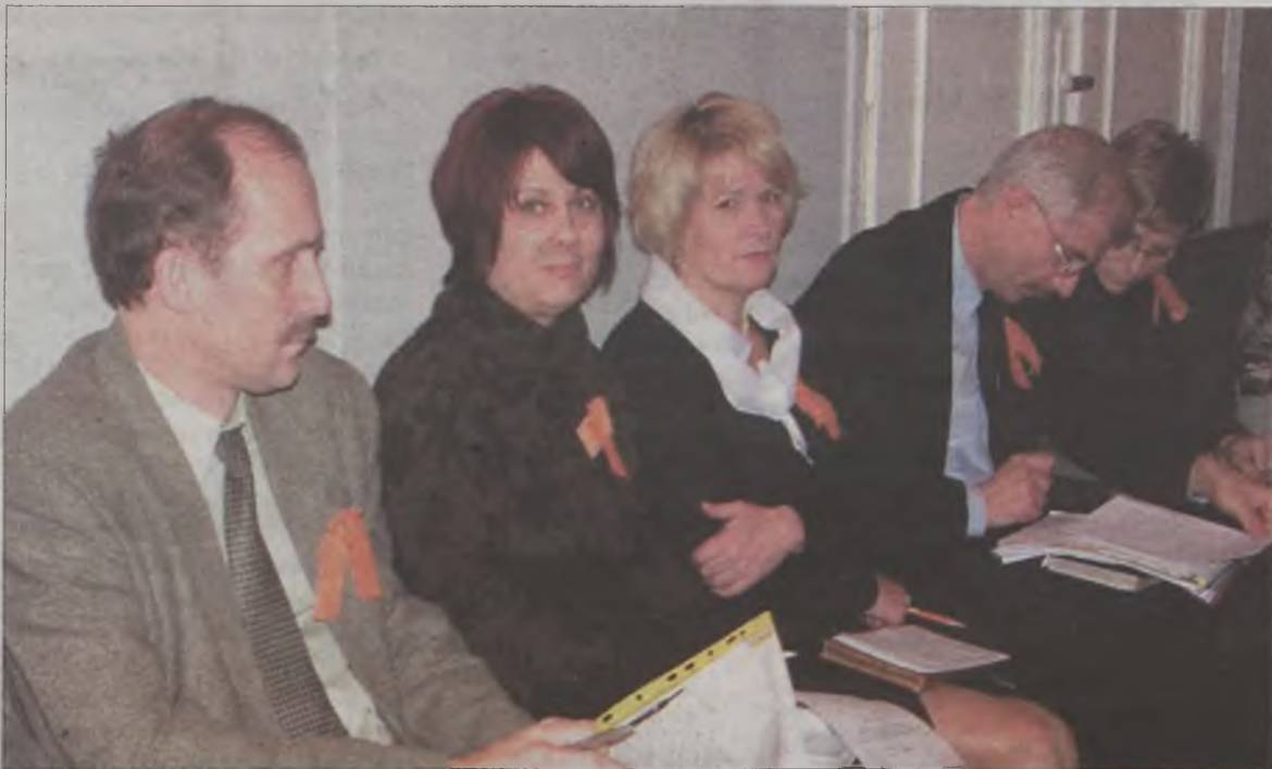
Zarówno radni, jak i urzędnicy miejscy manifestowali swoje poparcie dla wolnej Ukrainy.

Należy również odnotować również akt symbolicznego poparcia „pomarańczowej rewolucji” trwającej na Ukrainie okazanego przez turkowskich samorządowców. Turkowscy radni i samorządowi urzędnicy uczestniczyli w sesji przystojęni w symboliczne wstążki w pomarańczowych barwach. Powyższa postawa jest swoistym triumfem polityki: myśl globalnie, działaj lokalnie. Przypięte przez radnych pomarańczowe wstążki znakomicie ilustrowały banalną prawdę, że zarówno Turcy, jak Ukraina i oczywiście Polska leżą w Europie Środkowej. AJ