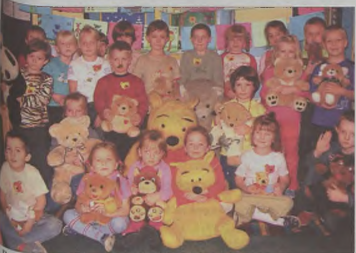
Przedszkolaki z „Trójki” i ich ulubione przytulanki.

Przez cały tydzień dzieci uczestniczyły w rozmaitych atrakcjach, które miały im przybliżyć postać pluszowej zabawki i pozwoliły się z nią zaprzyjaźnić. W salkach przygotowano kąciki pluszowego misia, w którym zamieszkały ulubione przytulanki przedszkolaków. Dzieci uczyły się misiowych piosenek i wierszyków oraz robiły specjalne misiowe przysmaki, kierując się własnymi pomysłami.