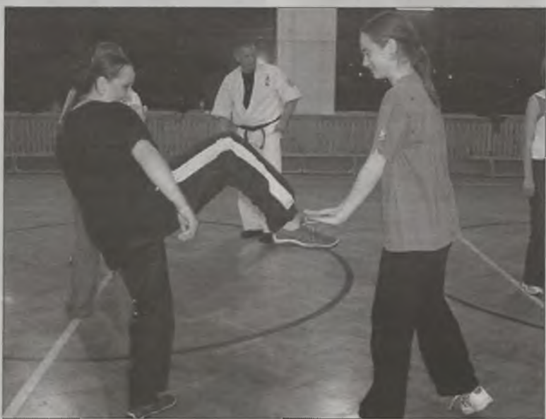
Kobiety rozpoczęły nietłatą naukę samoobrony.

W tej części szkolenia, trwającej przez kilka tygodni, panie będą uczyły się przyjmowania postawy obronnej, wykorzystywania w samoobronie czułych punktów w napastnika, odpierania ciosów i odpierania ciosów i jeszcze kilku innych ważnych technik. W toku ćwiczeń samoobrony panie będą