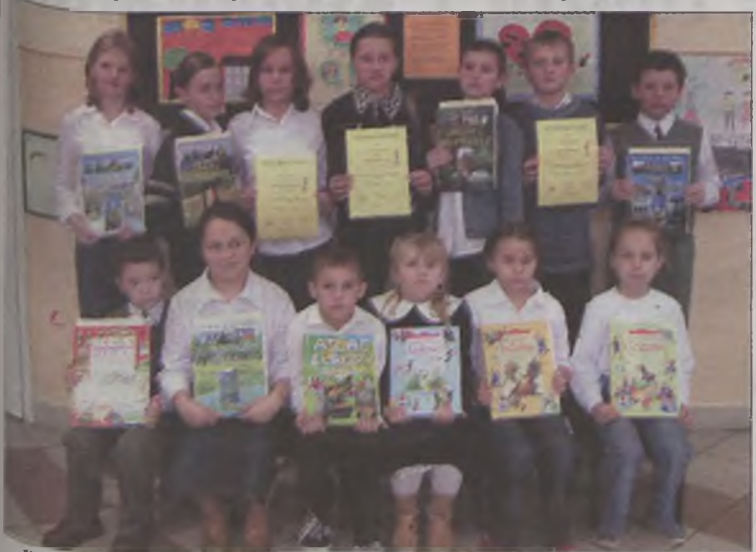
Dzieciaki nagrodzone i wyróżnione w konkursie.

„Tato, mamie nie pal!” to tytuł V edycji gminnego konkursu o tematyce antynikotynowej zorganizowanego przez szkolne koło PCK w Skarżynie. Podsumowanie jubileuszowej już edycji odbyło się w środę, 24 listopada w Szkole Podstawowej w Skarżynie.