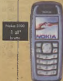
Nokia 3100 1 zł* brutto