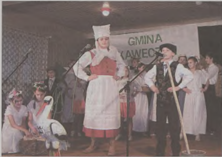
Dzieci z Kawęczyna pokazały, że ich gmina ma rolniczy charakter.

II Przegląd Dorobku Artystycznego Gmin Powiatu Tureckiego „Cudze chwalicie, swego nie znacie” odbył się 24 listopada w sali Ochotniczej Straży Pożarnej w Tuliszkowie.