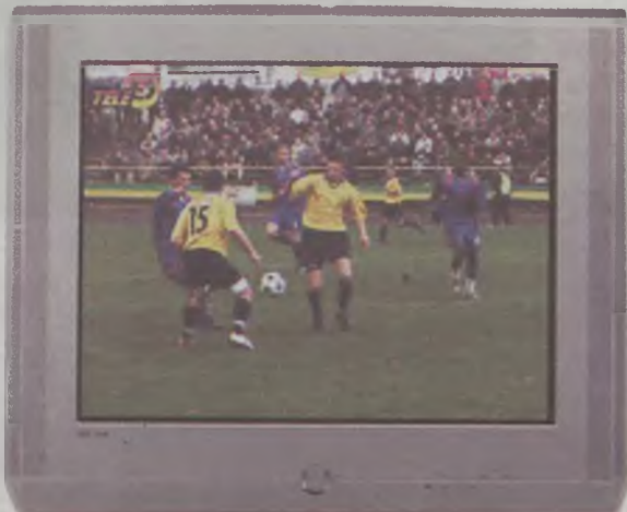
Być może rewanżowy mecz Tura z Toruńskim KP kibice z Turku będą mogli obejrzeć dzięki stacji Tele 5 na ekranach swoich telewizorów

je Kowalczyk. -Na początku byłyby to retransmisje, kto wie, może potem pojawiłyby się także relacje na żywo. Potrzebne są na to pieniądze, sponsorzy klubów z niższych lig na