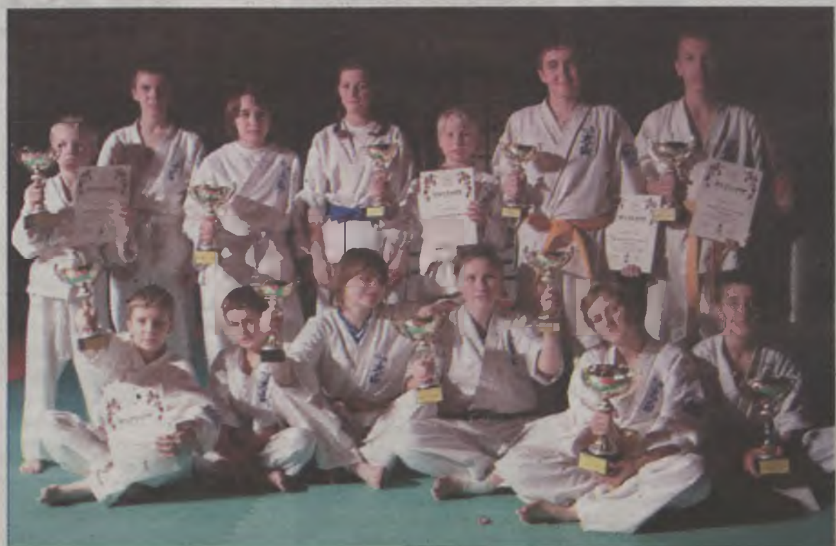
Zawodnicy Karate Oyama z naszego powiatu, którzy na mistrzostwach województwa zdobyli jedenastcie pucharów.