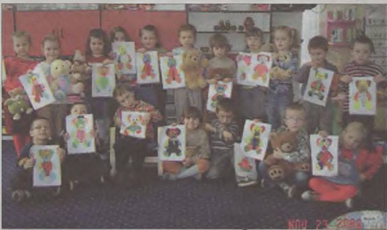
Nie łatwo było namalować pluszowego ulubieńca, ale przedszkolakom się udało.

Podsumowaniem pluszowego tygodnia była misiowa olimpiada sportowa, przygotowana przez nauczycieli i