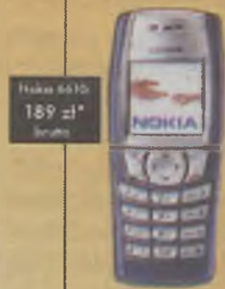
Nokia 6610 189 zł* brutto