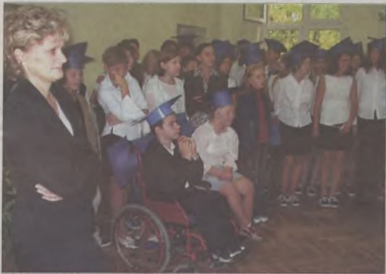
To już są prawdziwi gimnazjaliści.

Po zakończeniu uroczystości szkolnej uczniowie wraz z wychowawcami uczestniczyli w zorganizowanej specjalnie dla nich dyskotekie w Miejskim Domu Kultury. Wspaniała zabawa umożliwiła wszystkim lepsze poznanie się.