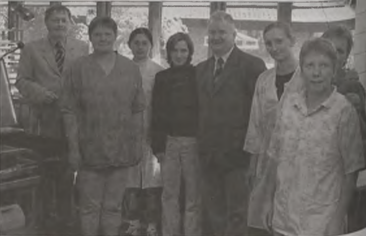
W trakcie wizytacji w jednej ze stołówek.

Także warsztaty kolejnej szkoły którą odwiedzili, wzbudziły podziw delegacji z Kaczek. Tak bogate i nowoczesne wyposażenie nie posiadają nawet te najbardziej renomowane warsztaty mechaniki pojazdowej w naszym powiecie.