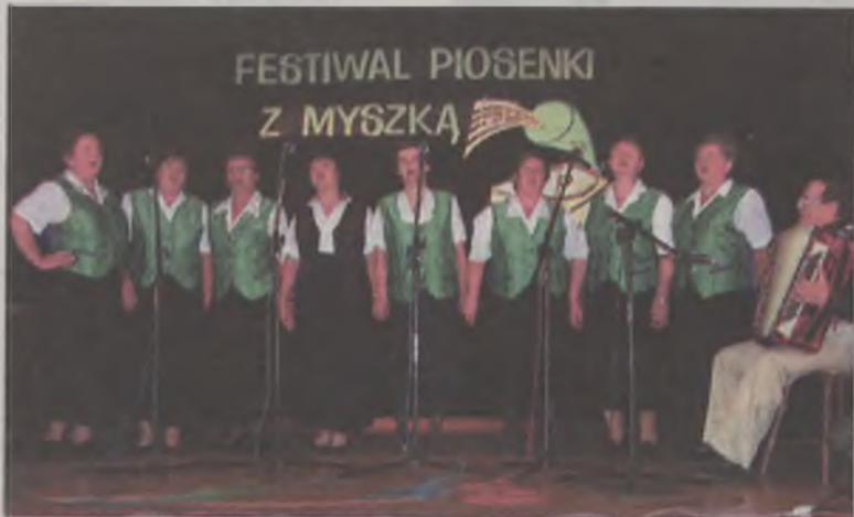
Zespół „Zgoda” ze Smulka był jedną z gwiazd wieczoru.

Moda na retro jest coraz bardziej popularna, nawet w dziedzinie muzyki, o czym świadczy „Festiwal piosenki z myszką” zorganizowany przez Miejski Dom Kultury w Turku. Podczas imprezy, która odbyła się w sobotę, 25 września usłyszeć można było największe przeboje lat 50 i 60, które niczym nie ustępują tym dzisiejszym.