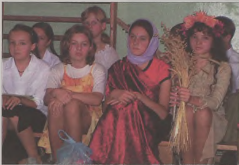
Oskarżeni i świadkowie w procesie nad cywilizacją.

właśnie okazję uczniowie klasy szóstej przygotowali „Sąd nad cywilizacją”. W tym szkolnym proce-