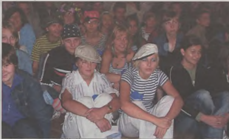
Neptun i jego dworzanie.