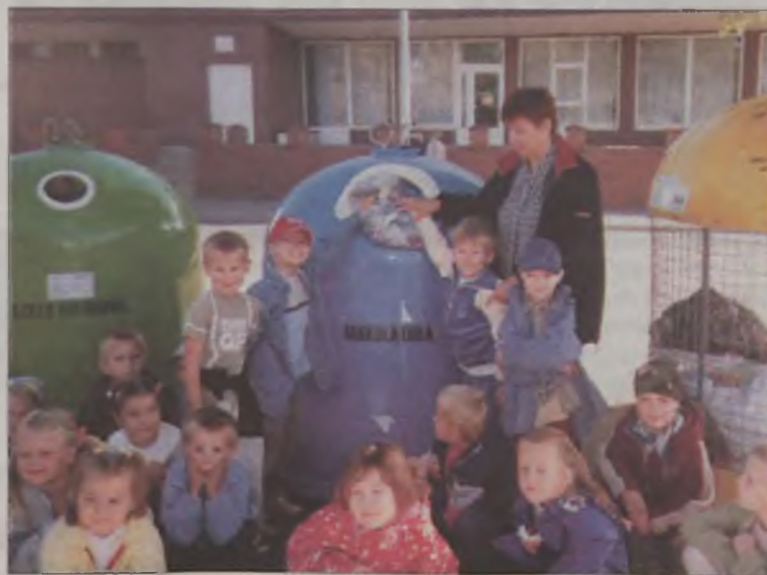
Dzieci nauczyły się segregacji odpadów.

Akcja miała na celu poprawę stanu środowiska przyrodniczego, zwrócenie uwagi najmłodszych turkowiaków na problemy czystości naszego miasta, zwłaszcza na konieczność ograniczenia ilości odpadów oraz ich właściwego składowania i przetwarzania. Przedszkolaki obiecały, że o czystość naszej planety i miasta będą dbały codziennie. AZ