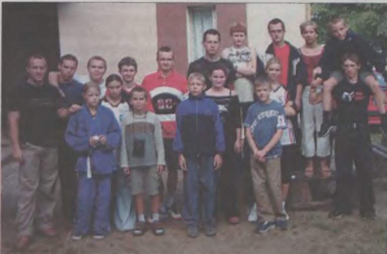
Mistrzowska ekipa ze swoim trenerem.

Kalendarz startowy brudzewskich judoków jest bardzo napięty. Jeszcze w tym miesiącu walczyć będą w Międzynarodowym Turnieju Judo w Trzciance, Eliminacjach Regionu III Juniorów Młodszych do OTK w Poznaniu, Turnieju Dzieci o Puchar Dyrektora SP w Poznaniu Dębica oraz Drużynowych Mistrzostwach Polski Juniorów młodszych w Bytomiu.