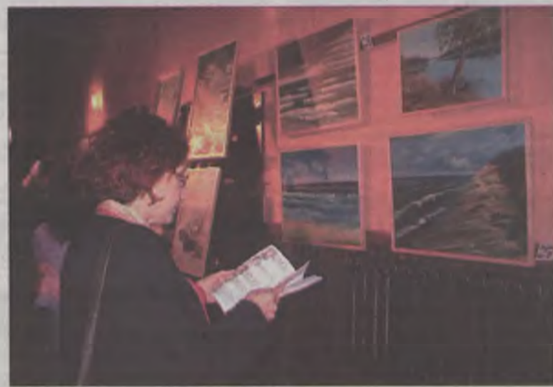
Z uwagą kontemplowano wystawione prace.

Wystawę można zwiedzać do 17 października w godzinach od 9.00 do 18.00. Istnieje również możliwość zakupu większości obrazów po umiarkowanych cenach. (can)