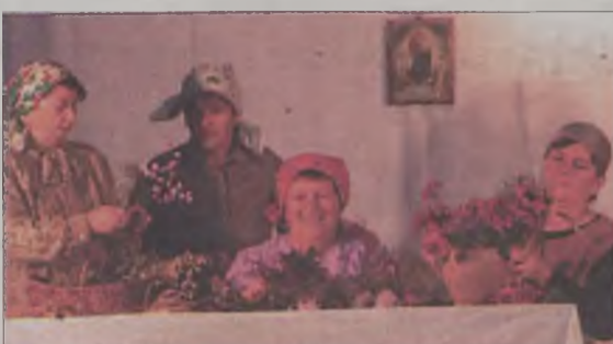
Klimat staropolskich czasów oddała nie tylko scenografia, ale także czasem niezrozumiała gwara i rozmaite wiejskie przysłówki.

Grzymiszewski teatr obrzędowy zapowiada kolejne spektakle nawiązujące do staropolskich obrzędów wiejskich. MJ