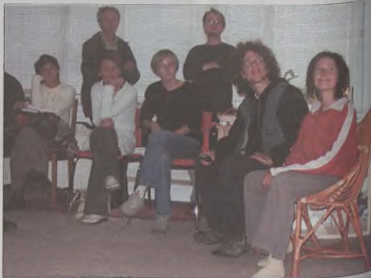
Autostopowicze opowiadali turkowanom o swojej podróży po świecie.