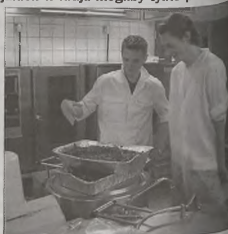
Chłopcy w kuchni czuli się prawdziwymi kucharzami.