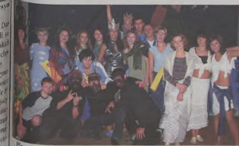
Pierwszaki ze spokojem oczekiwali kolejnych zadań.