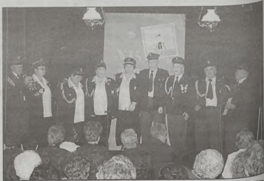
Tym razem władysławowski zespół „Wspomnienie” wystąpił z programem strażackim.

– Tu nie tylko występujemy, ale również spotykamy się, by porozmawiać, pośmiać się, pożartować. Większość z nas zna się nie tylko z tych spotkań we Władysławowie, ale również letniej imprezy dla klubów