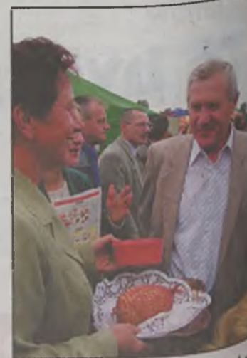
Uczestnicy festynu za drobna opłatą zgadywali wagę szynki. Drobna zwycięzcy była nagroda.