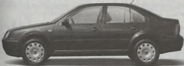
Bora rabat 7000 zł