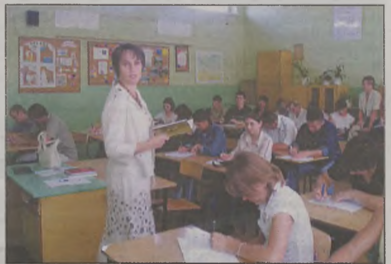
Na pierwsze lekcje przyszli wszyscy uczniowie.