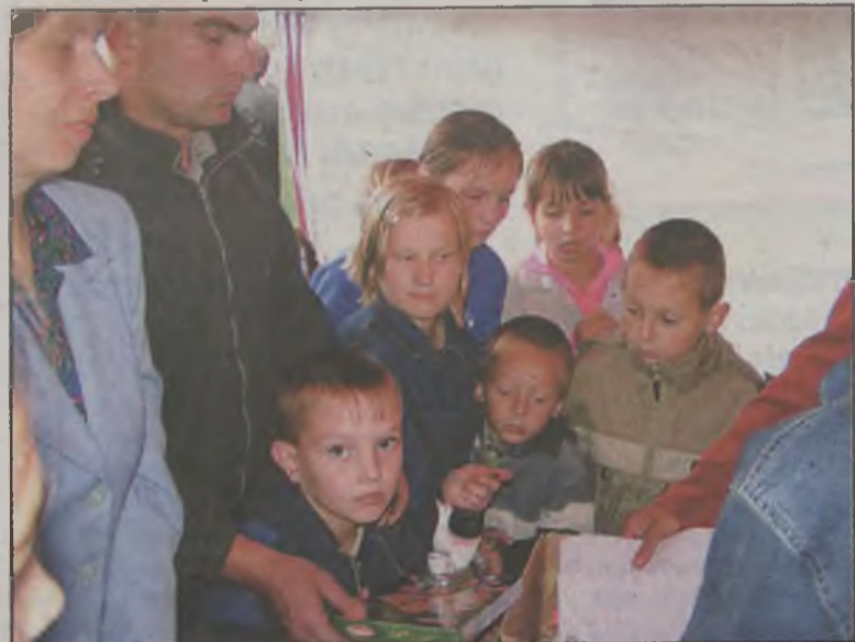
Największy tłok panował przy loterii fantowej.