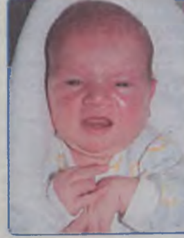
... Burdelak córka Elżbiety i Ryszarda ur. 8 września, godz. 11.00 wżyła 3440g, mierzyła 54cm