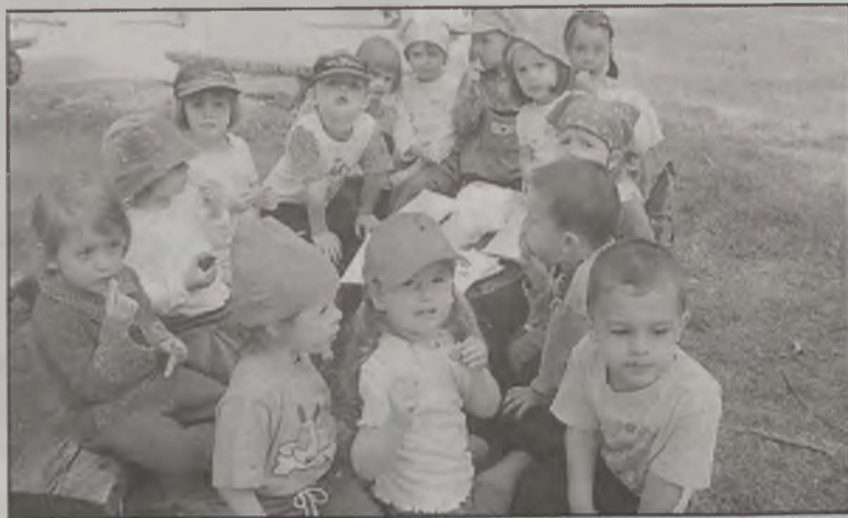
Trzylatki przez pierwsze tygodnie przyzwyczajają się do przedszkola. Później chciałyby tam chodzić nawet w weekendy.

Pamiętajmy, że każda zmiana w życiu człowieka przynosi ze sobą przeżycia radosne, ale czasami też smutne i że nie ma wyraźnego związku między przystosowaniem do nowego otoczenia a wiekiem dziecka. Czasami bywa tak, że 6-latek idąc po raz pierwszy do przedszkola rozpacza podobnie jak 3-latek, a mali uczniowie idąc do szkoły przeżywają podobne dramaty jak maluchy.