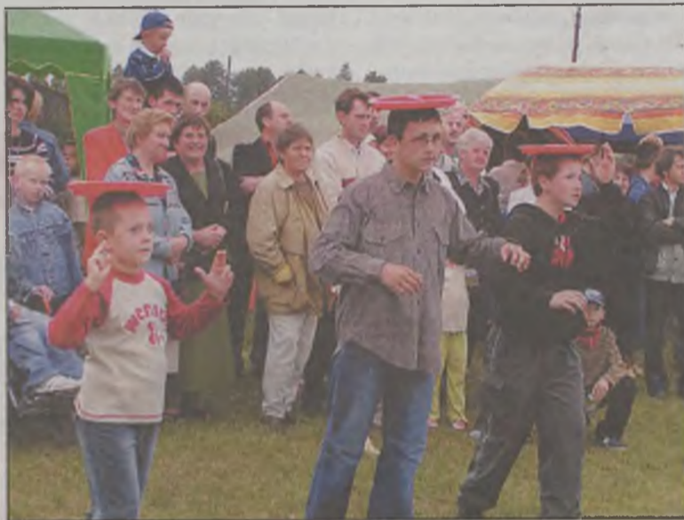
W wielu przygotowanych konkursach najważniejsza była sprawność i utrzymanie równowagi.

atrakcji w postaci nie tylko różnych stoisk, ale także konkurencji sprawnościowych. Było rodzinne przeciąganie liny, tatusiowie obierali ziemniaki i rywalizowali w kręceniu hula-hop. Z kolei mamusi skakały na skakankach i „sadziły ziemniaki” na czas. Konkursy prowadziły nauczycielki wychowania fizycznego przy pomocy rodziców. Równie ciekawe były konkurencje dla dzieci. Te m.in. biegały