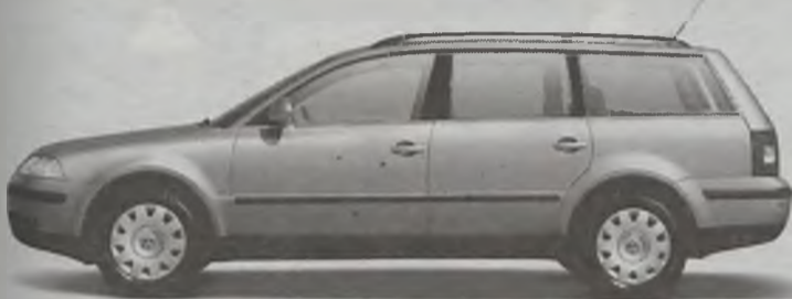
Passat Variant rabat 10 000 zł

Jeśli nie skorzystasz z naszej specjalnej oferty rabatowej, w każdej chwili możesz wybrać jeden z wielu atrakcyjnych sposobów sfinansowania zakupu Twojego Volkswagena, a pełen pakiet ubezpieczeniowy otrzymasz w cenie samochodu. Przyjdź do salonu. Skorzystaj z wyboru.