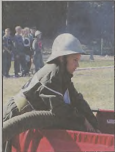
Kiedy jedni łączyli węże, inni pilnowali źródła wody.

Organizatorami zawodów była Komenda Powiatowa Państwowej Straży Pożarnej w Turku i Zarząd Powiatowy ZOSP RP w Turku. AZ