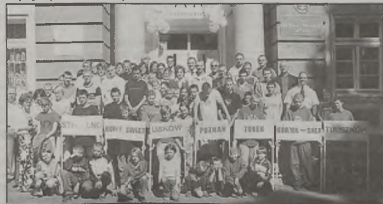
Do Turku przyjechali wychowankowie ośmiu domów dziecka.

Organizatorami mistrzostw byli: Dom dla dzieci i młodzieży w Turku, LOK w Turku i turkowska policja, a współorganizatorami: Urząd Marszałkowski w Poznaniu, Starostwo Powiatowe w Turku i Urząd Miejski w Turku. Organizatorzy dziękują wszystkim sponsorom zawodów za pomoc oraz wsparcie rzeczowe i finansowe. AZ