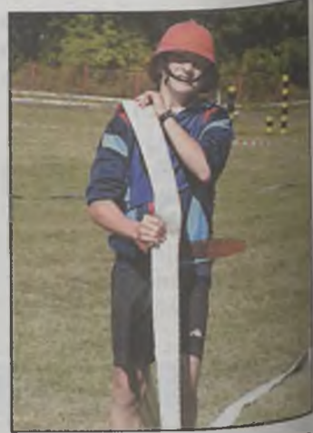
Każda drużyna musiała po sobie posprzątać.