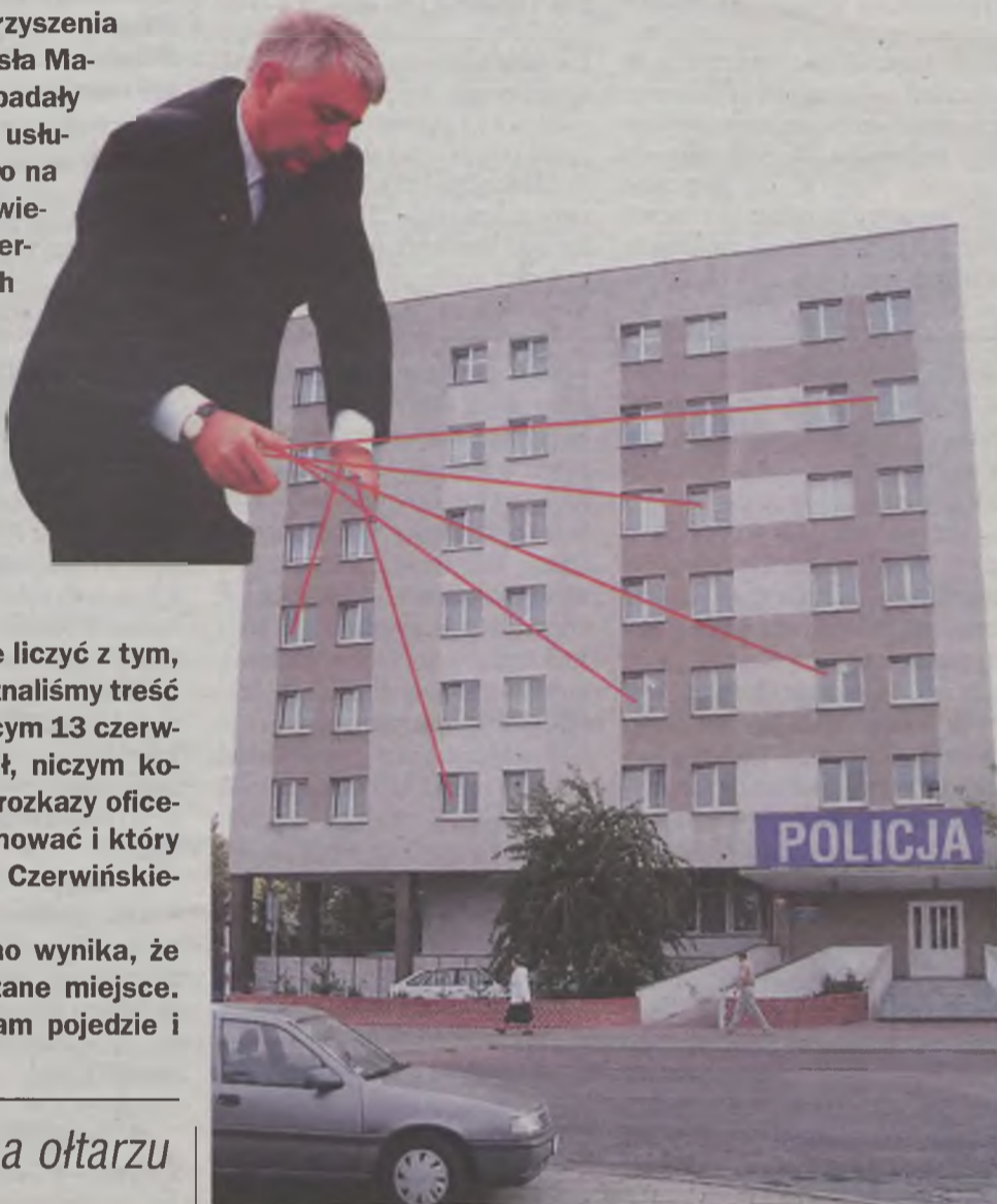
Podobnie jak w znanym filmie grozy pt. „Władca marionetek”, turkowski parlamentarzysta zafundował prawdziwy horror, który w tym przypadku mógłby nosić tytuł „władca policjantów”. Przynajmniej niektórych.