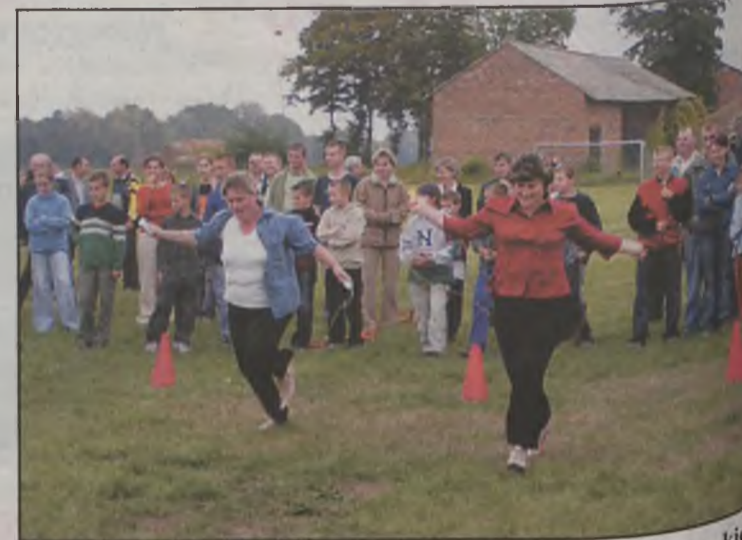
Niektóre mamy mogły sobie przypomnieć swoje dzieciństwo, kiedy skakały na skakance.

Przy stoiskach gastronomicznych można było się posilić. Posmakować ciasta, które upiekły