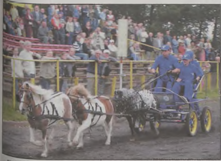
Widowni bardzo podobały się te małe koniki.

W zawodach łącznie wzięło udział 3 zaprzęgi oraz 5 jeźdźców, którzy na zawody przyjechali z różnych stron powiatu i kraju. Uczestnicy wystartowali w czterech konkurencjach, w powożeniu zaprzęgiem: jednokonnym, parokonnym i czterokonnym, a także w indywi-