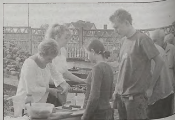
Panie przygotowały własne wypieki.

Wspólna zabawa integracyjna dla parafian, którzy liczą na kolejną letnie zabawy zorganizowane przez duszpasterzy z parafii Matki Bożej Fatimskiej w Turku.