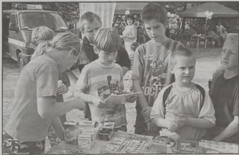
Działkowy festyn to atrakcja nie tylko dla ogrodników, ale i dla dzieci.

KWB „Adamów”, PKS, spółdzielni „Sintur” i PSS „Społem”. Festyn był doskonałą okazją do wręczenia nagród za największe i najpiękniejsze plony, najładniejsze ogródki oraz zaangażowanie w prace działkowca. Podczas imprezy działkowicze brali udział w rozmaitych grach i zabawach sprawnościowych jak rzut lotka do celu czy rajd rowerowy po terenie ogrodu. Dużym zainteresowaniem cieszył się radiowóz policyjny, w którym przesiadywali najmłodszy działkowicze. Mogli oni pod okiem policjantów obejrzeć osprzętowanie radiowozu lub posiedzieć za kierownicą w policyjnej czapce. Oczywiście podczas festynu nie obyło się bez grilla i zabawy tanecznej. MJ