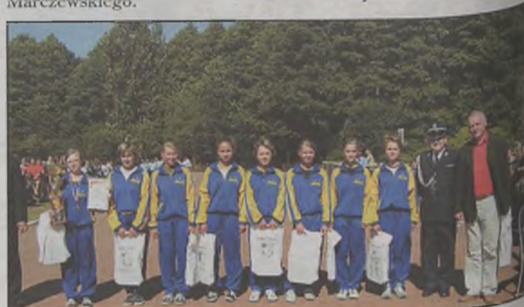
Zwycięskie dziewczęta z OSP Przykona.