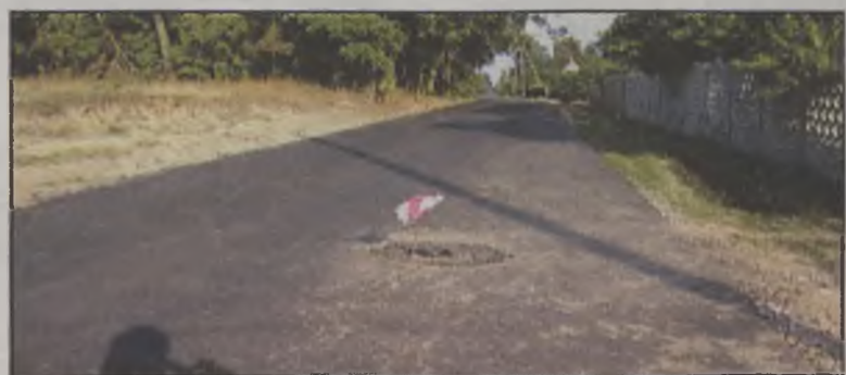
Co 50 metrów na drodze są takie chorągiewki, bez znaków ostrzegawczych.

wzdłuż wodociąg i co 50 metrów będą zabudowane specjalne przykrycia (kratki). Nie wiem, gdzie będą zabudowane hydranty p.poz. chyba nie w środku jezdni. Każde nowe przyłącze do gospodarstw wiązać się będzie ze zniszczeniem monolitu dywanika asfaltowego. Dolny odcinek wodociągu, czyli przed wsią Brody, narażony jest na duże ciśnienie z powodu dużej różnicy poziomu i pęknięcie rur. Przy takiej awarii również trzeba będzie rozkopywać nowo położo-