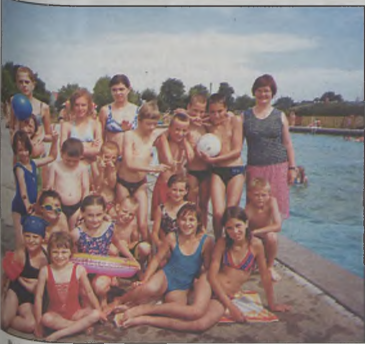
Podczas upalnych dni wychowankowie świetlic korzystali z basenu OSiR w Turku.