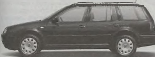
Golf Variant rabat 7000 zł