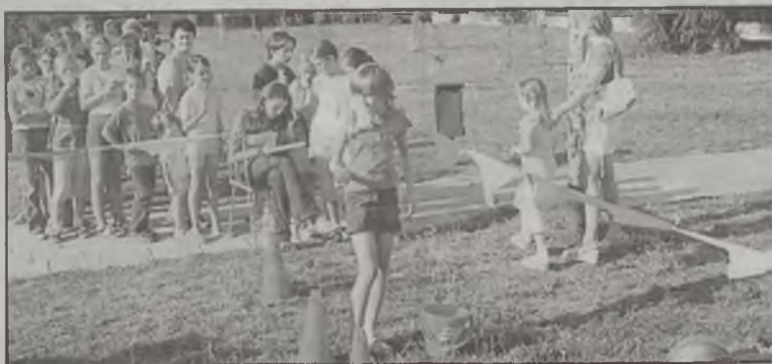
To był ostatni letni festyn na Osiedlu Wyzwolenia.