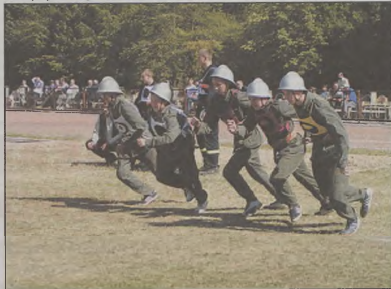
Najważniejsza była jednak szybkość i dokładność wykonania zadań.

Trzydzieści Młodzieżowych Drużyn Pożarniczych wystartowało w II Powiatowych Zawodach Sportowo-Pożarniczych MDP, które w sobotę, 11 września odbyły się na stadionie w Kaczkach Średnich. Zwycięzcami wielogodzinnej rywalizacji zostały dziewczyny z Przykony i chłopcy z Chylina.