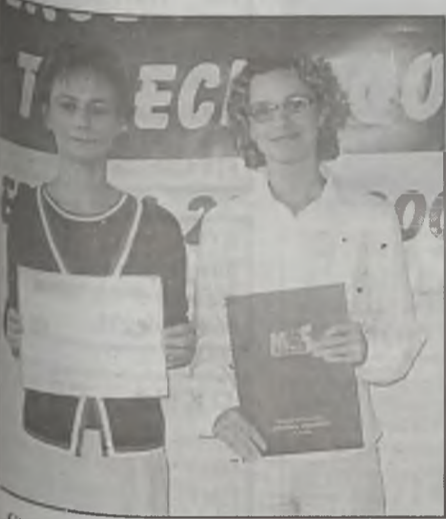
Gimnazjum nr 1 w Turku uplasowało się na trzecim miejscu wśród wielkopolskich gimnazjów.

Klasyfikacja powiatów wielkopolskich wygląda następująco: 1. miasto Poznań – 5427,60