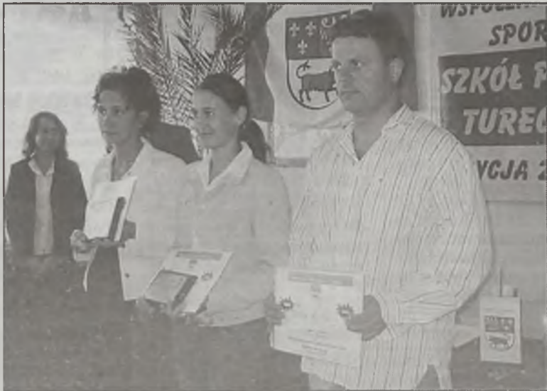
Nagrodzono również trenerów, których podopieczni w roku szkolnym 2003/2004 mieli największe osiągnięcia sportowe.

szkoły zajęliśmy miejsca: 4. Gim. nr 1 Turek – 185,25 pkt, 27. Władysławów – 116,25 pkt, Gim. nr 2 Turek – 84 pkt, 88. Przykona – 55,50 pkt, 147. Małanów – 30,50 pkt, 172.