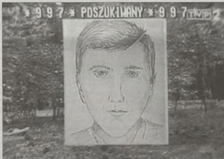
Zdaniem policjantów nie należy za bardzo nie sugerować się portretem pamięciowym sporządzonym czternaście lat temu.

-Mimo, że od tego wydarzenia minęło już czternaście lat, liczymy na to, że ktoś ma informacje, które mogą okazać się pomocne w wykryciu sprawcy morderstwa. Liczymy na pomoc społeczeństwa w tej sprawie – mówi podinsp. Zu-