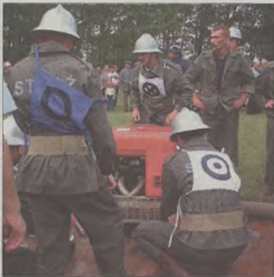
Przygotowanie do bojówki.

MDP - chłopcy: 1. Dobra II - 82,2; 2. Mikulice - 91,5; 3. Dobra I - 93,1; 4. Linne - 102,3; 5. Rzechta - 104,7; 6. Rzechta II - 121,1.