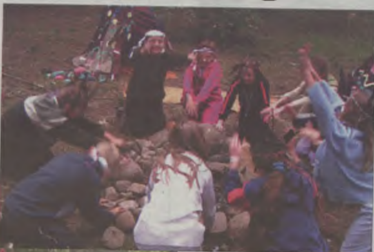
Zabawa wokół ogniska.

-Chodziło o integrację ośrodków kultury i to było główne założenie. Dzieci, które wzięty w zabawie wcześniej się nie znaly. Tu się poznały i od razu bardzo polubiły, tworząc zgraną indiańską grupę. To była dla nich tania forma spędzenia części wakacji, bo koszt zabawy to 10 złotych za dwudniowe wyżywienie. Po-