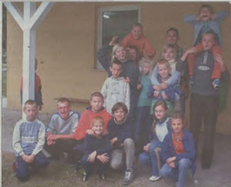
Półkoloniści ze swoimi opiekunami.