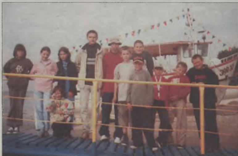
Dzieciaki są zachwycone nadmorskimi wożaczami.