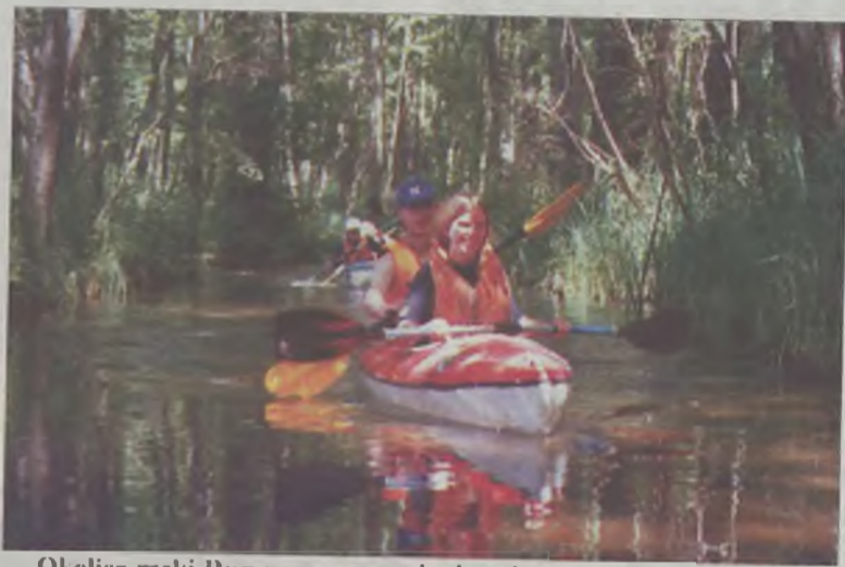
Okolice rzeki Rurzyca przypominały spływ Amazonką.

Niektórzy z nas nie mieli wcześniej do czynienia z kajakami, jednak trochę ćwiczeń (pływanie „na sucho” czy przymusowe wywrotki) i od razu poczuliśmy się pewniej – tak przynajmniej myśleli wodzowie. Spływ zaczęliśmy od wycieczek po jeziorach Komorze i Sikory. Płynąc od brzegu do brzegu (to oczywiście przez „krzywe” kajaki) pokonaliśmy pierwsze kilometry, dalej na rzece udawało się już utrzymać kierunek. W kajakach przemierzaliśmy ponad 120 kilometrów. Piękne je-