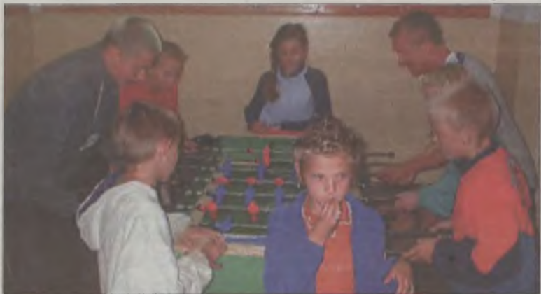
Piłka nożna dominowała nawet w klubowym budynku.

jęciach bierze udział do czterdzięściora dzieci dziennie. Są to uczniowie szkół podstawowych i gimnazjów. Grają w siatkówkę, koszykówkę, badminton, ringo i piłkę nożną. W czasie nie pogody uczestniczą w zajęciach świetlicowych. Grają w szachy, warcaby, piłkarzyki. Organizowane są również wycieczki po okolicy. Dzieci były już na pieszej w lesie oraz rowerowej po najciekawszych zakątkach zachodniej części gminy. Przewodnikiem był Stanisław Sta-