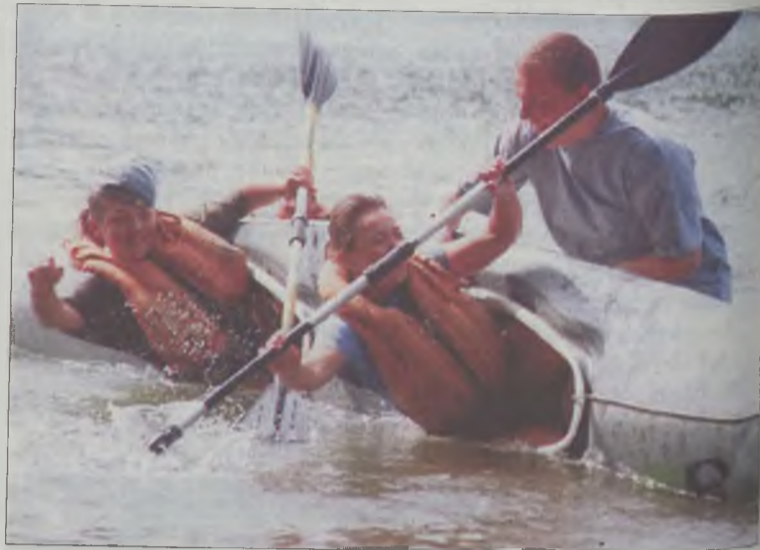
Przymusowe wywrotki to element ćwiczeń kajakowych.

Nie spędziliśmy jednak całego czasu w kajakach. Na „suchym lądzie” było też sporo zajęć i atrakcji – od wspólnego przygotowywania posiłków (niektórzy spływowicze w tej dziedzinie także nie mieli doświadczenia) przez wymyślane przez wodzostwo konkurencje (w tym nowa dyscyplina olimpijska – sprint grupowy z papierem toa-