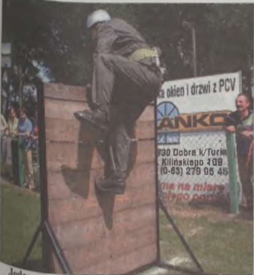
Jeden z trudniejszych elementów toru przeszkód