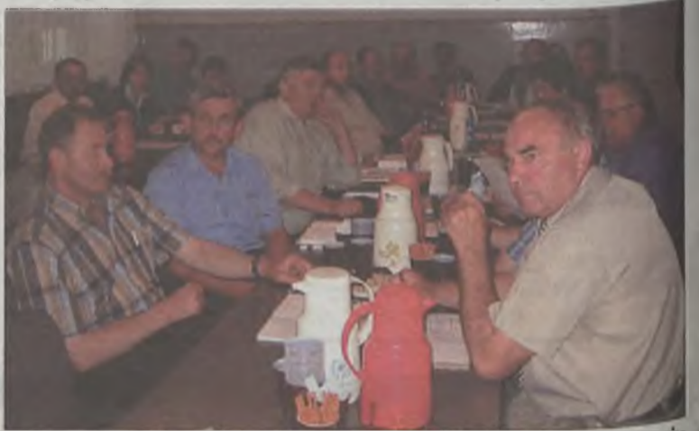
W szkoleniu wzięli udział zaproszeni przedstawiciele Agencji Restrukturyzacji i Modernizacji Rolnictwa, Ośrodka Doradztwa Rolniczego oraz zainteresowani rolnicy powiatu tureckiego.

Głównym zadaniem rolników posiadających bezpośrednią kwotę mleczną jest prowadzenie miesięcznego rejestru mleka i składanie na koniec roku kwotowego, (czyli po 31 marca każdego roku) rocznych informacji o ilości sprzedanego mleka. Rolnik, który chce zamienić kwotę bezpośrednią na hur-