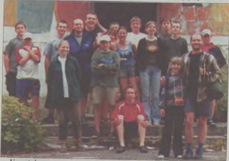
Uczestnicy wyprawy w opuszczonym mieście Gródek.

Już po raz siódmy Koło Turystyczne LO zorganizowało obóz kajakowy Turków Sakramentkich. Tym razem do ekipy z turkowskich szkół przyłączyli się chłopcy z Archidiecezjalnego Gimnazjum Męskiego w Warszawie wraz ze swoją opiekunką.