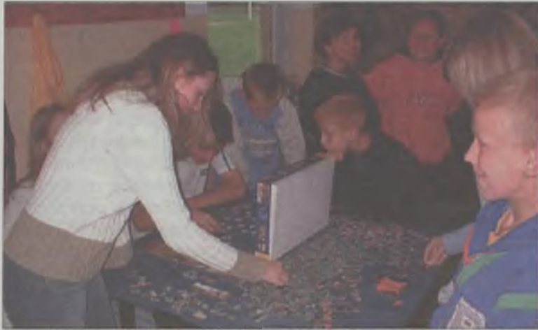
Na niepokodę układnie puzzli.

Za sprawą Powiatowego Urzędu Pracy, Klubu Sportowego „Wicher” oraz Gminnej Komisji Rozwiązywania Problemów Alkoholowych, kilkadziesiąt dzieci z Dobrej i najbliższej okolicy, uczestniczy w bezpłatnych półkoloniach zorganizowanych w ramach programu „Zielone Wakacje”.