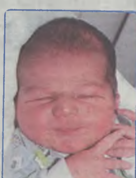
... NAWROCKI syn Marzyny i Pawła ur. 4 lipca, godz. 14.10 ważył 4400g, mierzył 59cm