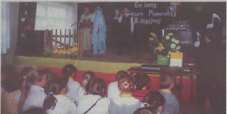
...i Gminnym Konkursem Piosenki Religijnej.

Dyrektor szkoły w Kaczkach Śr. dziękuje wszystkim, którzy przyczynili się do uświetnienia tej szkolnej uroczystości.