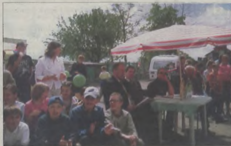
Publiczność i jurorzy.

Szkoła Podstawowa w Tokarach była organizatorem I Gminnego Festiwalu Piosenki Dziecięcej. Na ustawionej przed budynkiem szkolnym scenie, zaprezentowało się siedemnastu wykonawców. Byli wśród nich soliści, zespoły wokalne, a nawet jeden wokalo-instrumentalny.