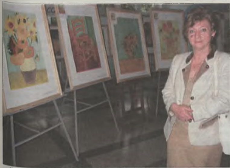
Wystawę obrazów obejrżeli nie tylko uczniowie, ale także rodzice.

W ramach europejskiego programu Socrates-Comenius, w którym od dwóch lat uczestniczy Gimnazjum nr 2 w Turku, uczniowie z partnerskich szkół w Niemczech i Holandii poznają się przez kulturę i edukację. Jedną z form tego poznawania jest wystawa malarstwa holenderskiego, którą przygotowali gimnazjaliści z „Dwójki”.