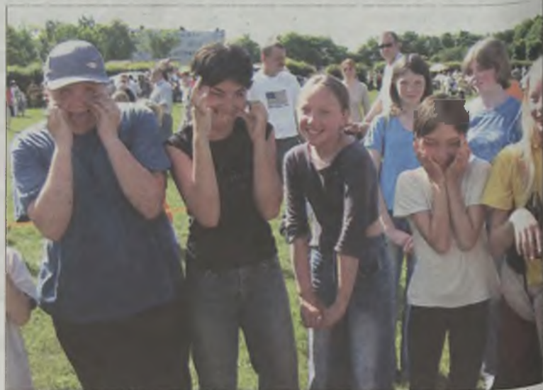
Dzieciaki chętnie brały udział w konkursie na najzabawniejszą minę

Poza tym na murawie OSiRu zorganizowano wiele zabaw ryzykownie sprawnościowych. Było łowienie drewnianych rybek, konkurs na najzabawniejszą minę, wyścig par ze zawiązanymi nogami, dmuchanie balonów lub loteria fantowa. Każde dziecko za udział w