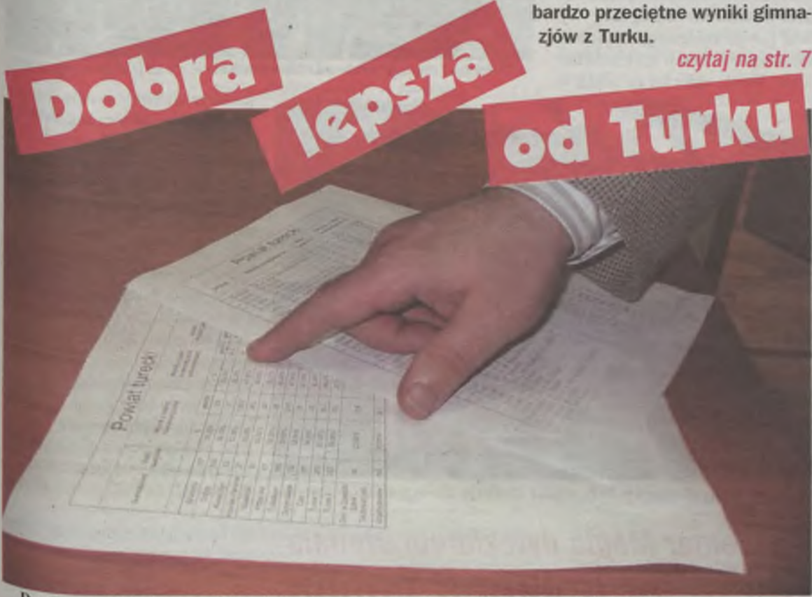
Dyrektorzy niektórych szkół z niedowierzaniem przyjmowali wyniki swoich uczniów.