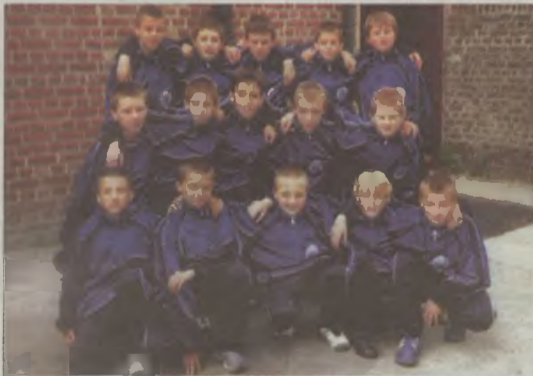
Reprezentanci SP 5 Turek na turnieju we Francji