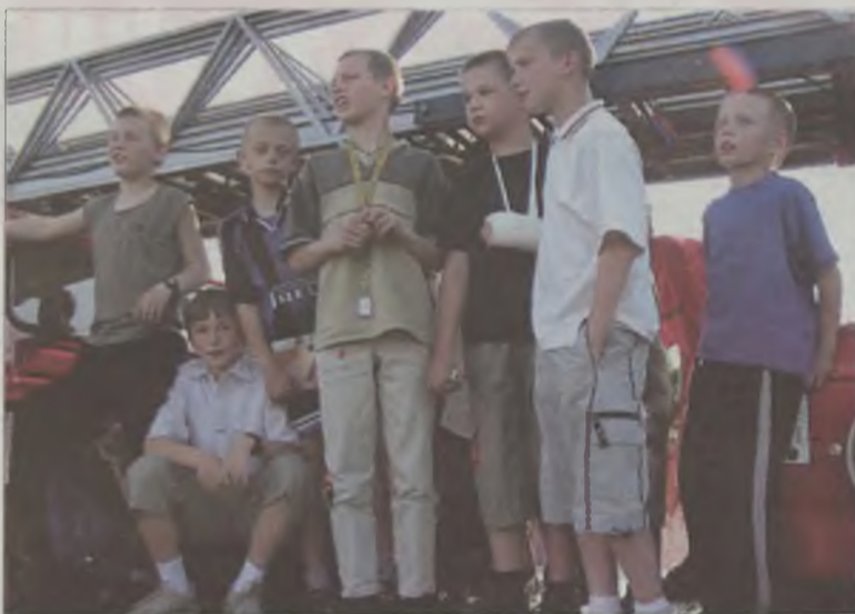
Samochody strażackie były wielką atrakcją dla uczestników festynu.

zabawnych konkurencjach otrzymywało pamiątkową nagrodę: koszulkę, zeszyt, czekoladę lub zabawkę. Dużym zainteresowaniem wśród maluchów cieszył się radiowóz policyjny, w którym zapewne zasiadło wielu przyszłych policjantów. Zakończeniem Dnia Dziecka był pokaz strażacki, wzbudzający wiele emocji szczególnie wśród chłopców, którzy pod urokiem dużych aut gaśniczych nie tylko chętnie pozowali do zdjęć, ale wszyscy jednogłośnie zapewniali, że w przyszłości będą strażakami.