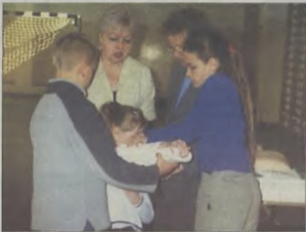
Opatrywanie zranień było jednym z zadań konkursowych.