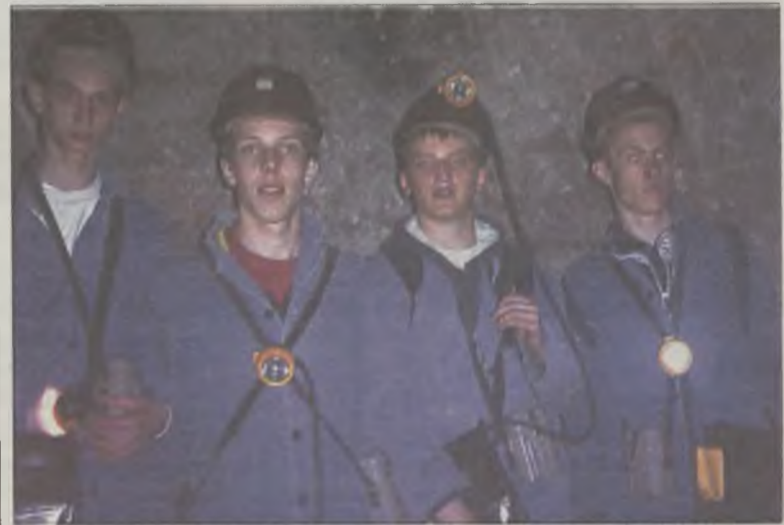
Gimnazjaliści musieli przebrać się w stroje robocze i założyć ważący 4 kilogramy ekwipunek.

s. Potem rozpoczęła się już długa wędrówka ciemnymi lub słabo oświetlonymi korytarzami. Górnicy – przewodnicy zapoznali gimnazjalistów z budową kopalni oraz procesem technologicznym wydobycia soli. Trzy godziny pod ziemią były znakomitą lekcją chemii, fizyki,