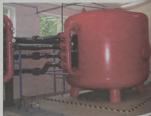
Jeden z czterech filtrów ciśnieniowych, dzięki którym mieszkańcy Turku mają czystą wodę, spełniającą dyrektywę europejską.

wia, ale również parametrach spełniających dyrektywę europejską. A wszystko to za jedyne 4,07 zł za litr wody (wraz ze ściekami), co daje nam pierwsze miejsce na liście miast o najtańszej wodzie w Wielkopolsce.