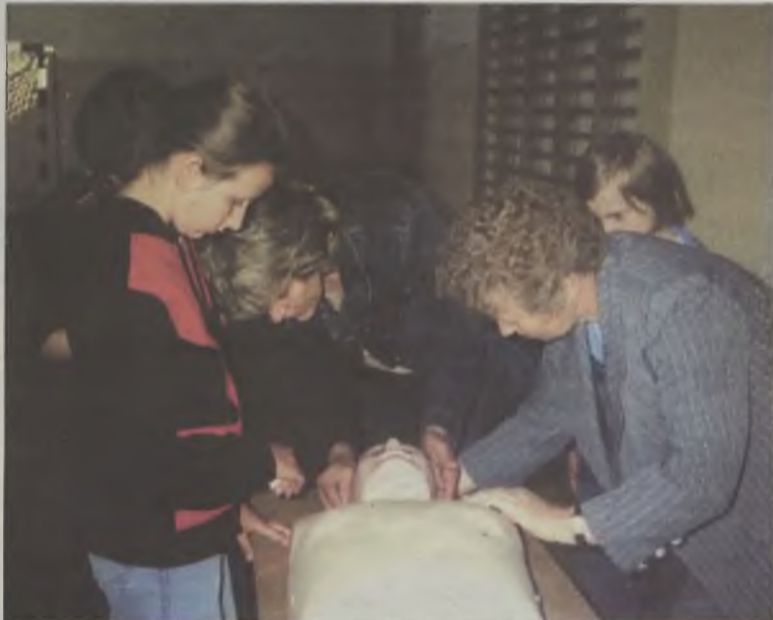
Do sprawdzenia umiejętności uczestników konkursu przydał się fantom.