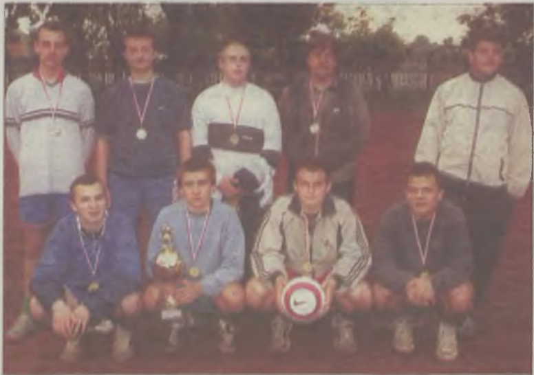
JARZĄBKI - zwycięzcy wiosennego turnieju drużyn osiedlowo-zakładowych