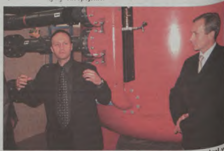
Podczas otwarcia przedstawiciel firmy wykonawczej wprowadził dane techniczne, parametry pomp oraz wyjaśniał zasady filtracji.