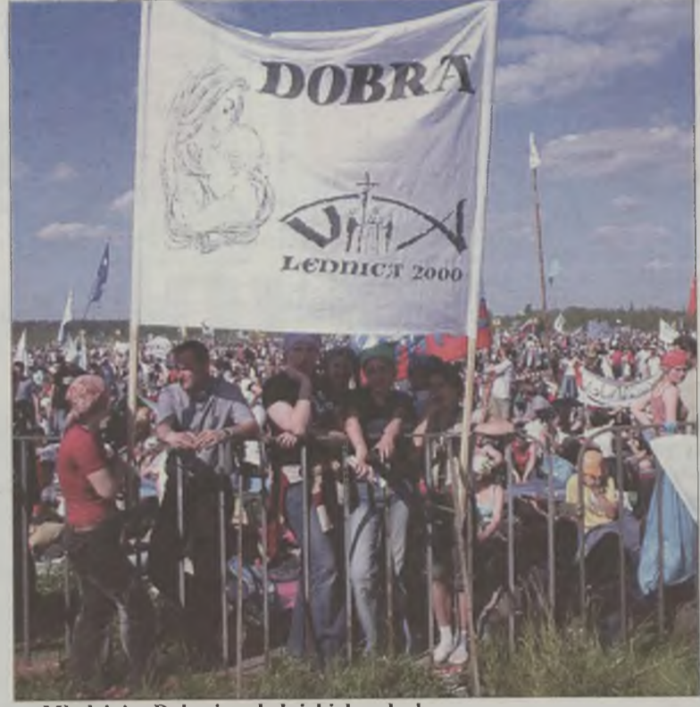
Młodzież z Dobrej na lednickich polach.

-Do domu wróciłam po godzinie 7 rano. Byłam bardzo zmęczona, ale już wiem, że za rok znów pojedę do Lednicy. Do dziś słyszę słowa Ojca Świętego i mam wrażenie, że choć było nas tam tysiące, On zwracał się tylko do mnie – podsumowuje lednickie spotkanie licealistka z Turku. AZ