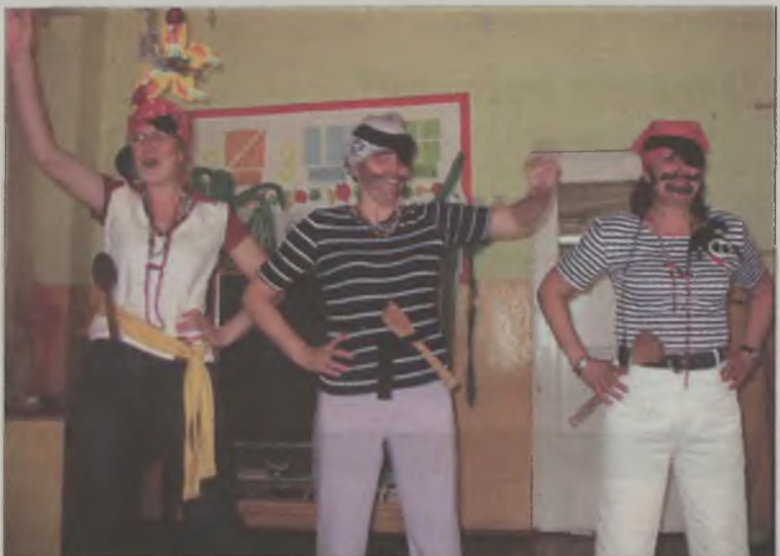
Przedszkolne nauczycielki w roli piratów poszukujących skarbów

W czwartek część przedszkolaków poszło do kina na bajkę „Ratunku – jestem rybka”, a inni z nauczycielkami na lody. Piąty dzień wielkiego imprezowania rozpoczął się od przedstawienia „Na pirackim statku”, które dzieciom zaprezentowały przedszkolne nauczycielki. W pirackich strojach, w rytmie marynarskich przebojów, przedszkolni piraci poszukiwali skarbów. Jednakże po długiej wyprawie znalezione skarby okazały się skrzynią wypełnioną warzywami i owocami. Gościnnie na przedstawienie przyszli koledzy i koleżanki z Przedszkola Samorządowego nr 3 w Turku. Po przedstawieniu każda grupa organizowała własną imprezę finałową, np. dyskotekę lub „Mini play back show”. Po takiej dawce zabaw i imprez przedszkolaki na długo zapamiętają tygodniowy dzień dziecka. MJ