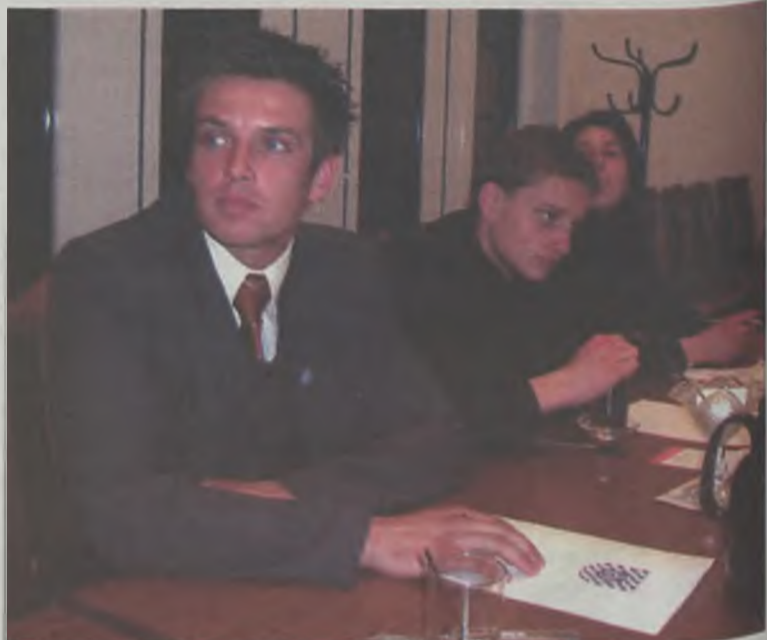
Młodych władysławowian interesowały m.in. cechy, jakimi powinien charakteryzować się kandydat na parlamentarzystę europejskiego.