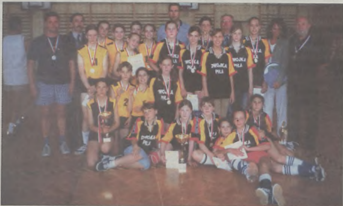
Od lewej stoją zdobywczynie srebrnego medalu, siatkarki z Tuliszkowa (żółte stroje). Obok mistrzynię z Pily (czarne stroje).

(25:17, 25:21) i SP 84 Poznań 2:0 (25:6, 25:6). Druga lokata przypadła zespołowi ze Stęszeza, trzecia Poznaniowi, czwarta Pudliszkom. W grupie „B” na pierwszym miejscu SP nr 2 Piła, drugim Kalisz, trzecim Skoki, czwartym ZS