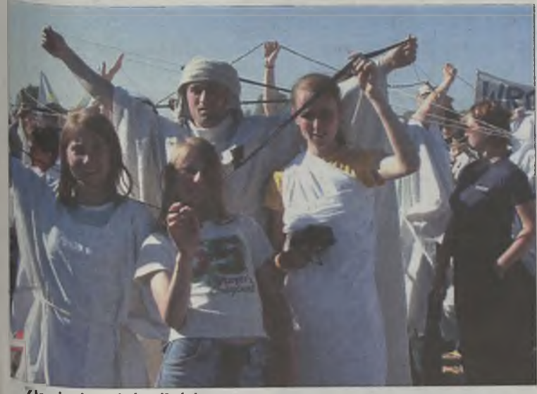
Złowieni w sieć miłości.

Około 500 młodych ludzi z powiatu tureckiego wzięło udział w VIII Ogólnopolskim Spotkaniu Młodych w Lednicy. Młodzież porwana w sieć miłości potwierdziła swoją wiarę.