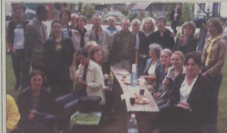
Grupa przed dworkiem w Kołaczkwowie.

osób chorych psychicznie. Chcemy, aby osoby te mogły normalnie funkcjonować, nie były izolowane od reszty społeczeństwa, aby czuły się potrzebne, wartościowe i akceptowane – mówią organizatorzy, studenci WSZ w Koninie i dodają: -Choć zorganizowanie spotkania nie było łatwe, trud nasz