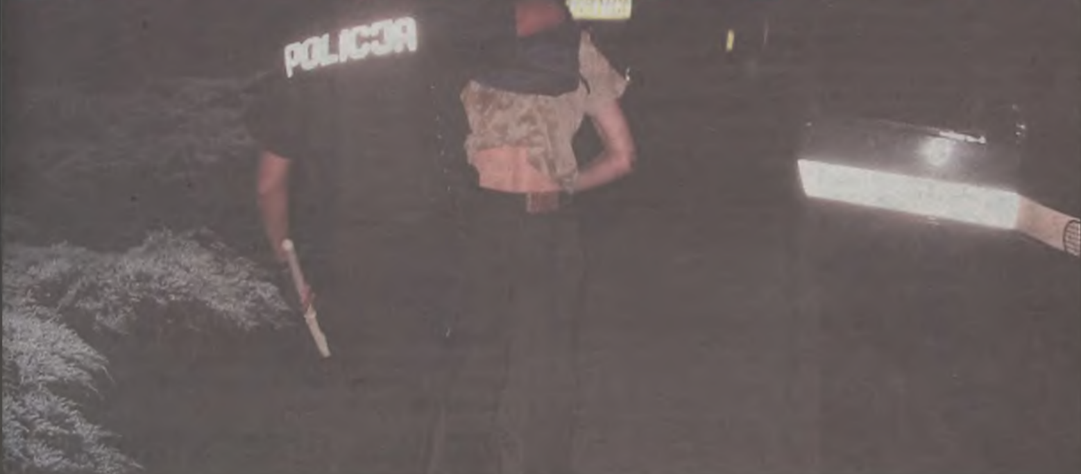
Młodzi ludzie zarzucają policjantom w kominiarkach brutalność i bezpodstawne sięganie po pałki.

Kilkanaście osób pobitych przez policję to efekt działań grupy w kominiarkach w noc z 30 kwietnia na 1 maja. Świadkowie twierdzą, że policjanci bez opamiętania bili pałkami młodych ludzi. Kilkoro z nich z obrażeniami zgłosiło się do turkowskiego pogotowia.