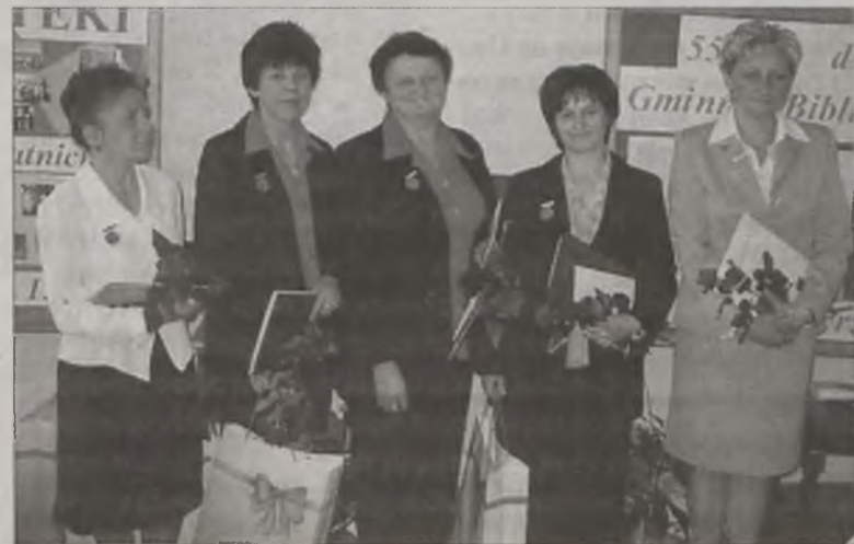
Pracownice bibliotek odznaczone medalem „Za zasługi dla powiatu tureckiego”.