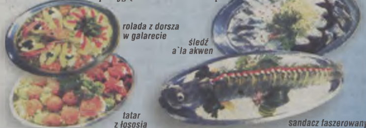
rolada z dorsza w galarecie