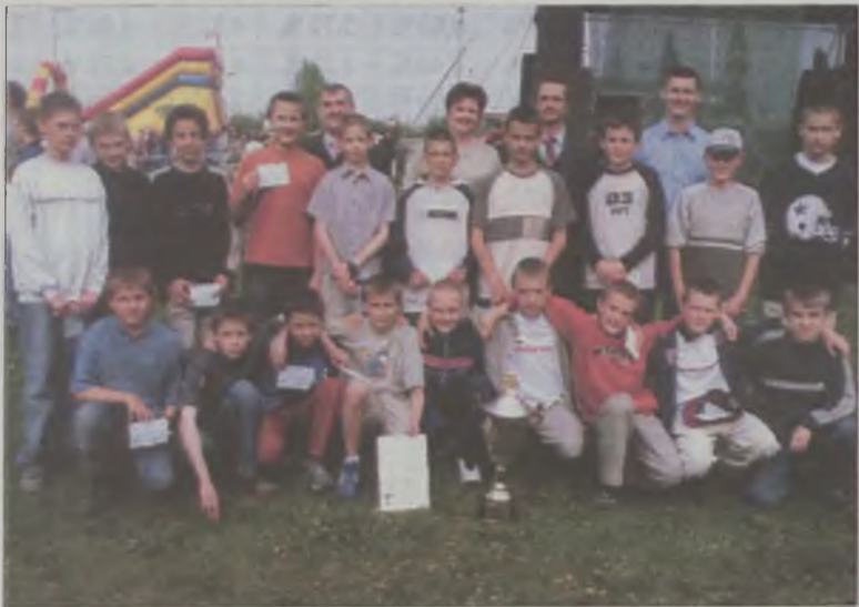
Drużyna SP 5 z Turku weźmie udział w międzynarodowym turnieju we Francji