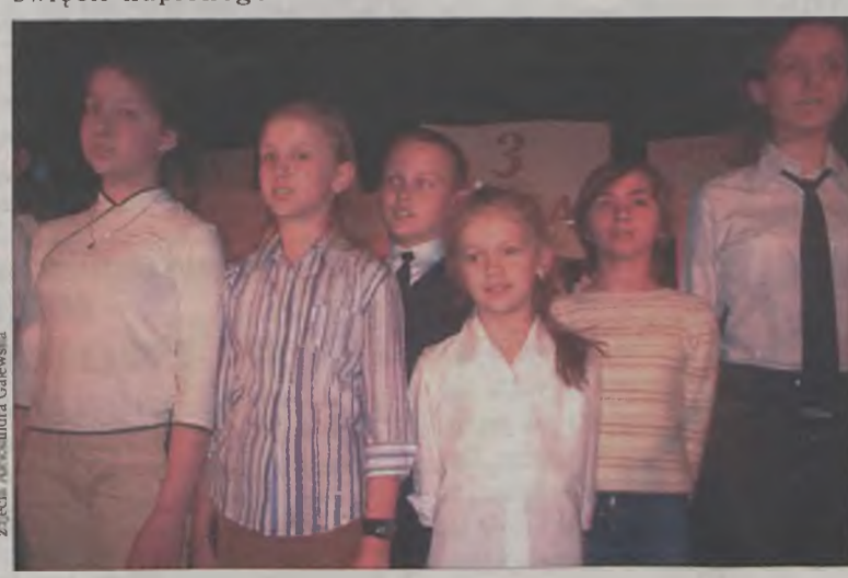
Dzieci biorące udział w akademii

kiem. Po jej zakończeniu, poświęcił kupionego niedawno przez dobrską jednostkę fiat ducato.