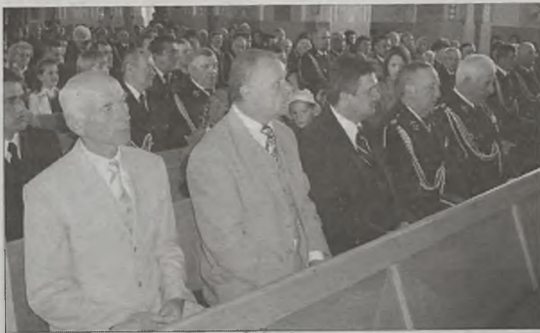
Uczestnicy uroczystej mszy świętej