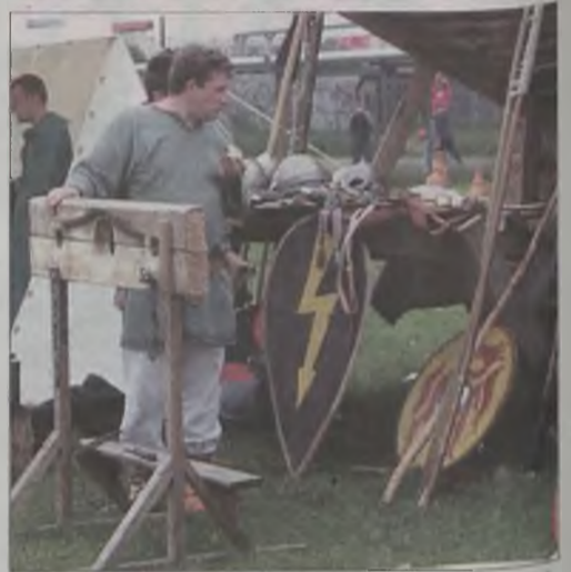
Podczas festynu Turkowanie mogli podziwiać stoisko z bronią średniowieczną.