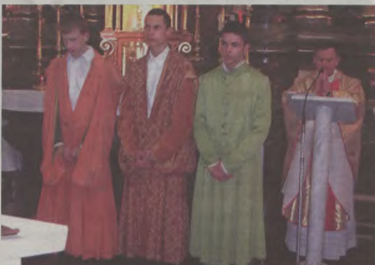
Gimnazjaliści w szlacheckich strojach towarzyszyli obchodom rocznicy uchwalenia Konstytucji 3 Maja.

Dla uczczenia rocznicy uchwalenia Konstytucji 3 Maja, przed Gminnym Ośrodkiem Kultury we Władysławowie zorganizowano specjalne uroczystości. Poprzedziła je msza św. w kościele pw. Świętego Michała Archanioła w Russocicach. Złożono również kwiaty pod krzyżem i pomnikiem „Tym co za Ojczyznę”.