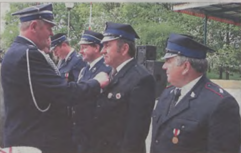
Medale i wyróżnienia tuliszkowscy druhowie otrzymywali w parkowym amfiteatrze.

„Wzorowy strażak” to odznaczenia, którymi uhonorowani zostali: