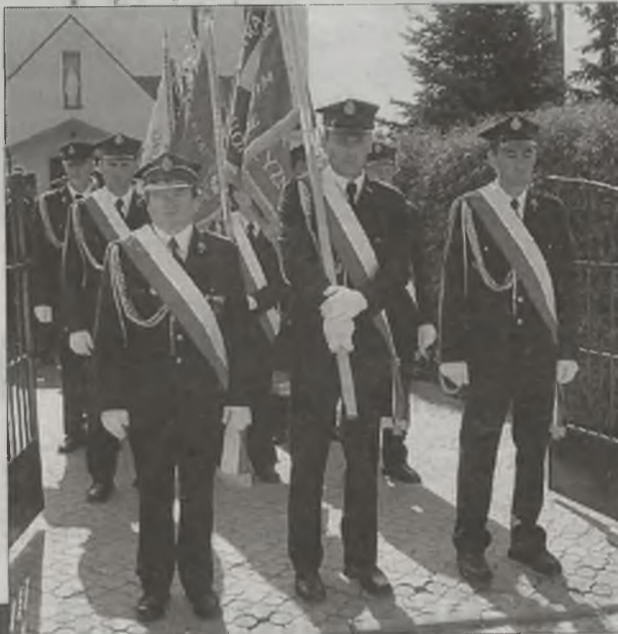
Strażackie poczty sztandarowe

podkreślił znaczenie dla Polski i Polaków integracji z Unią Europejską. W części artystycznej wystąpiły młodzież i dzieci z przykońskich szkół. Doniosłość uroczystości i jej oprawa, wywarła duże wrażenie na zaproszonych gościach i uczestniczących w niej mieszkańcach gminy. (can)