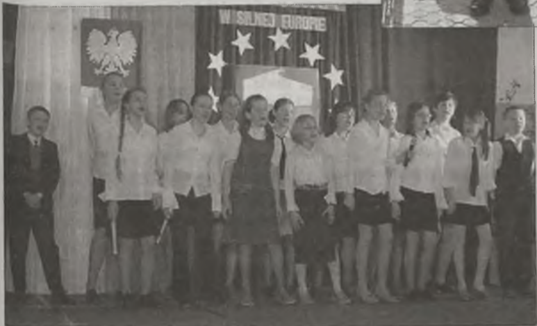
Część artystyczna uroczystości

podkreślił znaczenie dla Polski i Polaków integracji z Unią Europejską. W części artystycznej wystąpiły młodzież i dzieci z przykońskich szkół. Doniosłość uroczystości i jej oprawa, wywarła duże wrażenie na zaproszonych gościach i uczestniczących w niej mieszkańcach gminy. (can)