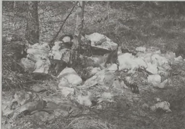
Śmieci zamiast na drodze wysypisko, trafiają do lasów i przydrożnych rowów.

trafiać do lasów i rowów. I stało się. Ilość odpadów dowożonych na wysypisko znacznie spadła. Za to lasy, a nawet boczne, mniej uczęszczane zaułki Dobrej przemieniły się w śmietniska. Znaczące zmniejszenie się ilości dowożonych na wysypi-