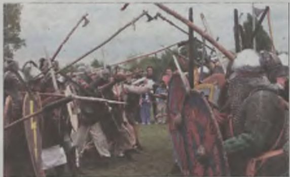
Na murawie OSiRu toczyły się liczne pojedynki rycerskie, bitwy i walki m.in. pomiędzy Słowianami a Wikingami.

Pojedynki rycerskie, walki, scenki rodzajowe oraz wiele innych atrakcji plebejskich było atrakcjami II Festynu Słowiańskiego, który w minioną sobotę, 8 maja, odbywał się na terenie Ośrodka Sportu i Rekreacji w Turku.