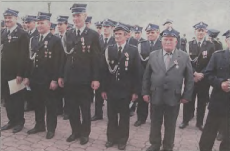
Wielu strażaków z gminy Brudzew zostało uhonorowanych medalami i odznakami.