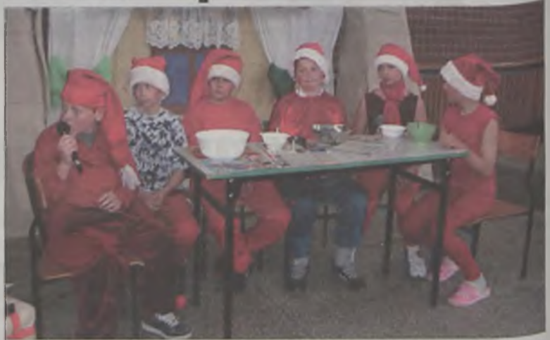
Chochelka, Kocmołuszek, Barylka, Cukierek, Dymek, Chorutek oraz Królowna Śnieżka to bohaterowie baśni higienicznej, którą zaprezentowano na zakończenie pogadarek „Z medycyną na Ty”.