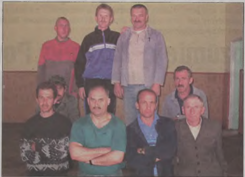
Druhowie z Janiszewa odbudowali remizę i teraz przygotowują się do jej poświęcenia i uroczystego otwarcia.

OSP w Janiszewie liczy ponad 50 druhów, jednak nie wszyscy z