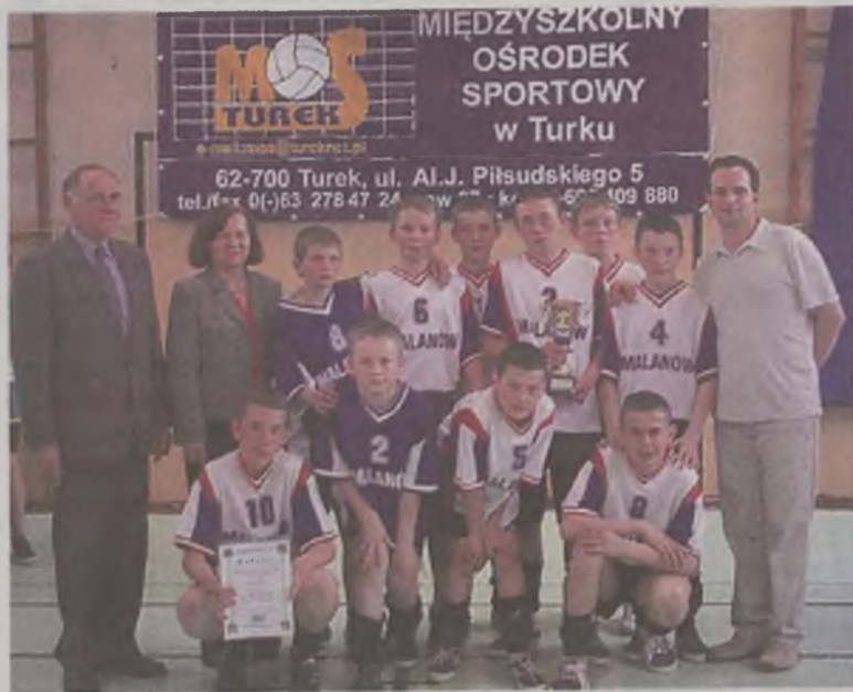
Młodzi siatkarze ze Szkoły Podstawowej w Malanowie z kompletem zwycięstw sięgnęli po Mistrzostwo Rejonu

Piękny sukces odnieśli młodzi siatkarze ze Szkoły Podstawowej w Malanowie, którzy w stawce sześciu zespołów zajęli pierwsze miejsce w Mistrzostwach Rejonu w piłce siatkowej chłopców. Tak więc mistrzowie Powiatu Tureckiego sięgnęli również po prymat w rejonie i kolejnym ich wyzwaniem będzie udział w finale Mistrzostw Wielkopolski.