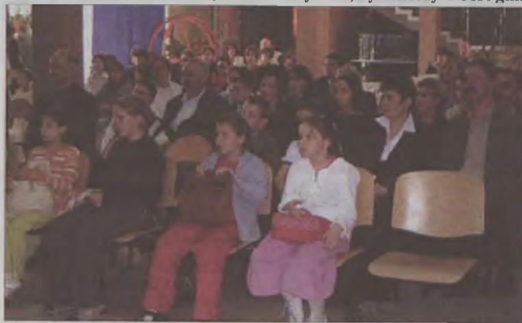
Już po raz siódmy recytatorzy przyjechali do Przykony.

Temat konkursu plastycznego brzmiał: „Światło naszym sprzymierzeńcem”. Prace wykonywano w trakcie trwania konkursu recytator-