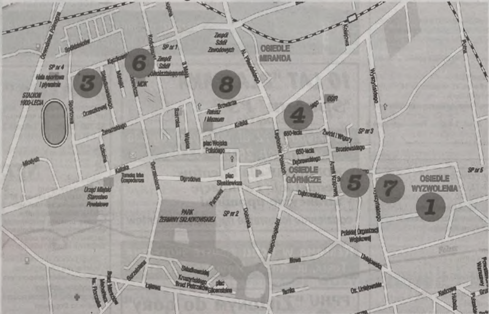
Numery oznaczają numerację poszczególnych przedszkoli samorządowych w Turku.

dobrą monetę? Czy rozumiemy, że dla kogoś, kto do tej pory był w domu, pod skrzydłami mamy, wejście w grupę dzieci jest ciężką fizyczną i psychiczną pracą, która wymaga wyuczenia się wielu nowych umiejętności?