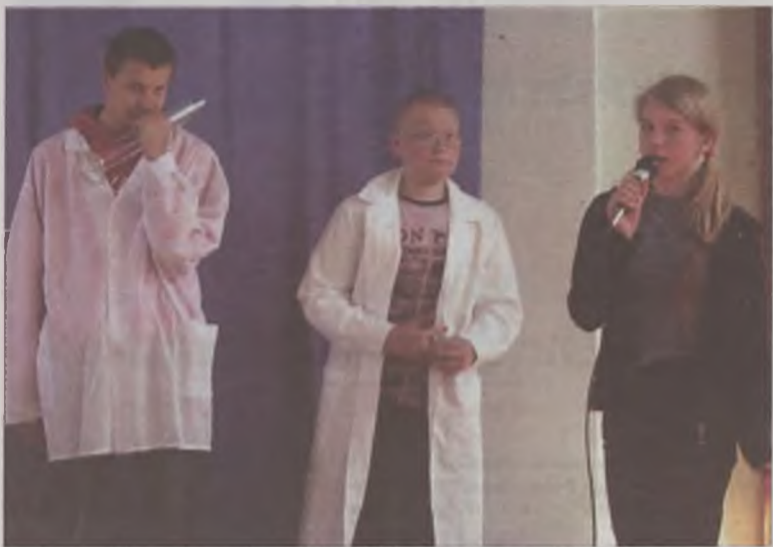
Ekologiczne scenki w wykonaniu gimnazjalistów z „Dwójki”.

i nauczycieli. Wszystko po to, aby przekonać nas o tym, że dobra zabawa może być jednocześnie formą nauki. W rywalizacji wystąpili przedstawiciele każdej z klas. Pisali test, prezentowali skecze, wiersze i piosenki o tematyce ekologicznej. Nad przebiegiem czuwała komisja złożona z grona pedagogicznego. Suma punktów z poszczególnych konkurencji, decydowała o wygranej. Maksymalną ilość zdobyła klasa I c. Można było