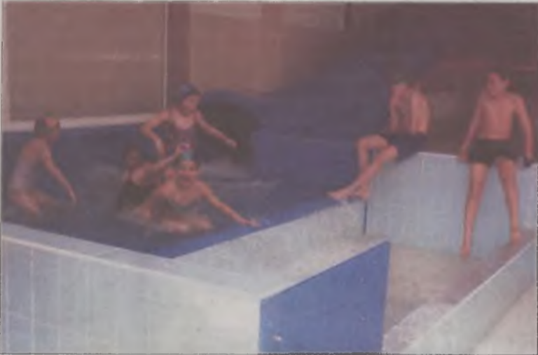
Uczestnicy zabawy dostali tytuły „wodnych przyjaciół”.

W najbliższych planach FMS jest zorganizowanie wyjazdu dzieci niepełnosprawnych na wycieczkę połączoną ze zwiedzaniem hodowli strusi oraz organizacja wyjazdów na sympozja i seminaria. Nadal też Federacja zaprasza do współpracy młodych, aktywnych mieszkańców naszego powiatu. AZ