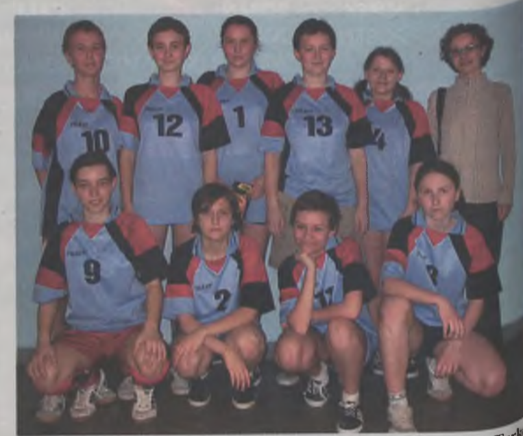
Najlepiej w piłkę nożną grały dziewczyny z Gimnazjum nr 1 w Turku

W rozgrywkach, zorganizowanych przez Ośrodek Wsparcia dla Osób z Problemami Uzależnień w Turku, Polskie Towarzystwo Zapobiegania Narkomanii, gminy Przykona i Brudzew, SP w Galewie i KPP w Turku, wzięło udział pięć gimnazjów: nr 1 i nr 2 z Turku, z Żuk, Brudzewa i Kowali Pańskich. Turniej rozgrywany był