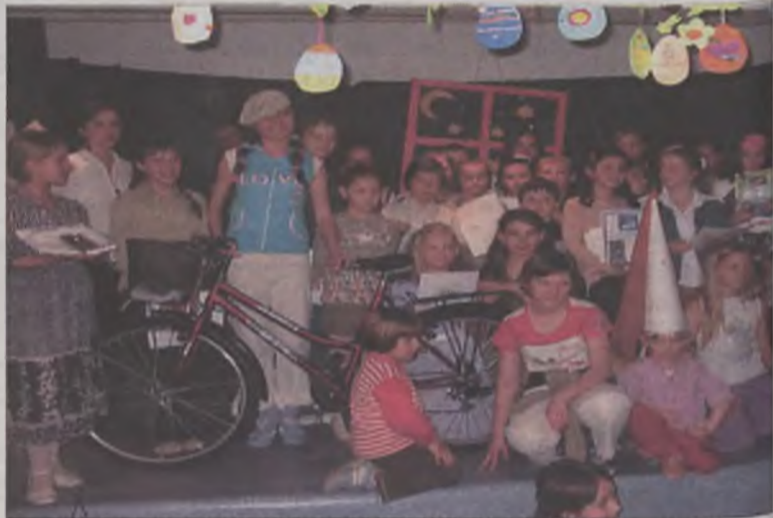
Rozeźmiani mali artyści byli zadowoleni z festiwalu i nagród.