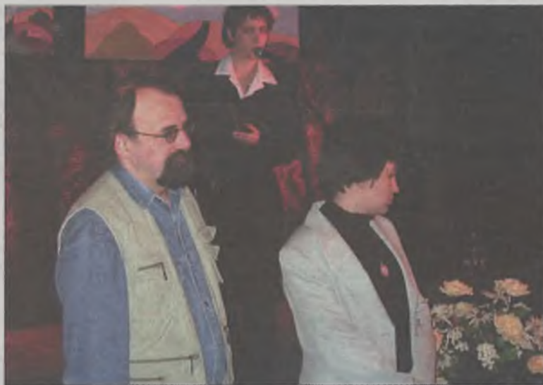
Poeci – laureaci konkursu