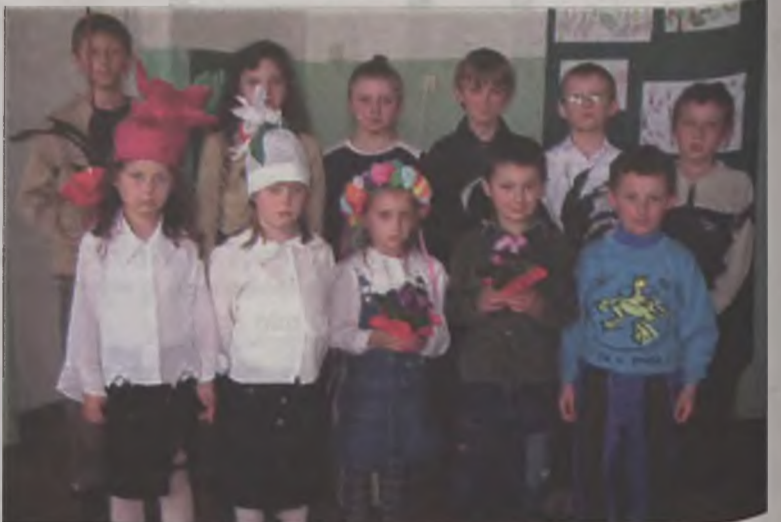
Reprezentanci klas - laureaci trzech pierwszych miejsc.

Przy okazji konkursu można było się dowiedzieć, jak dużo czasu do samoistnego rozłożenia potrzebują śmieci. I tak na przykład wyrzucony w lesie ogryzek jabłka potrzebuje 6 miesięcy, niedopałek papierosa 1 – 2 lata, guma do żucia 5 lat, puszka po napoju 10 lat, a torbka foliowa aż 300 lat. AZ