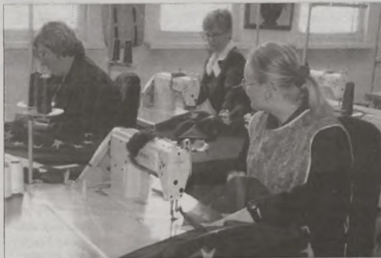
W trakcie spotkania uczestnicy zwiedzali warsztaty szkoleniowe

Uczestnicy dni otwartych mogli także zwiedzić warsztaty szko-