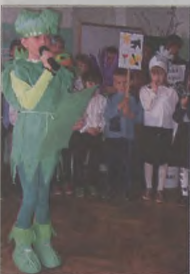
Część artystyczną poprowadził zielony, leśny ludek.