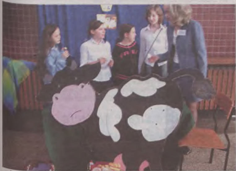
Stoisko firmowe naszego miasta przygotowane przez uczniów „Piątki”.

Po debacie na sali gimnastycznej odbył się mecz piłki siatkowej pomiędzy nauczycielami reprezentującymi państwa UE a drużyną uczniów reprezentujących Polskę. MJ