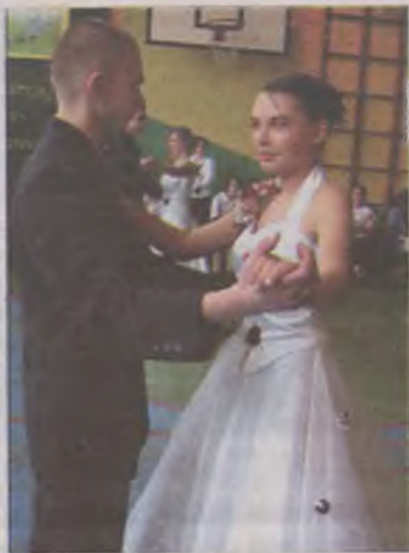
Walc w wykonaniu reprezentantów Tuliszkowa.

W turniejach wiedzyowych najwięcej punktów zdobyli gimnazjaliści z Władysławowa – łącznie 55 pkt. Za nimi byli młodzi tuliszkowianie i do-brzanie z sumą 52 pkt. Najwięcej