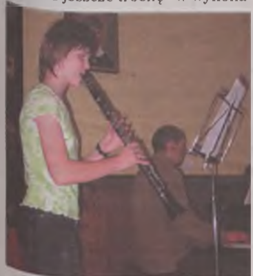
Uczniowie szkoły muzycznej wiosnę powitali koncertem.

Koncert rozpoczął się utworem „Płacz jeszcze trochę” w wykonaniu