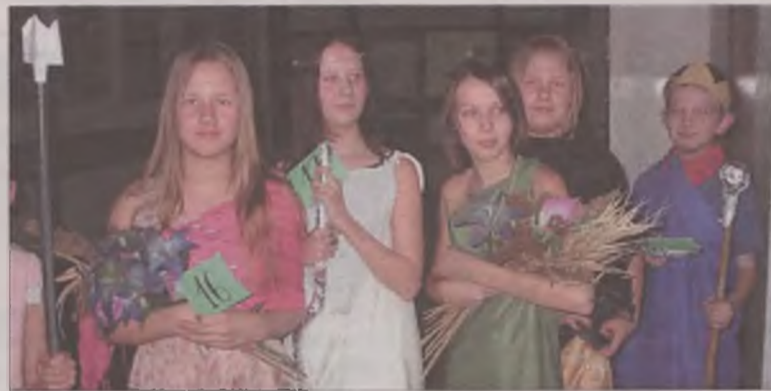
Greckie boginie z „Piątki”.

W turnieju mitologicznym braли udział uczniowie klas piątych, którzy nie tylko odpowiadali na pytania konkursowe, ale także mieli za zadanie wykonać plakat i komiks o tematyce mitologicznej. Poza tym w przerwie zmagani konkursowych odbyła się prezentacja tradycyjnych strojów starożytnej Grecji. Uczniowie poprzebierani za bogów, boginie i herosów swą pomysłowością i oryginalnością próbowali przekonać do siebie publiczność i jury. W emocjonującej dogrywce podwójne pierwsze miejsce, za wiedzę, oryginalność strojów i pomysłowość zdobyły klasy V a i V f.