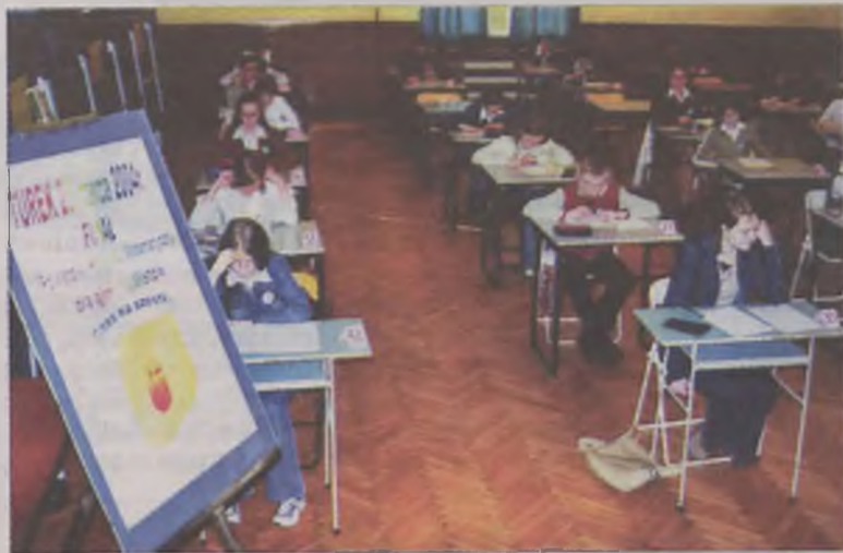
Skupienie w trakcie rozwiązywania matematycznych łamigłówek.