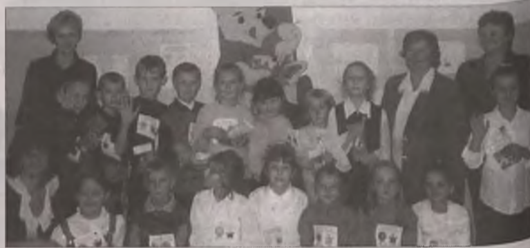
Uczestnicy zajęć z lekturą.

Pierwsze spotkanie odbyło się w listopadzie ubiegłego roku i było to konkurs czytelnicych pod hasłem „Baw się i ucz z Kubusiem Puchatkiem”. Kolejne, pod hasłem „Świat baśni Andersena – Calineczka”, miało miejsce 17 marca. Uczniowie zapoznali się z życiem i twórczością H.