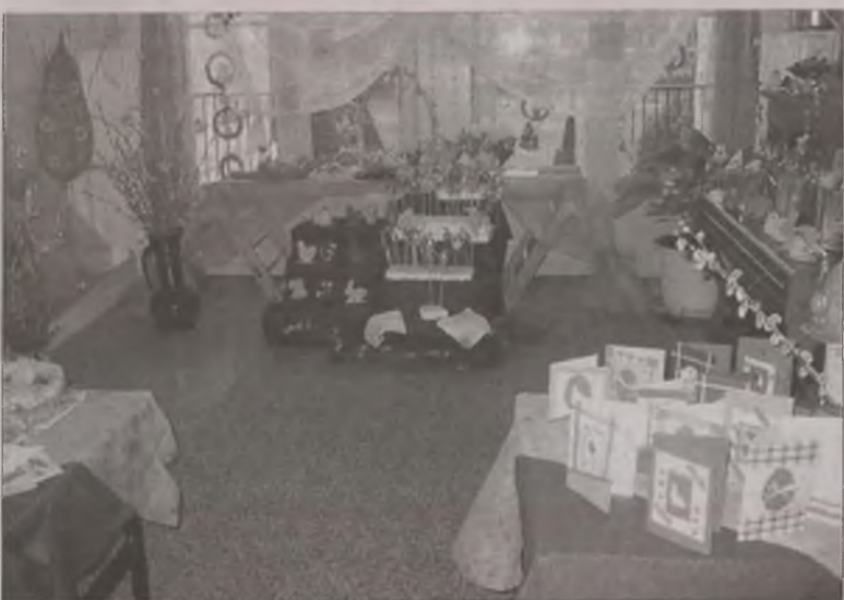
W przedszkolu na kupców czekają pisanki, kraszanki, baranki, kurczaki i inne ozdoby świąteczne.

gały wzrok każdego, kto odwiedza przedszkolne progi, ale także bardzo dobrze się sprzedają. Ten okazjonalny kiermasz jest próbą poszukiwania nowych i ciekawych sytuacji edukacyjnych, które zaspokajają dziecięcą ciekawość i dociekliwość. Przygotowania do kiermaszu pomagały aktywizować wyobraźnię twórczą dzieci oraz zachęcały do współpracy rodziców i opiekunów. Wszystkie znajdujące się na stoisku kiermaszowym ozdoby