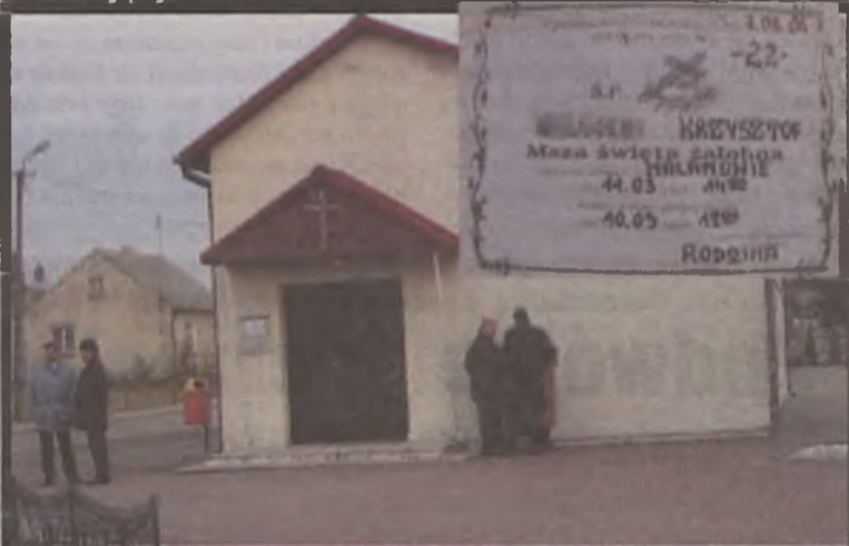
W czwartek, 11 marca odbył się pogrzeb 22-latką. Czy potrzebna była śmierć młodego człowieka, by policja poważnie potraktowała narkotykową przestępczość w gminie Malanów?

Na trzy miesiące trafił do aresztu 19-letni mieszkaniec Malanowa, podejrzewany o posiadanie narkotyków, ich sprzedaż i namawianie do zażywania. Areszt jest wynikiem intensywnych działań policji po tym, jak 22-letni mieszkaniec Malanowa śmiertelnie przedawkował środek odurzający.