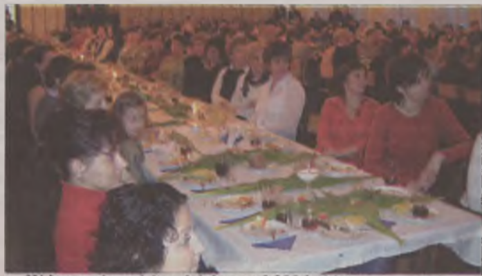
W imprezie wzięło udział ponad 200 kobiet