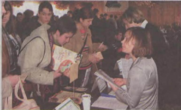
Największym zainteresowaniem cieszyło się stoisko oferujące pracę za granicą.

smucilo wiele zainteresowanych pracą kobiet. Mężczyznom oferowano m.in. pracę murarza, malarza, brukarza, stolarza, magazyniera i kierowcy. Kobietom z kolei oferowano pracę na stanowiskach: księgowej, kadrowej, szwaczki i kasjerki. To było głównym powodem niezadowolenia młodych wykształconych i nadal poszukujących pracy kobiet: -Niestety, mimo wielu ofert nie znalaz-