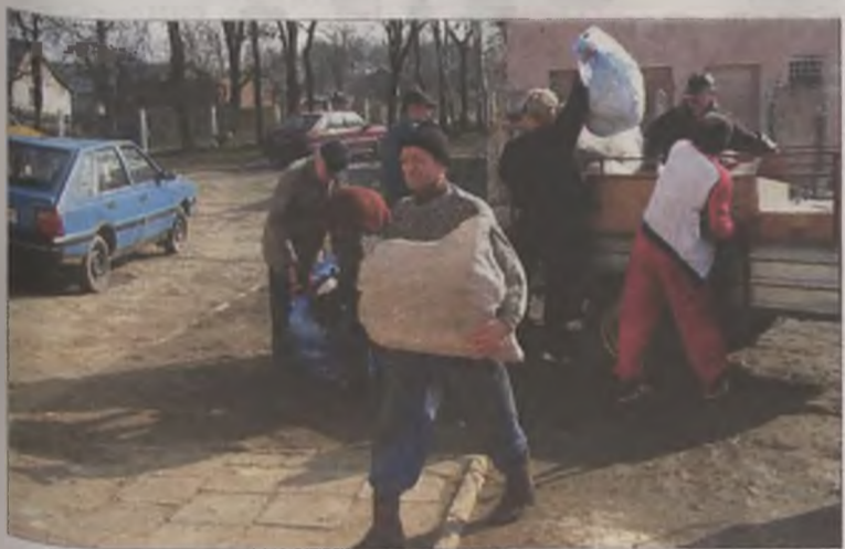
„Barkowicze” są wdzięczni za każdą ofiarowaną pomoc

„Barkowicze” od czasu pożaru otrzymali materiały budowlane, drzwi i okna, kable elektryczne, odzież, żywność i pieniądze. Jednak to wszystko jest kroplą w morzu potrzeb. Dlatego, wszyscy cały czas wierzą, że pomoc materialna będzie nadal napływać. – Głównie potrzebne są materiały budowlane, jak wapno i cement, niezbędne przy dalszym remoncie – mówi pan Sławomir i dodaje: – Będziemy wdzięczni za każdą pomoc. MJ