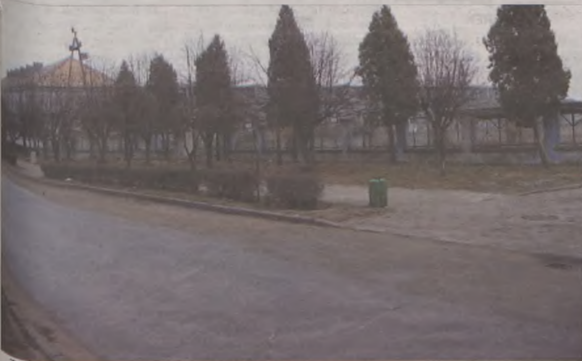
Turkowie zastanawiają się czy Kaliska z „Plusem” nie oznacza aby dużego minusa dla całego miasta

Dotychczas turkowską opinię publiczną bulwersowała zapowiedź powstania hipermarketu sieci KAUFLAND. Zwolennikami tego pomysłu wydają się być niektórzy działacze turkowskiego SLD i obecne kierownictwo PKS. Tymczasem okazuje się, że szybciej turkowski rynek mogą podbić dwa inne sklepy sieciowe – należące do grupy PLUS i NETTO. Gdyby wspomniane zamysły miały się zmaterializować, wówczas realną staje się przepowiednia naszego młodszego kolegi, w myśl której Turek stanie się wkrótce nie tylko „miastem emerytów, ale i supermarketów”.