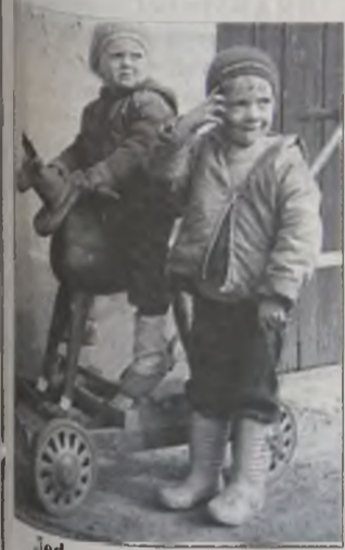
Jedna z wystawowych fotografii

Wystawę dopełniają nostalgiczne zdjęcia obrazujące dziecięce zabawy. Zabawki możemy oglądać do połowy kwietnia. Warto wybrać się ze swoimi pociechami, przypomnieć sobie własne dzieciństwo i pokazać najmłodszym, czym i jak się bawiono, kiedy nie było lalek Barbi i klocków Lego DS