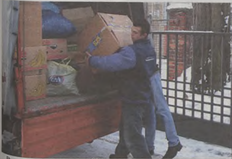
Przywiezione dary trafią do dzieci i podopiecznych ośrodka pomocy społecznej