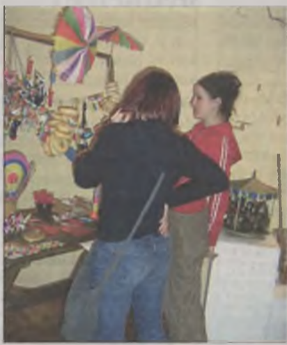
W muzeum pokazano także kolorowy jarmarczny stragan