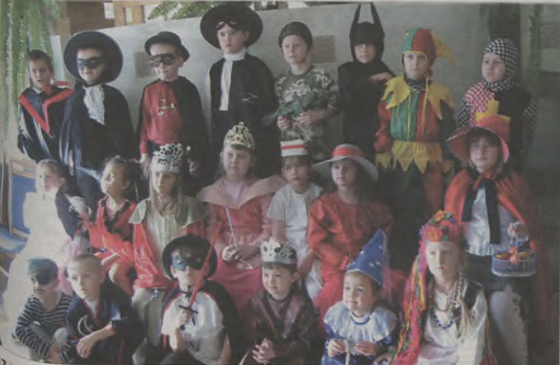
17 lutego 2004 r.

chłopców najpopularniejszy był Batman, Zorro i strój Indianina. Oprócz nich w zabawach karnawałowych udział brały kotki, bo-