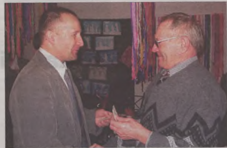
Krwiodawcy podzielili się opłatkami.