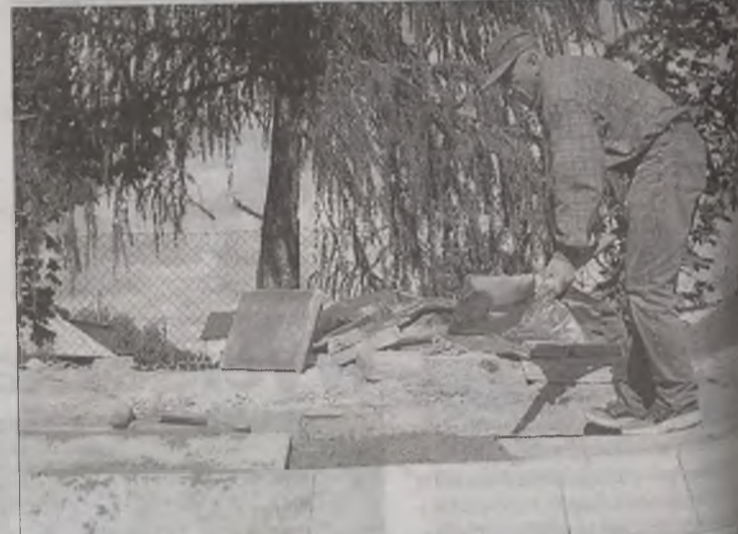
Osoby zatrudnione w ramach robót publicznych wykonały potrzebnych prac na terenie gminy. Głównie były to prace konserwatorsko-remontowe, ale również porządkowe.

Co ciekawe, w roku 2002 na władze gminy Władysławów na walkę z bezrobociem, poprzez prace publiczne i interwencyjne, przeznaczono zaledwie 22.201 złotych. Z kolei w roku ubiegłym na ten sam cel przeznaczono 55.212