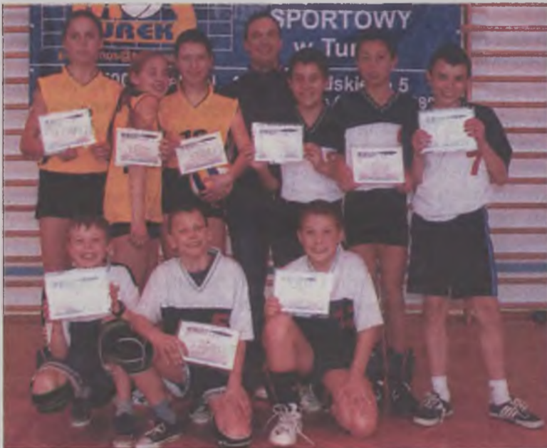
Zawodnicy z Tuliszka ....