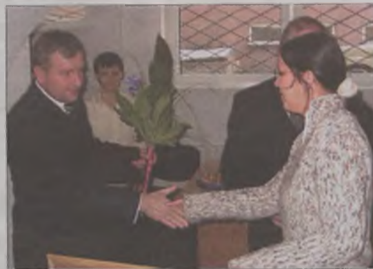
Przedstawiciele Przykony, gdzie powstało pierwsze w powiecie Gminne Centrum Informacji, podarowali kolegom z Władysławowa funkcjonalną tablicę korkową.