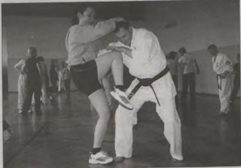
Tak panie szkoliły się podczas pierwszej edycji szkolenia.

Co ma wpływ na podjęcie takiej decyzji. Trudno określić to jednoznacznie. Z relacji uczestniczek pierwszej edycji szkolenia, która miała miejsce w miesiącach luty – marzec 2003 roku wynika, że panie chcą nabyć takie umiejętności, które pomogłyby im w sytuacji zagrożenia. Z policyjnych statystyk wynika, że kobiety najczęściej stają się ofiarami kradzieży kieszonkowych np. w sklepach i na targowiskach, kradzieży zuchwałych pieniędzy i torebek np. na uli-