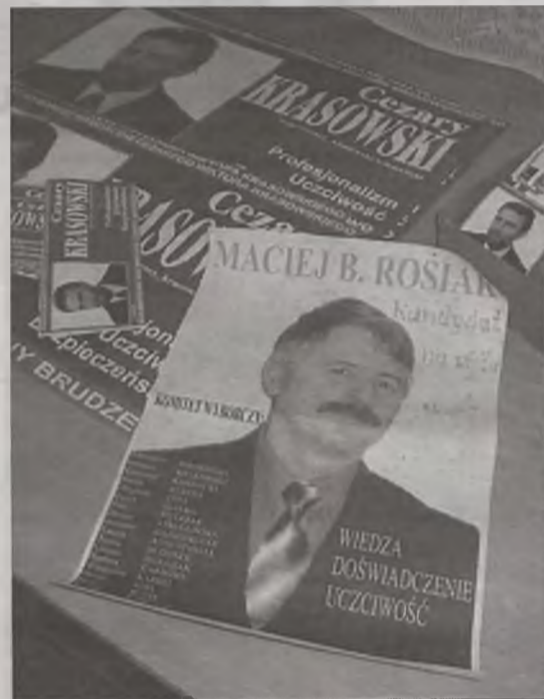
Jak widać na dobre rozpoczęła się rywalizacja o fotel wójta gminy Brudzew. Na początek „plakaty zostały rzucone”.

I na koniec, dwaj bodaj główni rywale do fotela wójtowskiego w Brudzewie. W gminnej polityce taka