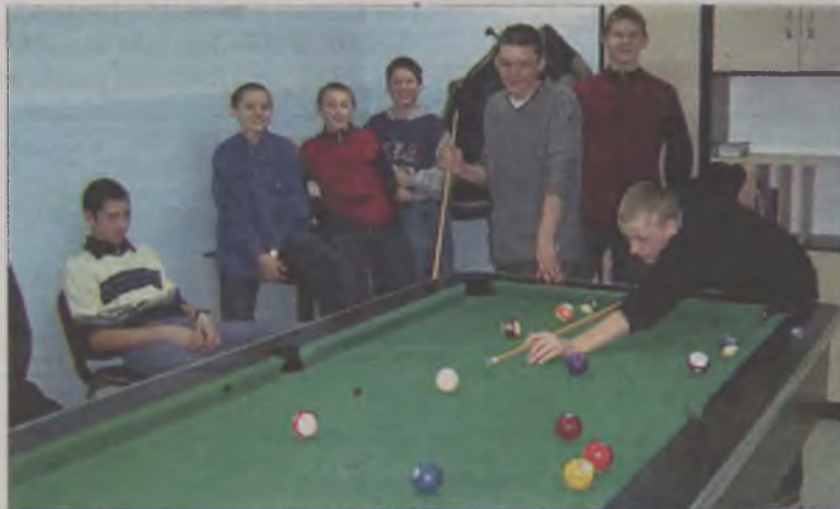
Duże wzięcie miał bilard

Poza tym OUK zorganizował wyjazd na turkowską krytą pływalnię. Odbyły się także zajęcia plastyczne. Grano w szachy, warcaby i bilarda, Oblegane wręcz było Gminne Centrum Informacji. Dzieci zmagaly się z komputerowymi przeciwnikami i buszowały w internecie. (can)