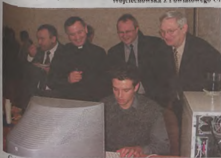
Czterdziestolatkom pozostało kibicowanie specem od informatyki.

Spotkanie opłatkowe połączone z wręczeniem odznaczeń i jednocześnie kończące obchody 20-lecia, odbyło się w niedzielę, 25 stycznia w Środowiskowym Klubie Honorowych Dawców Krwi im. Kardynała Stefana Wyszyńskiego Prymasa Tysiąclecia przy parafii św. Barbary w Turku.