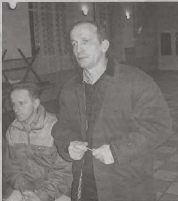
Mieszkańcy Janiszewa chcieli dowiedzieć się m.in., jak kandydaci widzą problemy miejscowych rolników.

Ordon z partii Samoobrona. No i rzecz jasna kto w tej reducie będzie oprócz głównego bohatera jeszcze podpałał lonty? Czyli kto gra w „drużynie” Ordon?