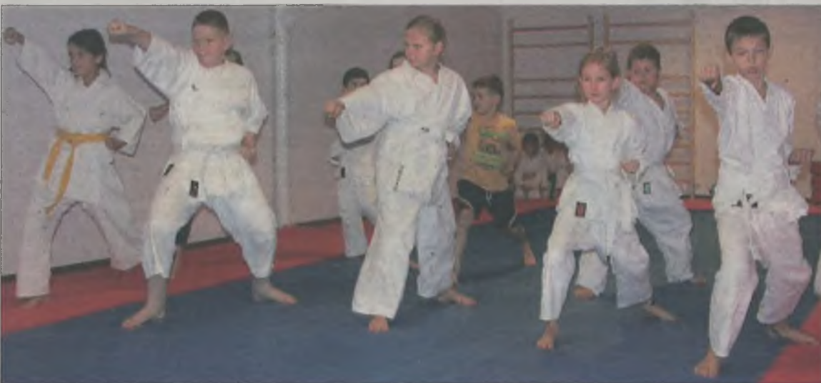
Trening na nowej sali.

karatecy zaprezentowali swoje umiejętności, a zarazem możliwości treningowe, jakie stwarza im nowa sala. (art)