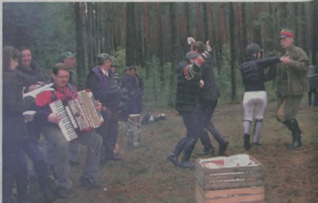
Po gonitwie, przy hubertusowym ognisku do późnych godzin popołudniowych jedzono, śpiewano i tańczono.