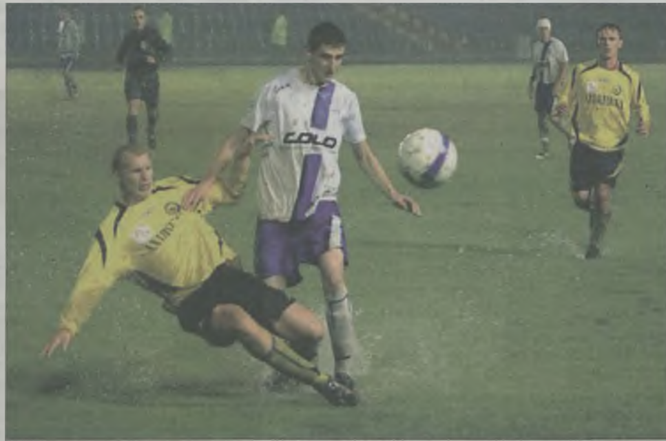
W Gdyni murawa tonęła w wodzie i grać było niesłychanie trudno.

Po meczu z gdyńskim Bałtykiem optymiści powiedzą, że to trzeci mecz z rzędu bez straconej bramki. Pesymiści - że po raz drugi z kolei nie udało się pokonać bramkarza rywali. Niemniej jednak bezbramkowy remis na bardzo trudnym terenie jest wynikiem korzystnym. Tym bardziej, że ten mecz przypominał bardziej zawody piłki wodnej niżli czysto piłkarskie widowisko.