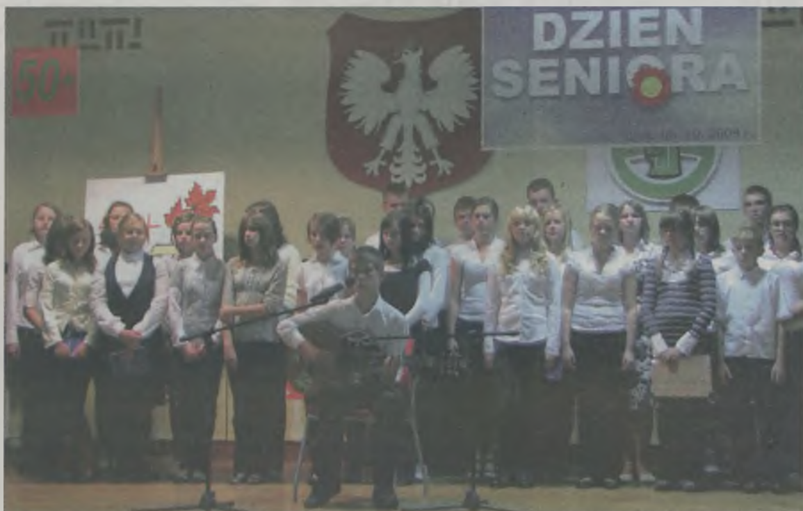
Podczas imprezy wystąpili uczniowie z Gimnazjum nr 2 w Turku.