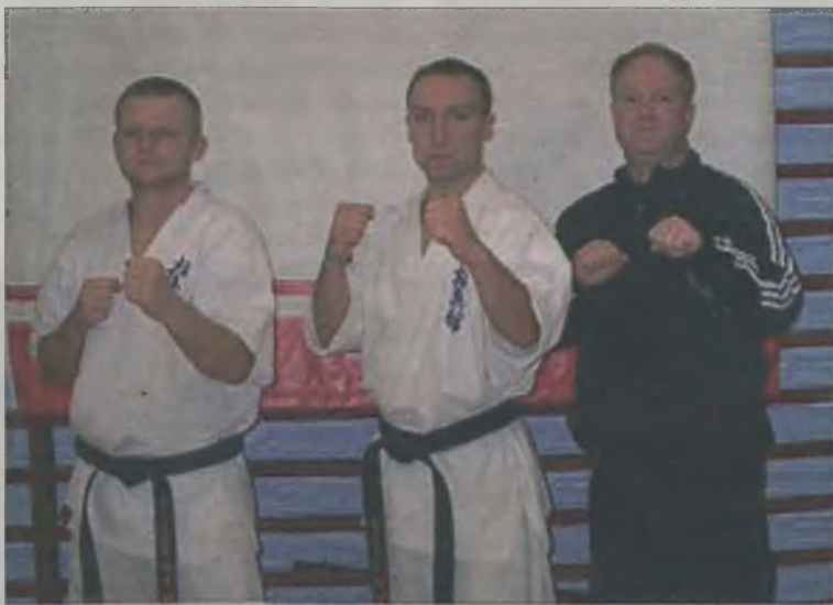
Turkowscy szkoleniowcy uczestniczący w seminarium w Wałczu.

Spotkanie w Wałczu było też okazją do podsumowania startu kadry PFKK na Mistrzostwach Świata Kyokushin w Budapeszcie, a także przygotowania kalen-