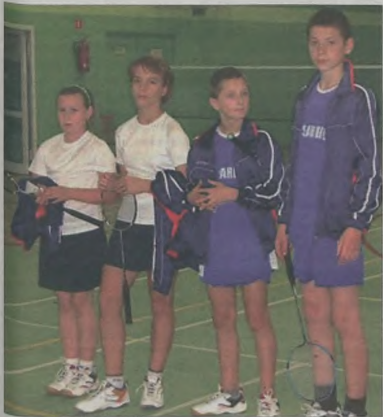
Badmintoniści z Sarbic.

Badmintoniści z Sarbic po raz pierwszy startowali w Solcu. Wywieźli stamtąd bardzo pozytywne wrażenia. Chwałą organizatorów za stworzenie bardzo dobrych warunków oraz miłej, życzliwej atmosfery. Podobało się im również 15 tysięczne miasto z historią sięgającą XIII wieku. (art)