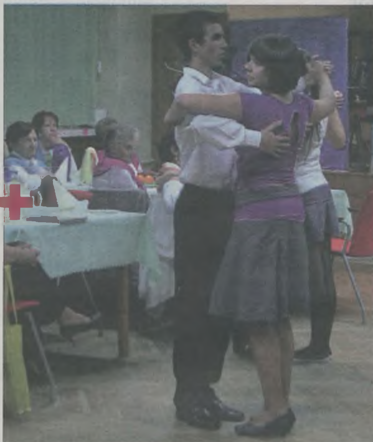
Oglądane na żywo układy taneczne bardzo podobały się seniorom.

Dzień Seniora był dobrą okazją do wręczenia nagród w konkursie