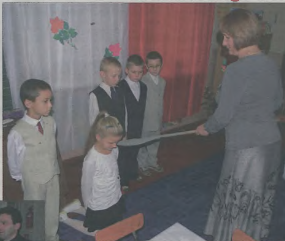
Dyrektor Polasińska pasował maluchów na pełnoprawnych uczniów.

szóstkę i uznali, że dzieci zasługują, aby pasować je na pełnoprawnych uczniów. Dokonała tego pani dyrektor dużym piórem ze stalówką. Następnie już uczniowie odbili odciski wskazującego palca pod aktem pasowania. Ich rodzice podpisali się obok.