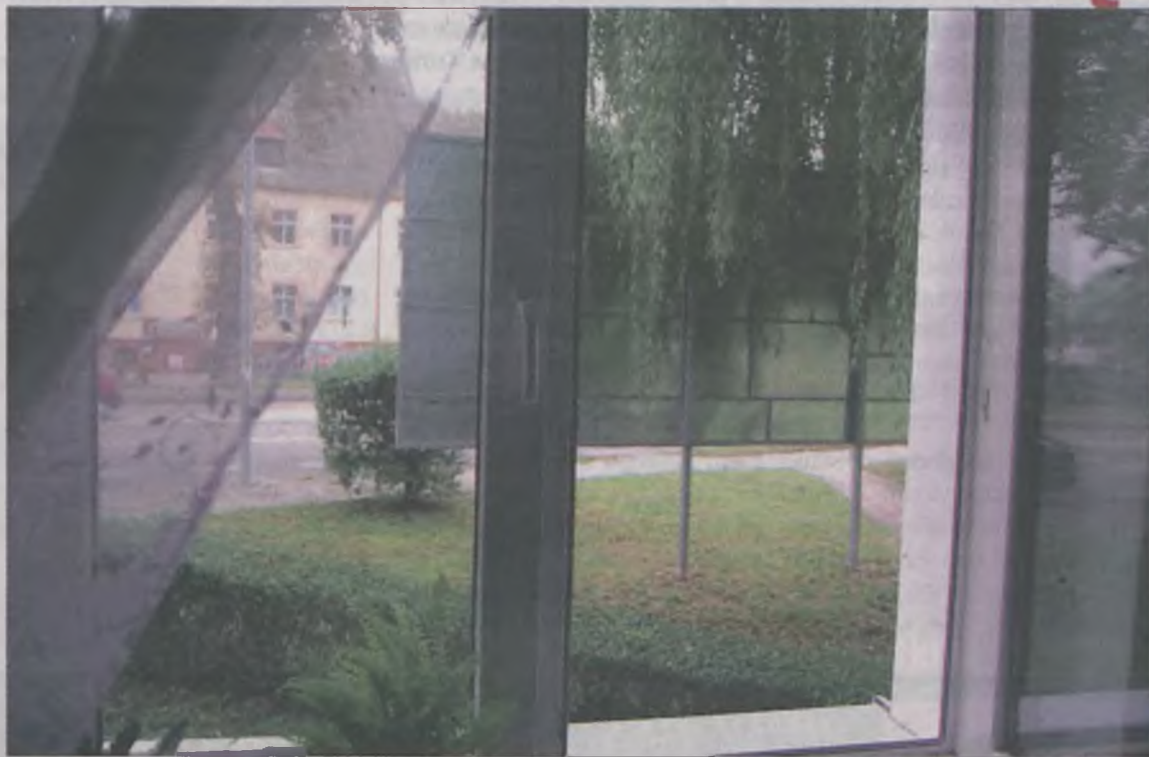
Taki widok z okna ma mieszkająca na parterze turkowianka.

– Ta reklama jest zbyt duża i ustawiono ją dokładnie na wprost