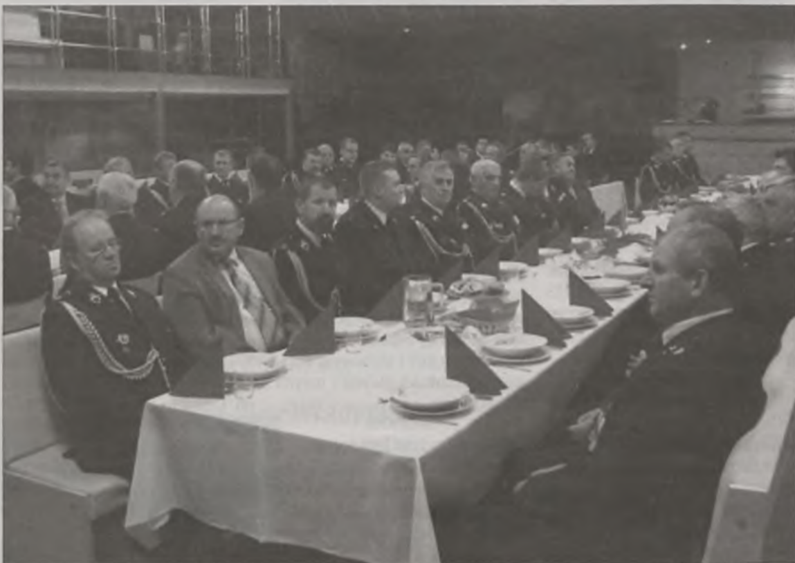
Przy wspólnym stole

W strażnicy Ochotniczej Straży Pożarnej w Tokarach w Gminie Kawęczyn odbyło się coroczne spotkanie opłatkowe powiatowe-ego aktywu strażackiego.