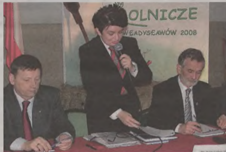
Podczas Forum Rolniczego we Władysławowie

Planuję otwarcie w moim biurze poselskim bezpłatnego punktu konsultacyjnego, gdzie będzie można uzyskać pomoc w wypełnianiu wniosków o dopłaty bezpośrednie. ITZ