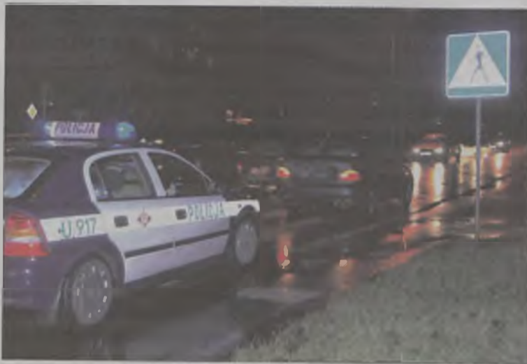
Przejście dla pieszych przy ul. Uniejowskiej jest niebezpieczne.

52-letni turkowiec ze złamaną ręką trafił do szpitala, po tym jak na przejściu dla pieszych przy ul. Uniejowskiej potrafił go hundai accent.