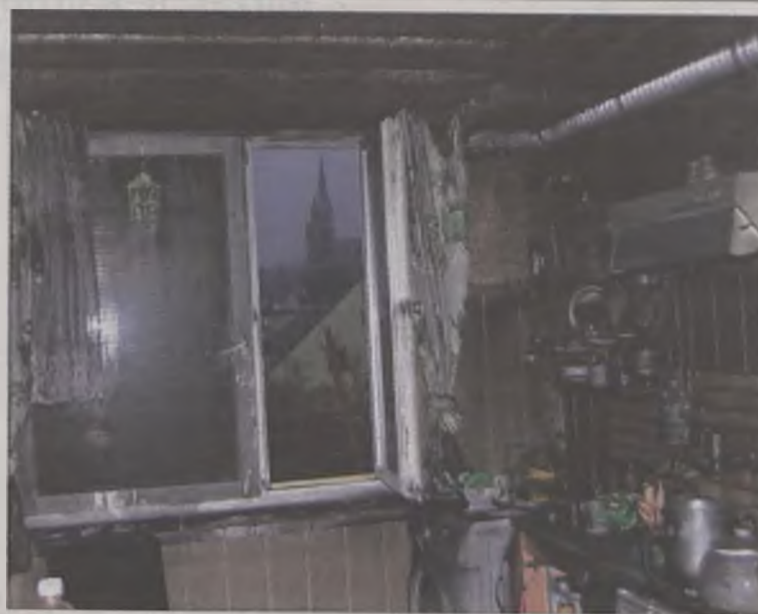
Wypalona kuchnia, okno, naczynia. Nic nie nadaje się do użytku...

Według strażaków przyczyną pożaru mogło być zwarcie instalacji elektrycznej. Nikt z lokatorów nawet się temu nie dziwi, gdyż nie była ona wymieniana odkąd pobudowano blok, czyli od około czterdziestu lat. Lokatorzy mieszkający w bloku boją się włączyć czegokolwiek do gniazdka, bo po włożeniu wtyczki pojawiają się w nim iskry. -W piwnicy jest jeszcze gorzej, nie możemy zapalić światła