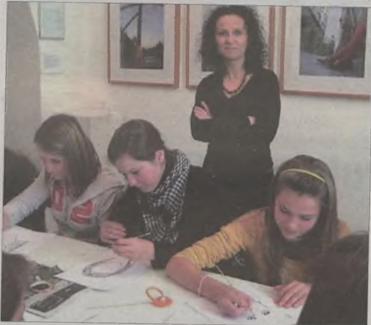
Rysowanie patyczkiem umaczanym w tuszu jest niezwykle trudne.