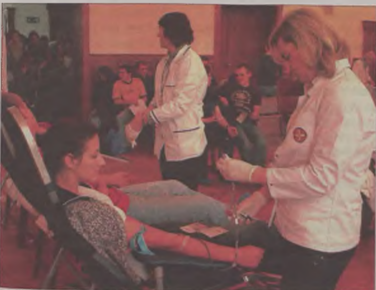
Honorowo oddało krew 149 uczniów liceum.

-Chcemy oddać krew, bo sami możemy jej w każdej chwili potrzebować – tłumaczyli uczniowie Liceum w Turku stojąc tłumnie pod szkolną aulą. Tam właśnie rozstawiono aparaturę do badania i pobierania krwi. 5 grudnia prawie 150 z nich oddało ten ratujący życie płyn.