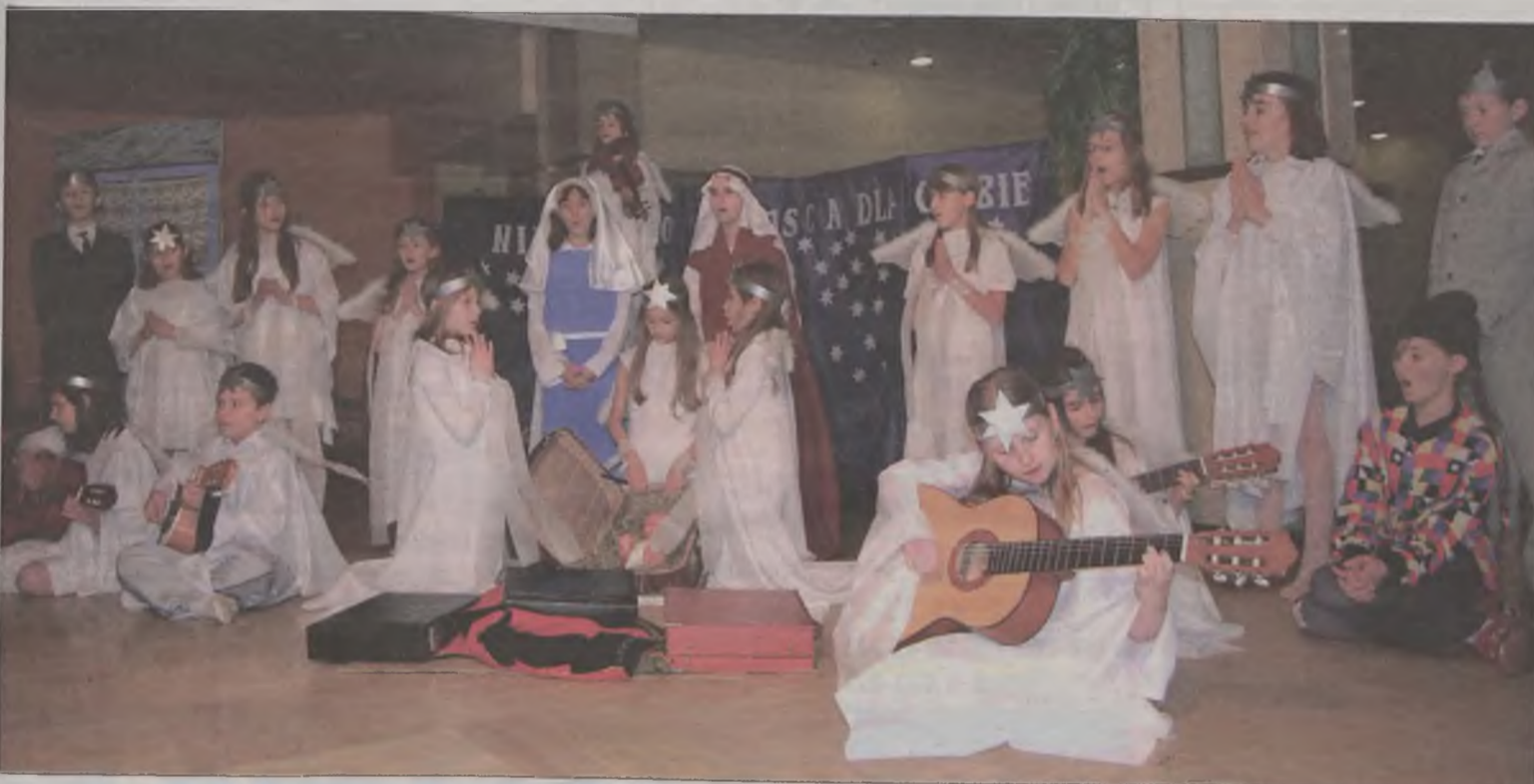
Uczniowie ze Szkoły Podstawowej we Władysławowie przygotowały bożonarodzeniowe jasełka.

skrzypcach. Kilkoro z uczniów zagrało także na gitarach. Zebrani usłyszeli także w wykonaniu zespołu „Turkowanie” pod dyrekcją Radosława Daruła.