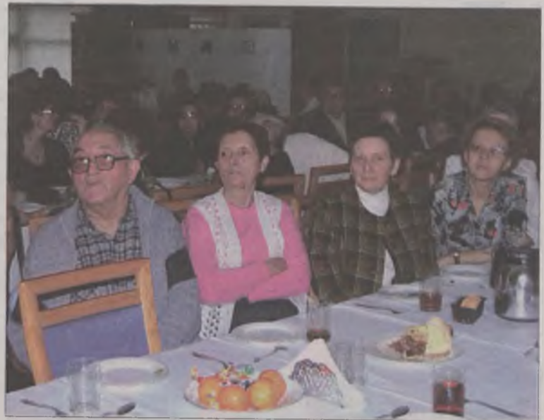
W spotkaniu wzięło udział ponad sto osób.

nak ich interpretacja była nieco inna niż ta tradycyjna. Dzieci pokazały zebranym, jak ich zdaniem wyglądało by, gdyby Jezus przyszedł na świat w obecnych czasach. Maluchy do spektaklu przygotowały się bardzo solidnie. Widać było, że stroje, w których wykonanie włączyli się rodzice, zrobiono z wielkim zaangażowaniem. Po przedstawieniu, które publiczność nagrodziła gromkimi brawami, przyszedł czas na wspólne odśpiewanie kolęd. Podczas śpiewania „Lulajże Jezuniu”, jedna z uczennic zagrała na