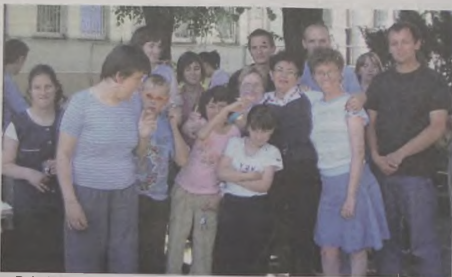
Dzieci ze Specjalnego Ośrodka Szkolno-Wychowawczego w Słupcy.

Myszę, że warto powiedzieć o wycieczkach goszczących w Sejmie (uczniowie gimnazjów, liceów, techników, studenci, nauczyciele, członkinie Kół Gospodyń Wiejskich, samorządowcy, osoby prywatne). Odwiedziło mnie ponad 400 osób. To ważne edukacyjne spotkania. Można spotkać polityków z pierwszych