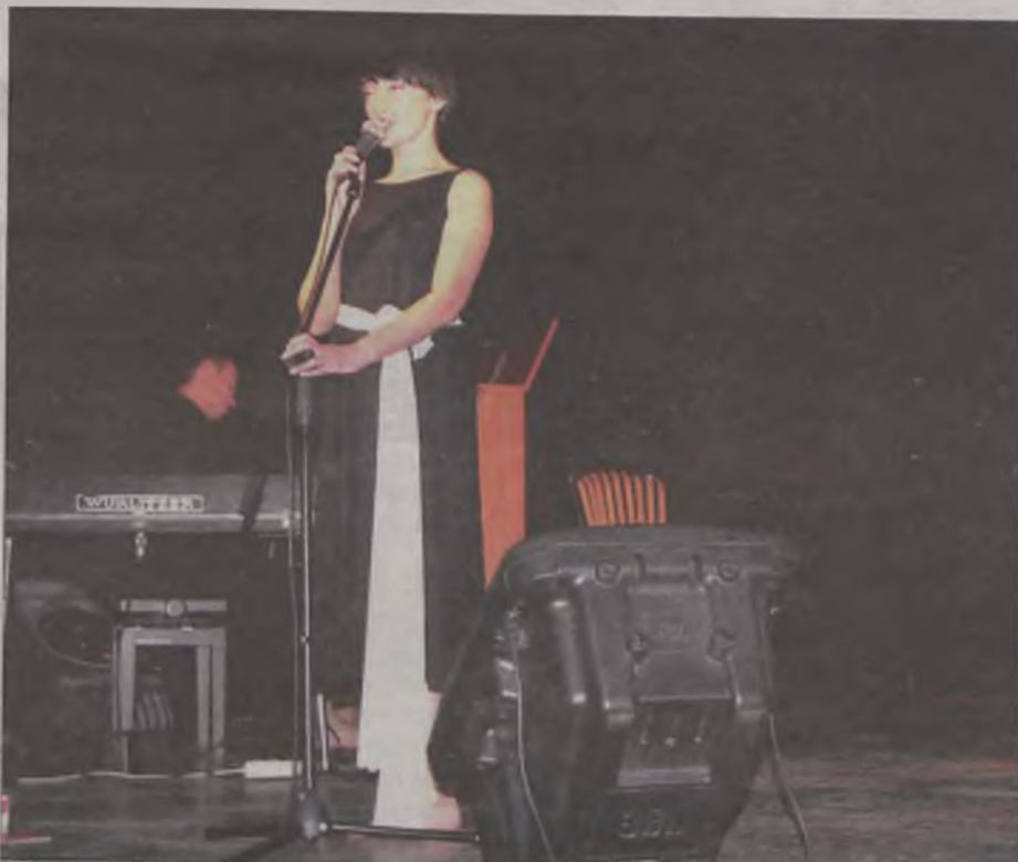
Katarzyna Groniec na scenie turkowskiego MDKu promowała piosenki z najnowszej płyty „Na żywo”.

Miejski Domu Kultury w Turku gościł wiele gwiazd. Ostatnią, która stanęła na jego scenie była Katarzyna Groniec. Publiczność, która wypełniła salę po brzegi uwielbia tę eteryczną piosenkarkę zarówno za jej głos, jak i talent aktorski. Podczas koncertu artystka promowała swój najnowszy album „Na żywo”.