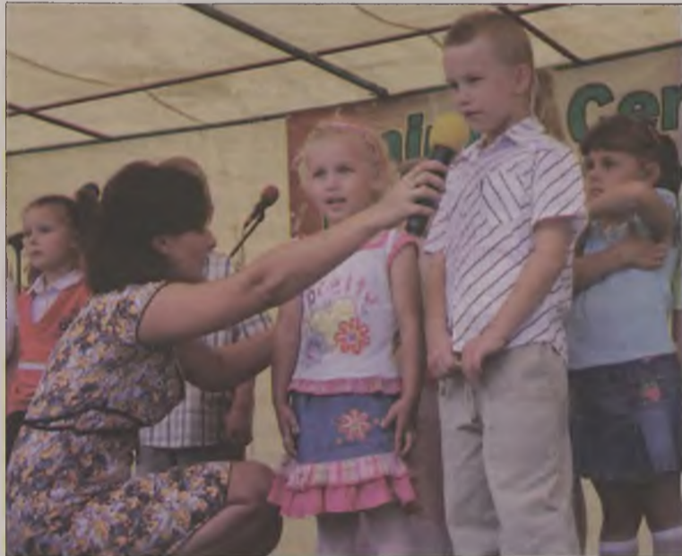
Dzieci z miejscowego przedszkola przygotowały dla zebranych piosenki i wierszyki.

Była także możliwość zwiedzania przepięknego budynku Środowiskowego Domu Samopomocy, który powstał trzy lata temu. Obecnie w domu przebywa dziesięciu podopiecznych. Kadra ŚDS-u liczy pięć osób: kierownik, terapeuta, dwóch instruktorów terapii oraz pracownik gospodarczy. Każdego dnia podopieczni mają możliwość udziału w zajęciach terapeutycznych, które odbywają się w pracowniach: kulinarnej, plastyczno-artystycznej, krawieckiej i stolarsko-ogrodniczej. Wspólne zajęcia dają poczucie bezpieczeństwa i pewności siebie, ale przede wszystkim uczą zaufania wobec siebie, a także radzenia sobie w trudnych sytuacjach. Każdy, kto chciałby się o tym przekonać może zawitać w otwarte progi Środowiskowego Domu Sa-