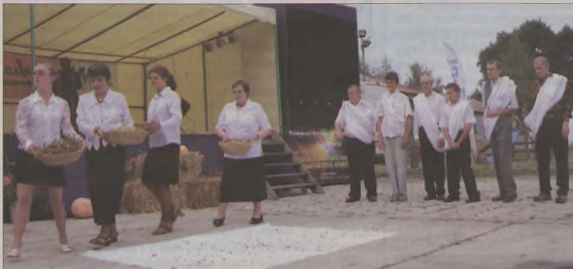
Podopieczni Środowiskowego Domu Samopomocy.

wem a Zdieszowicami rozpoczęła się w roku 1997. Wtedy mieszkańcy gminy Malanów pośpieszyli z pomocą mieszkańcom wsi Januszkowie w gminie Zdieszowi-