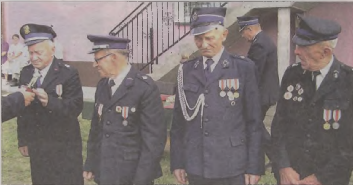
Uhonorowano czterech weteranów z 50 letnim stażem.

twiński) nie kwapiły się do tego, a wręcz utrudniały strażacką inicjatywę. Dopiero w 1975 roku otrzymali pozwolenie na budowę oraz działkę. Otwarcie strażnicy nastąpiło w 1982 roku. Dopiero po 1990 roku, kiedy władzę w gminie objęły demokratycznie wybrane władze samorządowe, rozpoczęły się tłuste lata dla jednostki w Kawęczynie. Jako pierwsza w gminie, a jednocześnie jedna z pierwszych w powiecie tureckim, włączona została do krajowego systemu ratowniczo-gaśniczego. Teraz posiada dwa dobrze wyposażone samochody bojowe i grono przeszkolonych strażaków.