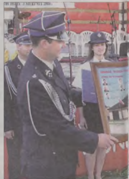
Burmistrz podarował obraz.