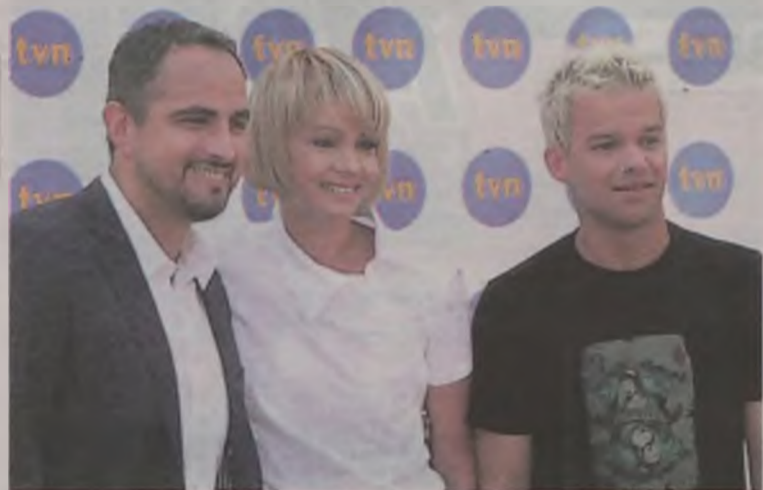
Na konferencji nie mogło zabraknąć jurorów „You Can Dance”