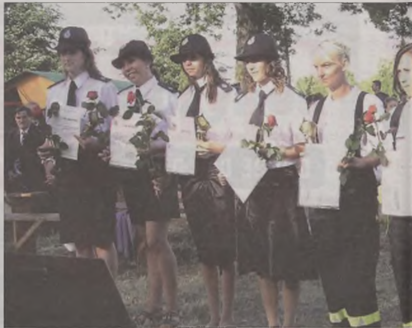
Druhnym z Mikulic uhonorowano statuetkami i kwiatami