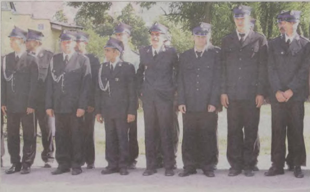
Dzielni strażacy z Mikulic.

Wokół placu Pod Dębem rozlokowały się stoiska gastronomiczne i handlowe. Tradycyjnie nie brakowało grochówki i kiełbasy z rożna. Szereg atrakcji przygotowano dla dzieci. Można też było obejrzeć gablotę z odznaczeniami, otrzymanymi przed laty przez strażaków z OSP Mikulice oraz wystawę części dyplomów za udział w zawodach sportowo-pożarniczych.