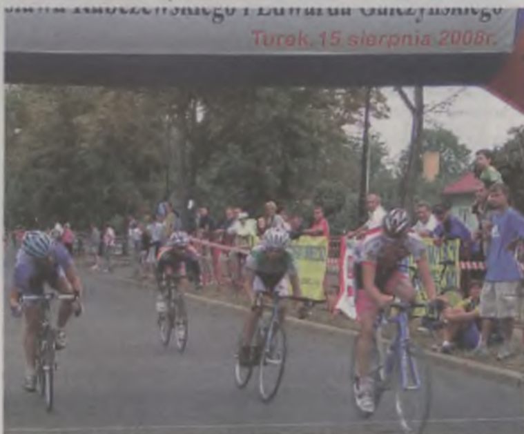
Żak Walka o punkty na punktowanym okrążeniu

klistów w Turku składa serdeczne podziękowanie sponsorom wyścigu: KWB Adamów S.A., Sintur, Andrewex, Auto części Mercedes - Daf - Man, Tur - Stal Bis, Elektrokabel, Drewtur, sklep rowerowy „IMP” ul. Kaliska, Towarzystwa Ubezpieczeniowe „Ergo Hestia” oddział w Turku, TECH - Dom sklep rowerowy ul. Mickiewicza, Jacek Wzorek, Zakład Obróbki Szklą i Metalu - Marek Stasiak, Zakład Murarski - Ryszard Włodarczyk. W kategorii młodzik, junior, junior, wyścigi rozgrywano na punkty, co 4 okrążenie było punktowane 5, 3, 2, 1 na „kresce”, a pozostałe okrążenia punktowano na „kresce” 2 pkt, 1 pkt. Punktacja w kategorii „open” była taka sama jak w kategoriach młodzieżowych. Zwycięzcą wyścigu został zawodnik z największą ilością punktów. O zwycięstwie w kategorii „zak” decydowała kolejność na mecie wyścigu. Łącznie w kryterium kolarskim wystartowało 180 zawodników. RB