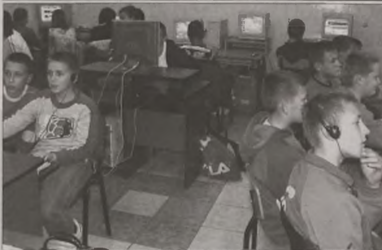
Podczas zajęć z informatyki.