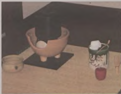
Utensylia używane w ceremonii parzenia herbaty.

„By wejść do środka pokoju herbacianego, trzeba wśliznąć się przez małe drzwiczki, nijiriguchi. Oddzielony tylko jedną deską drzwi, wewnątrz oczekuje inny świat, daleki od popolitości. W pokoju unosi się nie wiadomo skąd dochodząca woń kadzidła, a woda w kociołku gotuje się, szumiąc. niczym wiatr wśród sosen. We wnęce wisi kaligrafia, z której można odczytać to, co gospodarz chce przekazać gościowi, albo też stoi ukwiecona gałązka, kojarzą-