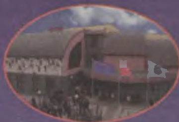
Gmach Collegium Novum

BIURO REKRUTACJI PWSZ w Kaliszu ul. Nowy Świat 4, 62-800 Kalisz tel. 0-62 76 79 566; e-mail rekrutacja@pwsz.kalisz.pl