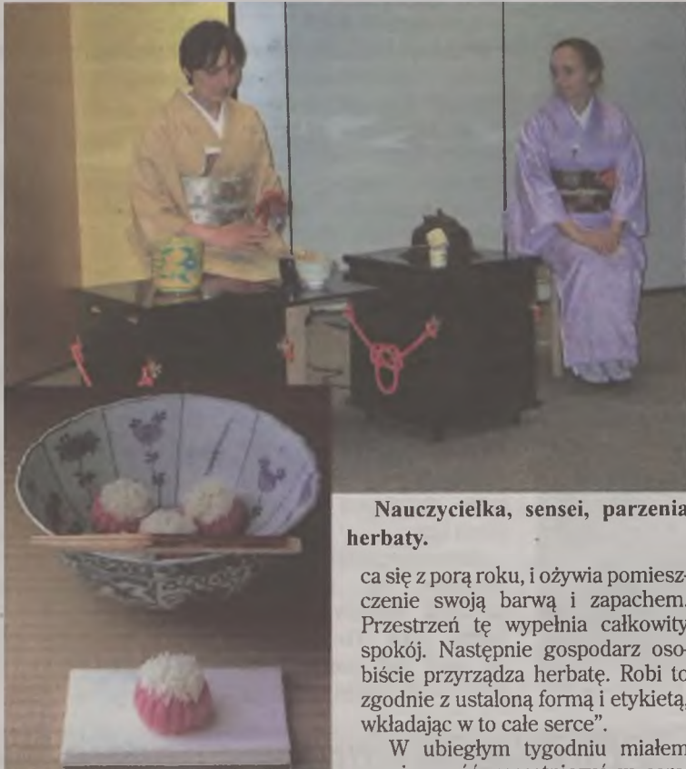
Nauczycielka, sensei, parzenia herbaty.

W 1940 roku powstało Stowarzyszenie Urasenke, łączące grupy poznające drogę herbaty według