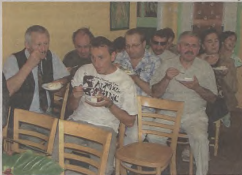
Jak to bywa na urodzinach, zwłaszcza tych okrągłych, nie może zabraknąć tortu.

usprawnienie i usamodzielnienie podopiecznych. Jednym z założeń domu, co udało się znakomicie, było stworzenie warunków nie tylko do terapii i rehabilitacji, ale też miejsca, gdzie podopieczni czują się potrzebni i akceptowani.