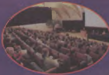
Aula w Collegium Novum