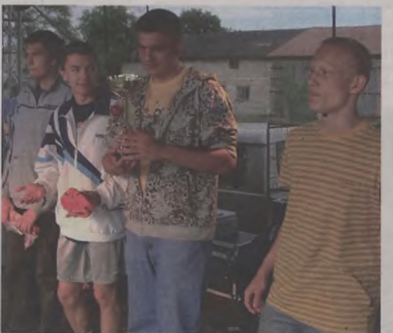
Zwycięska drużyna kolorowych woźniców.

najniższym stopniu podium stanął doński „Drink Team”, który wygrał dwa mecze.