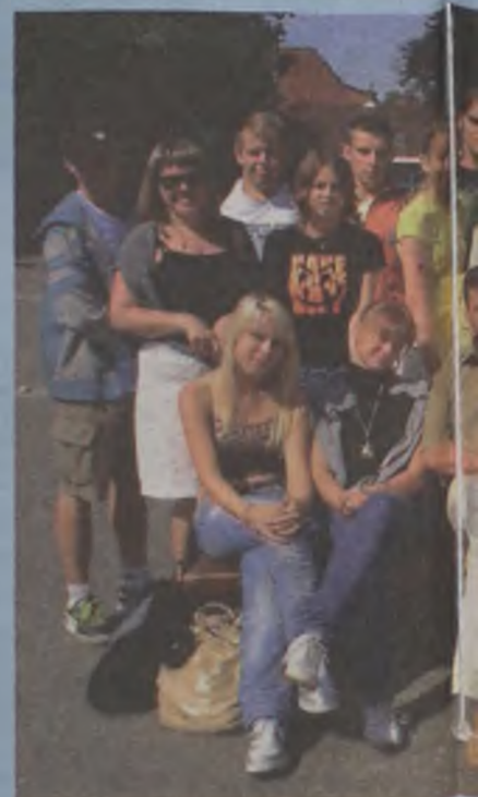
Dla turkowskich gimnazjalistów... ponieważ z niemieckimi rówieśnikami

Po II wojnie światowej dobudowano do remizy łaźnię miejską.