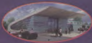
Wizualizacja krytej pływalni w kampusie studenckim