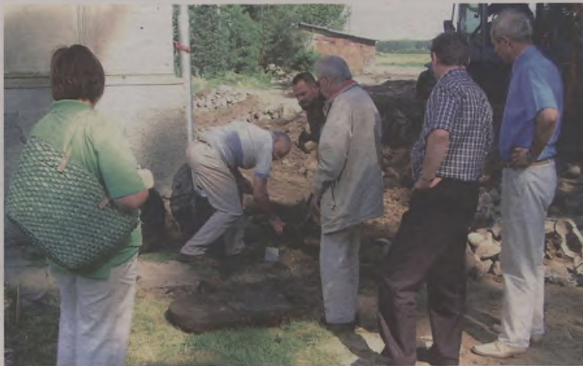
Robotnicy odkrywają pierwsze macewy

* Bejsojlem - w języku jidysz cmentarz żydowski