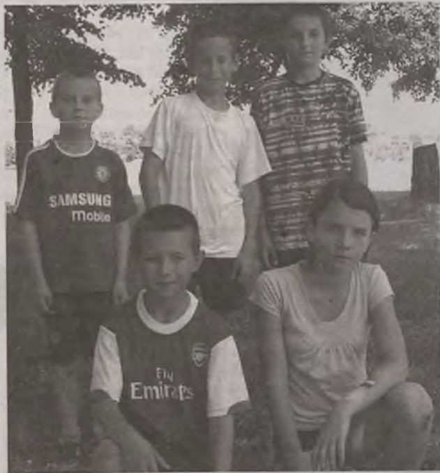
Mistrzynie Szkolnej Ligi Piłkarskiej w Dziadowicach