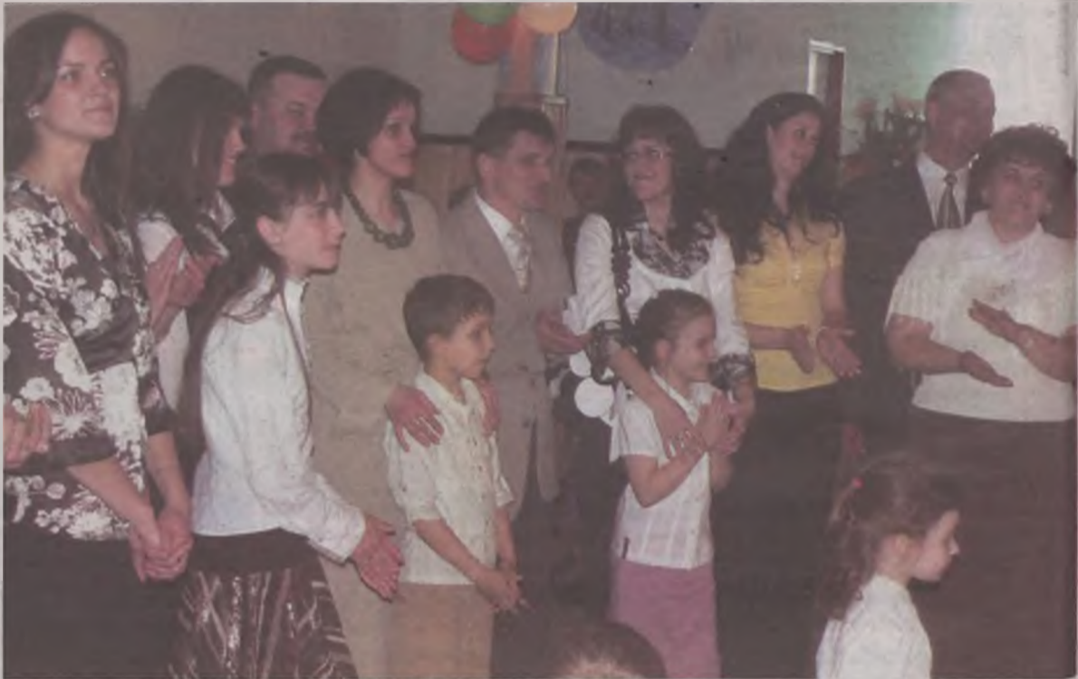
Podczas spotkania rodu nie mogło zabraknąć prezentacji rodzin.