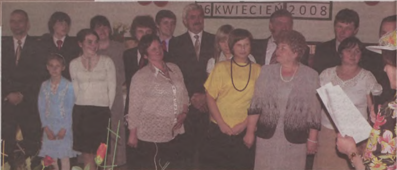
Można było sobie zrobić pamiątkowe zdjęcie. Takie spotkanie to dobra okazja do zebrania wszystkich członków rodziny.

W oczach niektórych pojawiły się łzy. Spotkanie po niekiedy tak wielu latach, to naprawdę wielkie przeżycie. Tym bardziej, że na co dzień wielu członków rodziny mieszka w odległych krańcach Polski, a nawet Europy. W sobotę była okazja, by się bliżej poznać, porozmawiać, powspominać i po prostu wspólnie pobawić. mar