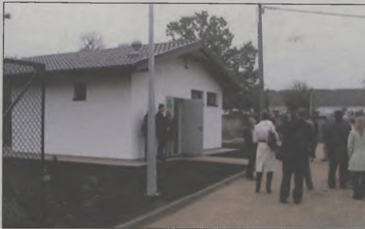
Odbiór nowej oczyszczalni ścieków w ZSR CKP w Kaczkach Średnich

Jednym z zadań Wydziału Rolnictwa, Leśnictwa i Ochrony Środowiska jest prowadzenie Powiatowego Funduszu Ochrony Środowiska i Gospodarki Wodnej, z którego finansowane są przedsięwzięcia związane z ochroną przyrody. W minionym roku ze środków funduszu zrealizowano wiele inwestycji, które łącznie przekroczyły kwotę 3 mln zł. Wśród nich najdroższą okazała się budowa oczyszczalni ścieków, a wraz z nią modernizacja i budowa nowej sieci kanalizacji sanitarnej dla Zespołu Szkół Rolniczych Centrum Kształcenia Praktycznego w Kaczkach Średnich (1,6 mln zł).