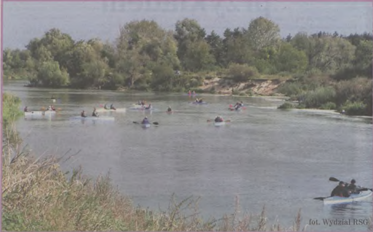
fol. Wydział RSG

W minionym roku działania Wydziału Rozwoju Społeczno-Gospodarczego były skierowane na promocję aktywnego wypoczynku. Zorganizowaliśmy, lub współorganizowaliśmy szereg imprez o charakterze turystycznym, sportowym, jak i kulturalnym.