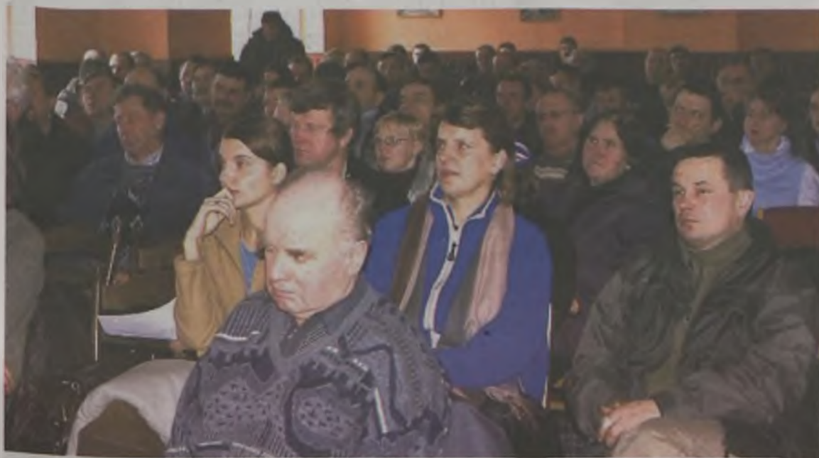
Sala Domu Kultury wypełniła się po brzegi

- przedstawiciel WODR na gminę Dobra, poinformował rolników o kolejnych planowanych przez niego szkoleniach dotyczących między innymi nowoczesnej uprawie ziemniaków i zbóż, rolnictwu ekologicznemu i programom rolno-środowiskowym. Zaprosił jednocześnie rolników do równie licznego udziału w nich. (can)