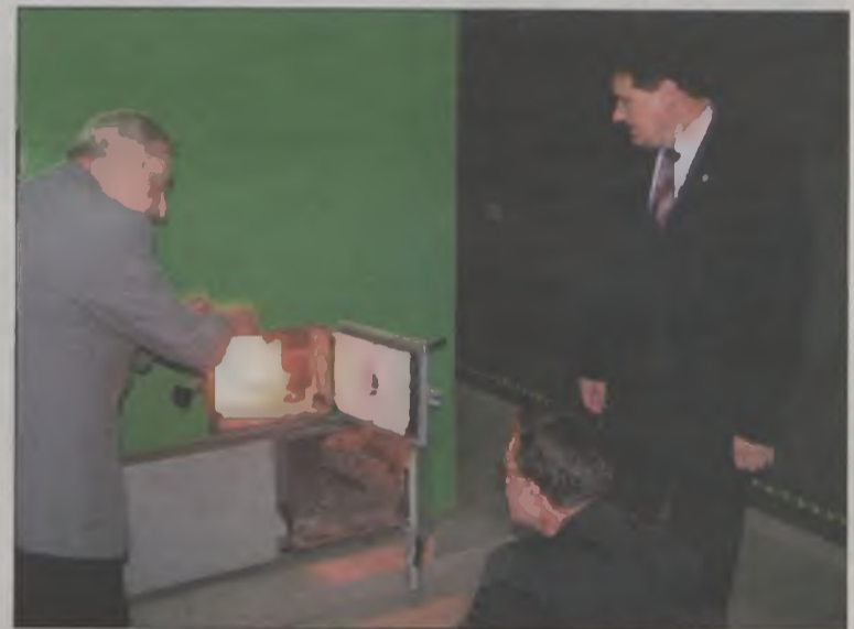
Zainstalowany kocioł grzewczy

W roku 2007, również ze środków funduszu, dokonano wymiany kotłów grzewczych w Domu Pomocy Społecznej w Skęczniewie i był to pierwszy etap prac. Inwestycja ta będzie kontynuowana w roku bieżącym – zostanie założona instalacja solarna. Jednak to nie koniec prac wykonanych w tej placówce ze środków powiatowego fun-