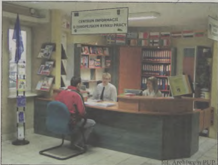
Powiatowy Urząd Pracy w Turku

Pozyskane środki Funduszu Pracy i Europejskiego Funduszu Społecznego na programy aktywizacji zawodowej osób bezrobotnych w 2007 roku osiągnęły rekordową kwotę 6 989 600 zł, co umożliwiło zaktywizowanie 2 369 osób. Ważnym elementem wsparcia w ramach pozyskanych środków było tworzenie warunków sprzyjających podnoszeniu zdolności do zatrudnienia osób bezrobotnych, obejmujących m.in. działania na rzecz dalszego doskonalenia bądź zmiany kwalifikacji zawodowych w formie szkoleń, przygotowania zawodowego, staży. Pomoc koncentrowała się również na rozwoju przedsiębiorczości i samozatrudnienia poprzez doradztwo, szkolenia oraz