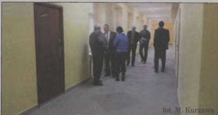
Wyremontowany korytarz w Domu dla Dzieci i Młodzieży w Nowym Świecie

Wydział Rolnictwa, Leśnictwa i Ochrony Środowiska