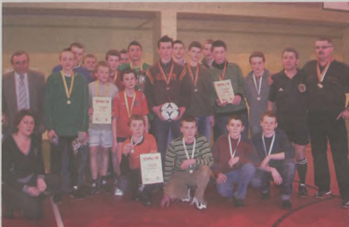
Najlepsze drużyny z organizatorami turnieju.