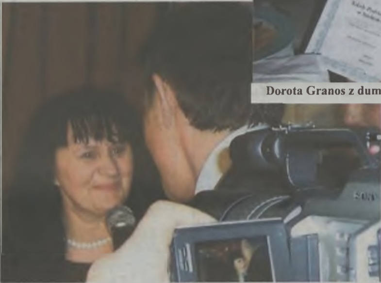
Ibiszowi się nie odmawia.

dyplom wraz z certyfikatem, pamiątkową statuetkę i liczne gratulacje od organizatorów oraz przedstawicieli kancelarii prezydenta i wspierających to przedsięwzięcie ministerstw. Dużym przeżyciem dla pani dyrektor był krótki wywiad udzielony Krzysztofowi Ibiszowi, który prowadził tą galę.