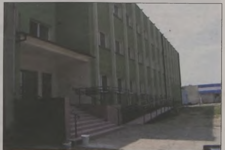
Zamiejscowy Wydział Inżynierii Środowiska PWSZ w Koninie

W związku z tym, że samorząd powiatowy realizuje zadania wynikające z programu usuwania azbestu i wyrobów zawierających azbest, stosowanych na terytorium Polski, udzielono dofinansowania do 31 wniosków. Dofi-