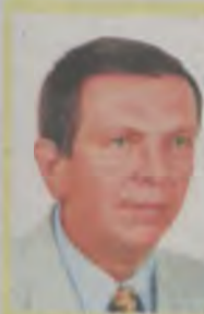
Bogdan Świtaj Skarbnik Powiatu Tureckiego