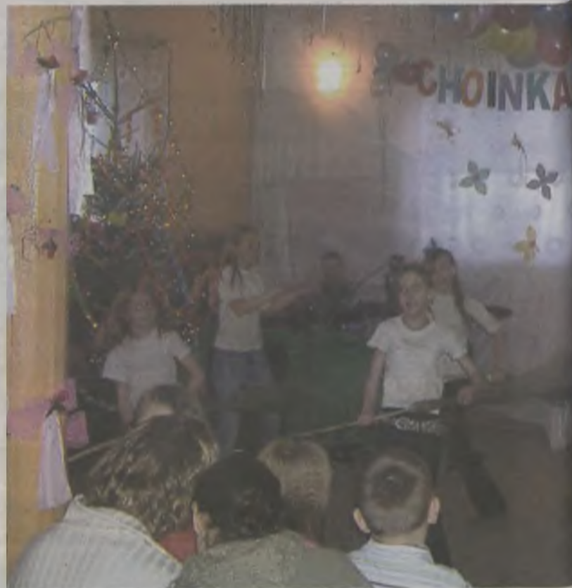
Tanec z miotełkami wykonany przez roztańczone „Kropeczki”

Członkowie stowarzyszenia nie porzeczali na szaleństwie karna-