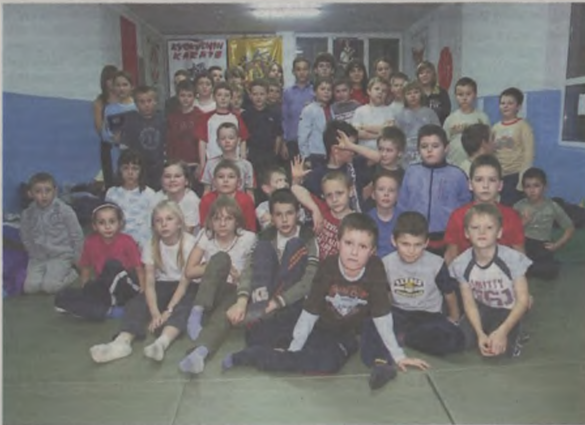
A to wszyscy uśmiechnięci od ucha do ucha uczestnicy nocy karateków.