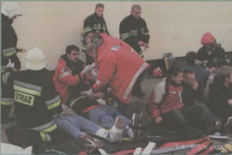
Ćwiczenia aplikacyjno-praktyczne w Zespole Szkolno-Gimnazjalnym w Brudzewie

Wydział Spraw Obywatelskich i Ochrony Ludności