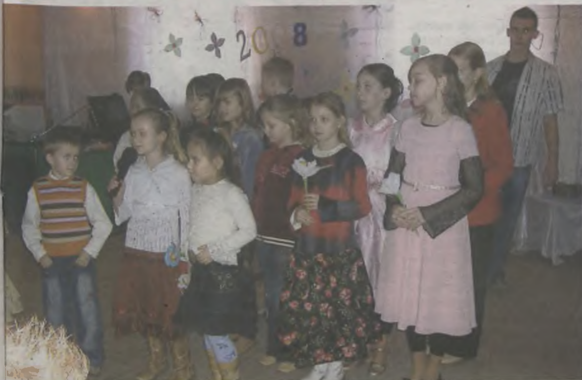
Kwiatki dla babci i dziadka.