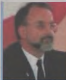
Przewodniczący Rady Powiatu Tureckiego

- Dokonując próby oceny dorobku Samorządu Powiatowego w pierwszym roku kolejnej już kadencji z punktu widzenia przewodniczącego Rady Powiatu, nie sposób odnieść się do wszystkich aspektów jego działalności. Szczegółowe sprawozdania poszczególnych Komisji oraz samej Rady dołączone są do protokołu ostatniej sesji odbytej w 2007 roku.