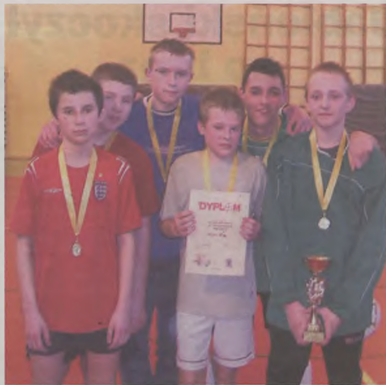
Zwycięska drużyna z IIa.