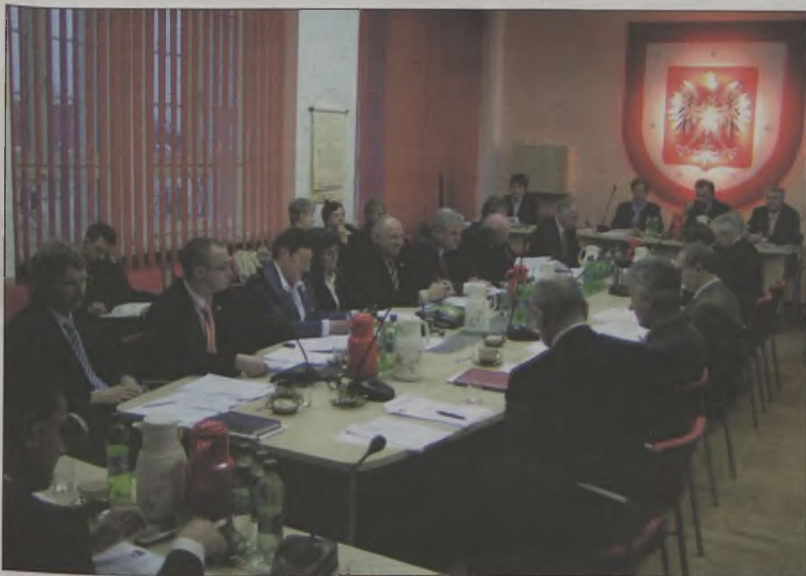
Sesja Rady Powiatu Tureckiego