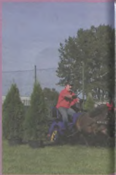
V Otwarte Mistrzostwa Powiatu Tureckiego w Powożeniu Zaprzęgami

Ponadto zamieściliśmy prezentację naszego powiatu w miesięczniku gospodarczym „Welcome to Wielkopolska”, która była zademon-