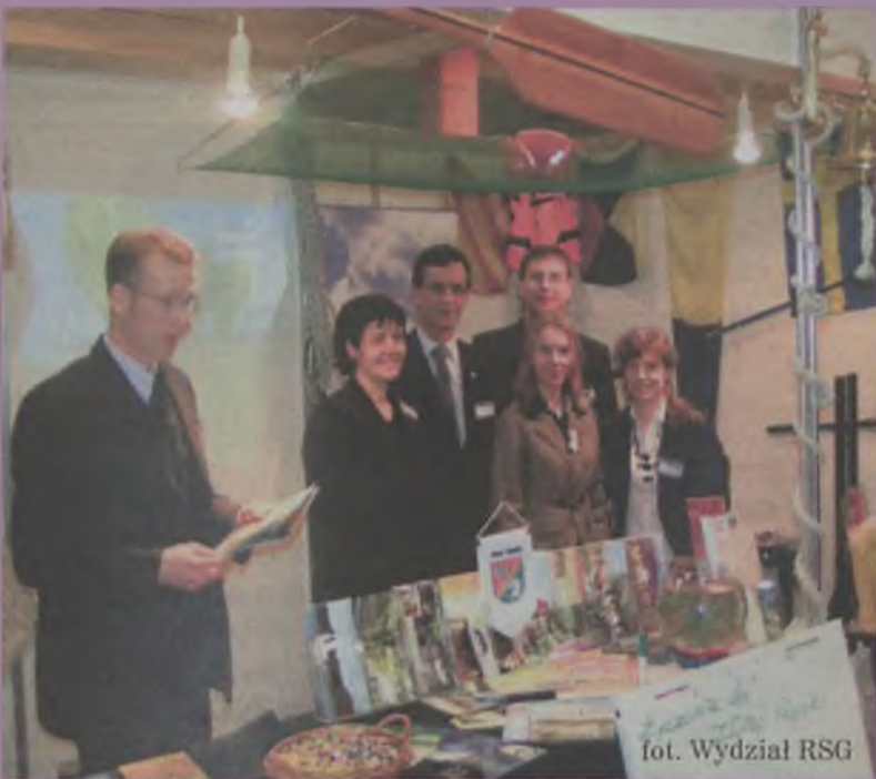
fol. Wydział RSG

Życzę nadzieję, że rok 2008 nie będzie gorszy i zapraszam wszystkich ludzi dobrej woli do dalszej współpracy.