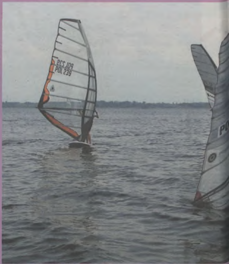
Puchar Polski w Windsurfingu na Jeziorsku

programu zaktywizowaliśmy lokalne firmy branży świadczących usługi turystyczne.