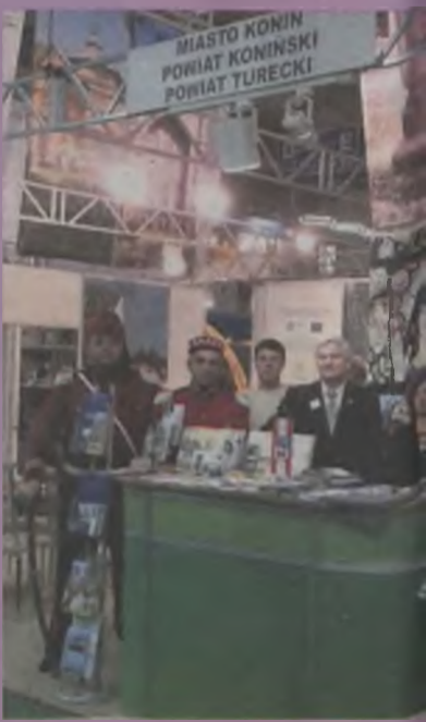
Targi Turystyczne „TOUR SA

W połowie roku rozpoczęliśmy wraz z gminami prace nad opracowaniem „Programu Promocji Powiatu Tureckiego”. Ponadto przygotowaliśmy projekt pn. „NaTURalnie u Nas”, który został przez Wielkopolską Organizację Turystyczną zakwalifikowany do ogólnopolskiego programu Turystyka Wspólna Sprawa. W ramach tego