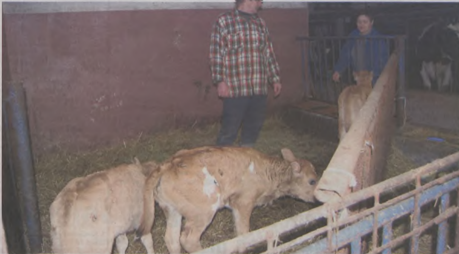
Zdziwienie i radość gospodarzy było potrójne, kiedy na świat przyszła trójka zdrowych i pięknych jałówek.

Na razie trojaczki chowają się dobrze, są pod specjalnym nadzorem właścicieli. ii