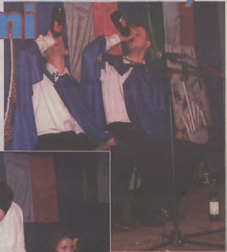
Muszkietierowie z Kaczek.

między innymi ziemniaczana, niemiecka sałatka, ciasto francuskie i polski placek drożdżowy. Skusili się na nie nawet przedstawiciele władz powiatowych, po czym pożegnali i odjechali. Niestety zabrakło hitu ubiegłych lat, ciasteczek w kształcie kaczek. Za to na zakończenie już bezstresowo odtańczono „Kaczuszki”.