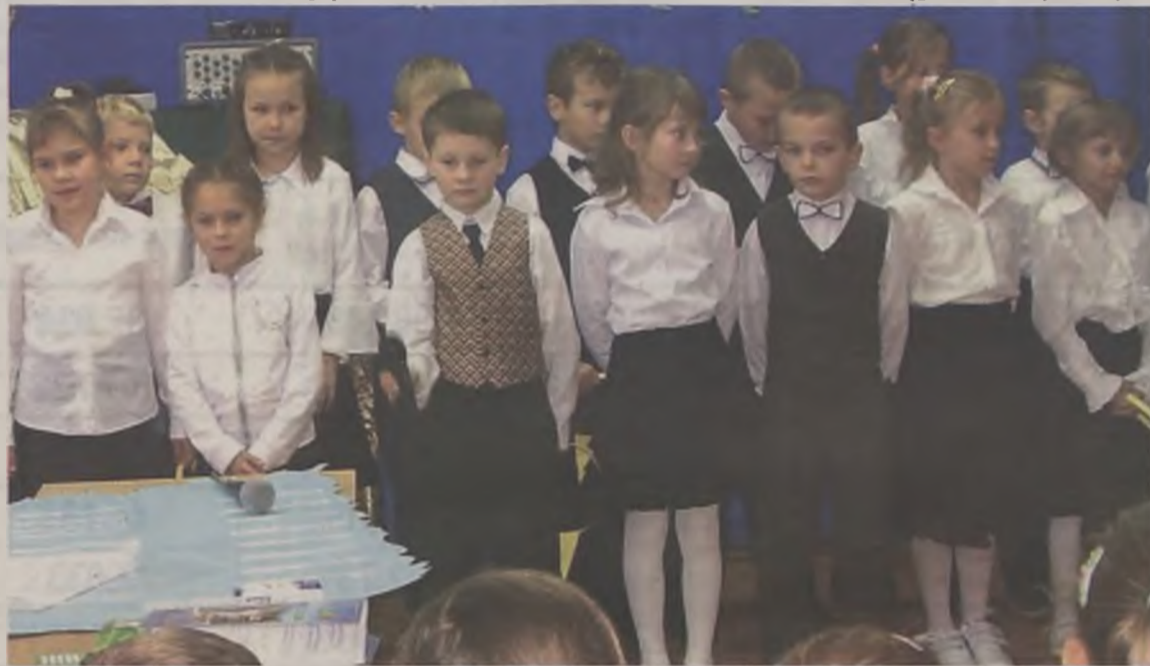
Pierwszaki z Tokar były bardzo przejęte tym uroczystym dniem.