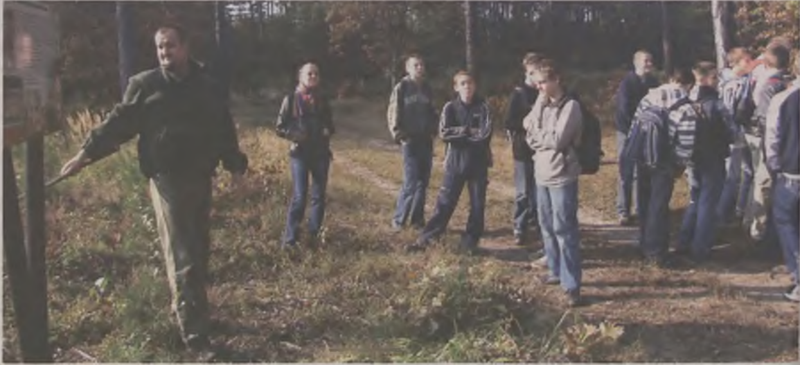
Gimnazjaliści z Władysławowa na ekologicznej ścieżce.