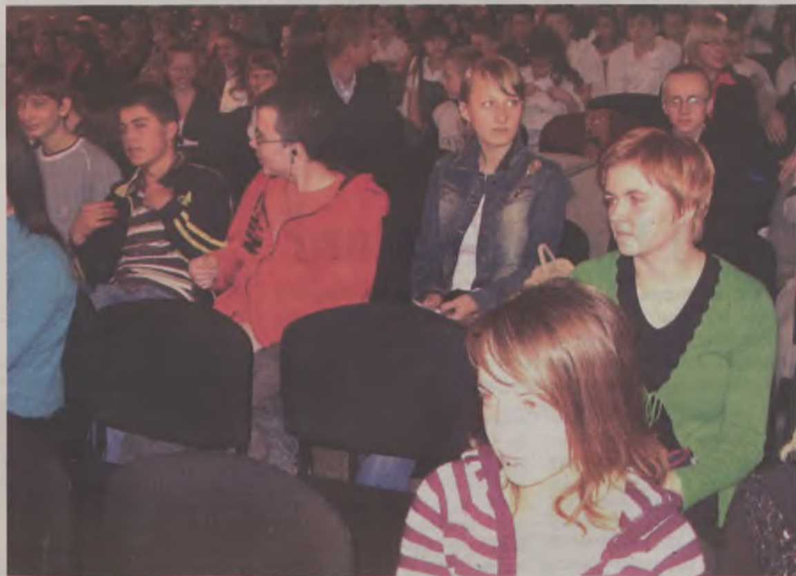
Sala wypełniła się po brzegi

Turku i Kawęczyna Szkoci kojarzą się ze skapstwem. Młodzież z Żuk widzi Rosję poprzez pryzmat kawioru, samowara i akordeonu. Francja dla uczniów szkół średnich w Kaczkach to wino, sery,