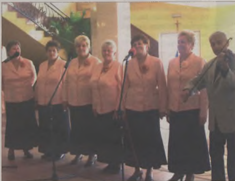
Czas umiłał występ zespołu „Tradycja”.