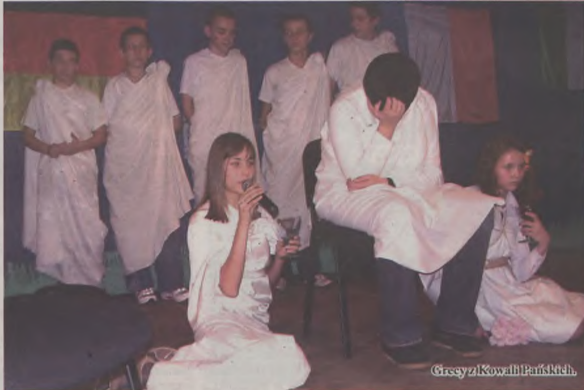
Grecy z Kowali Pańskich.

wanie wokalne słychać było w piosence wykonywanej przez uczennice tureckiego Gimnazjum nr 2. Publiczności podobała się również rosyjska piosenka w stylu „disco-polo”, zaśpiewana