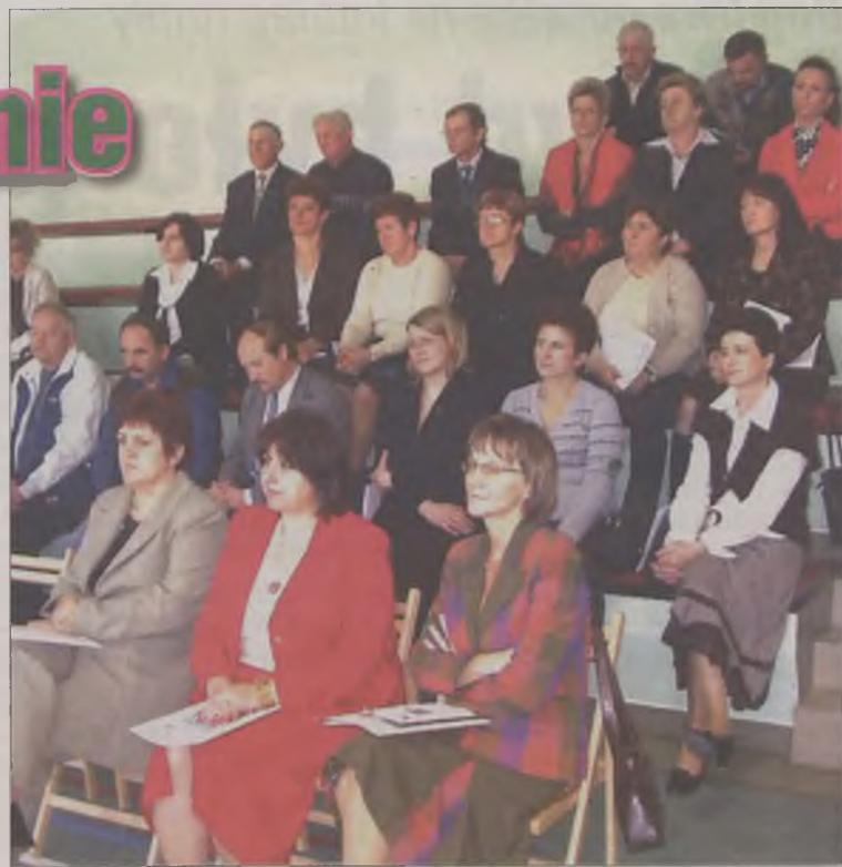
W konferencji uczestniczyło kilkadziesiąt osób.

na 70-letnim doświadczeniu Szkoły im. Kofoeda w Danii. Fundacja „Barka” realizuje go już od 15 lat. W Młodzianowie prowadzone będą zajęcia edukacji ogólnej,