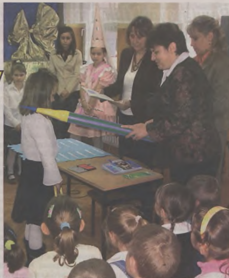
Pani dyrektor pasowała wielką ołówkiem.

Uroczystość zakończył przygotowany przez rodziców, słodki poczęstunek. (can)