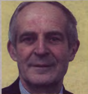
Andrzej Piątkowski, burmistrz Dobrej