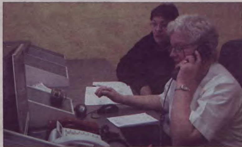
Dyspozytorka w CPR-rze odbierając rozmowę zwykłym telefonem, by jak najszybciej zadysponować wyjazd pogotowia, musiałaby jednocześnie wypełniać w komputerze kartę zgłoszenia. Bez specjalnych zestawów słuchawkowych jest to technicznie niemożliwe.