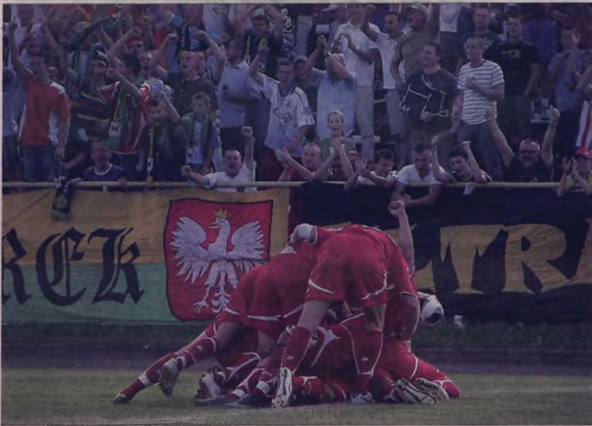
Radość piłkarzy i kibiców Tura z pierwszych goli w II lidze.

Ligowa karuzela rozkręca się i w środę Tura czeka wyprawa do Poznania, gdzie Warta będzie chciała zrewanżować się za wiosenną porażkę poniesioną w III lidze. A w sobotę do Turku zawita Podbeskidzie, które już w pierwszych dwóch meczach zredukowało karę sześciu minusowych punktów. WK