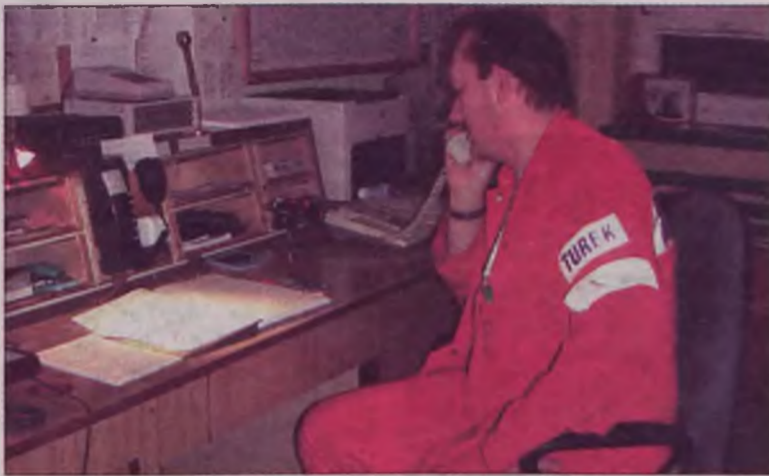
Ratownicy pogotowia przez wiele miesięcy wskazywali na niedostatki zainstalowanego systemu, teraz obawiają się, że za jego błędy przyjdzie zapłacić im i mieszkańcom.

Głównym założeniem nowej organizacji tego systemu było stworzenie jednego punktu, w którym spotkają się dwa najważniejsze jego ogniwa: stanowiska dyspozytorskie pogotowia ratunkowego i straży pożarnej. Od dwóch lat przystosowywano do szybkiej łączności i reagowania stanowisko w Państwowej Straży Pożarnej, bo to jemu „podlega” europejski numer ratunkowy – 112. Od marca do komendy