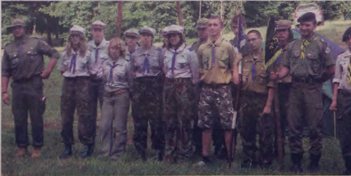
Diabelki w oczekiwaniu na tytuł i odznakę „Drużyny Grunwaldzkiej”.