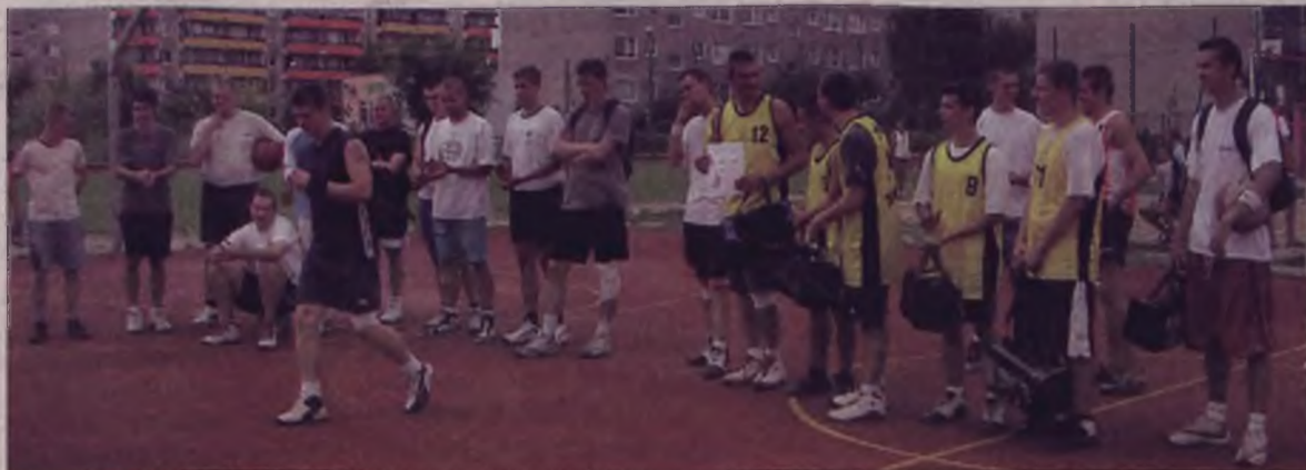
Pierwsza trójka zespołów w II turnieju piłki koszykowej.