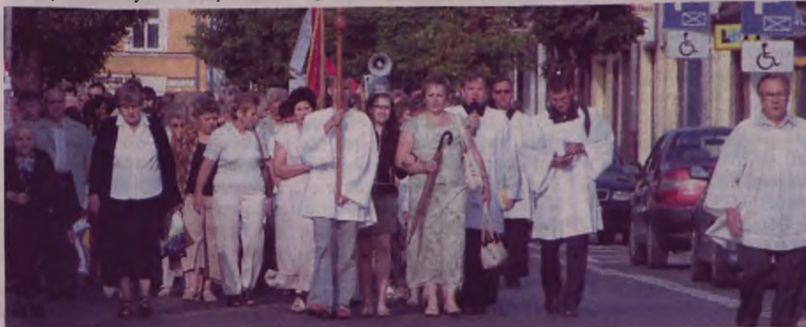
Po mszy, o godz. 8.00 jedna z pielgrzymek wyszła z kościoła NSPJ w Turku do Galewa.