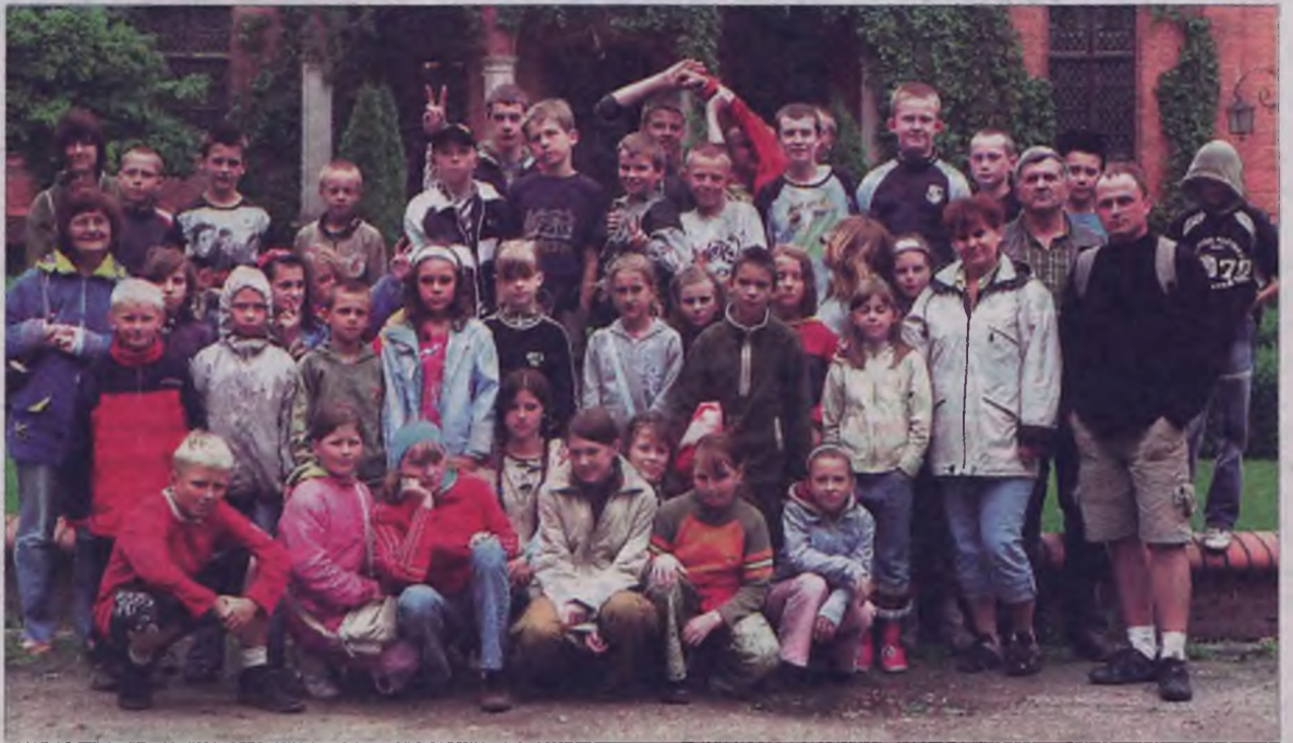
Koloniści z Turku zwiedzali nadmorskie okolice.

Ponieważ pogoda nad morzem sprzyjała wypoczynkowi, grupa zażywała kąpiele w Bałtyku jak również na odkrytym basenie w Żelistrzewie. Poza zwiedzaniem i poznawaniem ciekawych zakątków polskiego wybrzeża oraz uwrażliwianiem na piękno przyrody, dzieci uczyły się odpowiedzialności, wzajemnej życzliwości, współpracy, kulturalnego zachowania