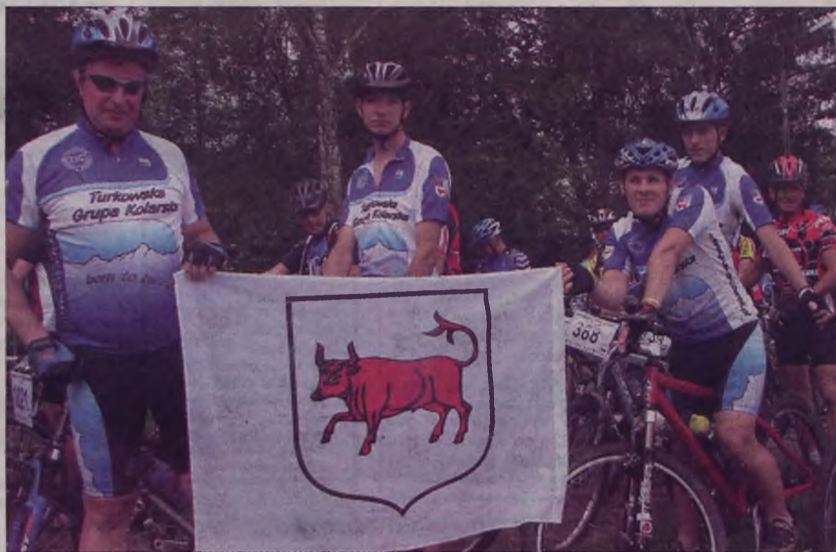
Kolarze z Turku na maratonie w Nidzicy.