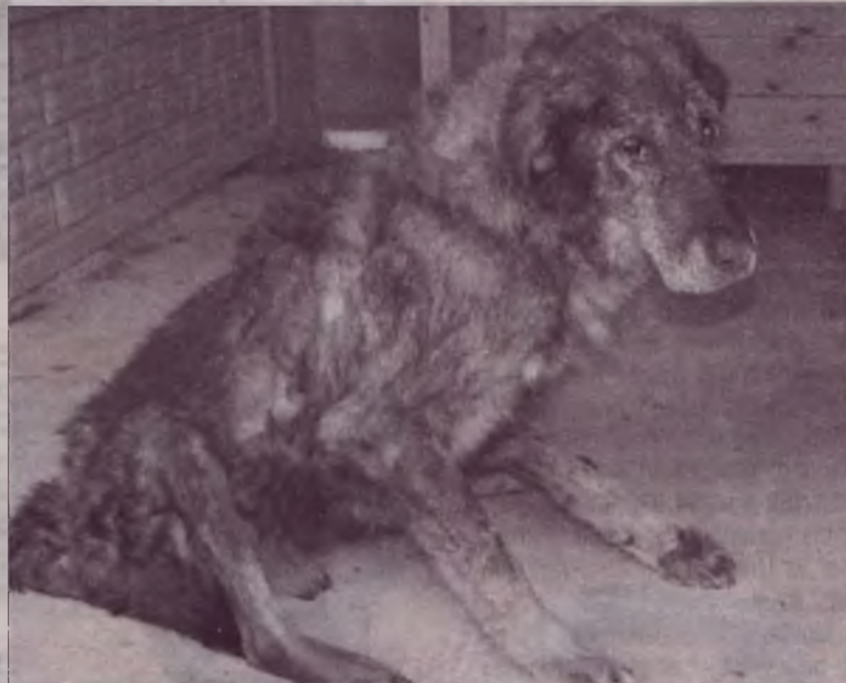
Dla tego skatowanego psa pobyt w schronisku okazał się wybawieniem od śmierci i bestialskiego „pana”.