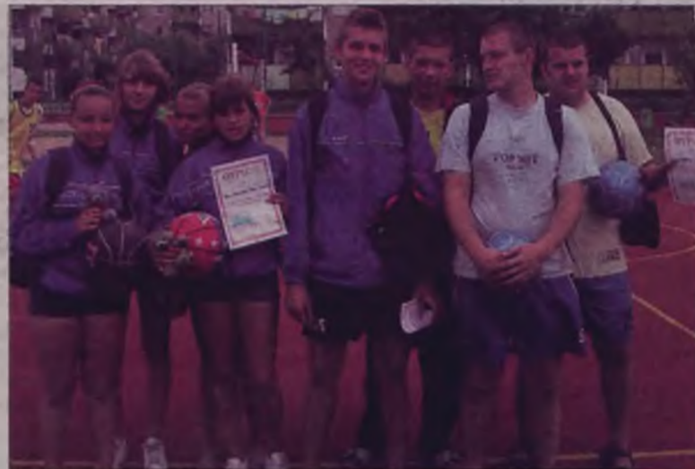
Pierwsza czwórka zespołów w II turnieju siatkówki plażowej.

Skuszeni wspaniałą atmosferą pierwszego turnieju działacze komitetu osiedlowego nr 7, spółdzielni mieszkaniowej „Tęcza”, zaryzykowali organizację drugich zawodów. Do basketu zgłosiło się 7 zespołów, które grały w dwóch grupach „A” - 4 zespoła, „B” - 3 drużynowa. Koszykarze starali się pokazać ful swoich umiejętności indywidualnych i zagrań zespołowych. Jednak tylko nielicznym zespołom udawała się grać poprawną koszykówkę. Zwycięsko z rywalizacji w drugim turnieju wyszedł zespół „Nie umiemy latać” w składzie: Seba-