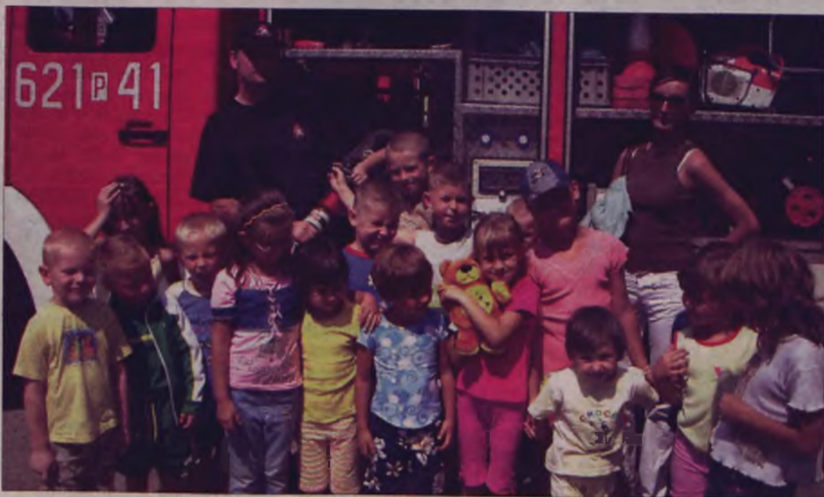
Jedną z atrakcji półkolonii była wizyta u turkowskich strażaków.

Ponadto dzieci w „Eurece” wykazują się swoją sprawnością, między innymi na specjalnie dla nich przygotowanych torach przeszkód czy turnieju koszykówki. AZ