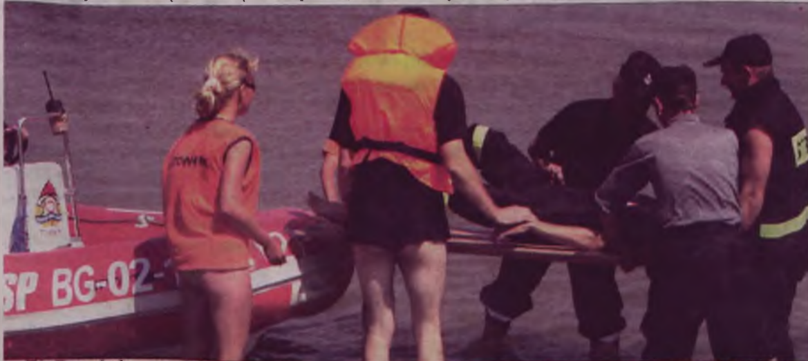
Wędkarz któremu udało się wyjść cało z wypadku na wodzie został wyłowiony przez strażaków, po czym na brzegu udzielono mu pierwszej pomocy.

Ćwiczenia odbywały się we współpracy z ratownikami pracującymi na plaży zbiornika „Przykona”. W związku z nowymi zadaniami wynikającym z funkcjonowania zbiornika, w ponton zaopatrzyła się tamtejsza OSP. Zatem ostatniego dnia ćwiczenia odbywały się już na dwóch pontonach. AZ