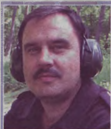
Kierownik Rewiru Dzielnicowych Sekcji Prewencji KPP w Turku

Dzielnicowy powinien być policjantem rozpoznawalnym przez mieszkańców swojego rejonu. Powinien służyć im pomocą i radą. Niestety, wciąż większość z nas nie zna swojego dzielnicowego, nie wie kim on jest i nie ma pojęcia, jak się z nim skontaktować. Dlatego dziś publikujemy listę dzielnicowych z Turku i gminy Turek.