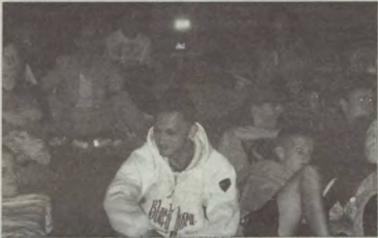
Lato z filmem to propozycja domu kultury nie tylko dla młodych ludzi.

Wszyscy dobrze się bawili podczas projekcji filmów, jedna z uczestniczek, turkowianka obecnie mieszkająca w Poznaniu stwierdziła: –Jest to bardzo fajna impreza,