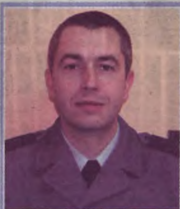
Rejon IV: sierż.