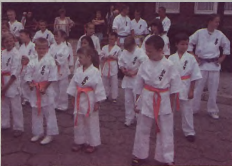
Pokaz sztuk walk zaprezentowali młodzi karatecy z turkowskiego Klubu Sportów i Sztuk Walk.

Po przekazaniu poczet zaprezentował sztandar kompaniom honorowym służb straży, wojska i policji. Na stronie głównej policyjnego sztandaru widnieje orzeł biały oraz napis: „Ojczyzna i Prawo”. Z