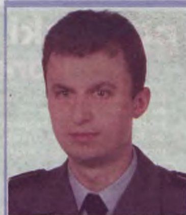
Rejon VII: mł. asp.

Ulice: Bacewicza, Kurpińskiego, Moniuszki, Nowowiejskiego, Ogińskiego, Paderewskiego, Różycznego, Serockiego, Szymanowskiego, Wieniawskiego, Zdrojki Lewe, Zdrojki Prawe, Zdrojowa, Żeleńskiego, Miejscowości: Albertów, Budy Śtokowskie, Cisew, Grabieniec, Dzierżazna, Kalinowa, Śtoków Kolonia, Śtoków, Obrębizna, Obrzębin, Pęcherzew, Szadów Księży, Szadów Pański, Wrząca.