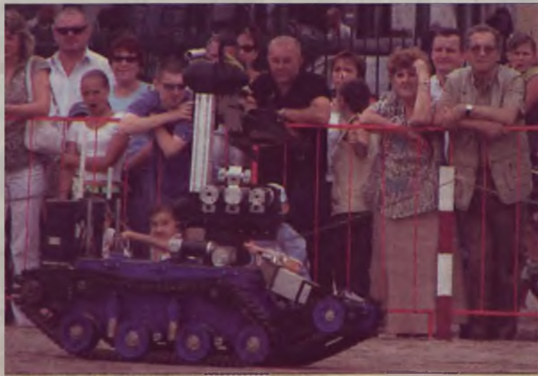
Można było obejrzeć, jak działa policyjny robot do przejmowania niebezpiecznych przedmiotów.

-Na sztandar trzeba sobie zasłużyć. Sztandar to duma, ale również obowiązek wobec tych, którzy go na-