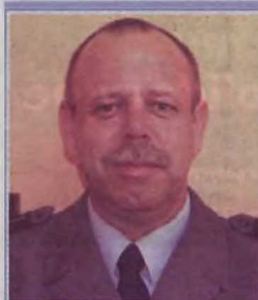
Rejon VIII: mł. asp.

S wojego dzielnicowego nie mają mieszkańcy rejonu III, tj. ulic: Braci Marszów, Braci Nawietrzaków, Chopina, Działkowa, Florczaka, Gorzelniana, Gwarna, Jana Pawła II, Kaliska, Kruszyńskiego, Komunalna, Konińska, Konopnickiej, Krótka, Łąkowa, Łagodna, Mehoffera, Miła, Miłosna, Muchlińska, Nastrojowa, Ogrodowa, Parkowa, Park Miejski im. Ż. Składkowskiej, Perlowa, Pl. Glicensteina, Pl. Sienkiewicza, Pl. Wojska Polskiego, Plac Zacisze, Poduchowne, Południowa, Promienna, Przyjemna, Rajska, Rubinowa, Sielska, Składkowskiej, Słowackiego, Spokojna, Styłowa, Tamka, Uroczna, Wesola, Zabawna, Zgodna, Zielona. Ten rejon obsługują dzielnicowi z innych ulic, będący akurat na służbie. AZ