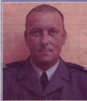
Rejon VI: sierż. sztab.

Ulice: Cicha, Czysta, Dobrska Szosa, Folwarczna, Górnica, Kwiatowa, Makowa, Malinowa, Morełowa, Orzechowa, Os. Uniejowskie, Piękna, Pl. Kilińskiego, Północna, Przemysłowa, Radosna, Słoneczna (do Wschodniej), Wiśniowa, Wschodnia. Miejscowości: Chlebów, Kaczk Średnie, Kowale Księży, Korytków, Turkowice, Warenka, Włetchinin, Żuki.