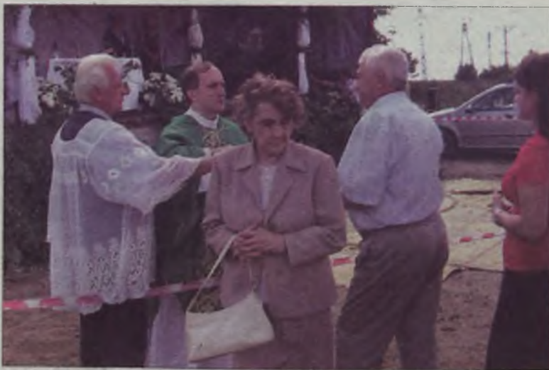
Podczas mszy świętej.