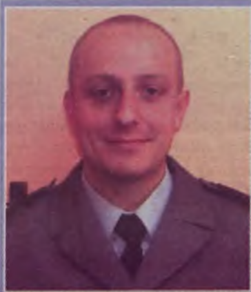
Rejon I: sierż. sztab.

Ulice: Akacyjowa, Browarna, Brzozowa, Dębowa, Dworcowa, Kasztanowa, Kączkowskiego, Klonowa, Milewskiego, Spółdzielców, os. Miranda, Piłsudskiego, Torowa.