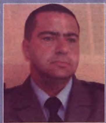
Rejon II: st. sierż.

Ulice: Armii Krajowej, Broniewskiego, Dąbrowskiego, Graniczna, Kolejowa, Kolska Szosa, 650-lecia, Legionów Polskich, Polskiej Organizacji Wojskowej, Stawickiego, Żwirki i Wigury.