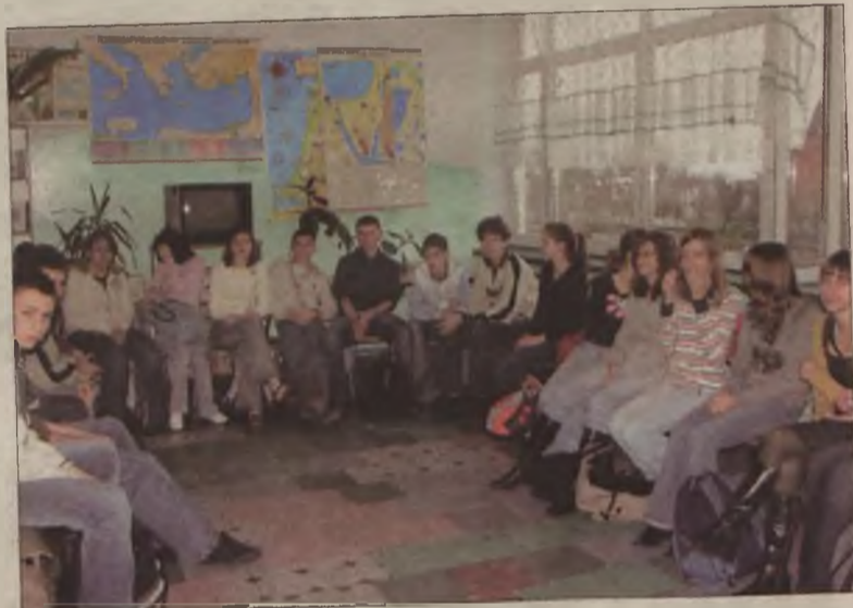
W warsztatach uczestniczyła klasa 3f i ib.

ośmiu szkół gimnazjalnych i średnich w Polsce, która zakwalifikowała się do akcji Szkoła Globalna, nawiązała kontakt z innym szkołami Europy uczestniczącymi w tej akcji i co najważniejsze zapowiada kontynuację przeprowadzonych warsztatów. MJ