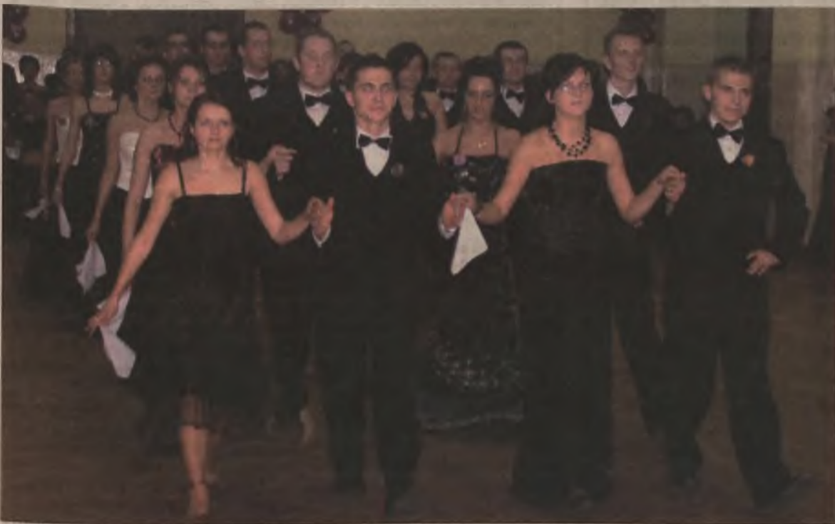
Tradycyjnego poloneza zatańczyło dwanaście par.

Swoją najważniejszą w życiu bal w minioną sobotę, 20 stycznia miała część tegorocznych maturzystów z Zespołu Szkół Technicznych w Turku. W trwającej do białego rana studniówce uczestniczyło niemal 400 osób.