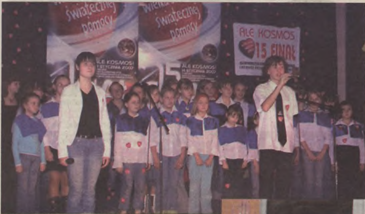
Na wielkoorkiestrowej scenie.