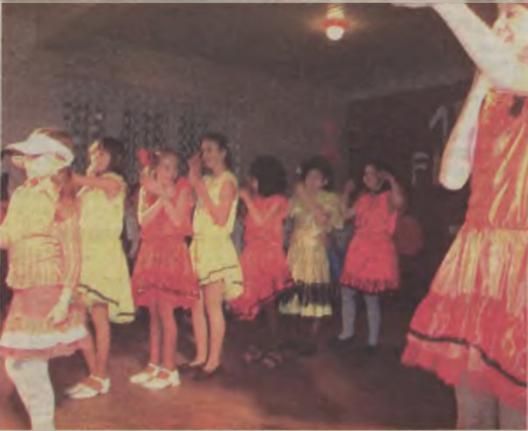
Atrakcją pokazu dziecięcego zespołu, działającego przy MGOK byli chłopcy przebrani w dziewczęce stroje i peruki.

W części artystycznej na scenie zaprezentowali swoje talenty zarówno ci najmłodsi, jak i starsi mieszkańcy miasta i gminy. Na przykład przedszkolaki wystąpiły z ciekawie ilustrowanymi ruchowo piosenkami, a członkowie sekcji OYAMA karate, działającej przy MGOK, z krótkim pokazem walki. Z kolei w pokazie miody na niepogodę, na wesoło, wystąpiły gimnazjalistki Zespołu Szkół w Tuliskowie, natomiast chór szkolny oraz solistki wykonały kilka piosenek. Ponadto z kilkoma utworami zaprezentował się na scenie zespół wokalny seniorów „Jesień”. ika