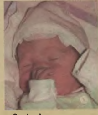
...Grzelczak syn Romany i Dariusza ur. 17 stycznia, godz. 22.55 waga 2700, długość 50cm