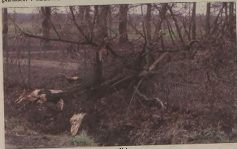
Drzewa łamały się niczym zapalki.

Zniszczone dachy do czasy naprawy zabezpieczano folią lub plan-dekami. Ale nie tylko dachy niszczył wiatr. Na przykład w Słodkowie zniszczył część ściany szczytowej nowo budowanego domu. Nie wszędzie potrzebna była pomoc straży, dlatego też nie wszystkie skutki huraganu zostały zgłoszone. Niemniej jednak najwięcej, bo dwanaście zdarzeń odnotowano w Turku. Ponadto po trzy różne przypadki niszczącej siły huraganu zgłoszono z terenów gmin Przykona, Tuliszków i Kawęczyn, pięć z gminy Władysławów, po