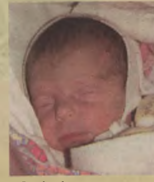
...Grzelczak córka Romany i Dariusza ur. 17 stycznia, godz. 22.53 waga 2880, długość 51cm