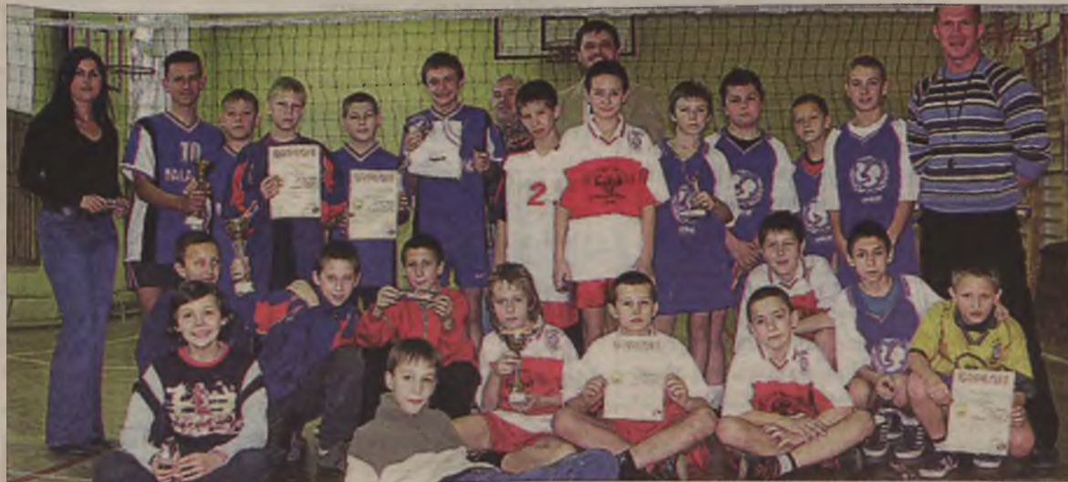
Uczestnicy VIII Memoriału im. Jacka Zycha w mini siatkówkę chłopców.