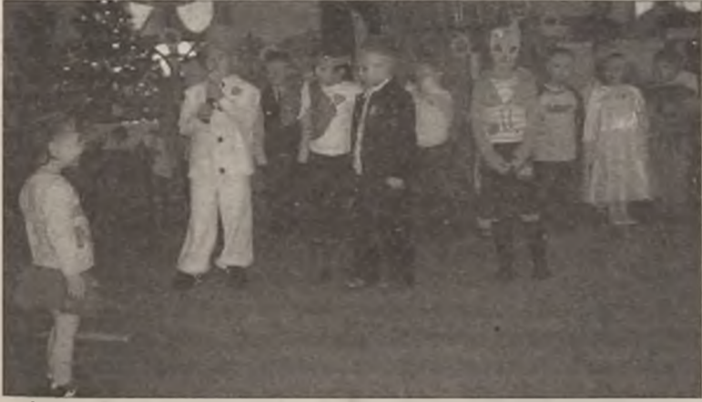
Przedszkolaki z specjalnie przygotowanym programie artystycznym.