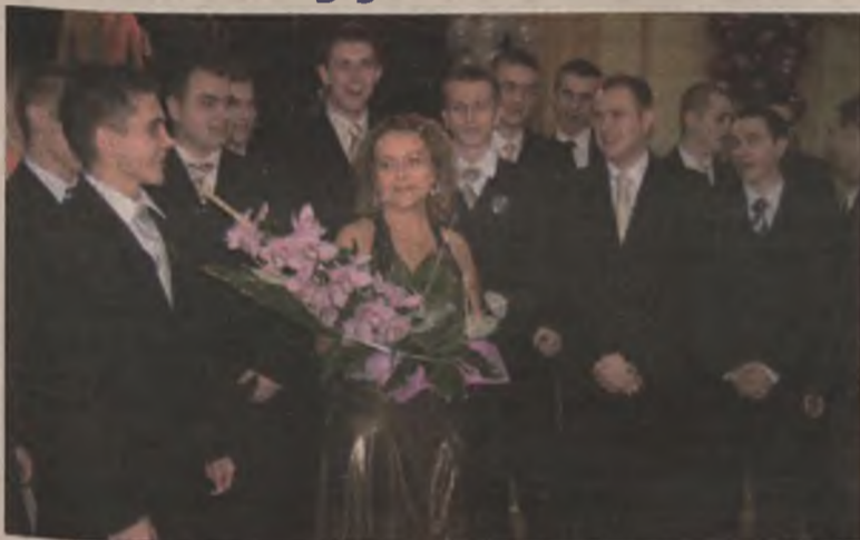
Męska klasa ze swoją wychowawczynią.