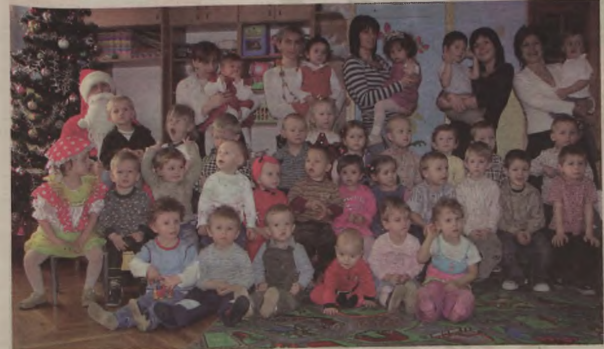
Mali uczestnicy balu w żłobku.

Mikołaja. Jedne płakały, inne od razu próbowały uciekać. Ale były też i takie, które odważnie pozwalały posadzić się u Mikołaja i pozować do pamiątkowej fotografii. Na zakończenie zabawy każde dziecko otrzymało od miłego gościa paczkę ze słodyczkami. AZ