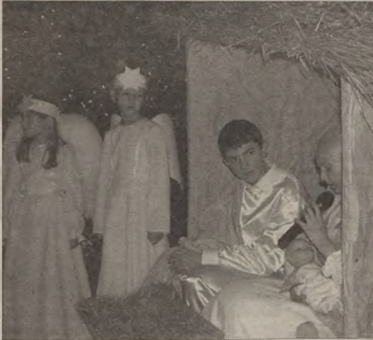
To przedstawienie obejrżeli rodzice oraz oficjalni goście.

Wszyscy zebrani podzielili się opłatkami, po czym zasiedli do rozstawionych na szkolnym korytarzu stołów. Tu delectowano się słodkim poczęstunkiem, przygotowanym przez jak zwykle niezawodnych rodziców. AZ