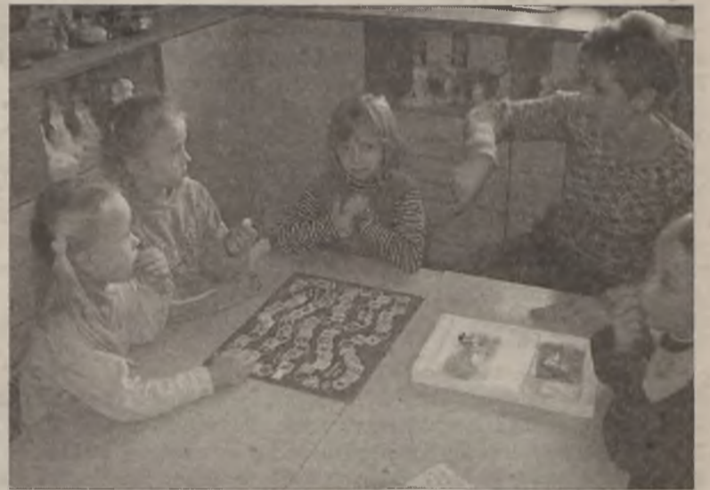
Uczestnicy warsztatów edukacyjnych

czas których otrzymywali pomoc w odrabianiu prac domowych. Do dyspozycji oddano im księgozbiór biblioteki szkolnej i Internetowe Centrum Informacji Multimedialnej. Dla uczniów klas 0 - VI zorganizowano zajęcia korekcyjno - kompensacyjne i dydaktyczno - wyrównawcze. Z dzieci borykającymi się z wadami wymowy, pracował logopeda. Mogły także skorzystać z pomocy pedagoga szkolnego, poprzez uczestnictwo