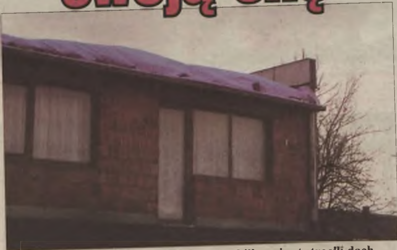
Właściciele tego domu w Kalinowej w kilka minut stracili dach.

W Powiatowym Stanowisku Kierowania znajdującym się w Komen-dzie Powiatowej Państwowej Straży Pożarnej w Turku tej nocy telefon dzwonił bez przerwy. Pomocy szukali tu mieszkańcy wszystkich gmin naszego powiatu. Łącznie odnotowano 54 zdarzenia. Pierwsze wezwanie oficera dyżurny w straży otrzymał około godz. 22.00, 18 stycznia, ostatnie około godz. 9.00 następnego dnia.