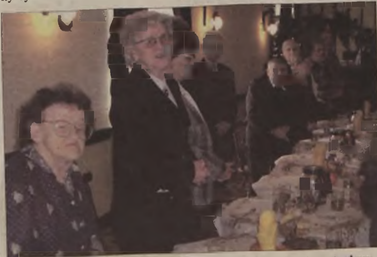
W spotkaniu opłatkowym uczestniczyli Sybiracy z rejonu turkowskiego, osoby wspierające ich działalność oraz zaproszeni goście, reprezentujący władze Turku i powiatu.

To szczególne spotkanie było okazją do wspomnień, osobistych wrzuceń, podziękowań, złożenia hołdu wszystkim ofiarom Sybiru. MJ