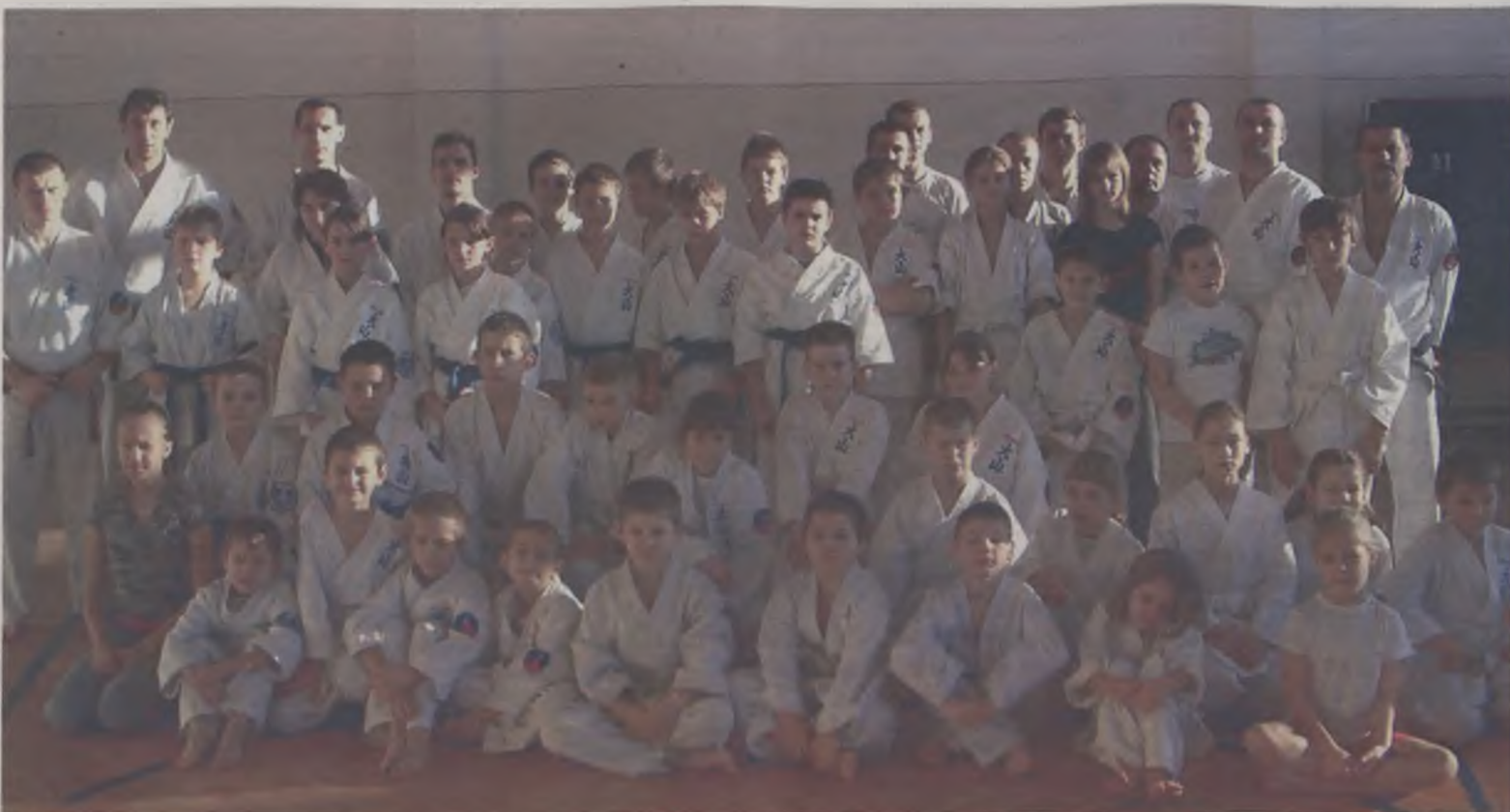
Wszyscy uczestnicy egzaminu.