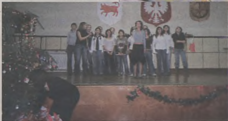
W czasie spotkania podopieczni świetlic profilaktycznych przygotowali świąteczny program artystyczny.

Miłym akcentem była wspólna kolacja wigilijna.