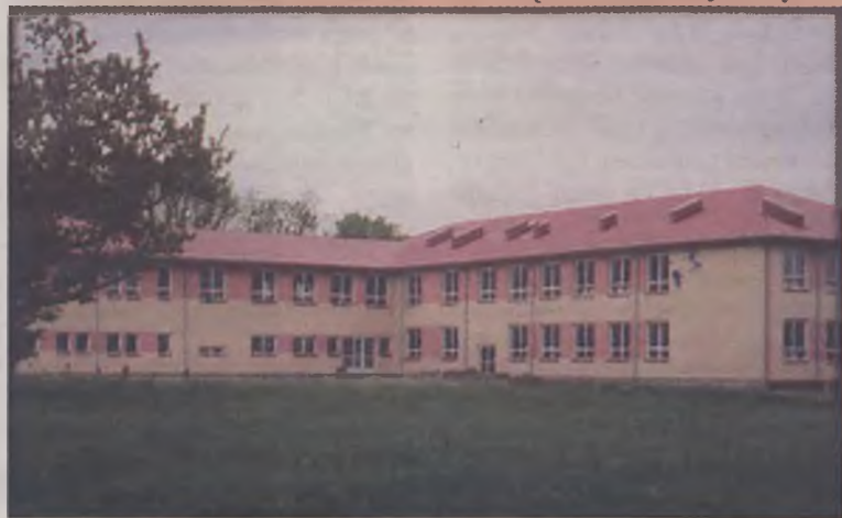
Tytuł Mistera Budownictwa przyznano firmie „BUD-BET” za Gimnazjum w Malanowie.