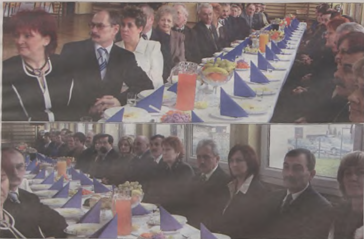
Za stołem zasiedli ziości i srebrni jubilaci z gminy Brudzew.