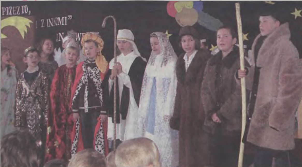
Piątoklasiści z Koźmina w przedstawieniu jasełkowym.

Witaj Maryjo, witaj Boże Dziecię” – tymi słowami narodzonego Chrystusa pozdrowili pasterze i królowie w jasełkach, przygotowanych 21 grudnia przez uczniów klasy piątej w Szkole Podstawowej w Koźminie z Filią