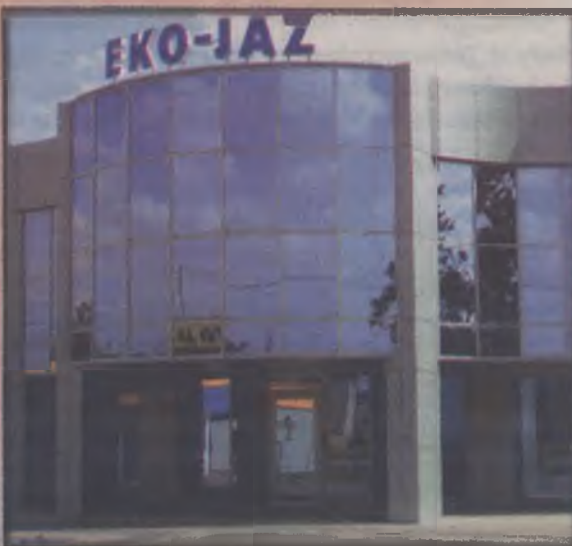
Za wykonanie stacji paliw Eko-Jaz w Turku firma otrzymała kolejny tytuł v-ce Mistera Budownictwa.

Tulizków Już po raz czwarty Forum Kobiet w Tulizkowie zorganizowało Mikołajkową zabawę. Wzięło w niej udział ponad 80 dzieci (w tym również niepełnosprawnych) z miasta i gminy Tulizków.