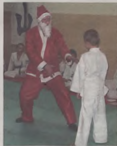
Gość w czerwonym ubraniu zaprezentował swoją sprawność fizyczną.

Zarówno młodszy, jak i starsi karatecy, nie kryli zaskoczenia, ale i zadowolenia z wizyty Mikołaja i otrzymanych upominków. Organizatorzy przedsięwzięcia zauważają, że imprezy tego typu bardzo integrują ze sobą karateków oraz dają możliwość dobrej