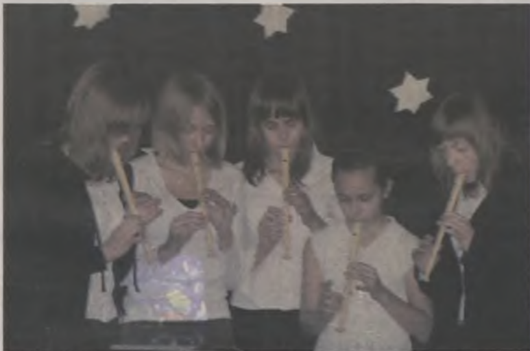
Muzyczne umiejętności zaprezentowali utalentowani fleciści.

Pod takim tytułem w Gimnazjum nr 2 im. Mikołaja Kopernika w Turku odbyły się tradycyjne uroczystości związane ze świętami Bożego Narodzenia. Młodzież przygotowała specjalny montaż słowno-muzyczny nawiązując do biblijnego przekazu o narodzeniu Jezusa Chrystusa, Zbawiciela świata.