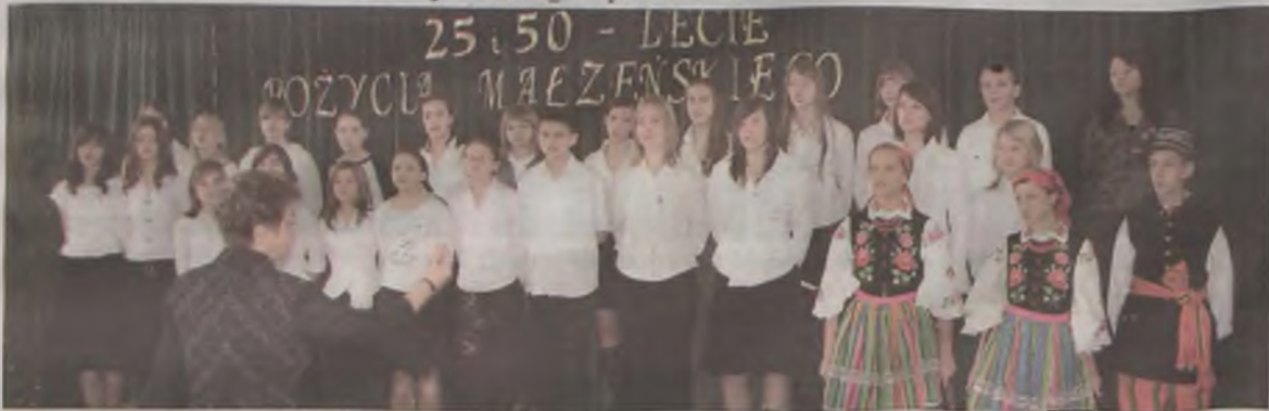
Dla jubilatów wystąpił chór dziecięcy z Brudzewa.

bardzo ciężkie chwile. To właśnie dzięki wielkiej miłości, wytrwałości i wzajemnemu wybaczeniu udało im się w szczęściu i spokoju przeżyć razem nawet te najcięższe chwile, dochować dzieci, wnuków i prawnuków. Co ciekawe, żadna z par, które przybyły na jubileuszowe uroczystości nie zmieniłyby swojego życia i co najważniejsze swojej drugiej połowy. Świadczyły o tym zadowolone, uśmiechnięte i szczęśliwe miny szanownych złotych i srebrnych jubilatów.