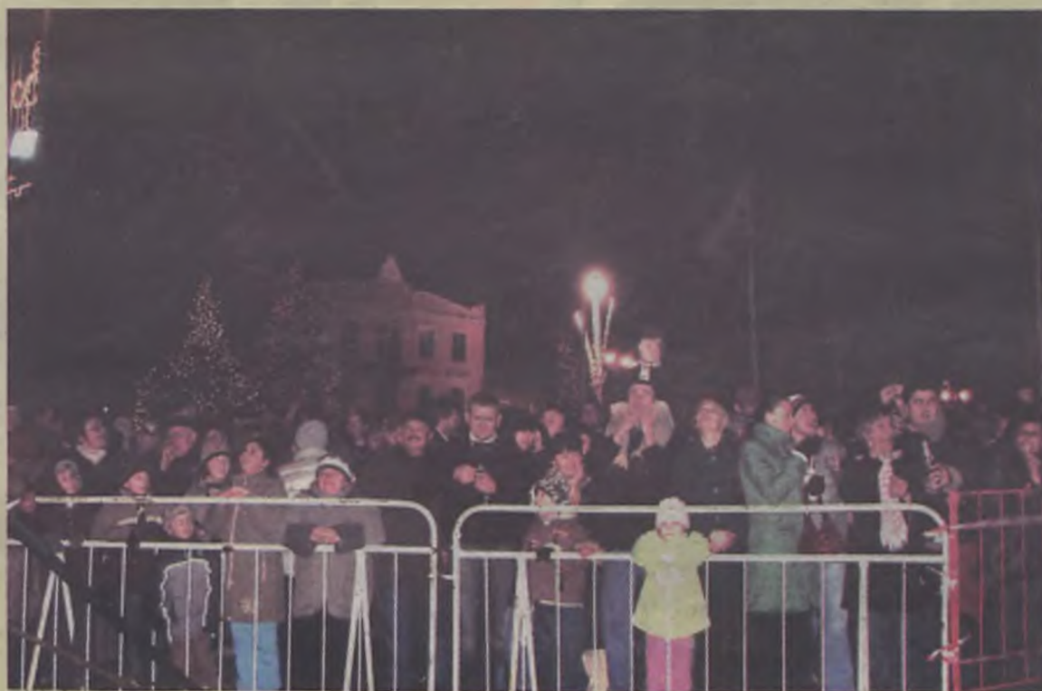
Zazwyczaj w noc sylwestrową większość mieszkańców miasta bawi się w rynku, czemu towarzyszą fajerwerki i wspólne życzenia.