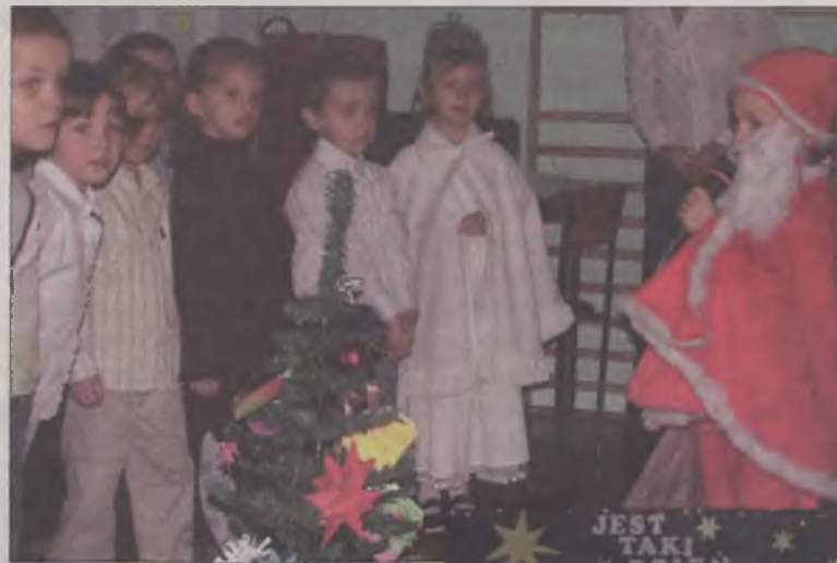
Dzieci przygotowały świąteczne występy.

Dziwny ten Mikołaj, który w piątek, 22 grudnia przybył do Przedszkola Gminnego we Władysławowie. Zamiast przybyć saniami, do których zaprzężone są renifery, przyjechał wozem strażackim. Dla dzieci nie to jest jednak ważne, ale to, że Mikołaj dla każdego miał prezent.