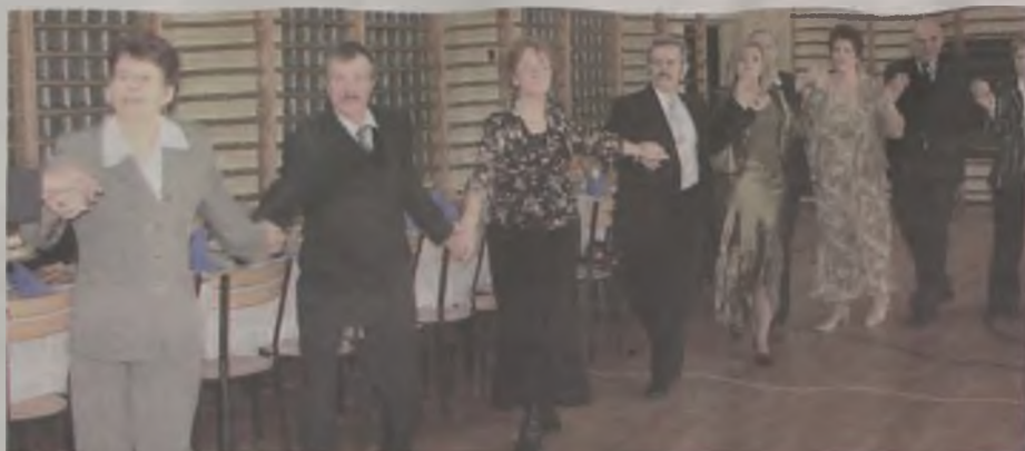
Imprezie towarzyszyła dobra zabawa ze wspólnymi tańcami.