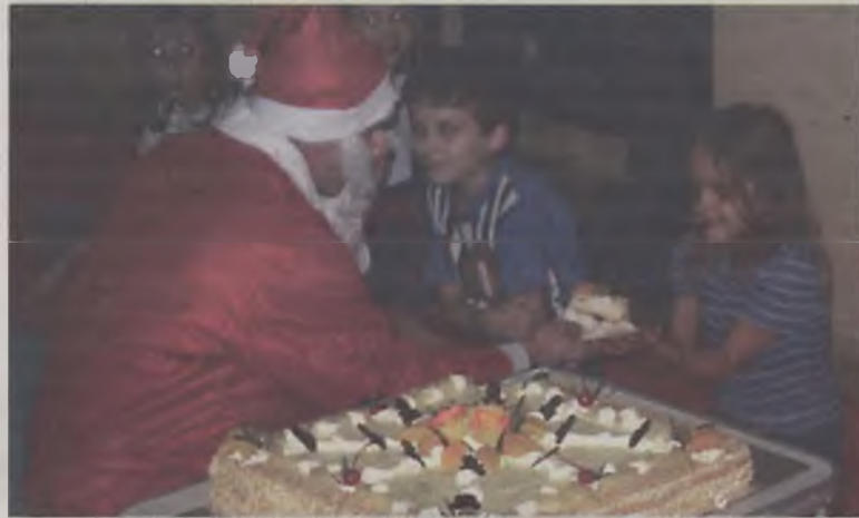
Mikołaj podarował dzieciom upominki i słodycze oraz częstował tortem.

Okazało się, że Mikołaj jest bardzo wysportowany, zaplanował bowiem dla dzieci wiele gier i zabaw ruchowych, pokazał także kilka sztuczek japońskich i sprawdził wiedzę najmłodszych, którzy nie spodziewali się tej wizyty. Po zajęciach wszyscy spałaszowali pyszny tort, a dzieci otrzymały paczki z drobnymi upominkami oraz słodyczkami.