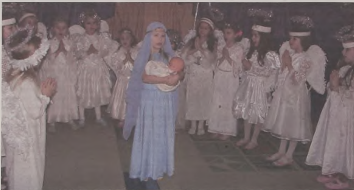
Przedszkolna Maria z dzieciątkiem w gronie aniołków.

Przedszkolaki z „Czwórki” to mali artyści. Swoje jasełka najpierw zaprezentowali kolegom z Przedszkola Samorządowego nr 1, później rodzicom, po czym innym dzieciom ze swojego przedszkola. AZ