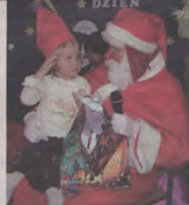
Mikołaj miał prezent dla każdego.

Po głośnych nawoływaniach, do przedszkola przyjechał św. Mikołaj. Wielkie było zdziwienie przedszkolaków, kiedy ich gość wyszedł z wozu władysławowskiej OSP. Szczególnie zachwyceni tym faktem byli chłopcy, z których chyba co drugi chciałby