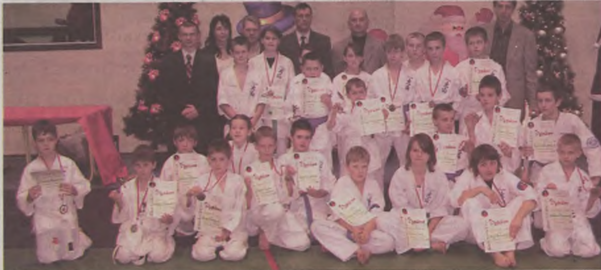
Karatecy z naszego powiatu – uczestnicy turnieju w Łasku wraz z opiekunami

Jak na turniej mikołajkowy przystało, karateków odwiedził św. Mikołaj, który rozdawał słodycze. AZ