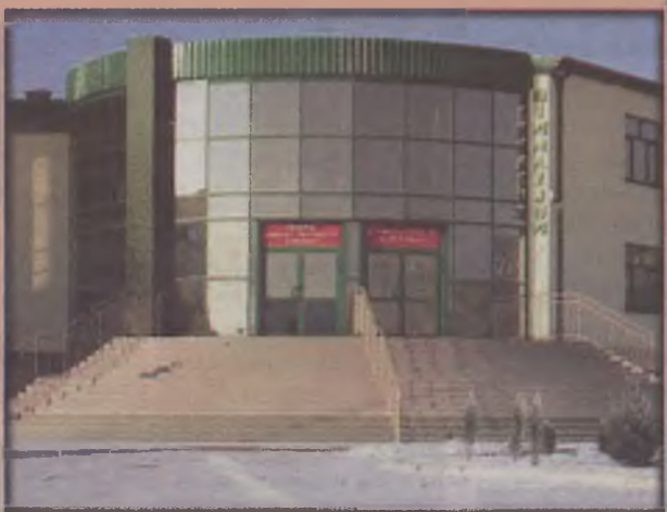
Gimnazjum w Brudzewie nagrodzone tytułem v-ce Mistera Budownictwa.