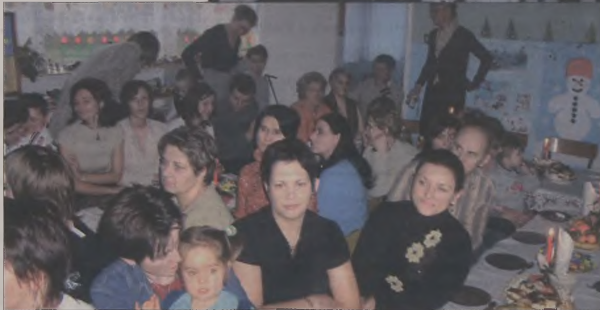
Jasełkowe przedstawienie obejrzała liczna publiczność.

konana bożonarodzeniowa szopka. Na koniec uroczystości przybył św. Mikołaj, na którego dzieci czekały z wielką niecierpliwością. Gwiazdora z białą brodą i workiem powitały