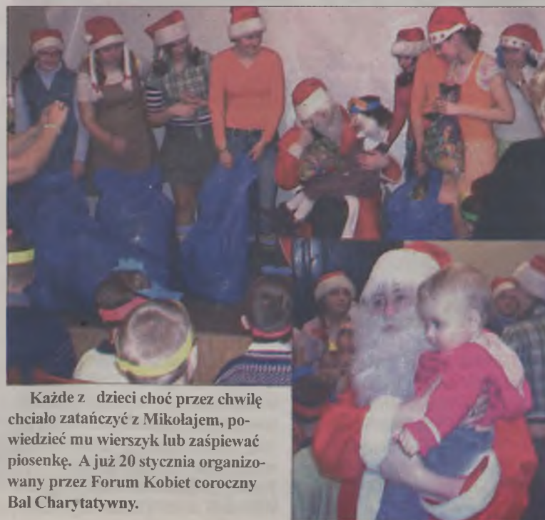
Każde z dzieci choć przez chwilę chciało zatańczyć z Mikołajem, powiedzieć mu wierszyk lub zaśpiewać piosenkę. A już 20 stycznia organizowany przez Forum Kobiet coroczny Bal Charytatywny.