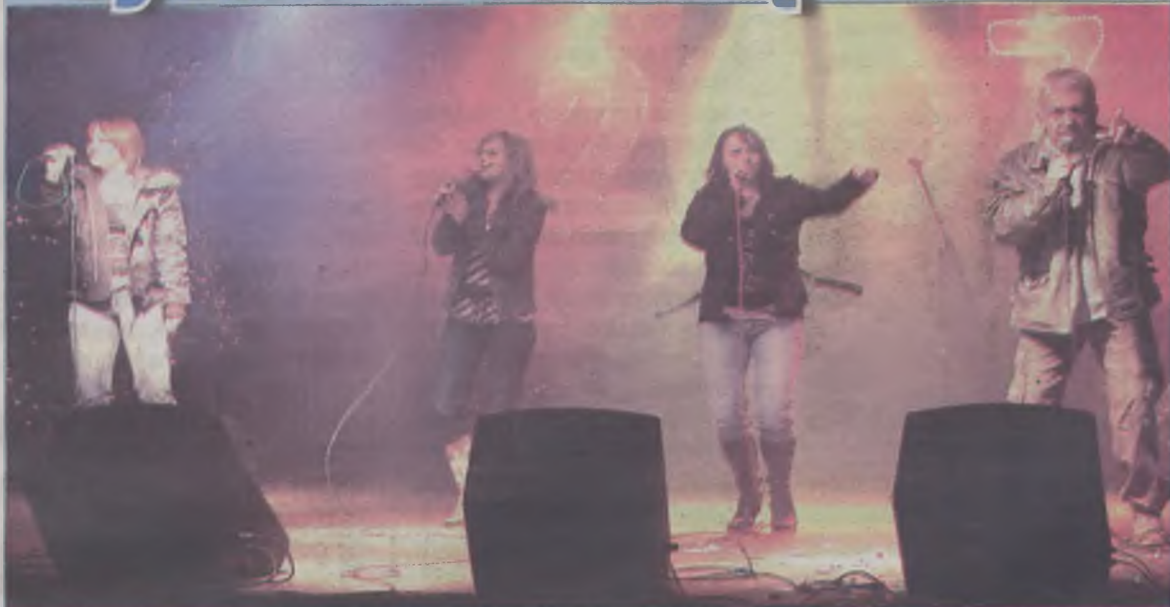
Przeboje Abby po polsku wykonał dla zebranej publiczności zespół Abba Forewer