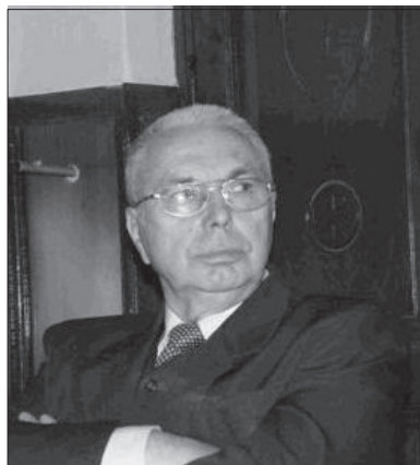
Autor wspomnień w 2012 r.

Relacja z przeżyć naszej rodziny w latach 1939–1945 powstała z tego, co widziały moje oczy i co zarejestrował mój mózg. Czy jest absolutnie obiektywna? Za to nie mogę ręczyć. Ja tylko mogę stwierdzić, że tak to przeżyłem i tak to zostało zarejestrowane w mojej wtedy nieletniej i jeszcze niedoświadczonej głowie. Wielka szkoda, że tak mało dyskutowaliśmy na ten temat ze starszymi braćmi i rodzicami wtedy, kiedy jeszcze żyli. Teraz już nie żyją i z wielkim żalem stwierdzam, nie mam z kim skonfrontować moich wspomnień z tego okresu. Starałem się jak najbardziej nie tworzyć nic nowego poza tym, co pozostało w mojej głowie. Mam nadzieję, że może moi następcy przeczytają ten tekst i zastanowią się nad trudnym, przeszłym losem swoich przodków. Ta właśnie idea przyświecała mi w czasie rozmyślań nad czasem przeszłym i w czasie pisania tych wspomnień.