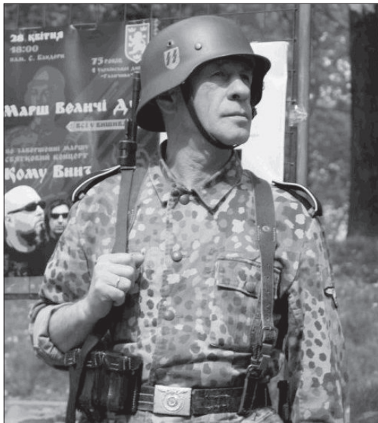
Ukraińiec w mundurze żołnierza z Waffen SS podczas obchodów rocznicy powstania SS Galizien.

Szkoły mniejszości ukraińskiej finansowane są przez polskiego podatnika, w tym potomków ofiar ukraińskiego ludobójstwa, toteż rzeczą absolutnie skandaliczną i niedopuszczalną jest propagowanie w tych placówkach ideologii banderowskiej, odpowiedzialnej za masowe mordy ludności polskiej. Jest to możliwe tylko dzięki braku nowelizacji Ustawy o IPN, wprowadzającej penalizację propagowania banderyzmu w Polsce, co powoduje, że środowiska