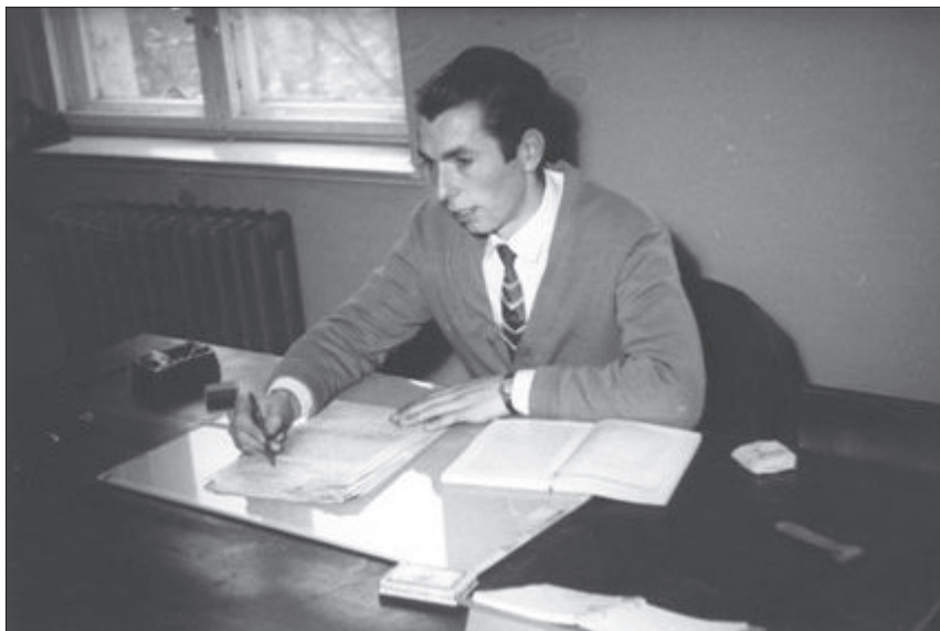
Autor wspomnień przy pracy w Powiatowej Radzie Narodowej w Ząbkowicach Śląskich, 1955 r.

Postanowiliśmy, że trzeba zobaczyć co jest w tych barakach. Po naradzie postanowiono, że ja mam pójść, byłem przecież najmłodszy. Schowaliśmy się wszyscy w chaszczach, a ja podczołgałem się do rogu baraku wtedy, gdy żołnierz