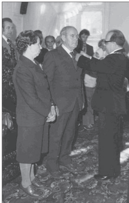
Zdjęcie nie żyjących już moich rodziców z 1981 r. Przedstawia moment dekorowania medalem za długotrwałe pożycie małżeńskie, Złote Gody.