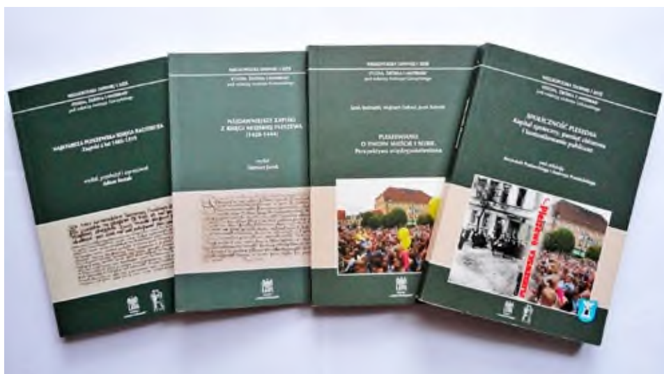
Zeszyty naukowe wydane przez Centrum „Instytut Wielkopolski” UAM w ramach prac nad nową monografią Pleszewa.