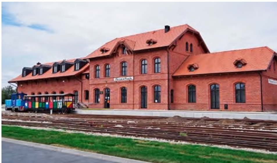
Nowa siedziba Biblioteki, ul. Kolejowa 1.

lat w pierwszej piątce pod względem liczby czytelników i wypożyczeń 10 , a podejmowane przez nią inicjatywy wpisały się na stałe do repertuaru propozycji kulturalnych dla mieszkańców ziemi pleszewskiej.