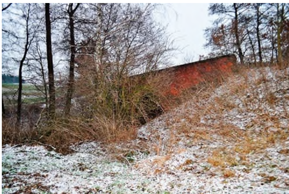
Kamienny most na Nerze. Stan obecny.