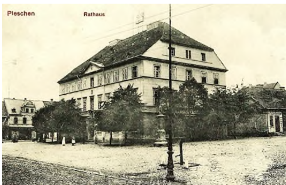
Pleszewski ratusz w okresie zaborów. Pocztówka ze zbiorów Muzeum Regionalnego w Pleszewie.