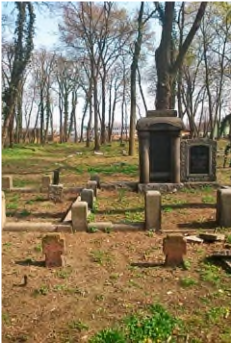
Miejsce pochówku żołnierzy niemieckich z czasów I wojny światowej na cmentarzu ewangelickim w Pleszewie.