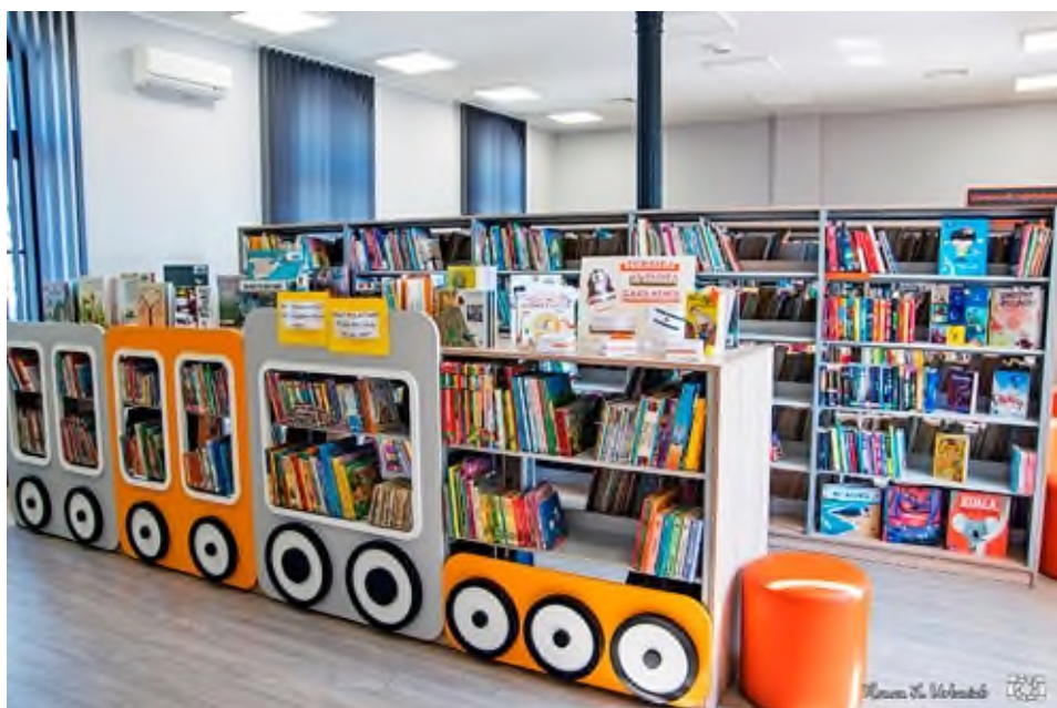
Dział dziecięcy.