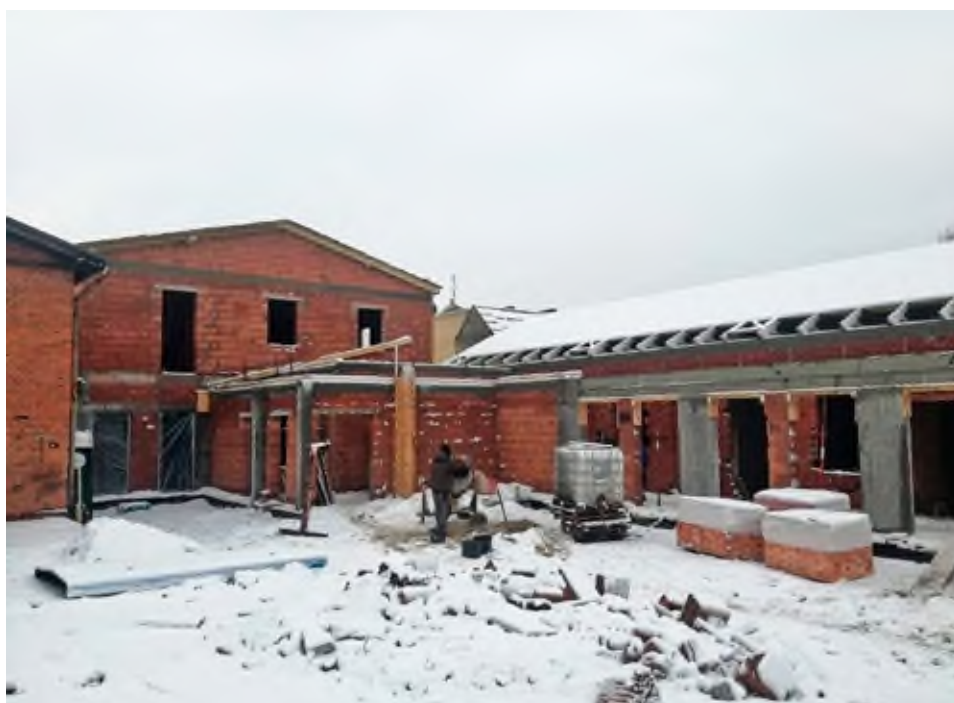
Dom Kultury w trakcie budowy, styczeń 2019 r.