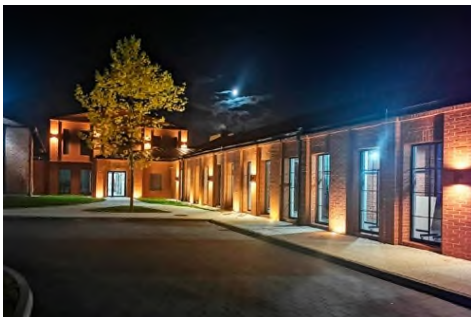
Nowa siedziba Domu Kultury w Pleszewie przy ul. Kolejowej 3.