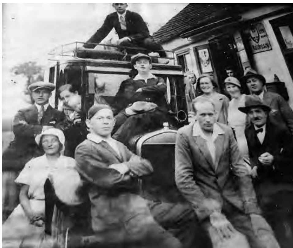
Zdjęcie wykonane przed Gościńcem Małolepszego.