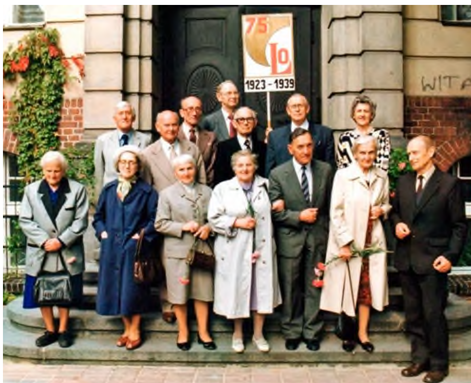
Jubileusz 125-lecia pleszewskiej szkoły średniej – Gimnazjum i Liceum Ogólnokształcącego im. St. Staszica w Pleszewie w dniu 21 września 1996 r. Na zdjęciu uczestnicy zjazdu z roczników 1923–1939.