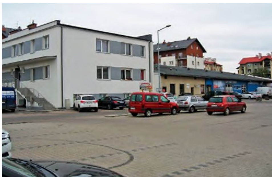
Obiekty przy ulicy Targowej w Pleszewie po byłej Spółdzielni. Stan z listopada 2019 r.