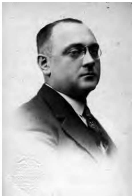
Teodor Seweryn Ciążyński