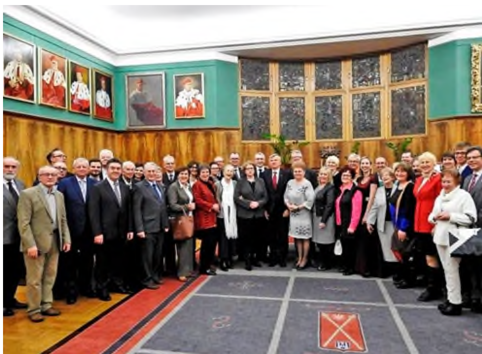
Drugie spotkanie pleszewian w Poznaniu. Zwiedzanie gabinetu Rektora UAM, marzec 2016.