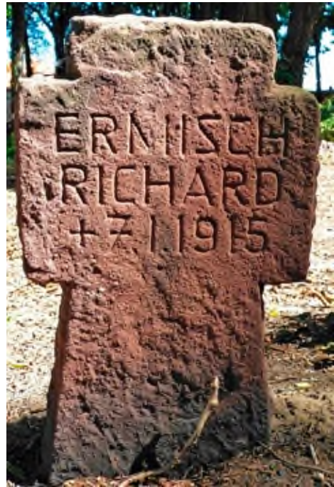
Krzyż z piaskowca symbolizujący żołnierskie groby.