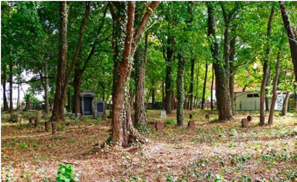
Miejsce pochówku żołnierzy niemieckich z czasów I wojny światowej na cmentarzu ewangelickim w Pleszewie.