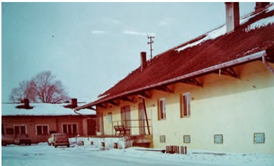
Magazyn z rampą załadunkową. Stan z roku 1979.