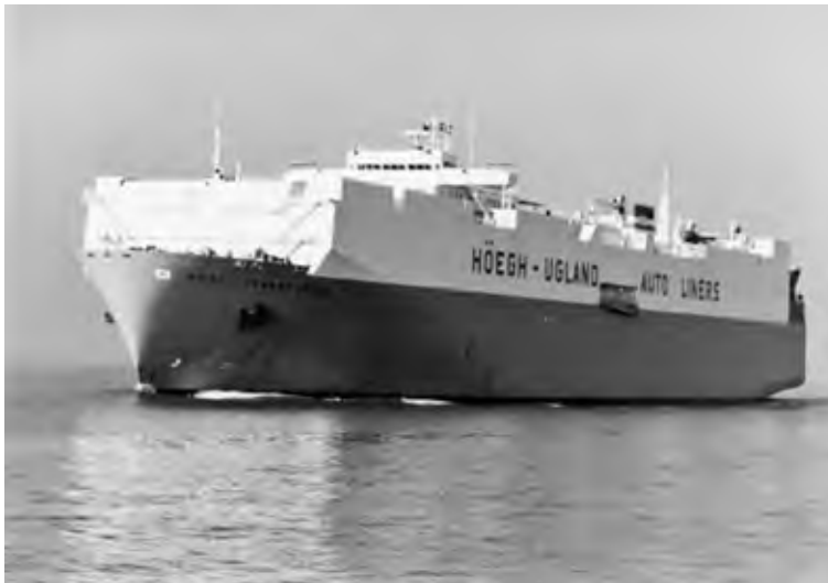
HUAL TRANSPORTER zaprojektowany przez Wojciecha Żychskiego. Reprezentuje statki zwane „Wojtkami”.