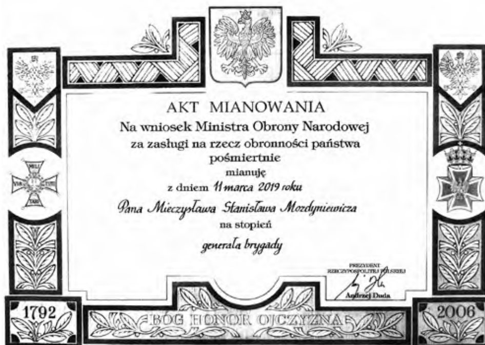
Akt mianowania Mieczysława Mozdyniewicza na stopień generalski.