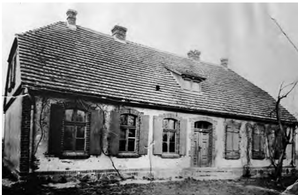
Budynek pruskiego odwachu, lata 30. XX wieku.