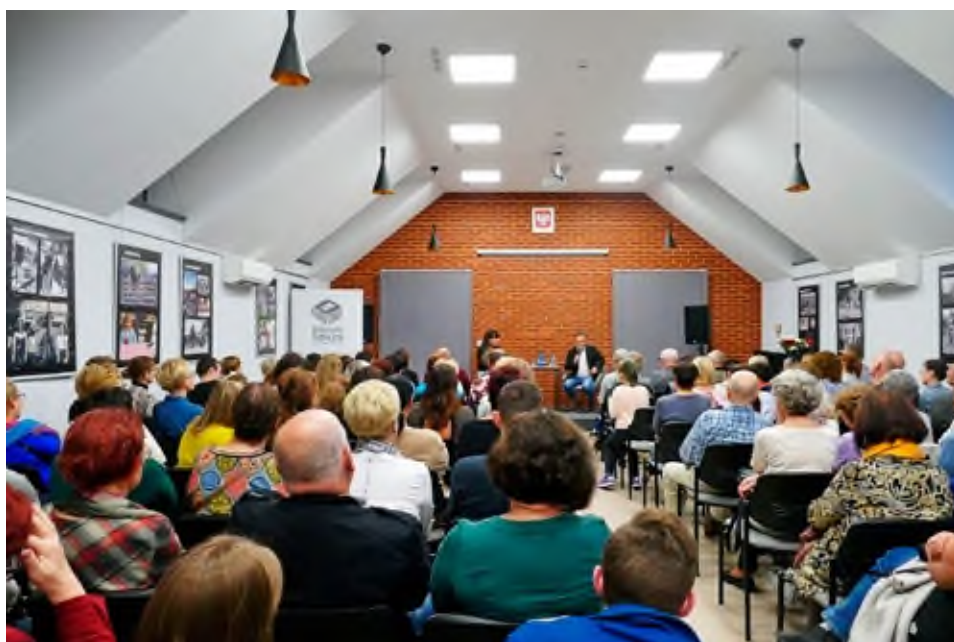
Spotkanie z Robertem Makłowiczem.