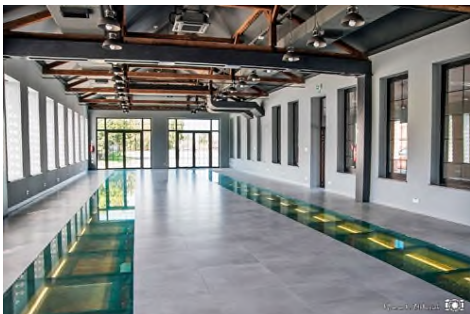
Zajeżdźnia Kultury czyli sala koncertowa z zabytkowymi podświetlanymi torami.