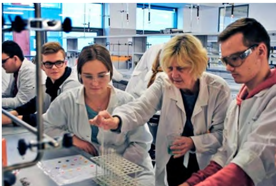
Uczniowie Niepublicznego Liceum Ogólnokształcącego w Pleszewie podczas warsztatów na Wydziale Chemii UAM, listopad 2017.