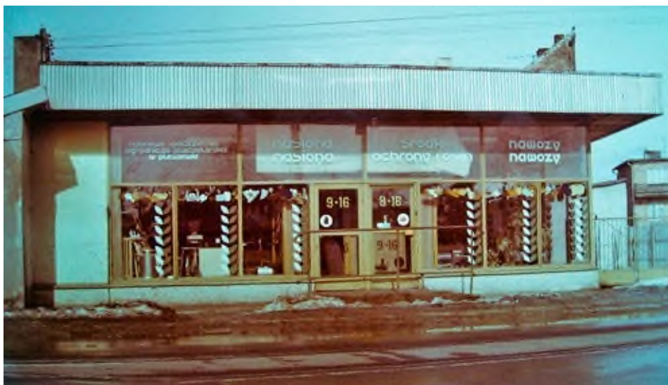
Sklep przy ulicy Hallera w Pleszewie. Stan z 1987 r.