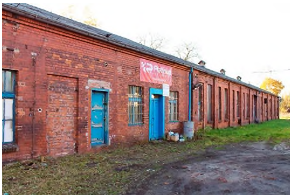
Stara parowozownia przed remontem, 2015 r.