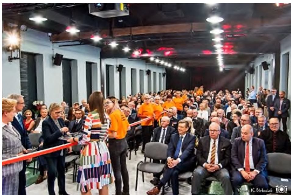
Uroczyste przecięcie wstęgi podczas otwarcia nowej siedziby DK.