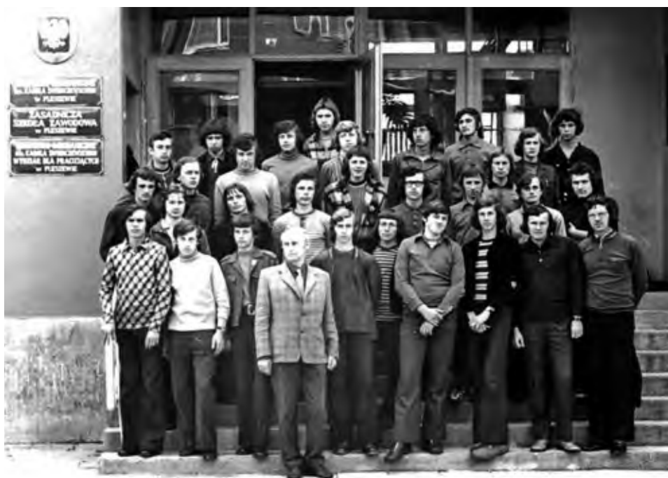
Nauczyciel w Technikum Mechanicznym w Pleszewie, lata 70. XX wieku.