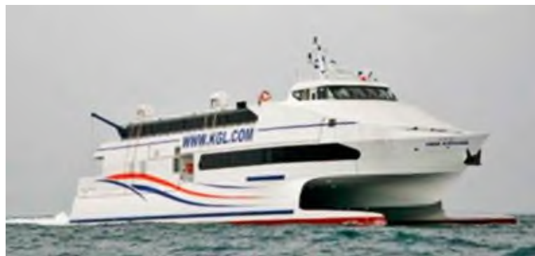
Katamaran według projektu Zbigniewa Fórmanekiewicza.