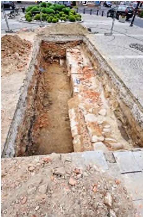
1. Pleszew, Rynek: widok na wykop pod nieckę fontanny z fundamentem budynku.