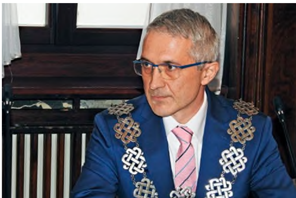
Burmistrz Arkadiusz Ptak po zaprzysiężeniu na Sesji Rady Miejskiej w dniu 19 listopada 2018 roku