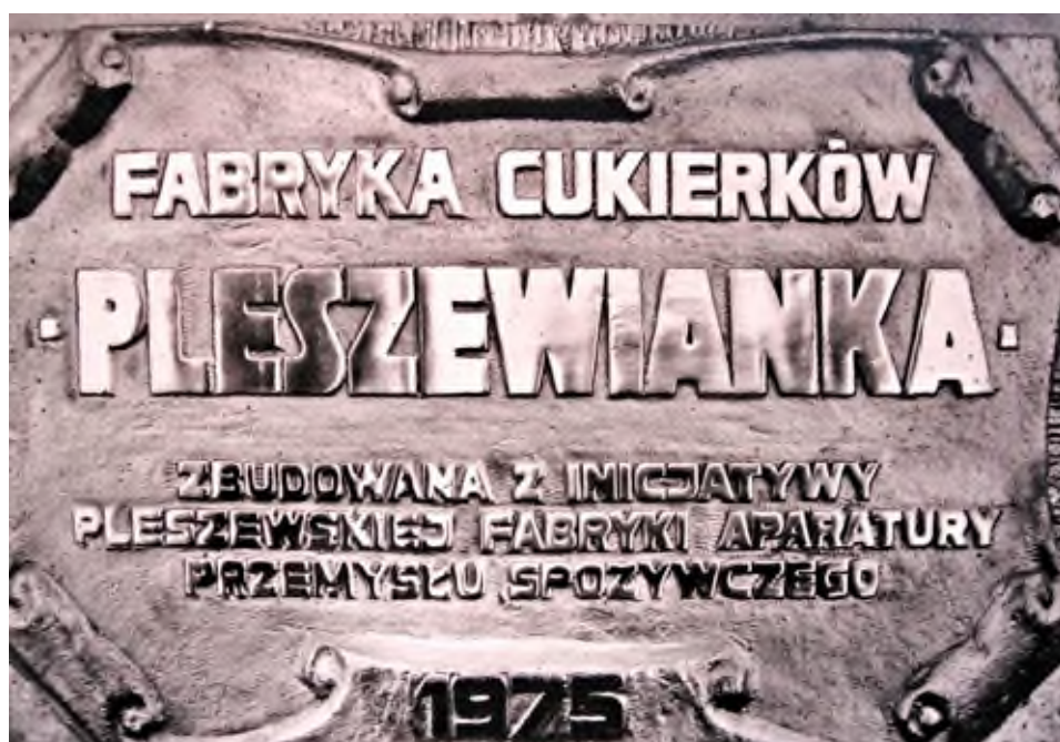
Tablica pamiątkowa, która była umieszczona na zewnętrznej ścianie hali produkcyjnej widoczna przy wejściu do wytwórni.