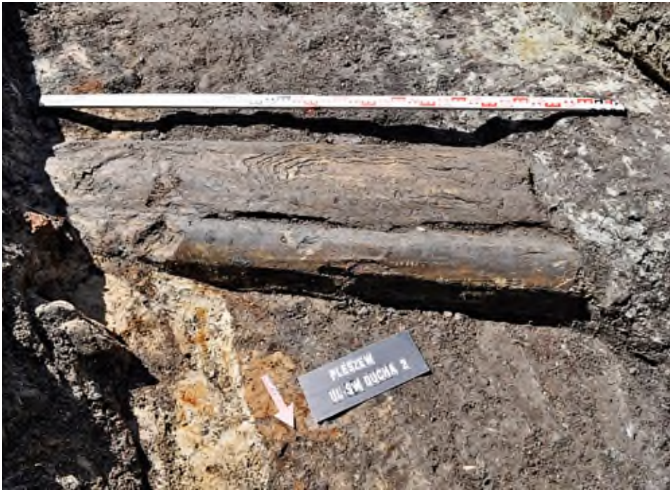
9. Pleszew, ul. św. Ducha: widok na drewnianą rurę wodociągową.