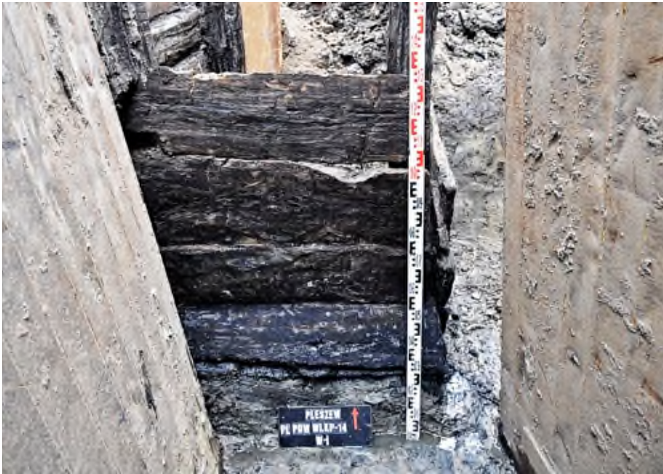
13. Pleszew, Plac Powstańców Wielkopolskich 14: widok na profil drewnianej studni nr 2.