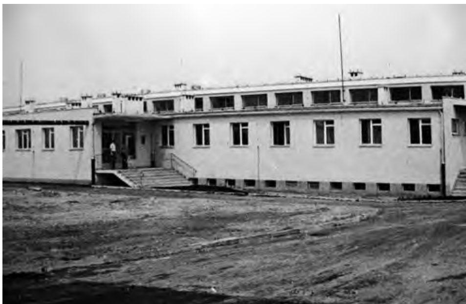
Hala produkcyjna, widok od strony południowej.