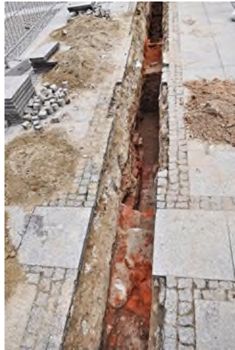
2. Pleszew, Rynek: wykop pod przyłącze wodociągowe i energetyczne z fundamentami i fragmentem podłogi budynku.