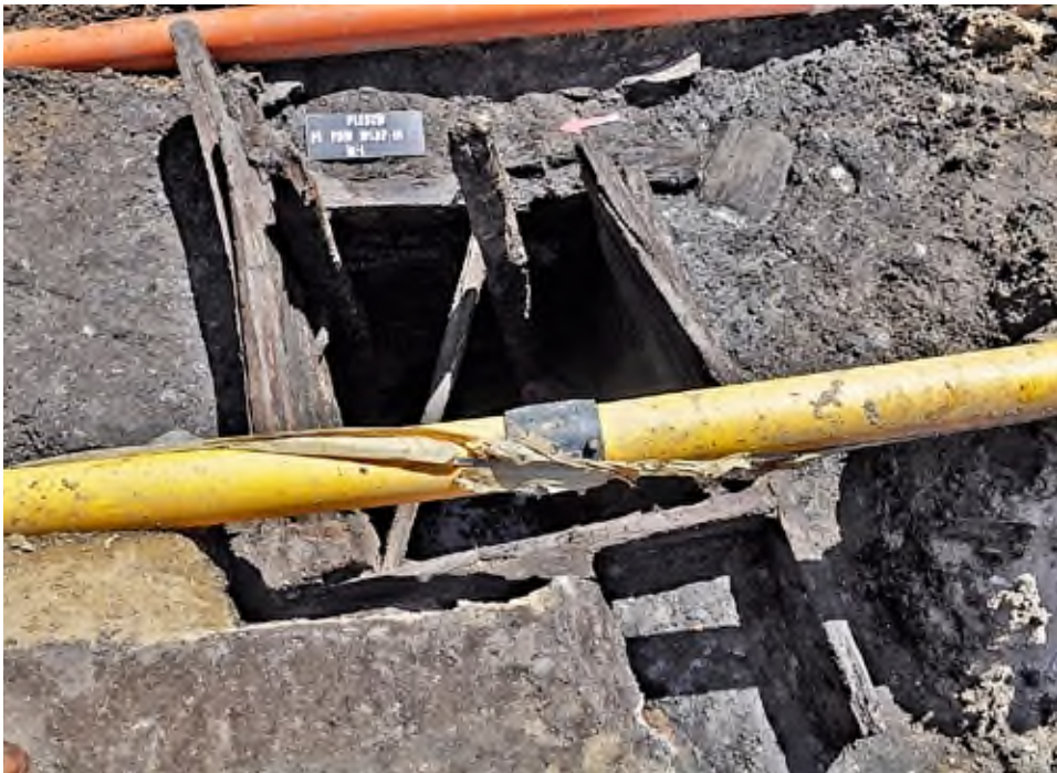
10. Pleszew, Plac Powstańców Wielkopolskich 14: widok na rzut drewnianej studni nr 1.