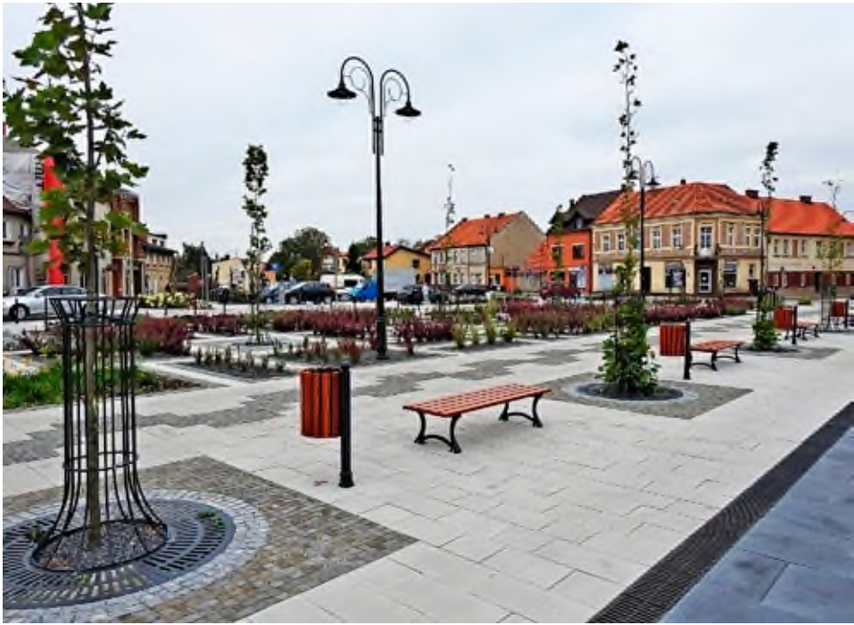
Rewitalizacja Placu Powstańców, 2018 rok.