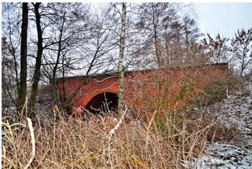
Most na Nerze z 1942 roku.