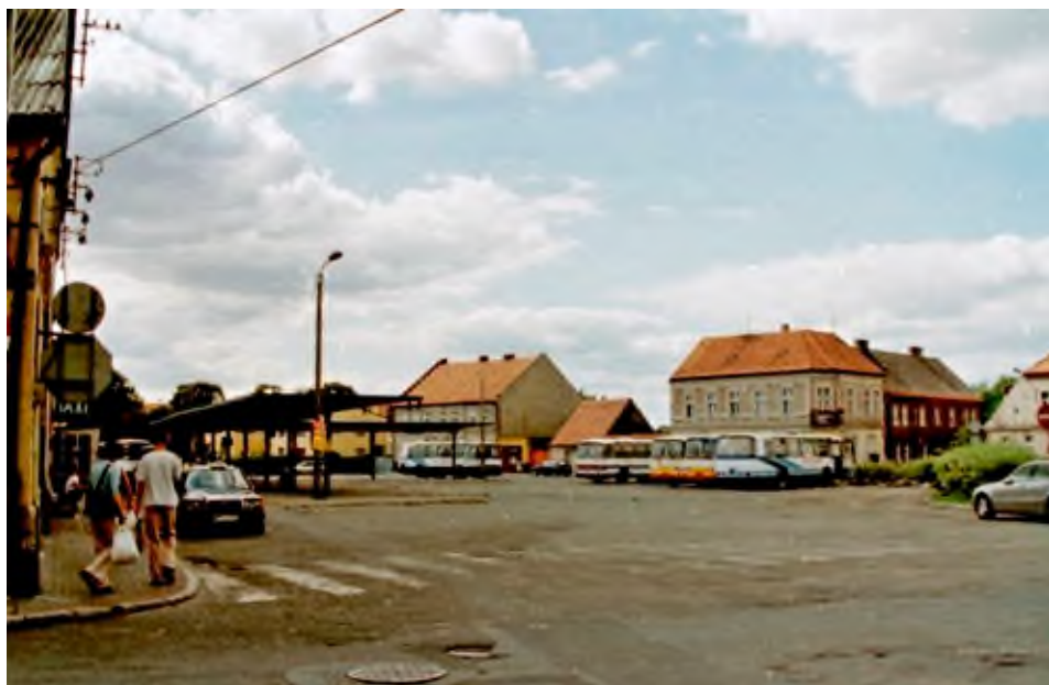
Plac Powstańców przed rewitalizacją.

Plac Powstańców Wielkopolskich i otoczenie zyskały nowe elementy zagospodarowania i małej architektury w tym: wiatę przystankową, gablotę informacyjną, ławki parkowe, stojaki na rowery, kosze na śmieci. Pomimo wykopalisk archeologicznych, awarii sieci wodociągowych czy niekorzystnych warunków pogodowych prace ukończono w czerwcu 2018 r. Całkowity koszt wykonanych prac z kosztem dokumentacji oraz nadzorem inwestorskim zamknął się w kwocie ok. 4.430.000 zł.