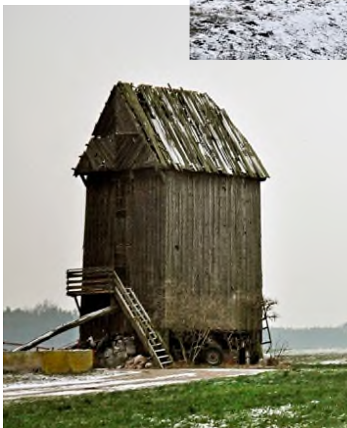
Wiatrak po Jarosińskich na Wygnańcu.