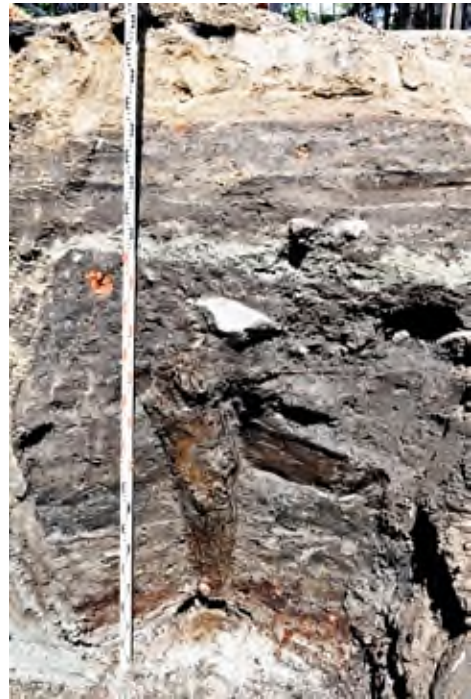
8. Pleszew, ul. Poznańska: profil wykopu z widoczną konstrukcją drewnianą.