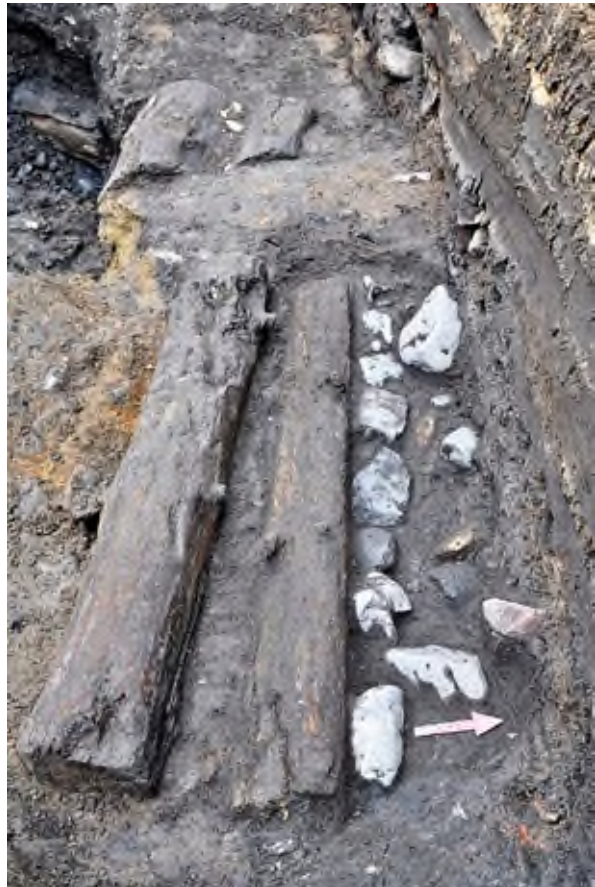
5. Pleszew, ul. Poznańska: widok na konstrukcje drewniano – kamienną.