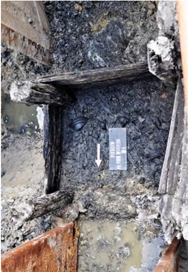
12. Pleszew, Plac Powstańców Wielkopolskich 14: widok na rzut drewnianej studni nr 2 wraz z wypełniskiem i fragmentami ceramiki naczyniowej.