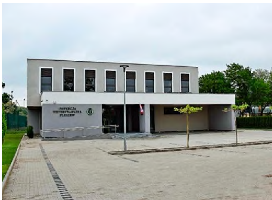
Budynek Inspekcji Weterynaryjnej w Pleszewie, fot. Rafał Kolanowski