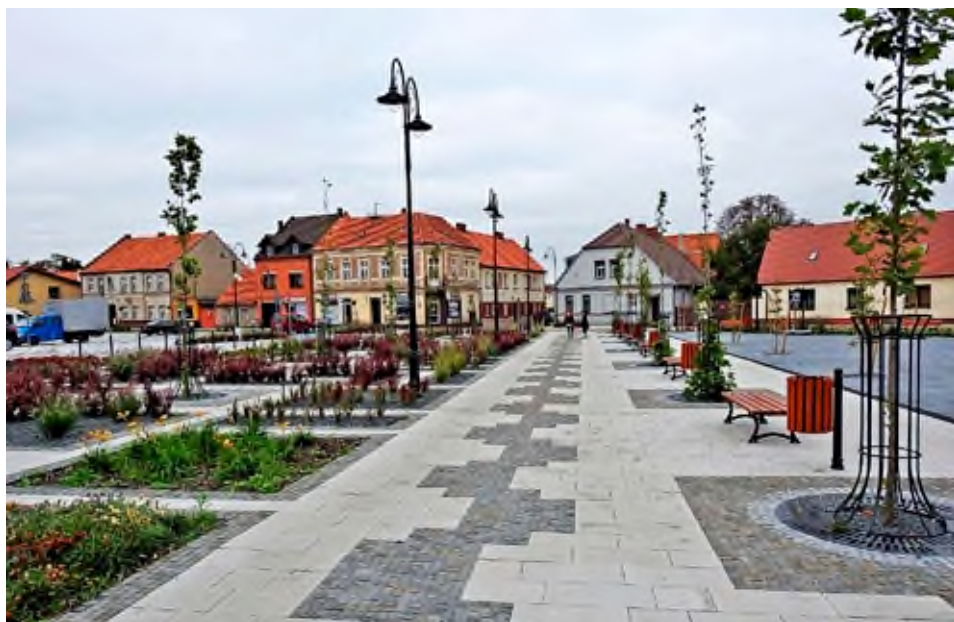
Rewitalizacja Placu Powstańców, 2018 rok.