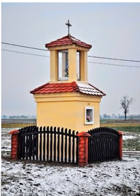
Kapliczka Michałowiczów na Wygnańcu.