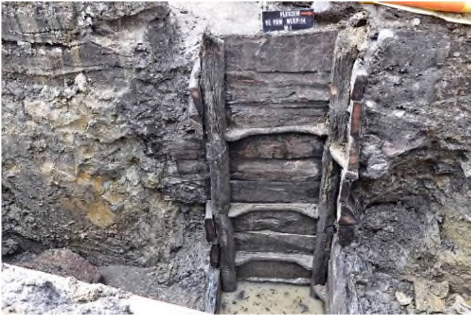
11. Pleszew, Plac Powstańców Wielkopolskich 14: widok na profil drewnianej studni nr 1.