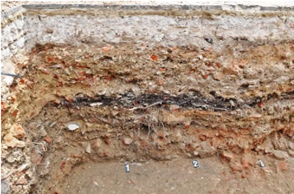
4. Pleszew, Rynek: widok na fragment profilu wykopu pod nieckę fontanny.