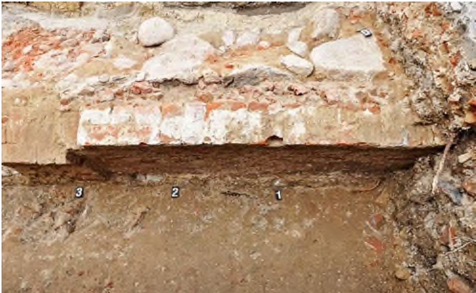
3. Pleszew, Rynek: widok na fragment fundamentu ceglanego budynku.