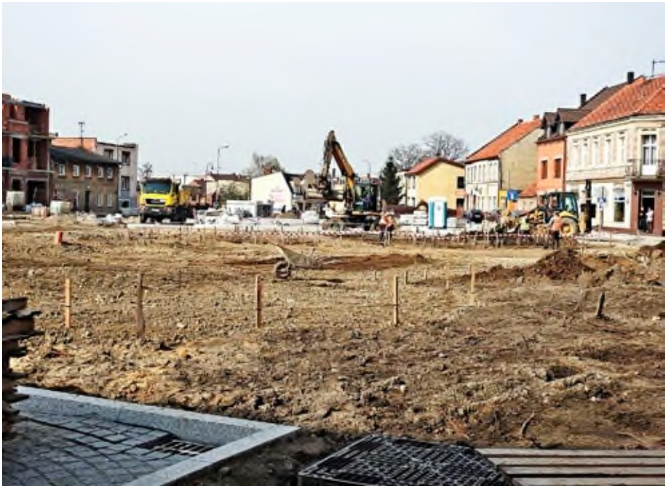
Rewitalizacja Placu Powstańców, 2018 rok.