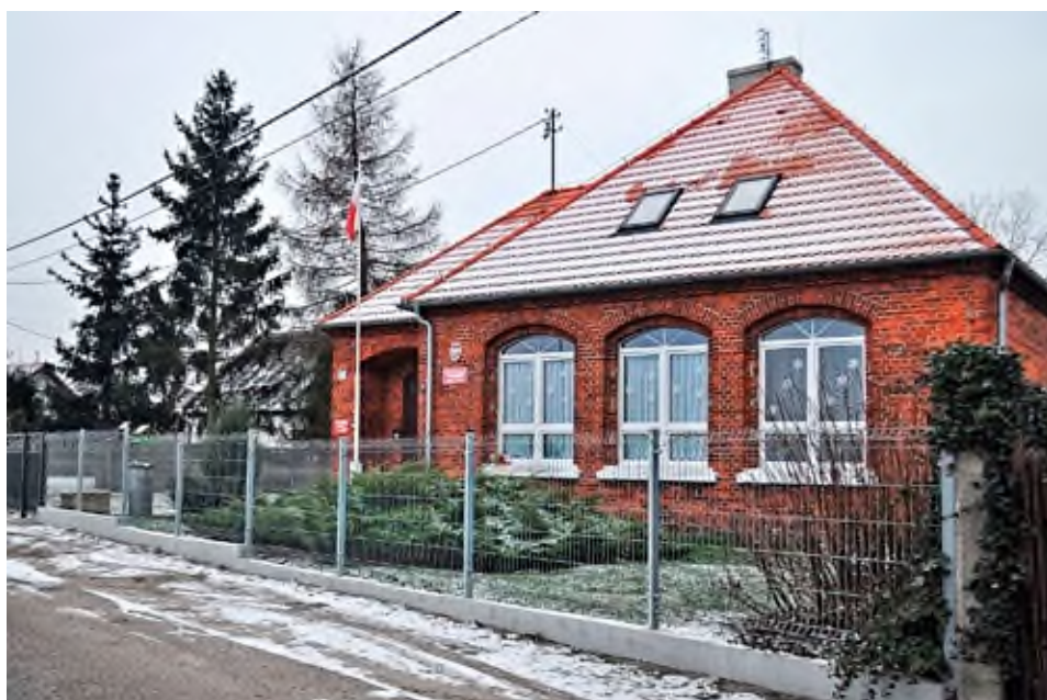
Budynek szkoły z 1895 roku na Wygnańcu.