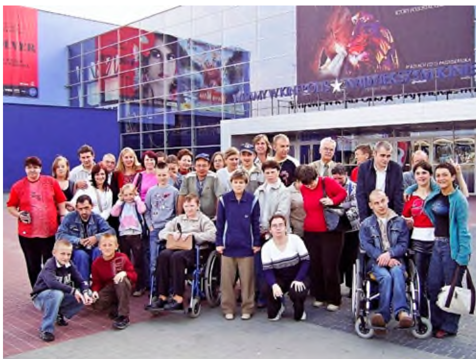
Impreza integracyjna, wspólny wyjazd do Kinemapolis, 2006 rok