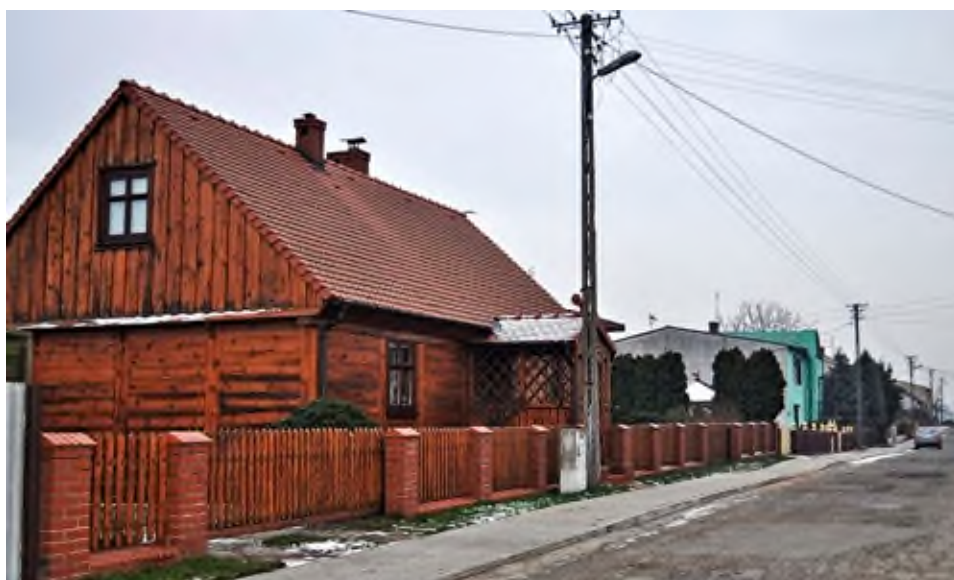
Zabytkowy dom Pisarskich, później Kempieńskich, Tanasiów, Sobczaków.