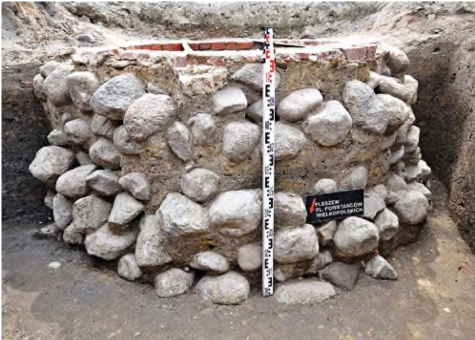
15. Pleszew, Plac Powstańców Wielkopolskich: widok na profil studni kamiennej.