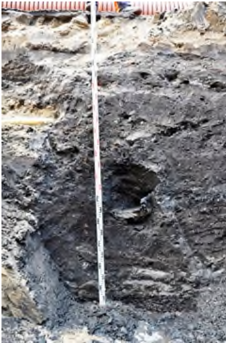
7. Pleszew, ul. Poznańska: profil wykopu z widocznym fragmentem drewnianego rynsztoku.