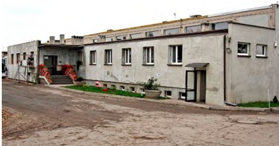
Zajezdnia autobusowa PLA, która mieści się na terenie byłej wytwórni – stan obecny.