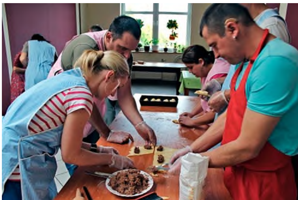
Pracownia Funkcjonowania w Codziennym Życiu, 2013 rok