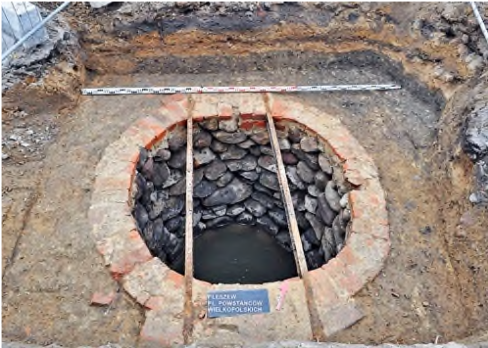
14. Pleszew, Plac Powstańców Wielkopolskich: widok na rzut studni kamiennej.