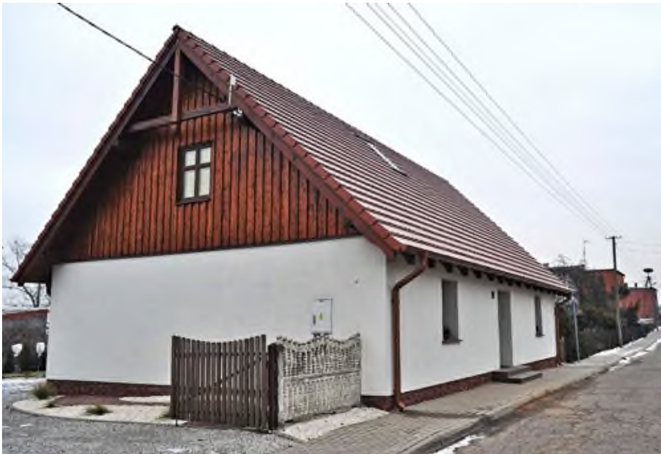
Zabytkowy dom Szwedka.