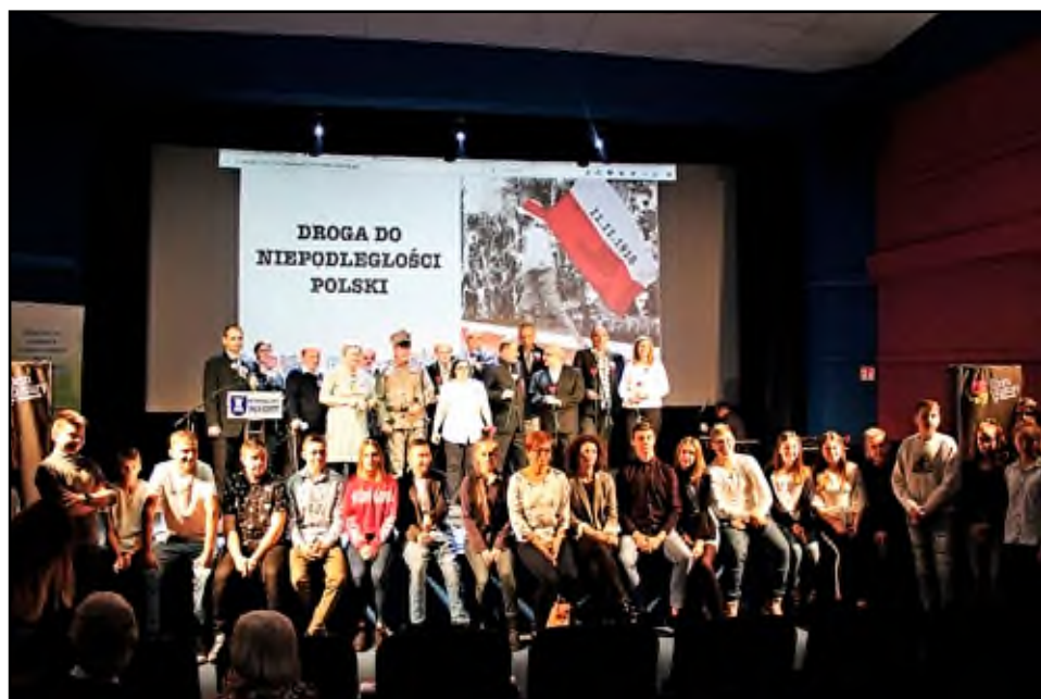
Obchody z okazji 100-lecia odzyskania niepodległości, listopad 2018