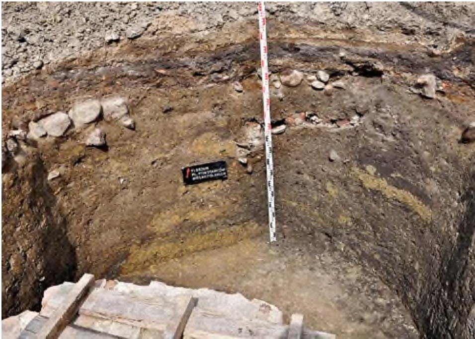
16. Pleszew, Plac Powstańców Wielkopolskich: widok na profil wykopu obok kamiennej studni.