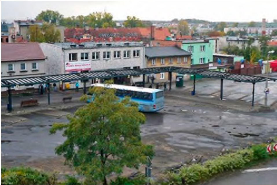
Plac Powstańców przed rewitalizacją.