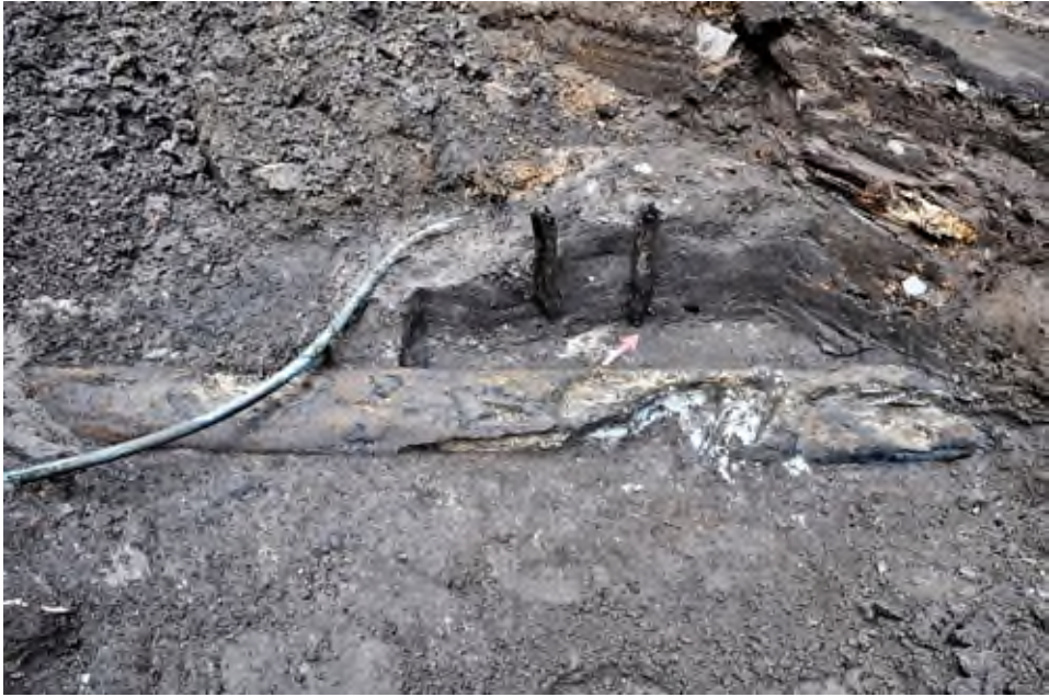
6. Pleszew, ul. Poznańska: widok na drewnianą rurę wodociągową.