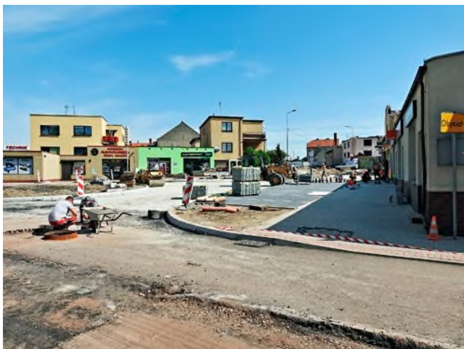
Przebudowa ulicy Św. Ducha i Sopałowicza, 2018 rok.