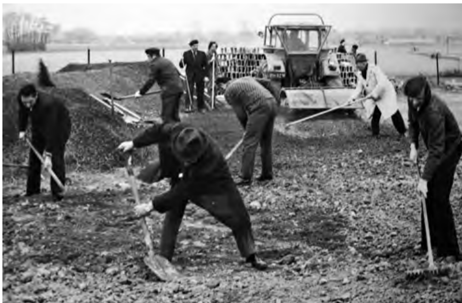
Prace porządkowe w ramach czynu społecznego wykonywane przez pracowników SPOMASZ.