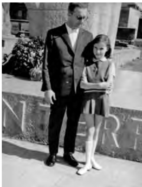
Autorka z Ojcem pod pomnikiem papieża Jana XXIII we Wrocławiu, ok. 1968 r.