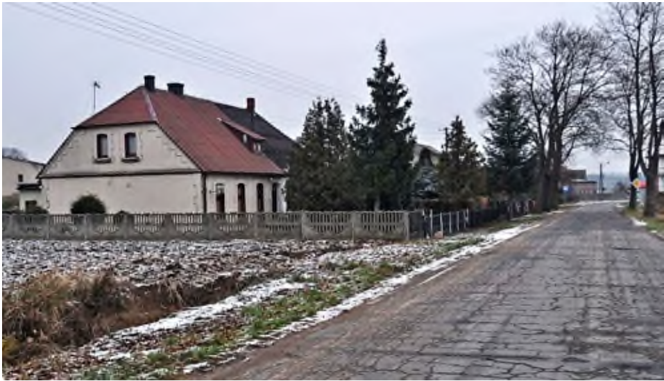
Odwach – pozostałość po zaborze pruskim.