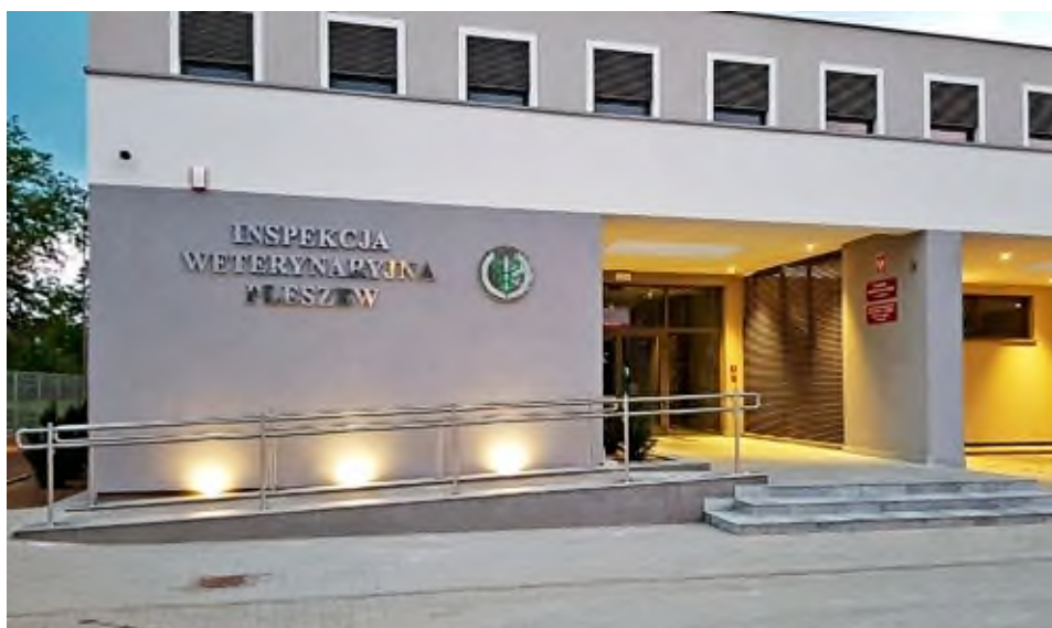
Budynek Inspekcji Weterynaryjnej w Pleszewie