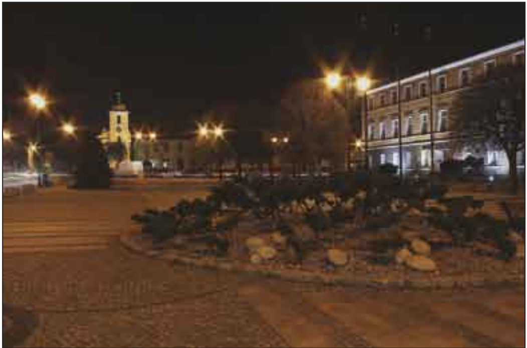
Rynek pleszewski po przebudowie.