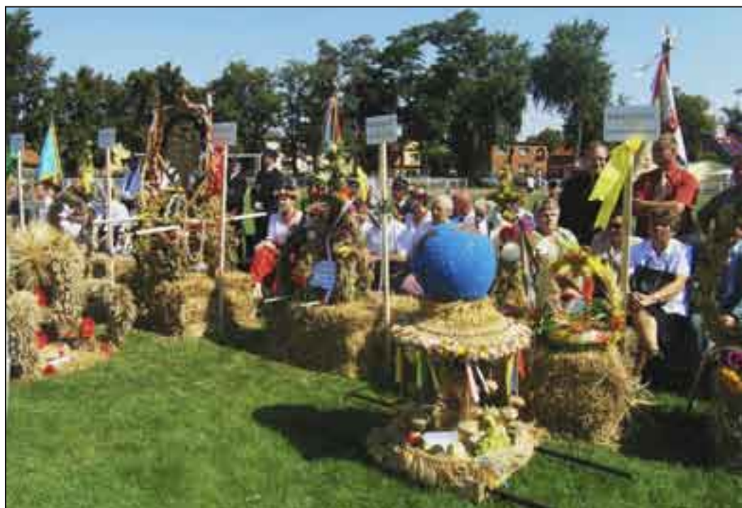
Scenografię dożynek stanowiły dekoracyjne wieńce przywiezione ze wszystkich dekanatów diecezji.