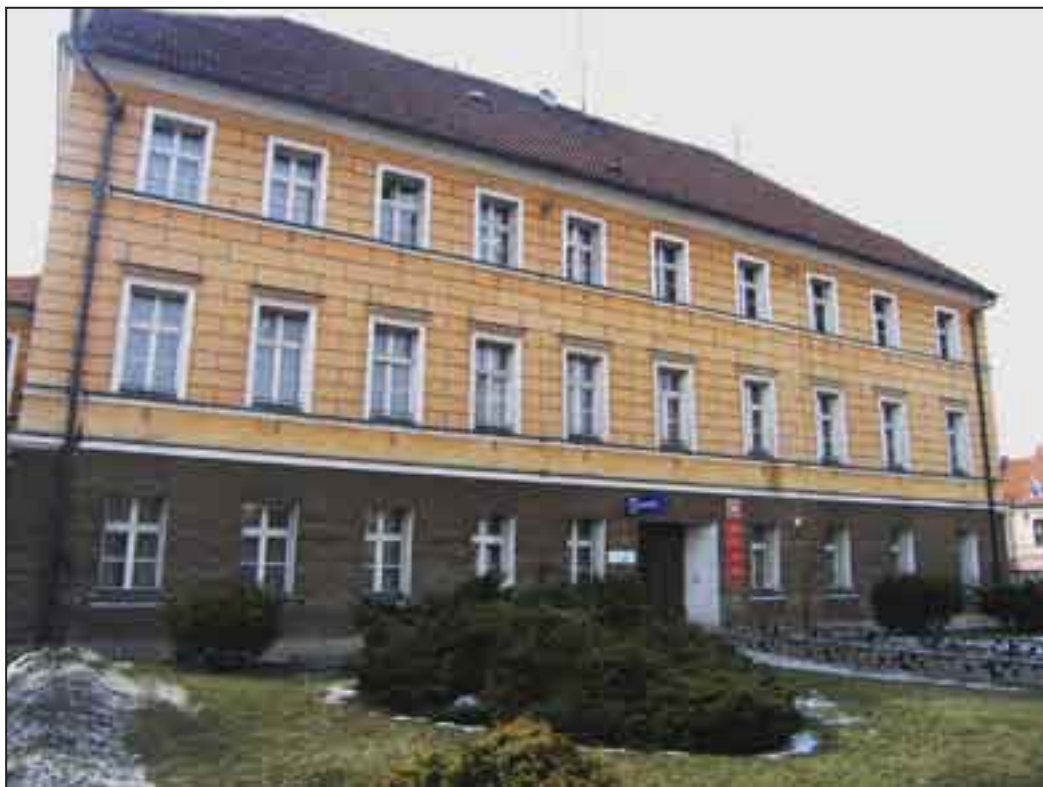
Północna strona płyty Rynku przed remontem.

Wręczając nagrody na ręce Burmistrza sekretarz stanu Piotr Styczeń podkreślił, że: „Przebudowę i modernizację Rynku wykonano ze szczególną starannością. Prace objęły wykonanie nawierzchni, odwodnienia, wykonano elementy małej architektury i oświetlenie. A wszystko z zastosowaniem materiałów budowlanych korespondujących z otoczeniem”.