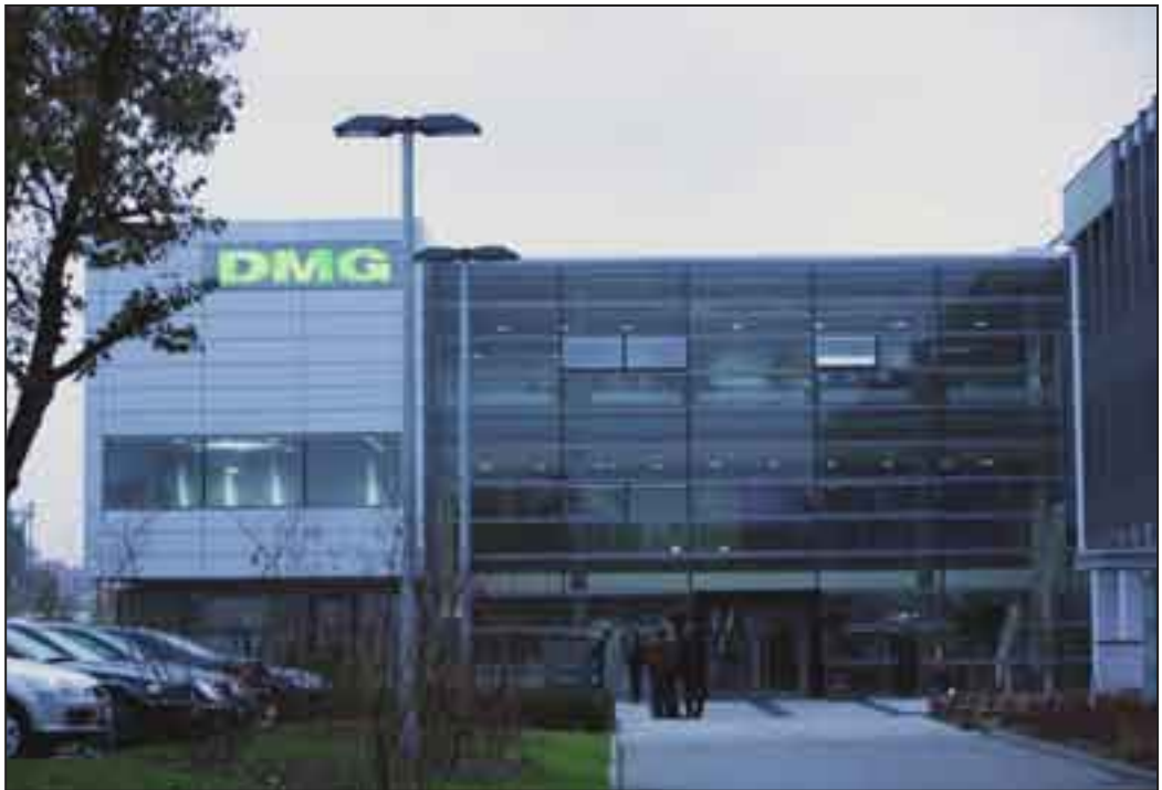
Budynek z zewnątrz 10.2007 r.