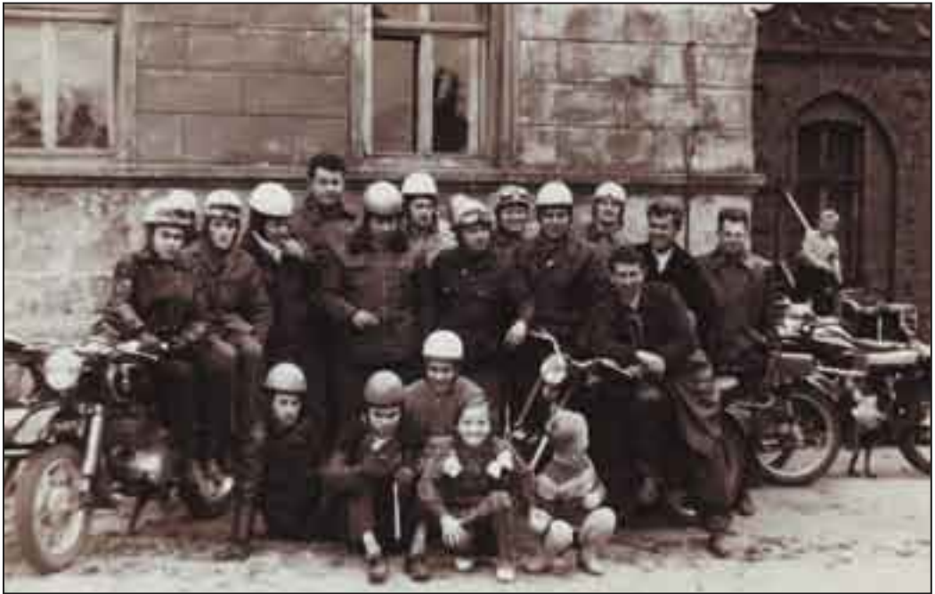
Wyjazd do Taczanowa w 1962 roku.