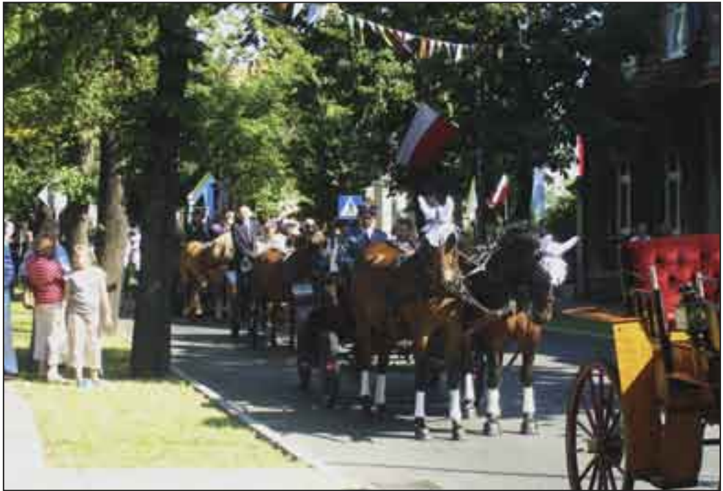
W barwnym korowodzie uczestnicy dożynek udali się ulicami miasta na stadion miejski.