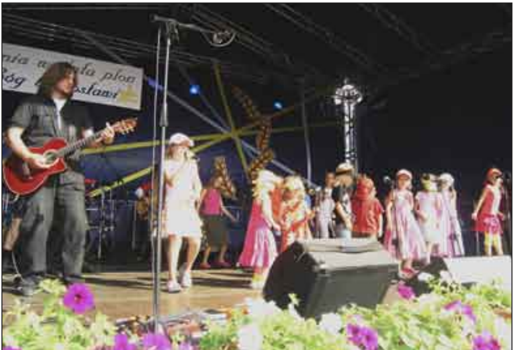
Występ zespołu „Arka Noego” zgromadził liczną publiczność.