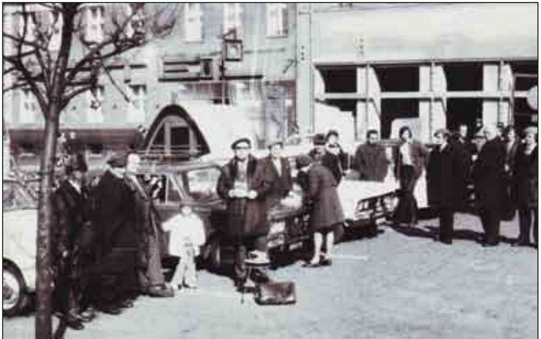
Start do rajdu z pleszewskiego Rynku.