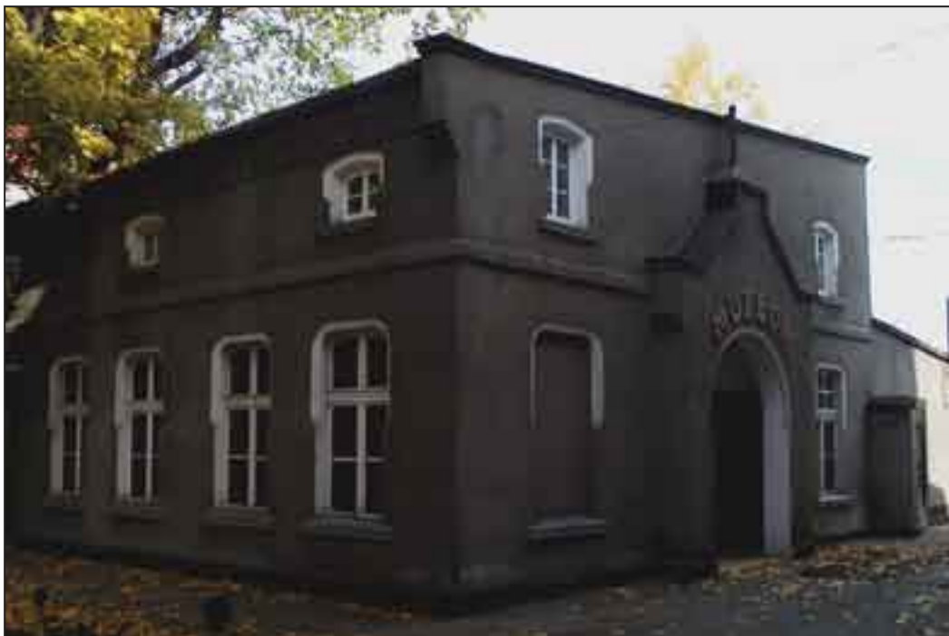
Budynek Muzeum (dawne prosektorium i kaplica przyszpitalna)