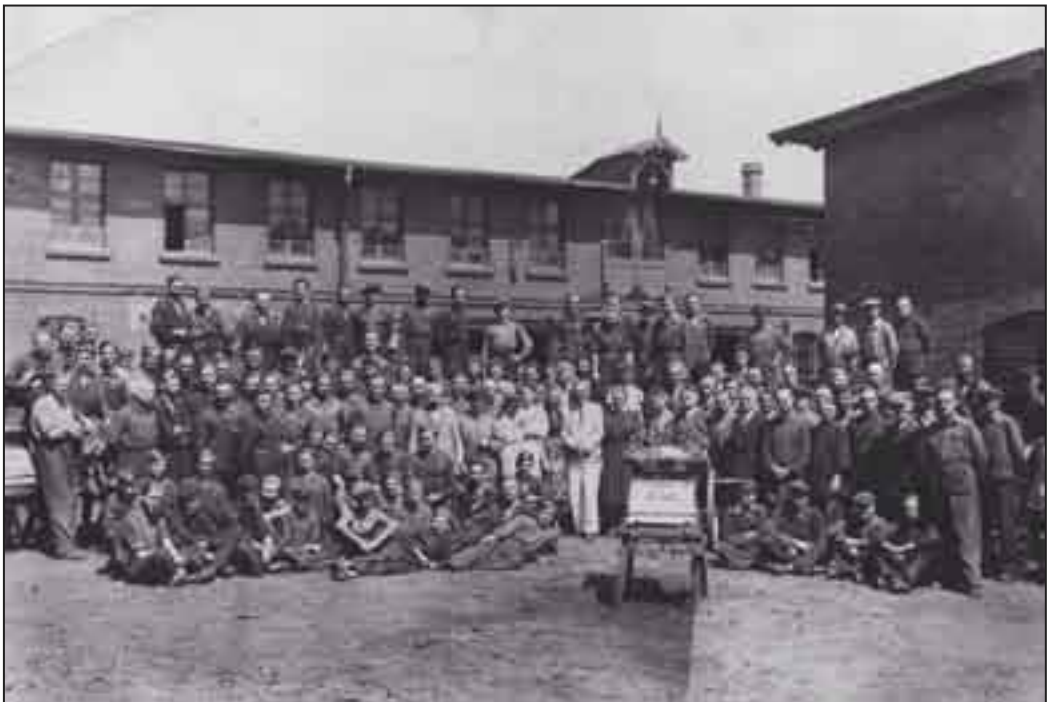
Fotografia załogi z 1943 roku.