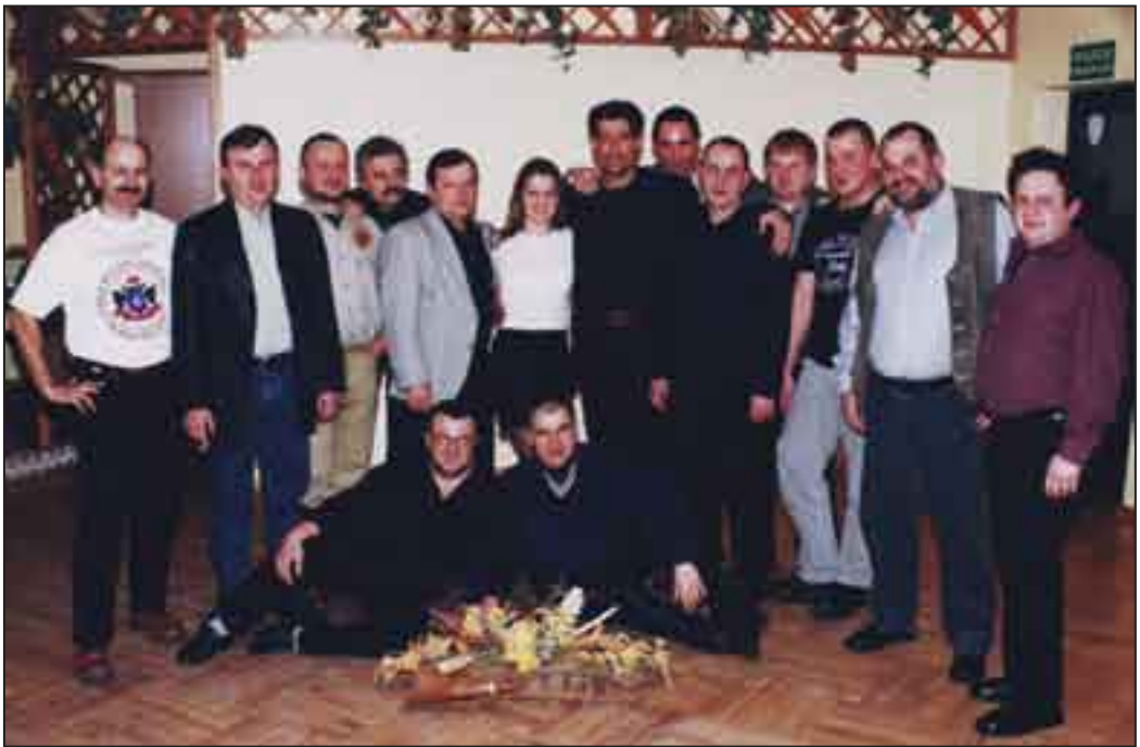
Pleszewski Klub Motocyklowy „PLATAN” w SEVIE w 2003 r.