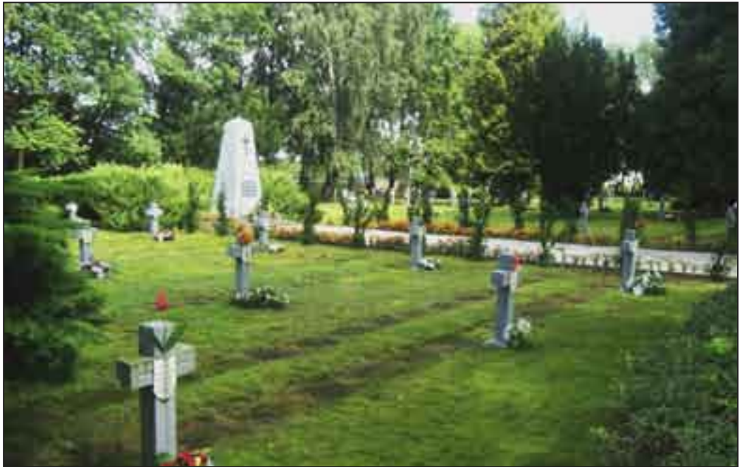
Cmentarz w Rybnie.