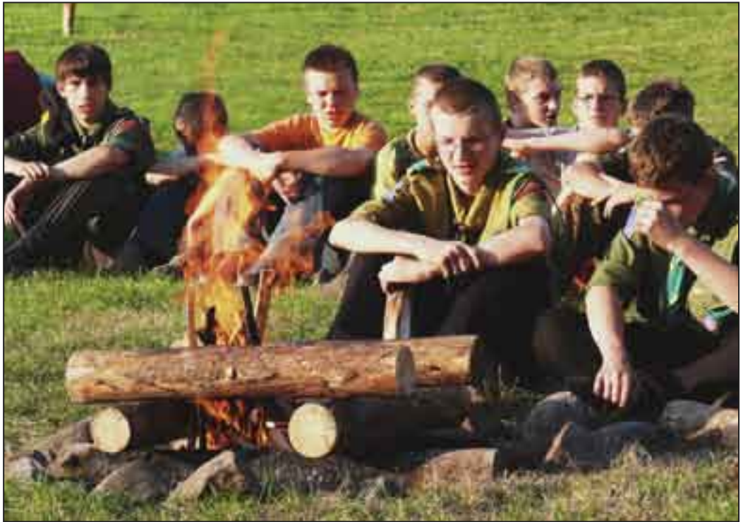
Światowy Zlot ZHP Kielce 2007 r.