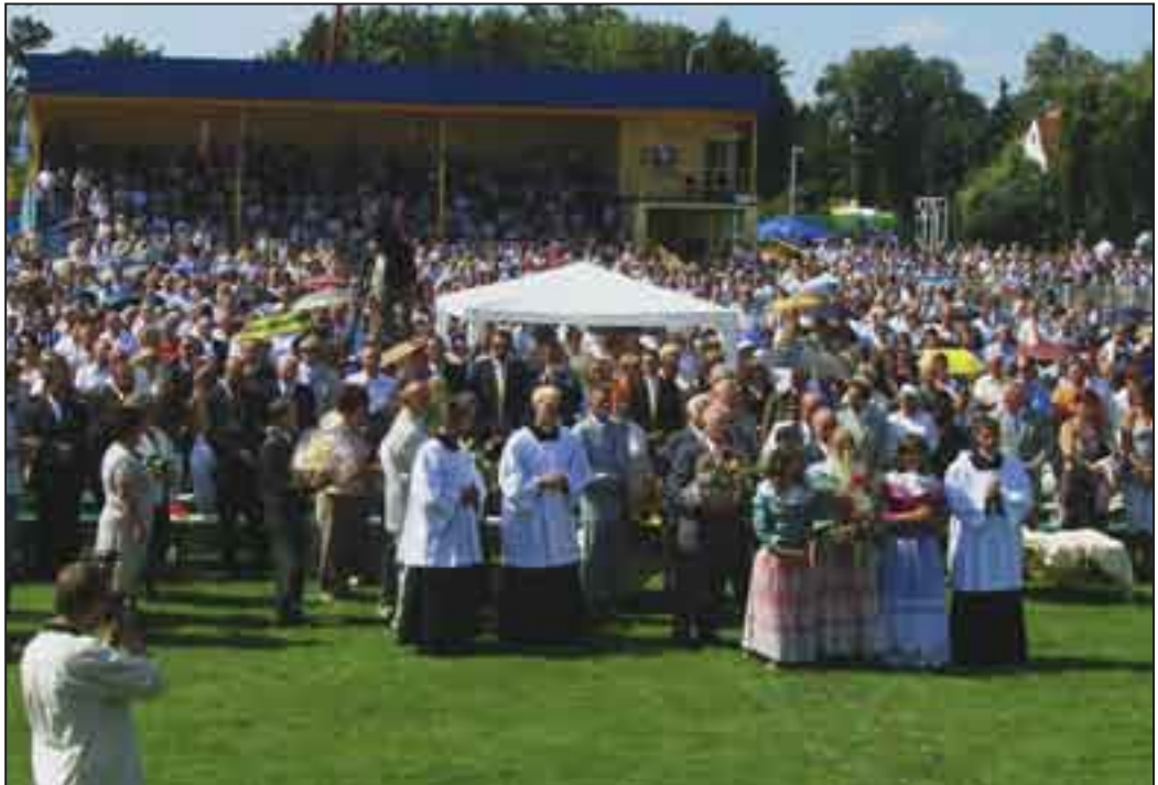
W trakcie Mszy św. przedstawiciele różnych grup społecznych utworzyli procesję z darami.