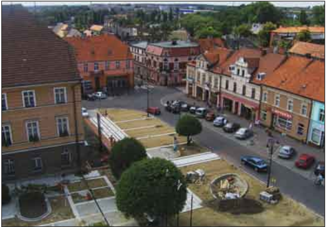
Przebudowa płyty Rynku. Prace wykonuje Przedsiębiorstwo Produkcyjno -Usługowo-Handlowe Gembiak & Mikstacki z Krotoszyna.