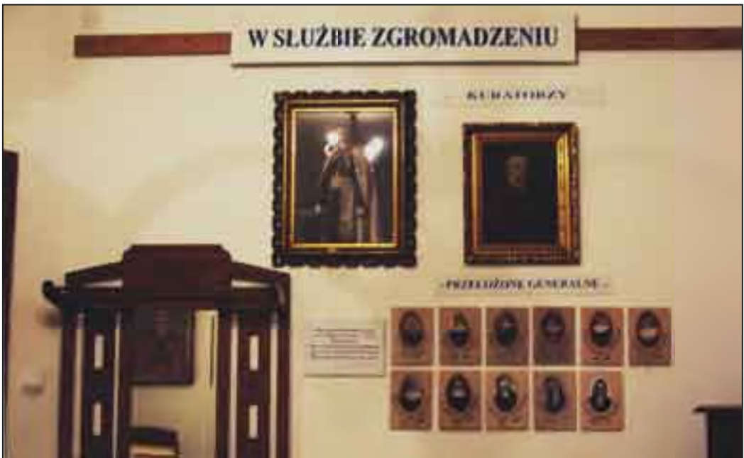
Jedna z sal wystawowych Muzeum na parterze.