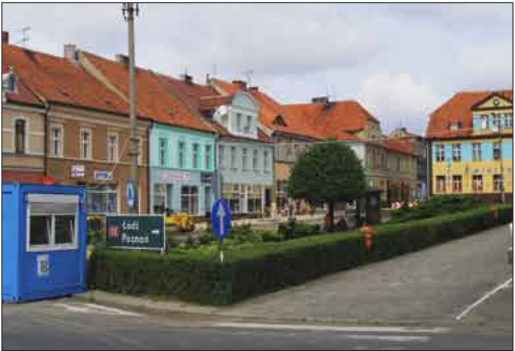
Zachodnia strona Rynku przed przebudową.