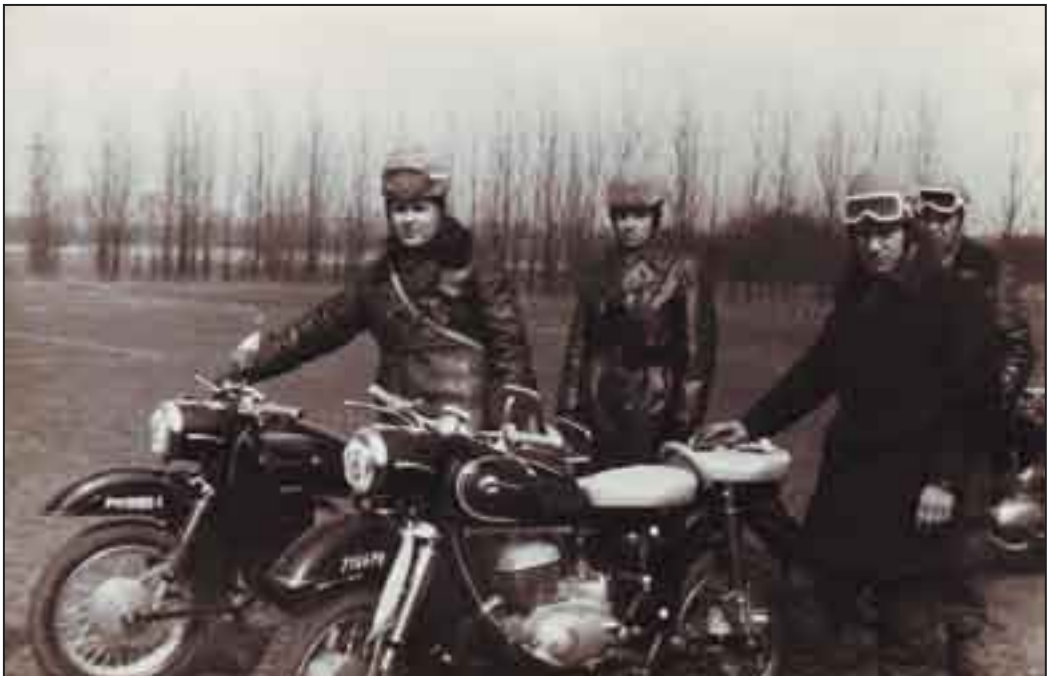
Zbiórka na pleszewskim Rynku