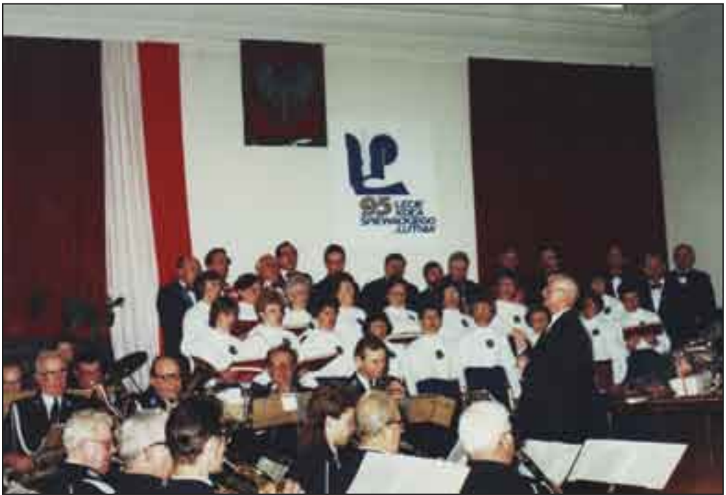
Koncert jubileuszowy 95-lecie Koła Śpiewackiego „Lutnia”, Orkiestra Dęta Cukrowni Witaszyce i dyrygent J. Szpuntek.