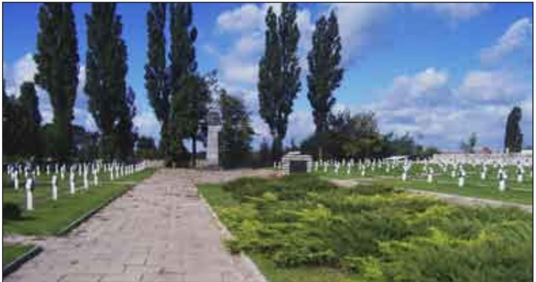
Sochaczew - największy cmentarz po bitwie nad Bzurą.