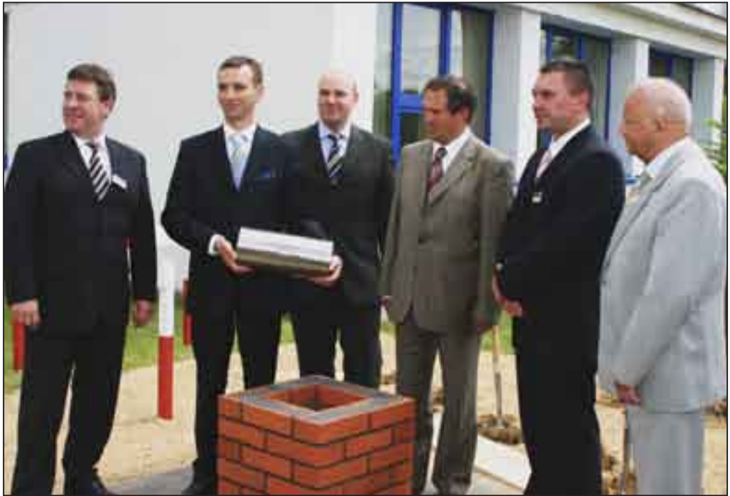
Wkopywanie kamienia węgielnego 08.06.2006 r.