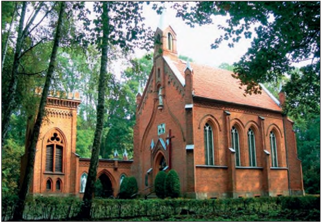
Widok ogólny na kaplicę i dzwonnice od strony południowej, fot. Jerzy Małyшко.