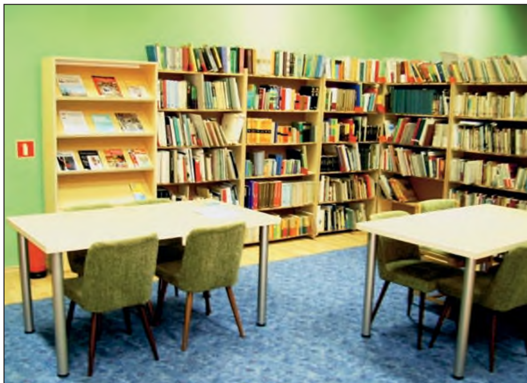
Wnętrze Książnicy Pedagogicznej przy ulicy Ogrodowej 13 w Pleszewie.

Filia KP w Pleszewie na miarę swoich możliwości stara się dobrze spełniać powierzoną rolę i zadania, służąc mieszkańcom Pleszewa i całego powiatu.