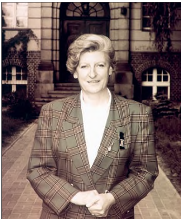
Rok 1994. Hanna Suchocka przed Liceum Ogólnokształcącym im. Stanisława Staszica w Pleszewie