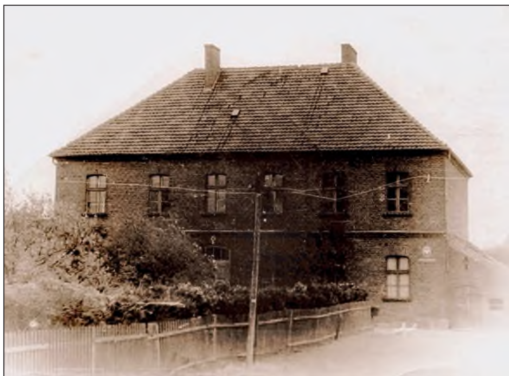
Szkoła podstawowa w Sowinie Błotnej (lata 50-te XX wieku)