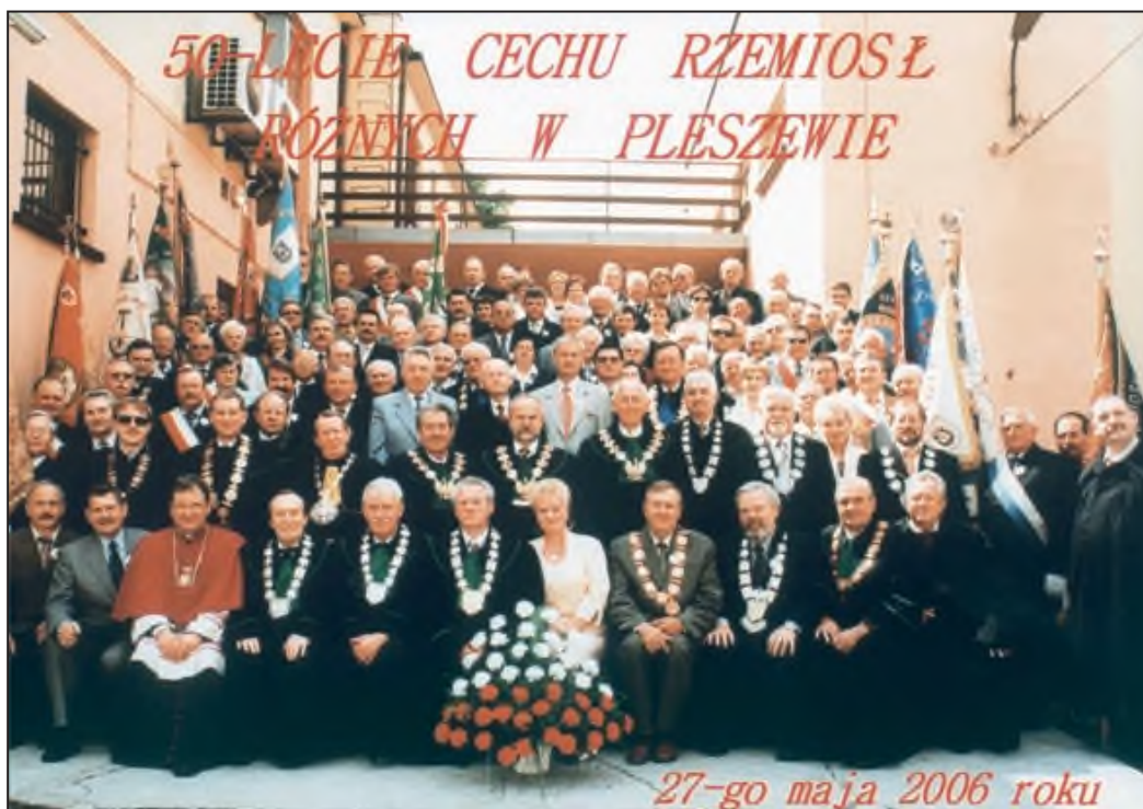
50-lecie Cechu Rzemiosł Różnych w Pleszewie. 27 maja 2006 roku.