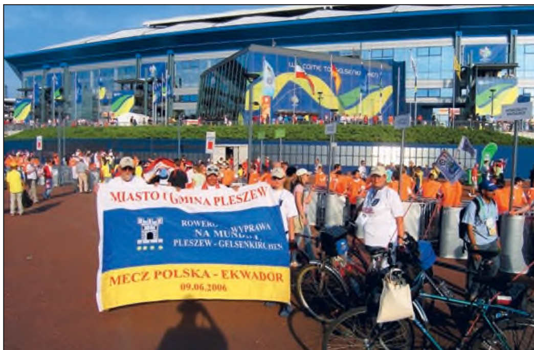
Pleszewska grupa rowerowa w Gelsenkirchen przed meczem z Ekwadorem.

Dziękujemy władzom miasta za pomysł takiego przedsięwzięcia w którym mogłam wziąć udział i mieć przyjemność być uczestnikiem wyprawy promującej nasze miasto. Myślę, że zadanie zostało wykonane. Dziękuję i do zobaczenia... przy następnym wyjeździe !!!