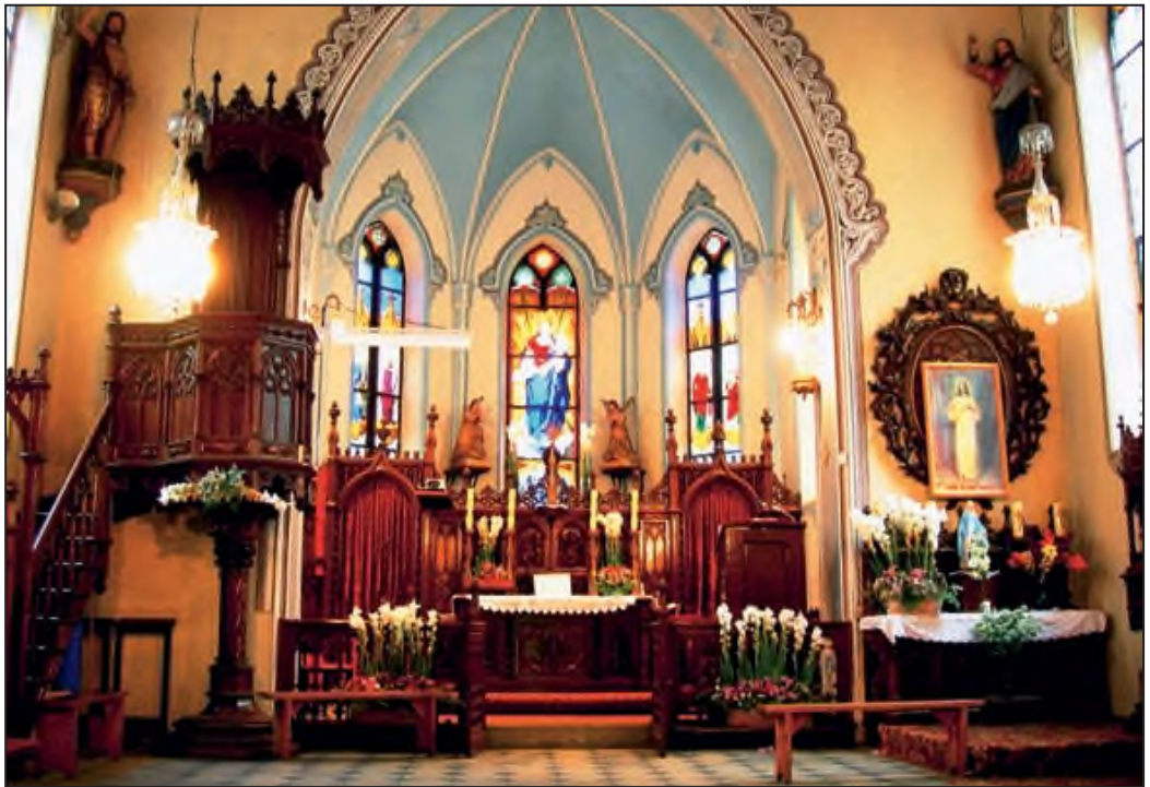
Wnętrze kaplicy, fot. Alina Małyшко