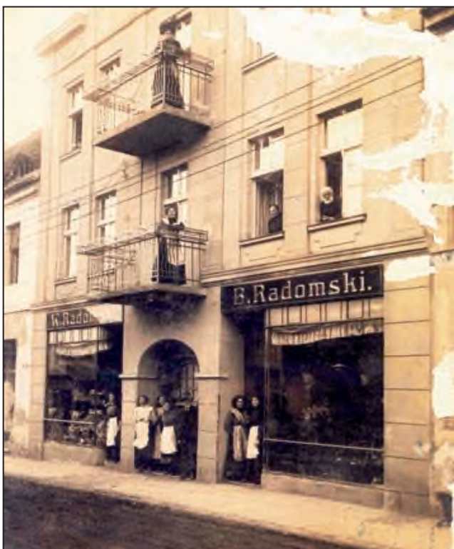
Kwiaciarnia Radomskich przy ulicy Sienkiewicza.