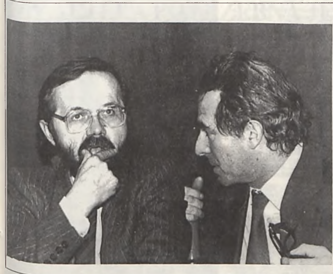
Skąd weźmiemy pieniądze na wybory?