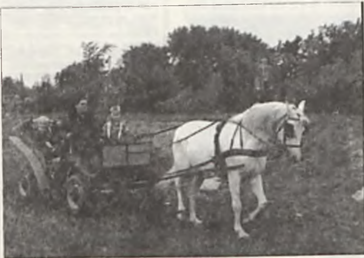
Na przejazdy bryczką lub wierzchem ustawiała się kolejka chętnych. Nikt nie odszedł zawiedziony.

W sobotę 29 maja ponad 100 osobowa grupa dzieci obejrzała przedstawienie wystawione w Miejsko-Gminnym Ośrodku Kultury. Około godz. 15.00 Orkiestra Dęta Swarzędzkich Fabryk Mebli po przemarszu ulicami miasta dała pokaz musztry parady i wspaniały koncert na boisku Szkoły Podstawowej nr 3. Wystąpiły zespoły dziecięce z przedszkoli Zielona Pólnutka i Miś U-