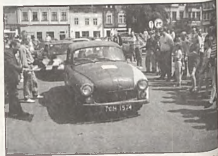
Państwo Saturniawiczowie z Poznania w swojej 30-letniej syrenie 103 z numerem startowym 13.

Punktualnie o godzinie 11.00 załoga z pierwszym numerem startowym, po charakterystycznym machnięciu kraciastą flagą przez burmistrza, ruszyła na trasę. Po niej w minutowych odstępach kolejne samochody.