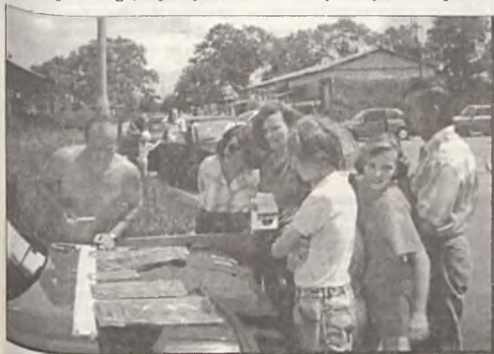
Tu trzeba było się wykazać wiedzą z zakresu mechaniki.

owego, znajomości budowy samochodów, odpowiadali również na pytania w rodzaju - „Czy lewa to bułgarski pieniądz dzielony na 100 stotinek?”, strzelali z pistoletu sportowego, wykazywali