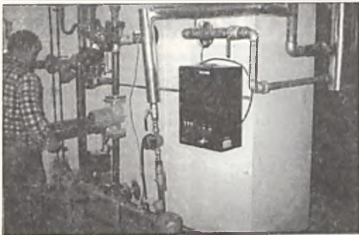
Kompaktowe wymienniki ciepła oparte na automatyce Danfossa - wręcz specjalność SANBUD-u.

Jak w każdej szanującej swego klienta firmie oferta „SANBUD-u” nie ogranicza się li tylko do wykonawstwa sieci, ale możliwe jest również zrealizowanie zamówienia od przysłowiowego A do Z, czyli od projektu poprzez zakup i montaż urządzeń po finalne odbiory techniczne. Cały pakiet możliwości firmy dotyczy zarówno obiektów bardzo dużych kubatorowo jak również małych domków jednorodzinnych. Co potrafią udowodnili między innymi w wielu domkach stojących w Osiedlu im. E. Raczyńskiego w Swarzędzu. Z nowościami światowymi są za pan brat, gdyż od kilku lat stali się znaczącym wykonawcą sieci ciepłowniczych preizolowanych, które są o kilka klas lepsze