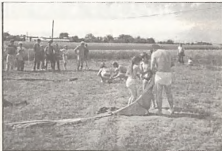
To nie striptease. To jedna z konkurencji finałowych turnieju rodzinnego.