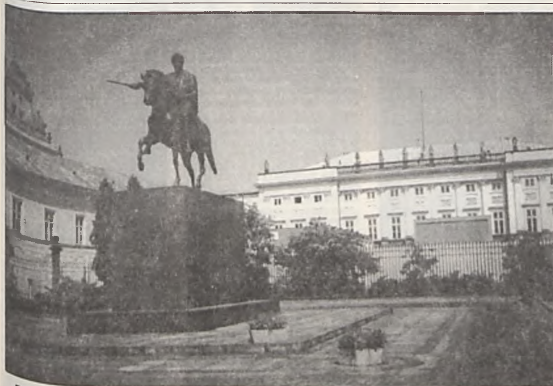
Ponoć z ethosu zostały tylko wasy. Ale gdzie są?!