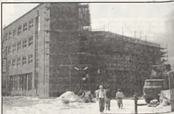
Bank PKO BP na Piątkowie — wszystkie instalacje wykonane w nim specjaliści z SANBUD-u. Fot. (3x) R. Bełacki

Młoda wiekiem, ale doświadczona załoga ma świadomość, że na rynku pozostaną tylko najlepsi. Ci, którzy na pierwszym miejscu stawiają jakość pracy, wprowadzanie nowości światowych, gotowi spełnić każde życzenie inwestora. Gdyby było inaczej, to nie mieliby w swej ofercie najlepszych w świecie kotłów niemieckiej firmy „Strebel”, które jako jedyne dopuszczane są do użytkowania w Szwajcarii. Nie byłoby również sygnatariuszem porozumienia podpisanego z Ministerstwem Budownictwa o nowych warunkach organizowania przetargów na wykonawstwo robót zleconych przez jednostki budżetowe. Tylko w roku 1982 wykonali kompletne roboty instalacyjne w około 300 mieszkaniach, kilku bankach, Porcie Lotniczym, kilku budynkach szkolnych. Mają zaufanie inwestorów, stąd nie są wśród wiecznie narzekających na brak zleceń firm. Czy można się temu dziwić? Raczej nie, bowiem każdy z nas z dobrych wybiera najlepszych. (m)