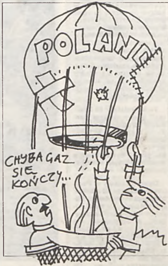
Rys. E. Sieiński

A kto pyta emerytów, rencistów, bezrobotnych, czy mają na opłaty za komorne, energię i wodę? W stosunku do nich prawo jest bezwzględne i nie chce słuchać żadnych wyjaśnień, a przecież oni nie decydują o gospodarce w państwie!