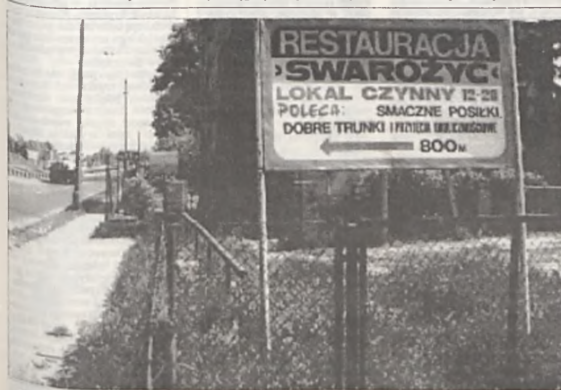
Proponujemy władzom podejmować delegacje właśnie w tej restauracji