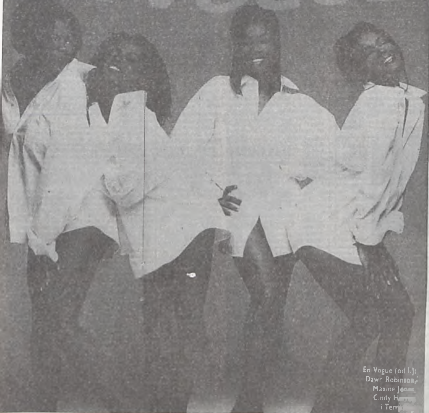
En Vogue (od l.): Dawn Robinson, Maxine Jones, Cindy Herron i Terry Ellis

Czasami chciałybyśmy żeby nasz zespół miał inną nazwę, wzdycha Dawn Robinson (24) z „En Vogue”. „Problem w tym, że ta nazwa zobowiązuje. Zawsze musimy być ubrane zgodnie z najnowszymi trendami mody. Przez to nie dorobiłyśmy się fortuny, mimo że od-