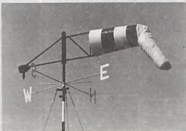
Dla lotników i... polityków! Wiadomo skąd wieje wiatr.

Czytelnicy popierają Program Powszechnej Prywatyzacji. Niestety reprezentanci społeczeństwa zasiadający w Sejmie byli odmiennego zdania. Nie pierwszy raz zresztą. (fl)