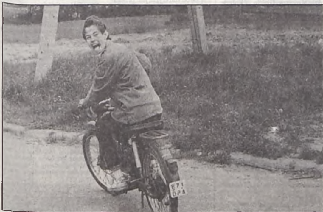
Byłe czym, byłe jak, byłe na Zachód

★★★ Niestety — nikt spośród 11 indagowanych Czytelników dokładnie nie wiedział, co było przyczyną manifestacji. Politycy tak wyobcowali się ze społeczeństwa, że żyją własnym życiem, własnymi, często urażonymi ambicjami. Mało obchodzą ich sprawy nas, zwykłych zjadaczy chleba, płacących coraz wyższe podatki, by zaspokoić coraz wyższe diety parlamentarzystów i pensje ministerialnych urzędników. (fil)