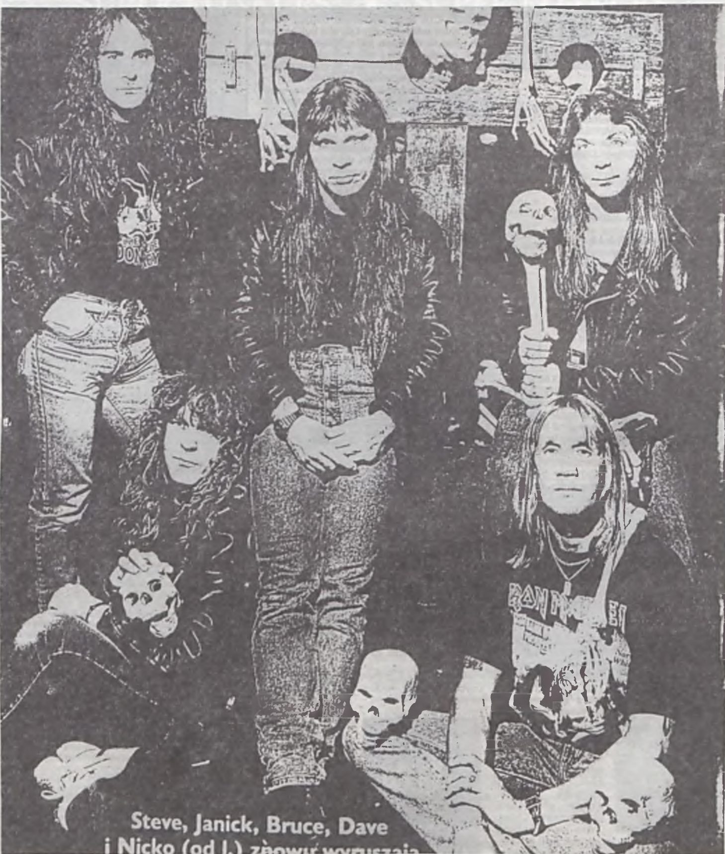
Steve, Janick, Bruce, Dave i Nicko (od l.) znowu wyruszają