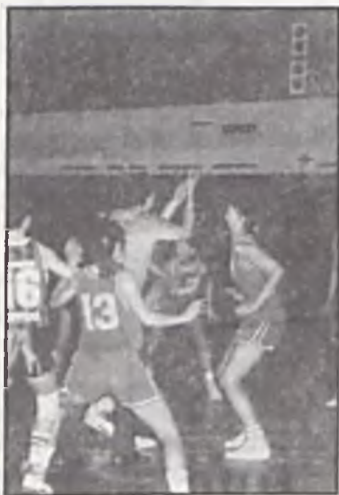
Wznowienia gry w meczu Unii I z Belgijkami