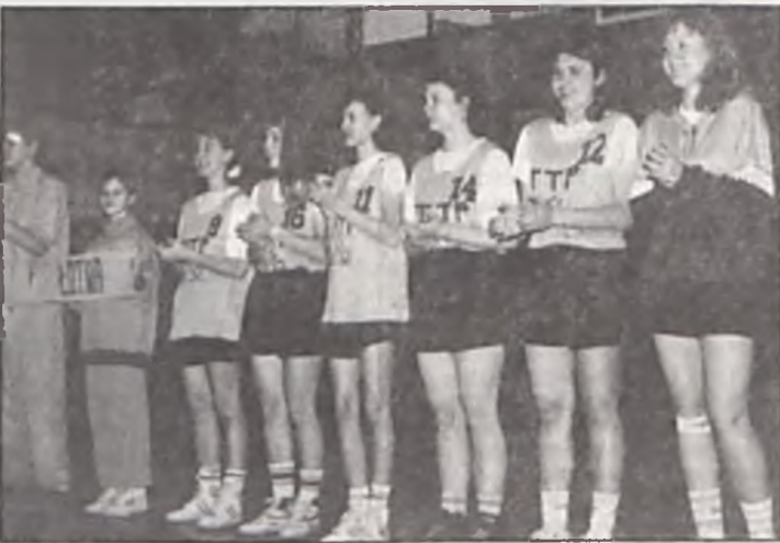
Zdobywca trzeciego miejsca — drużyna z Łotwy