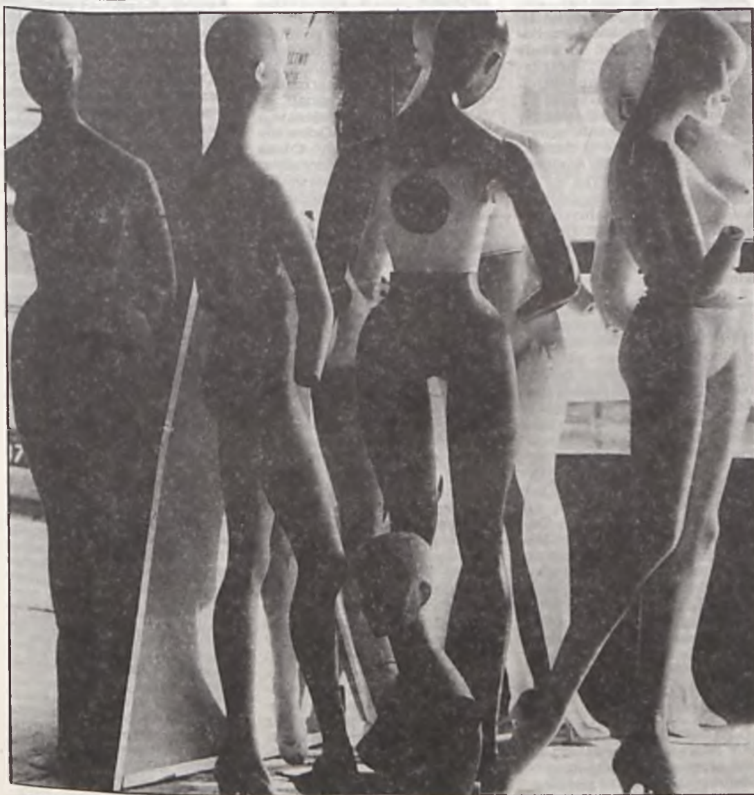
PPM — Polska Partia Manekinów (bez kanapy).

Niestety, nikt spośród in- dagowanych przez nas 20 przechodniów nie deklaro- wał, że wysyła dzieci na wakacje. Wypoczynek dzie- ci (tak letni jak i zimowy) stał się obecnie dla nas luk- susem. Jak to się odbije na kondycji fizycznej i psychi- cznej naszych pociec, przekonamy się za kilka lat. (fil)