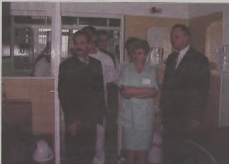
Goście oglądali wyremontowane pomieszczenia

W turkowskim szpitalu zakończył się remont oddziału chirurgicznego. Prace przy odnawianiu oddziału trwały od lipca i kosztowały szpital 53.000 złotych. Pozostałe koszty w nieznannej wysokości zrefundowały firmy farmaceutyczne.