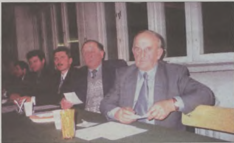
W zjeździe uczestniczyło 34 delegatów