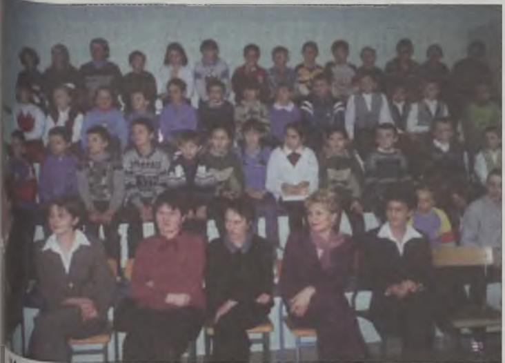
Muzyki słuchano z dużym zainteresowaniem

Imprezę mikołajkową dla nich zorganizowano w nowej hali sportowej w Kawęczynie, po raz kolejny uwadniając potrzebę wzniesienia tego obiektu. Na widowni zasiadły osuszone dzieci, ich opiekunowie oraz oficjele. Tych ostatnich było wielu. Dotarli jedynie przedstawiciele władz gminy i dyrektorzy wszystkich szkół. W świąteczny nastrój wprowadzili wszystkich artyści z Ło- Kolędy, pastorałki i bożonarodzeniowe pieśni z różnych stron świata, zaprezentowało trio wokaln-