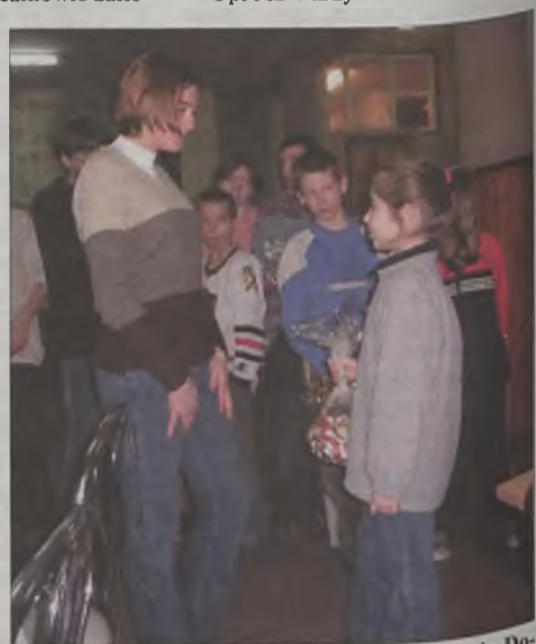
Dzieci z Natalii nie pierwszy raz pomagają Domowi Dziecka

Wychowankowie Domu Dziecka przyjęli ich bardzo serdecznie i z zadowoleniem. Powodem do radości były nie tylko przywiezione dary, ale sama chęć pomocy ze strony uczniów szkoły. Dzieci przywiozły ze sobą pakunki złożone głównie z produktów rolnych. Dom Dziecka