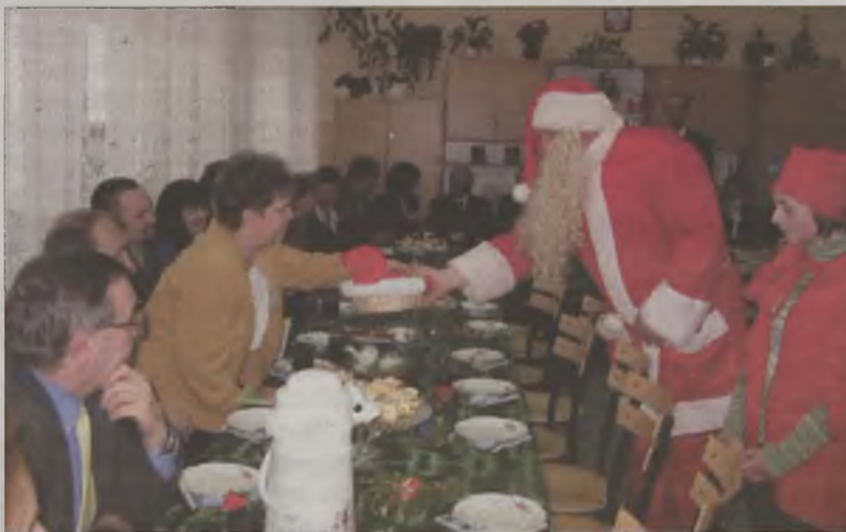
Dyrektorów odwiedził Święty Mikołaj