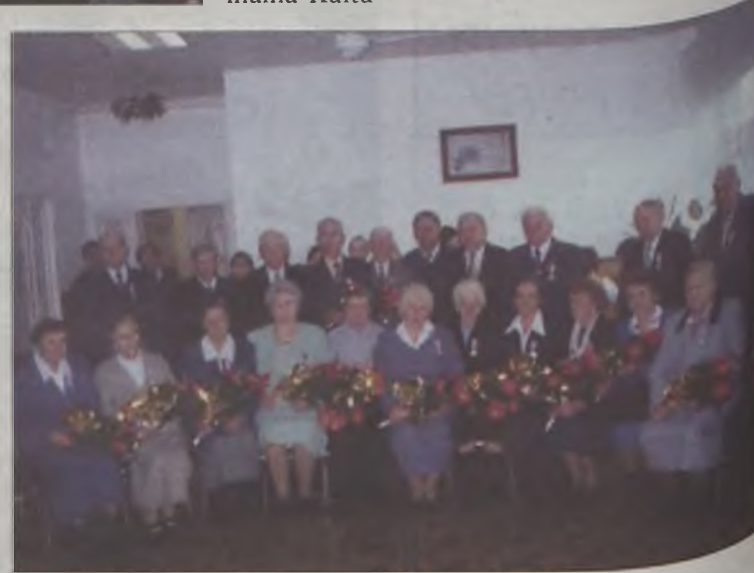
Pary, które przeżyły ze sobą 50 lat

- Choć przez minione pięćdziesiąt lat - powiedziała - z pewnością nie omijały was troski, przeżyliście je zgodnie, dotrzymując danych sobie w dniu ślubu przysiężeń.