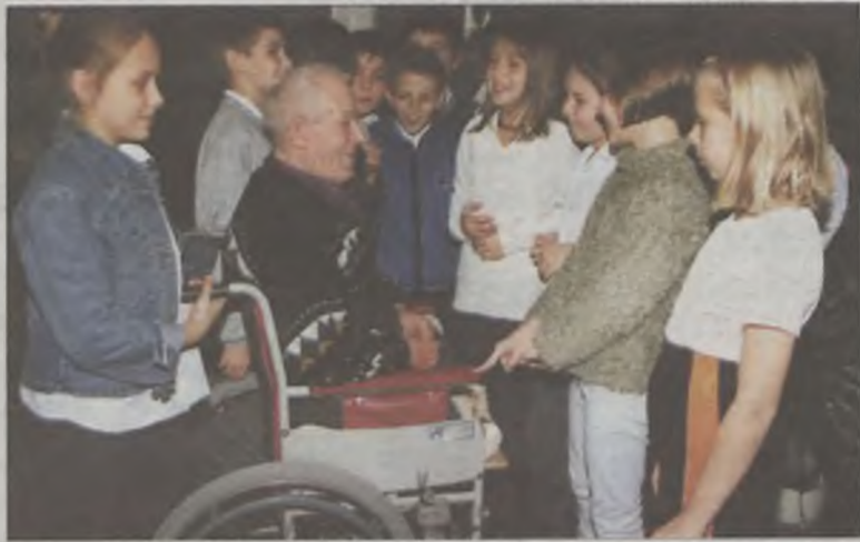
Dzieci przyniosły radość