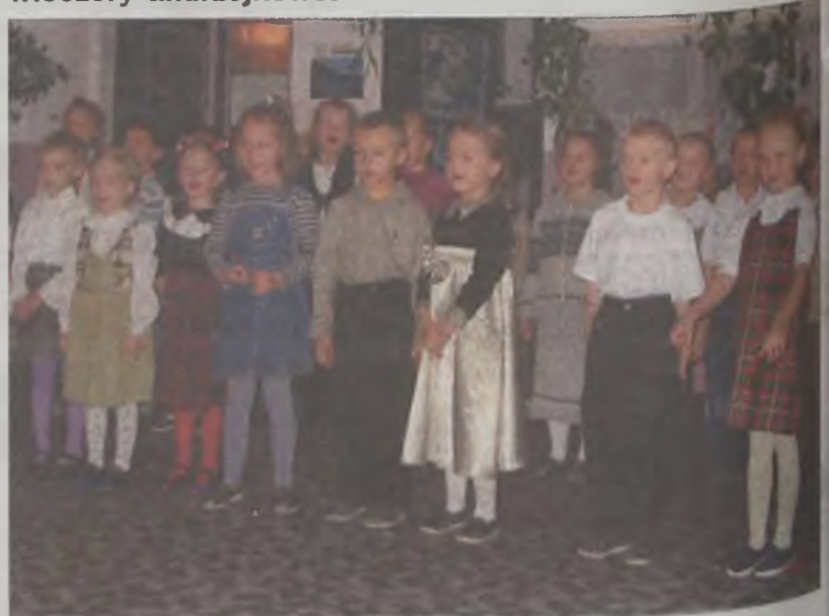
Przedszkolaki występowały dla swoich rodziców

Tradycją już jest, że każdego roku w Przedszkolu Samorządowym nr 3 w Turku dzieci z grup starszych organizują wieczory andrzejkowe.