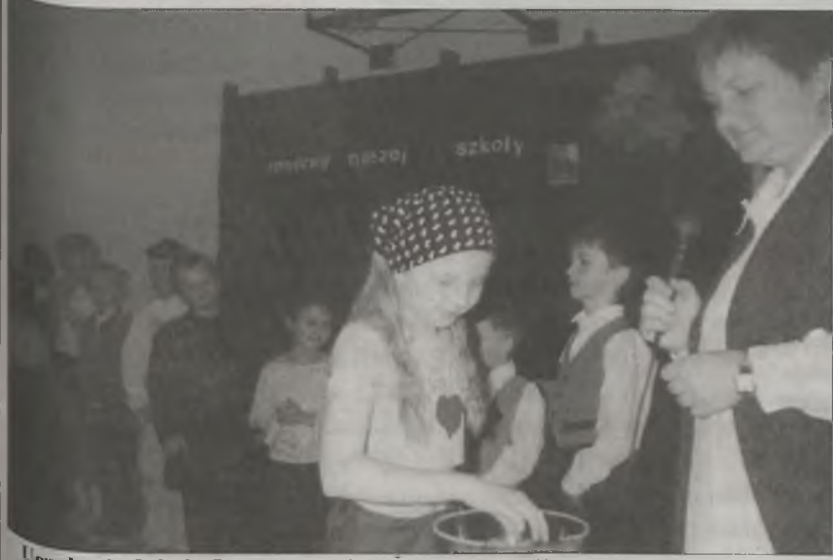
Uczniowie Szkoły Podstawowej w Żukach zostali przetestowani z wiedzy o Marii Skłodowskiej-Curie