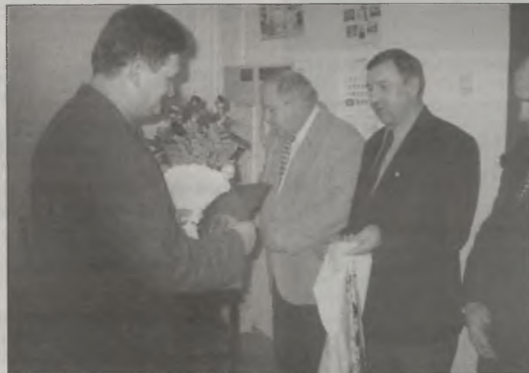
Gratulacje i upominki od władz gminnych