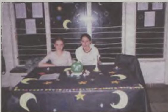
Czarodziejska kula gimnazjalistki

ceum Ogólnokształcącym, gdzie imprezę tę wraz z uczniami przygotowały nauczycielki: I. Mielczarek i S. Durczyńska. Tam cały wieczór bawiono się w bardzo kameralnej atmosferze, przy świecach i nastrojowej muzyce. Z kart wróżyły „prawdziwe” cyganki. rzucano obierkami jabłek, oczekując iż wypadnie inicjał ukochanego. Nie obyło się także, bez chyba najbardziej tradycyjnej kabały, a mianowicie lania wosku przez klucz. Warto może przypomnieć, że sztuka zajmująca się odczytywaniem kształtów nazywa się kromacją.