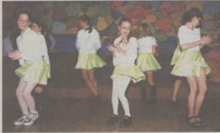
Występ bardzo podobał się mieszkańcom Domu

Z tej też okazji uczniowie przygotowali dla mieszkańców skęczniewskiego Domu Opieki Społecznej część artystyczną, na którą składały się piosenki, wiersze oraz inscenizacja teatralna. Występ wychowanków słodkowskiej podstawówki spodobał się mieszkańcom, bowiem nagrodzili dzieci gromkimi brawami. Ponadto uczniowie wręczyli mieszkańcom własnoręcznie wykonane na tę okazję laurki. - Wizyta młodzieży w tym domu to promyk słońca w szarym życiu ludzi Domu Opieki Społecznej w Skęczniewie. Ukazy-