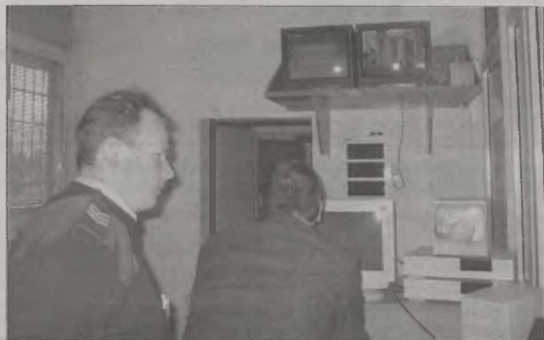
Czy teraz nie już nie umknie czujności policjantów

-Zwalnia to dyżurnego z ciągłego patrzenia na monitory i sterowania joystickiem (...) Wszystko, co widzi kamera nagrywane jest na 24-godzinny magnetowidzie. Gdy dowiadujemy się, że coś zaszło na ul. 3 Maja czy Kaliskiej, zawsze jest możliwość powrotu do tego fragmentu i jego odтворzenia.