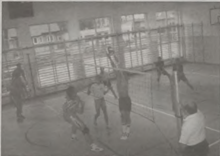
Mecz Malanów - Przykona

Prawdziwym chrzem nowej sali sportowej w Kawęczynie, był ubiegły tygodniowy III Powiatowy Turniej Piłki Siatkowej Wiejskich Zespołów Sportowych. Niespodziewanie faworyzowana drużyna z Malanowa musiała uznać wyższość reprezentantów Przykony.