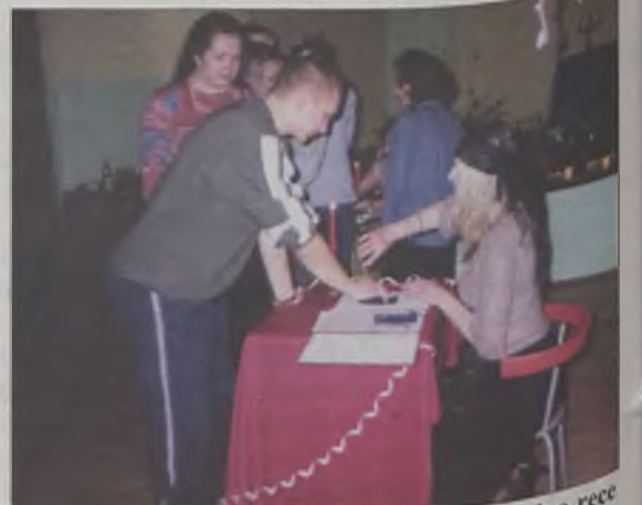
W Prywatnym Liceum wróżka miała pełne ręce roboty

Andrzejkowe wróżby przeprowadzono również w Prywatnym Li-