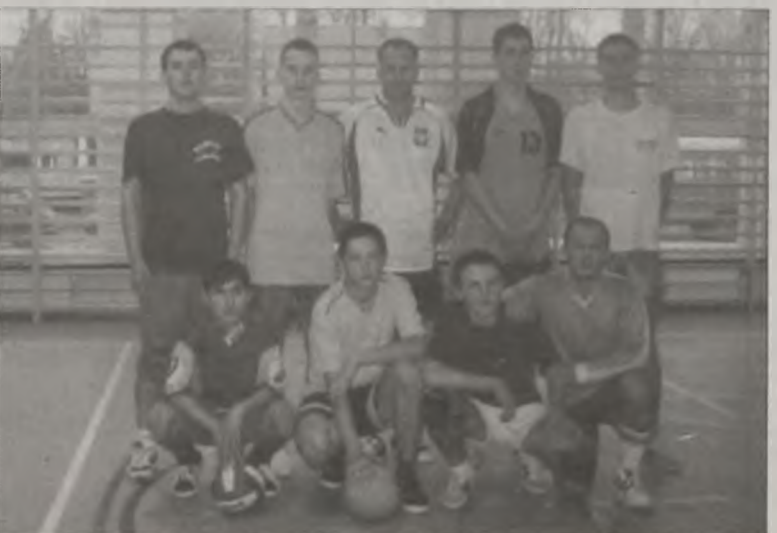
Rewelacyjna drużyna z Przykony

1. Przykona 6:0 6:0 2. Malanów 5:1 4:3 3. Kawęczyn 4:2 3:4 4. Marianów Kol. 3:3 0:6