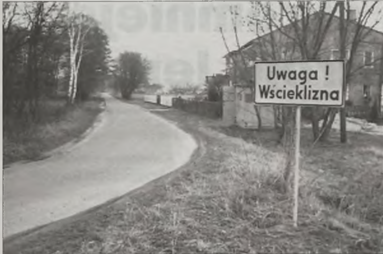
Takich tablic jak ta w Szadowie jest więcej

obserwacji. Były szczepione i nie ma niebezpieczeństwa - powiedział J.